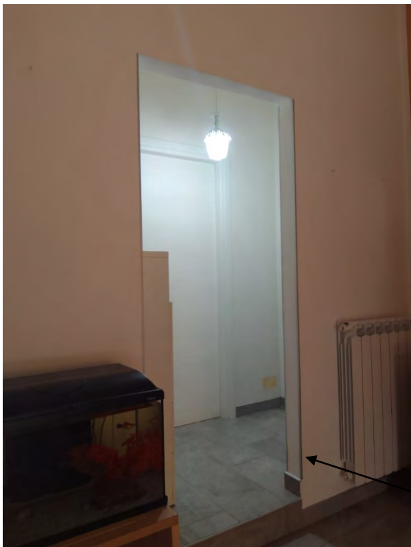
FOTO N° 12- APPARTAMENTO PIANO TERRA – INGRESSO DA DISIMPEGNO COLLEGATO CON ANDRONE.