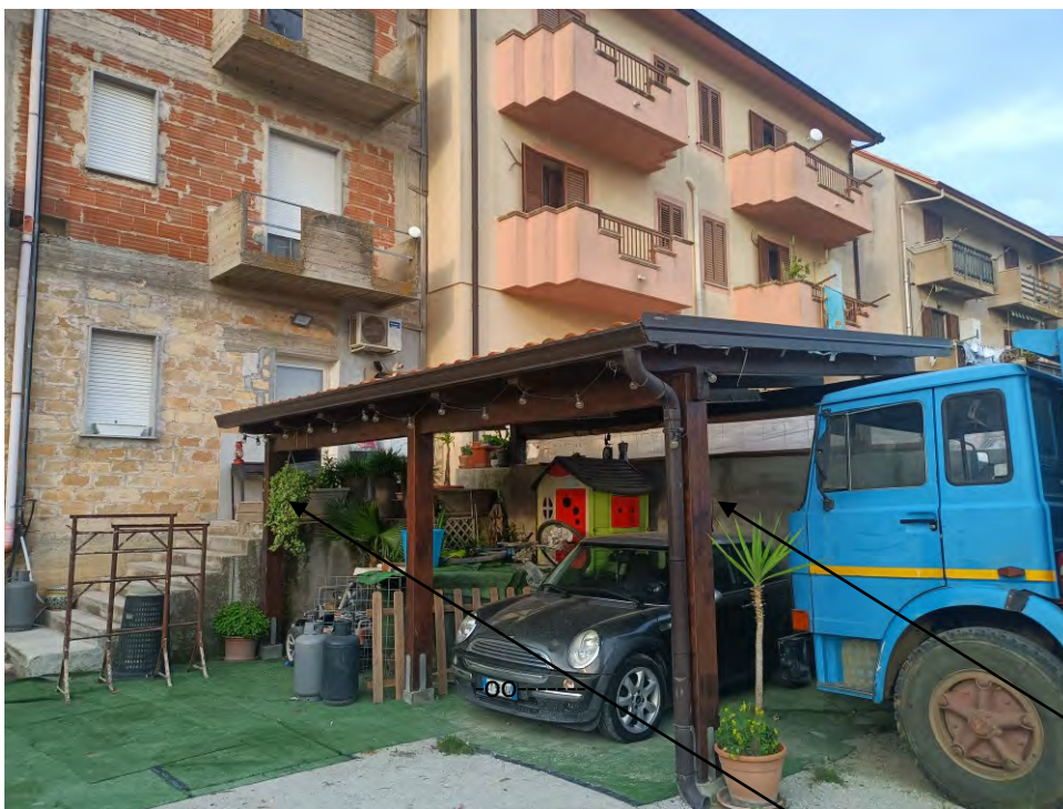
FOTO N° 5 – AREA COMUNE RETROSTANTE CON GRADINATA CON TERRAZZO E TETTOIA IN LEGNO