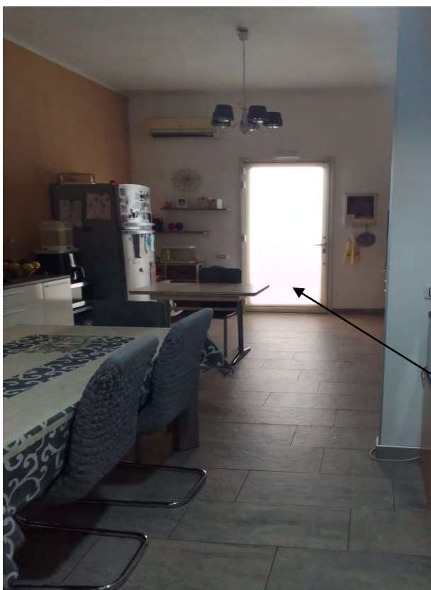
FOTO N° 7 – APPARTAMENTO PIANO TERRA – CUCINA-PRANZO-SOGGIORNO CON INGRESSO DA AREA RETROSTANTE