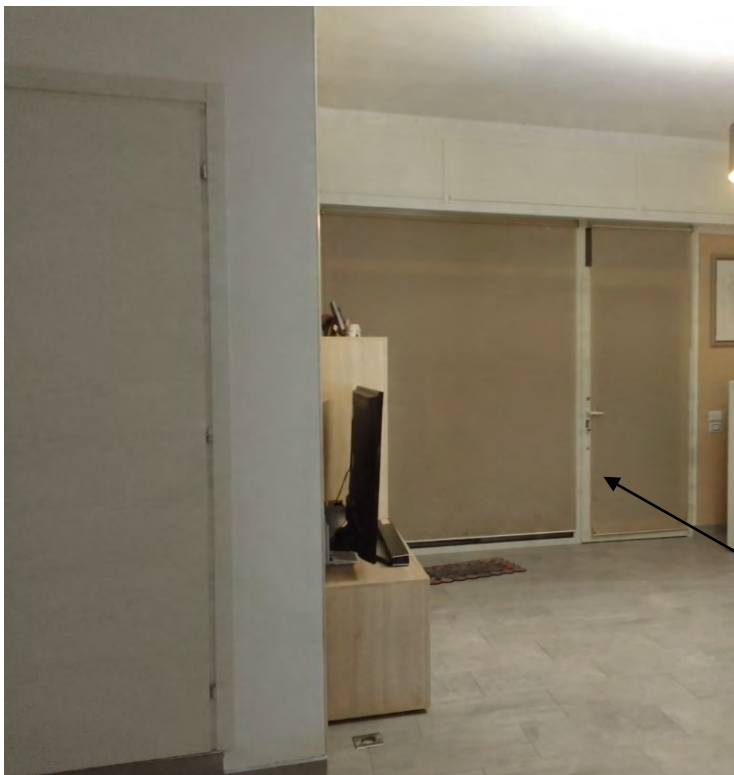
FOTO N° 8 – APPARTAMENTO PIANO TERRA – CUCINA-PRANZO-SOGGIORNO CON INGRESSO DA SP 29