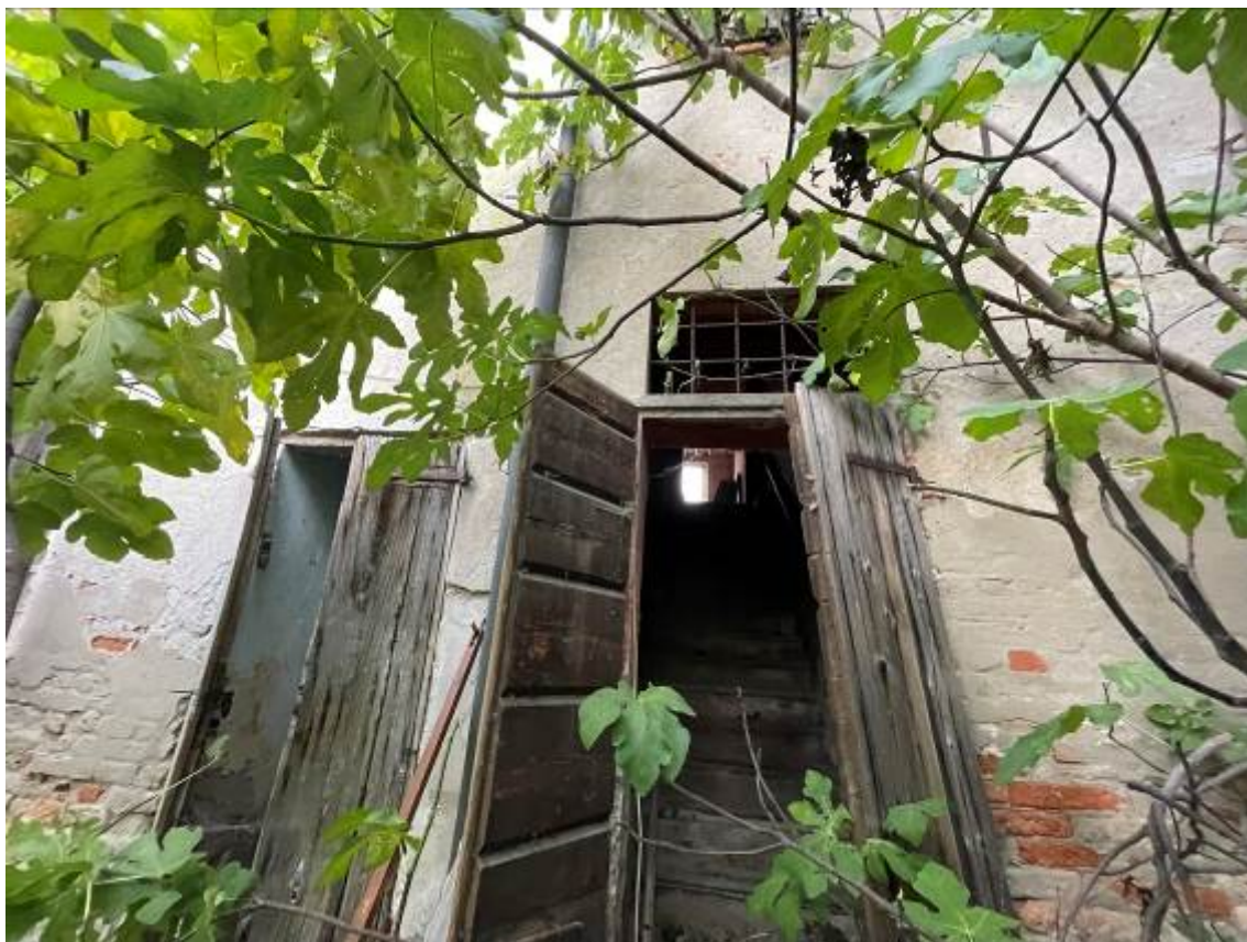
Vista dal giardino interno