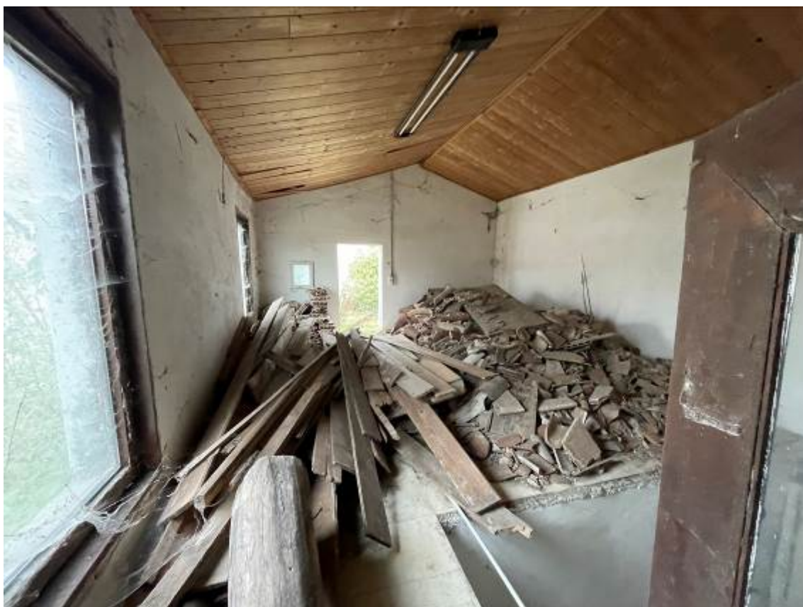
P.1. “Granaio” – vista interna con zona apertura vano scala non realizzato