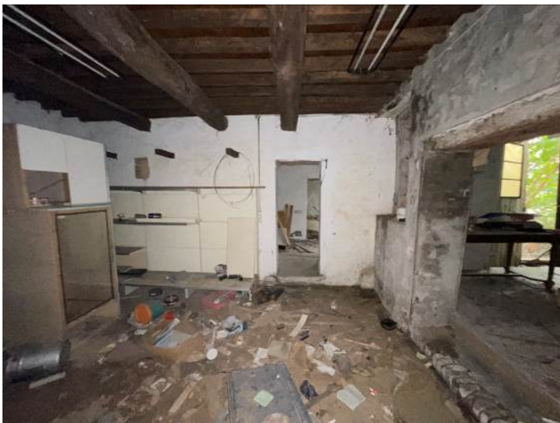
P.T. “Cantina” – vista interna