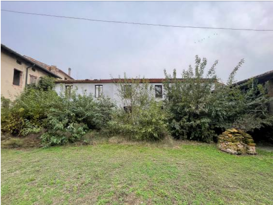
Vista generale dal giardino