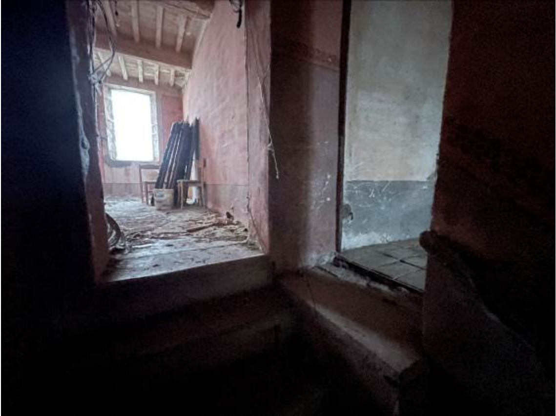
P.1. Sbarco scala