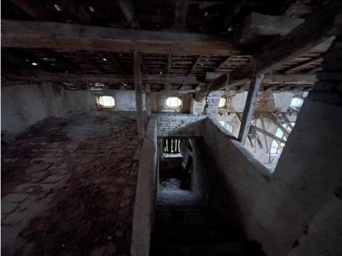
P. Soffitta Soffitto parzialmente crollato