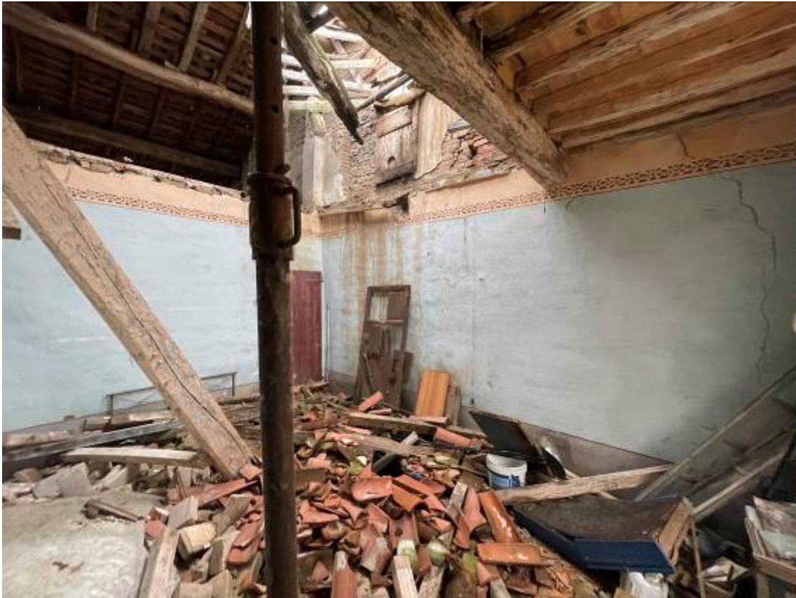
P.1. Stanza con solaio parzialmente crollato