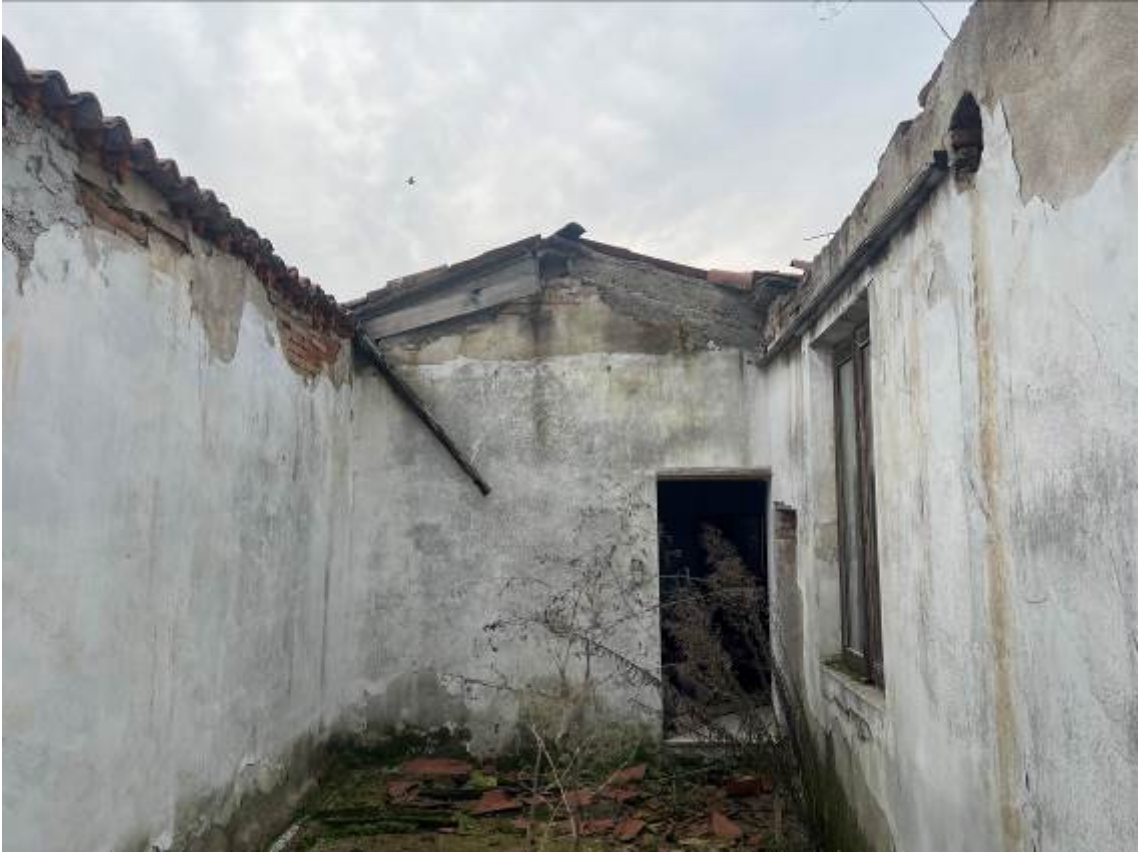
P.1. "Granaio" – vista soffitto crollato