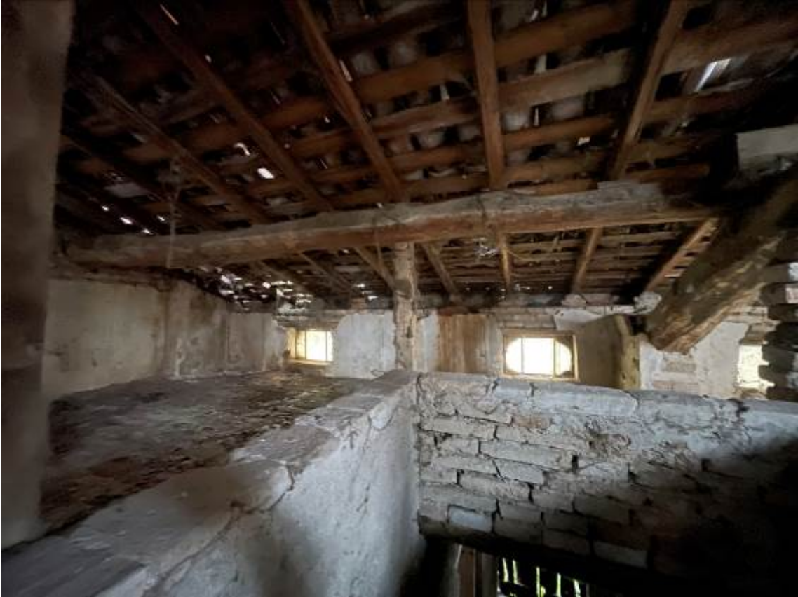
P. Soffitta Sbarco scala