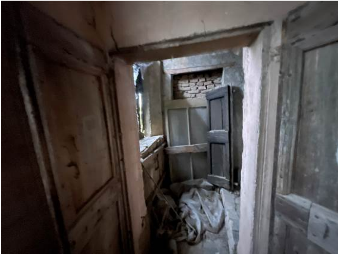
P.1. Imposta pianerottolo scala