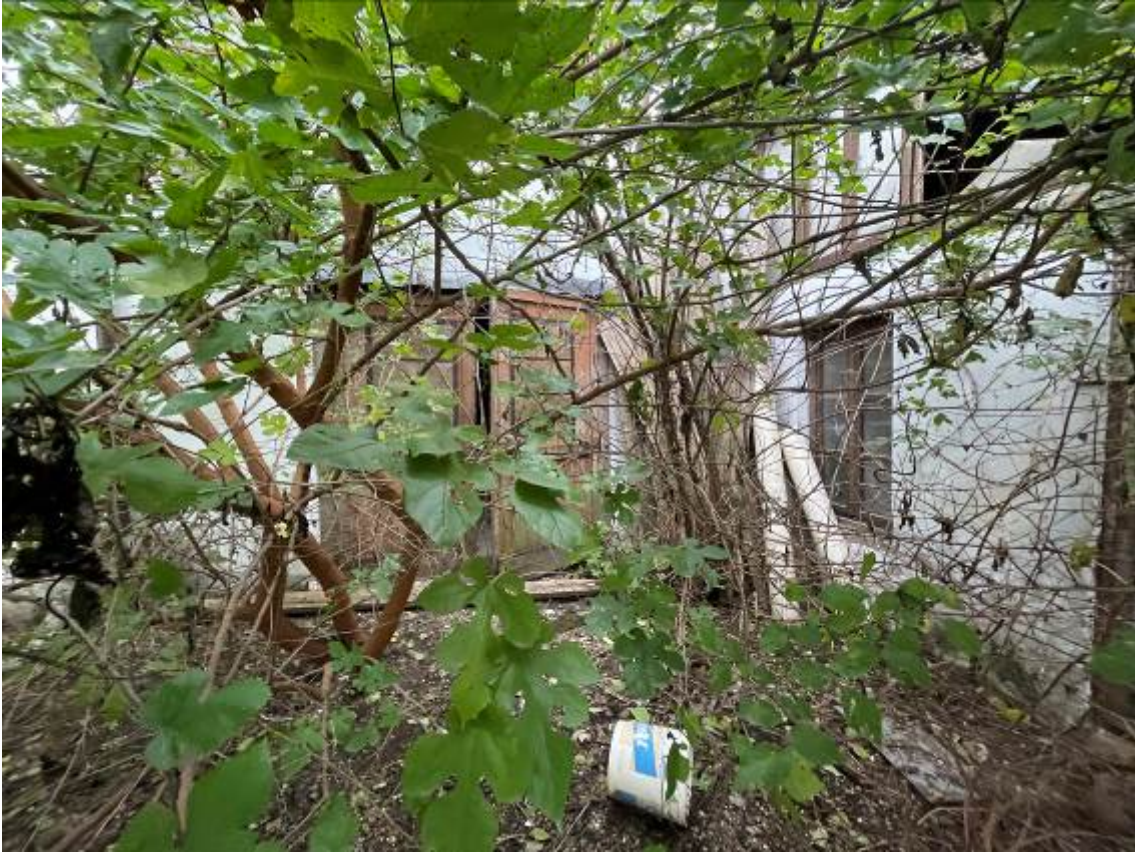
P.T. Vista esterna “stufetta”