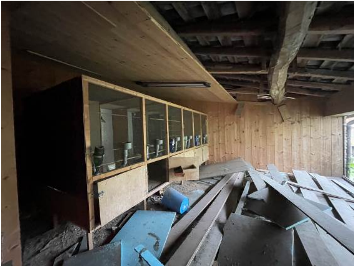
P.1. “Fienile” – vista interna