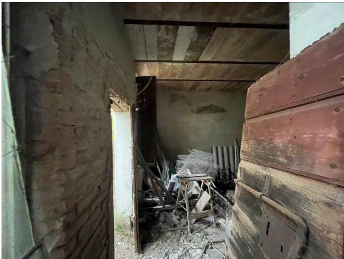
P.T. "Pollaio" - vista locale allargato