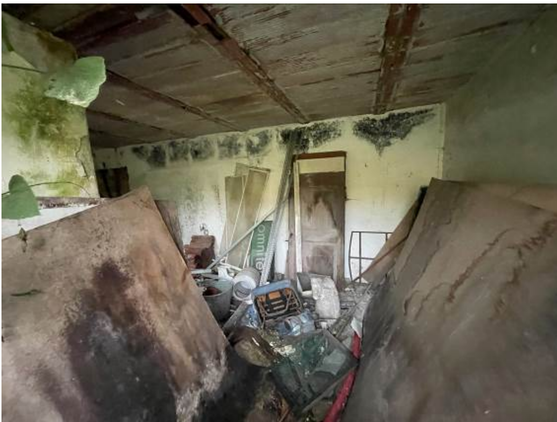
P.T. Vista interna “stalla”