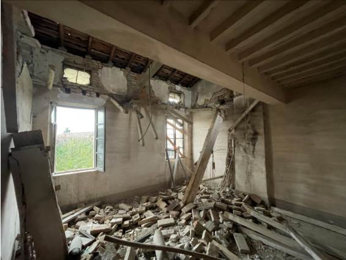
P.1. Stanza con solaio parzialmente crollato