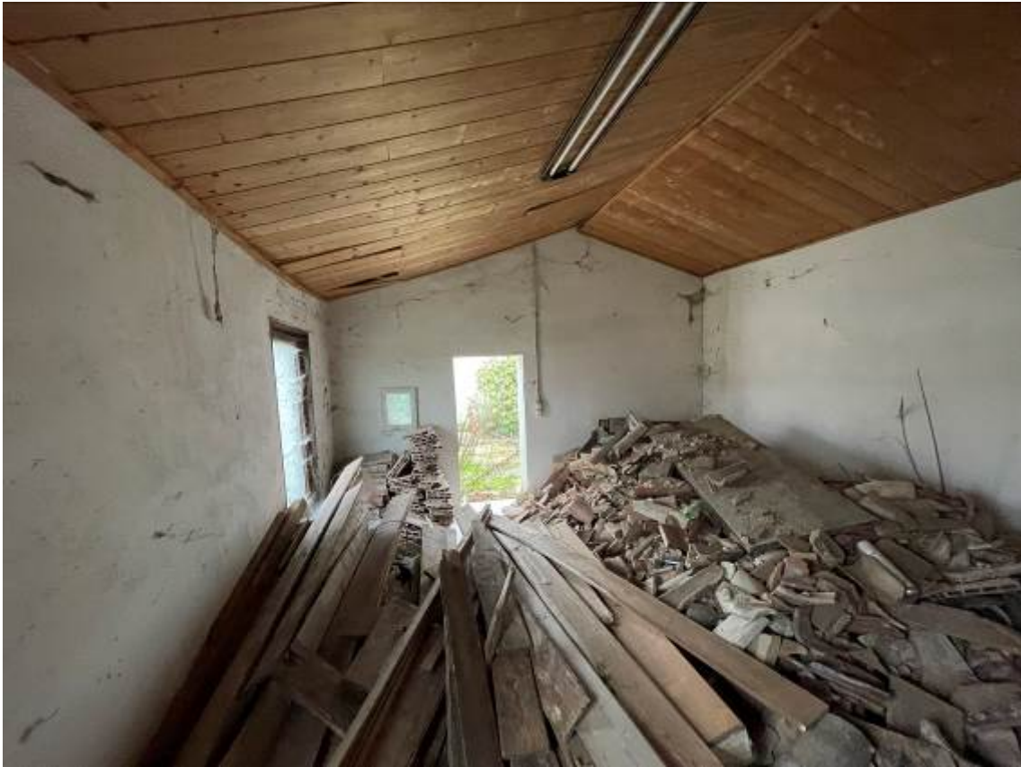
P.1. "Fienile" – vista passaggio tra i locali