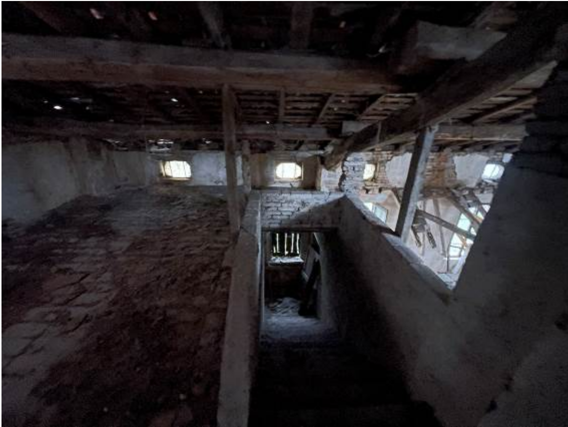
P. Soffitta Vista scala