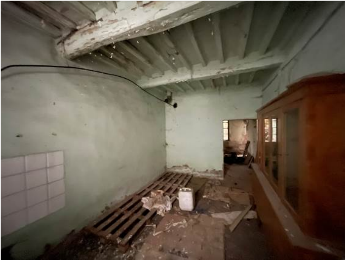
P.T. Zona giorno