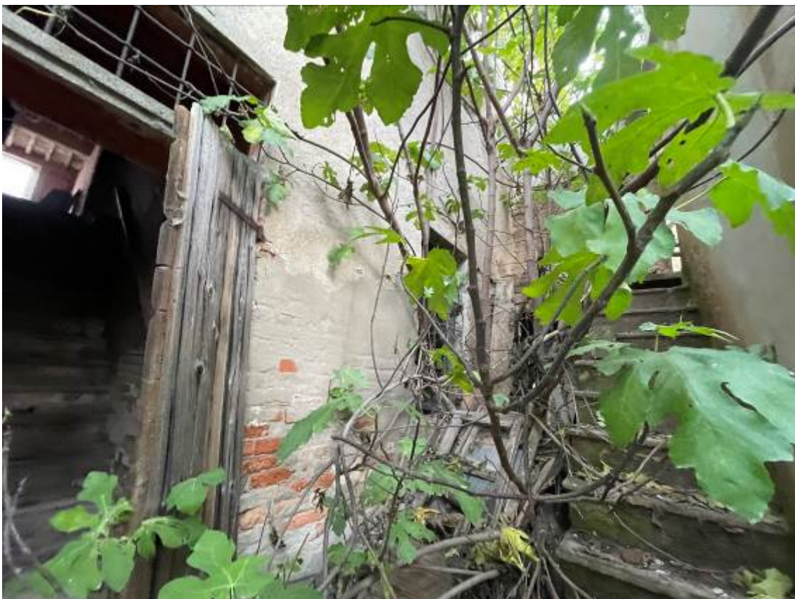
P.T. Scaletta esterna di servizio