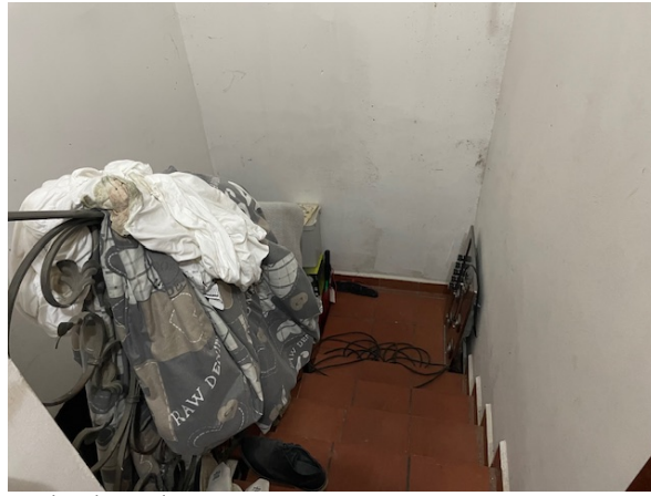
scala al seminterrato