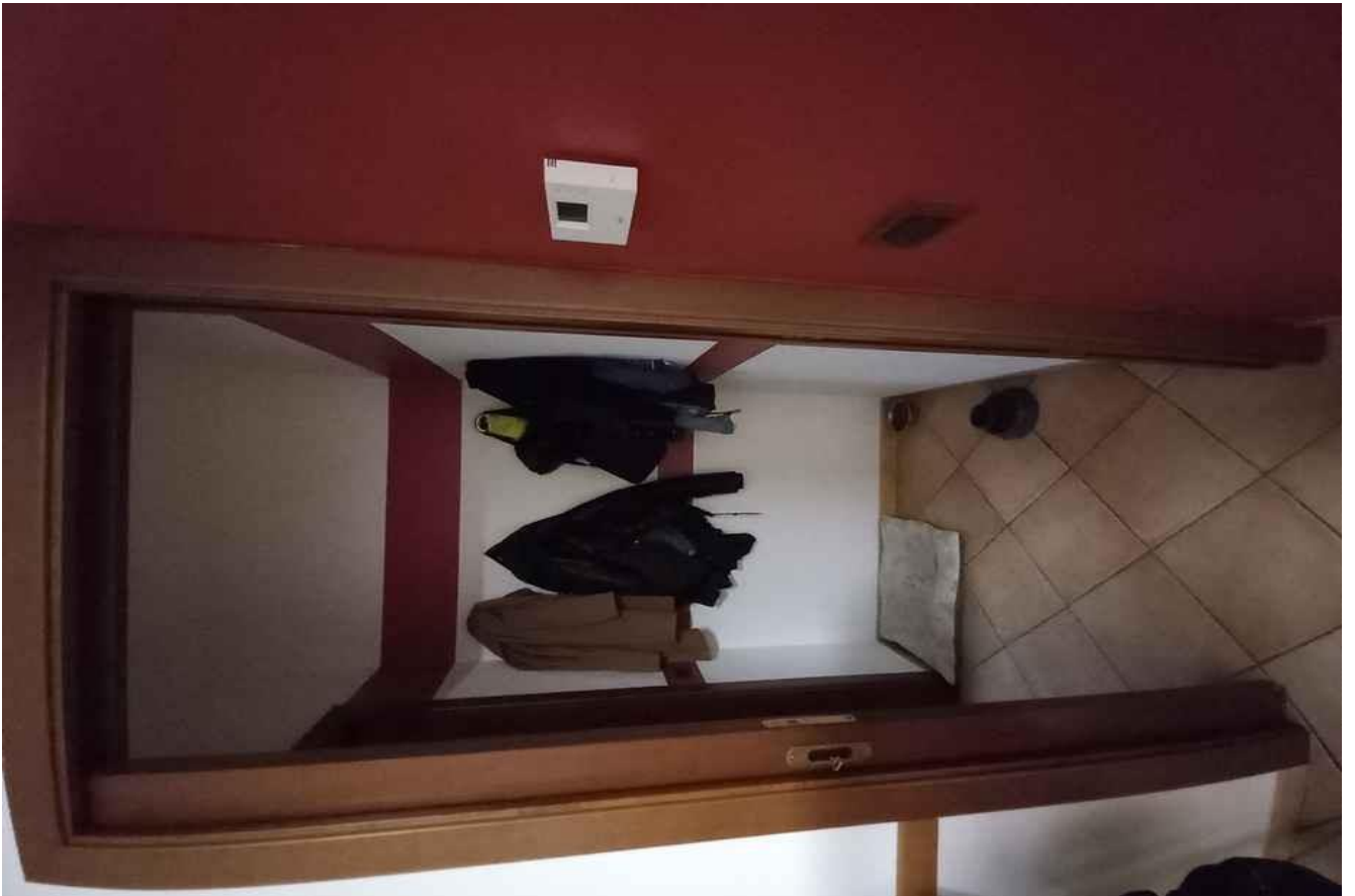
DISIMPEGNO/ANTIBAGNO PIANO TERRA