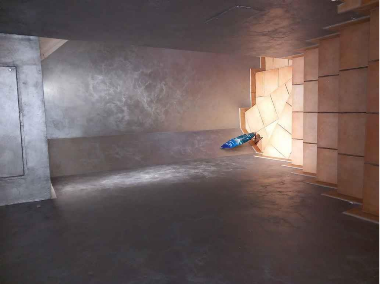
SCALA INTERNA DI COLLEGAMENTO PT/P1