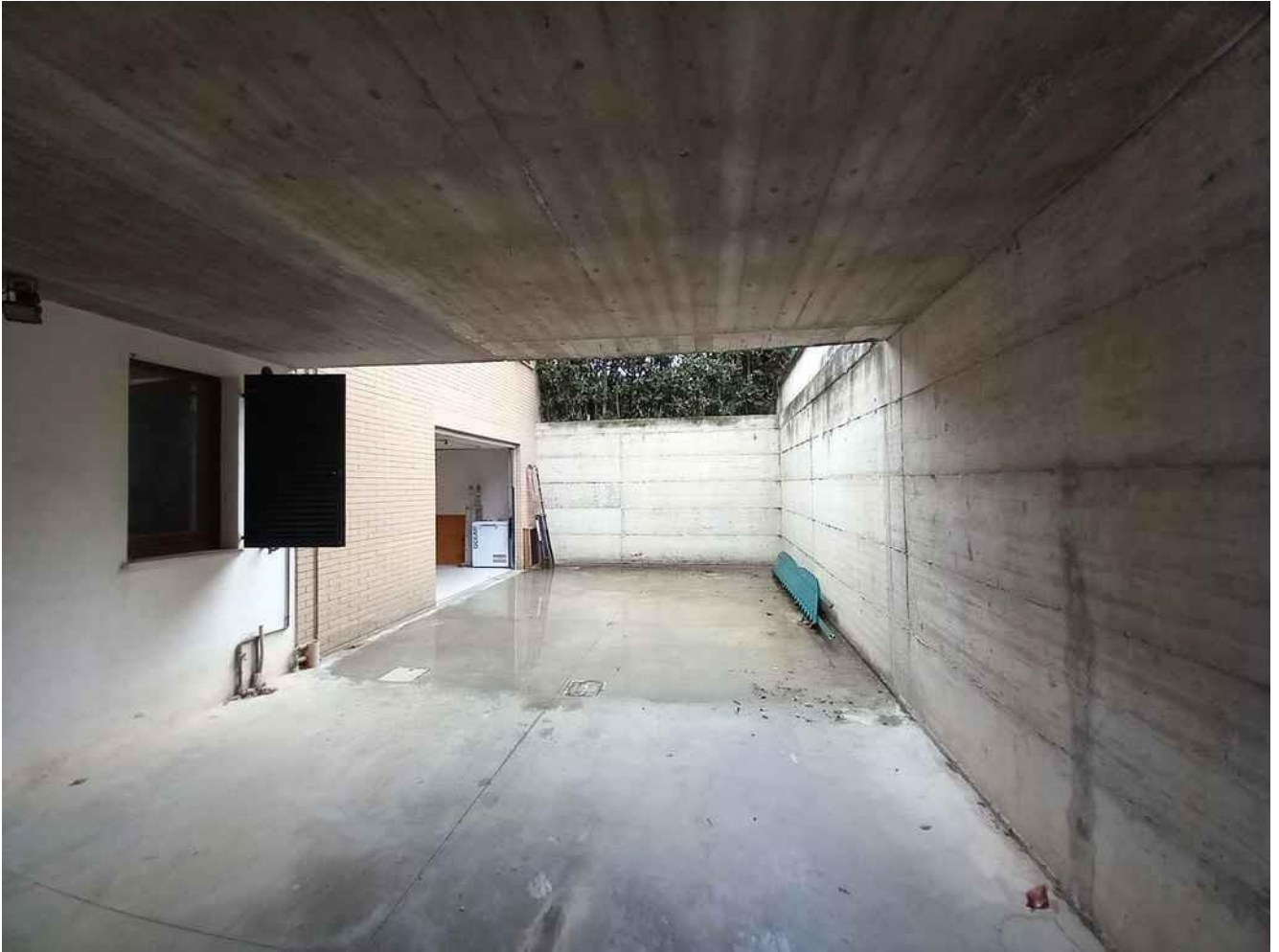
CORSIA DI MANOVRA – ACCESSO AL GARAGE – SUB 5