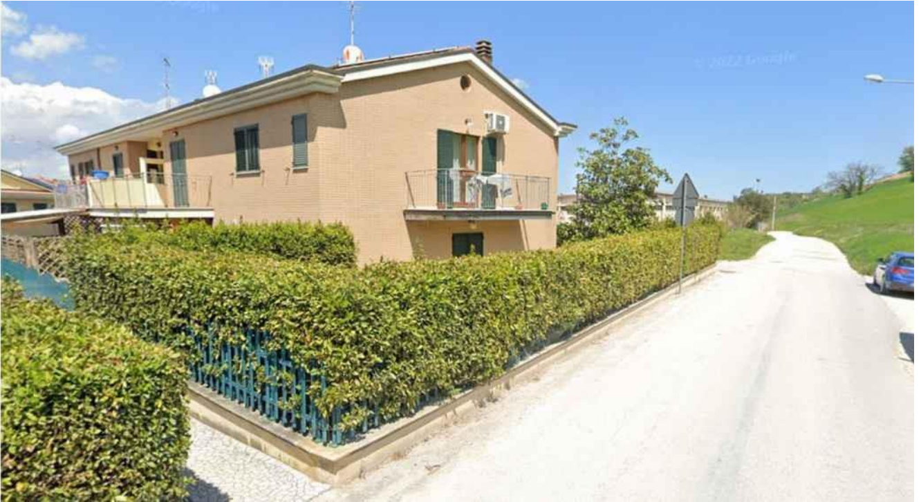
ANGOLO SUD-OVEST DELLA PROPRIETÀ - VIA DELL'ARTIGIANATO – PROSPETTO SUD