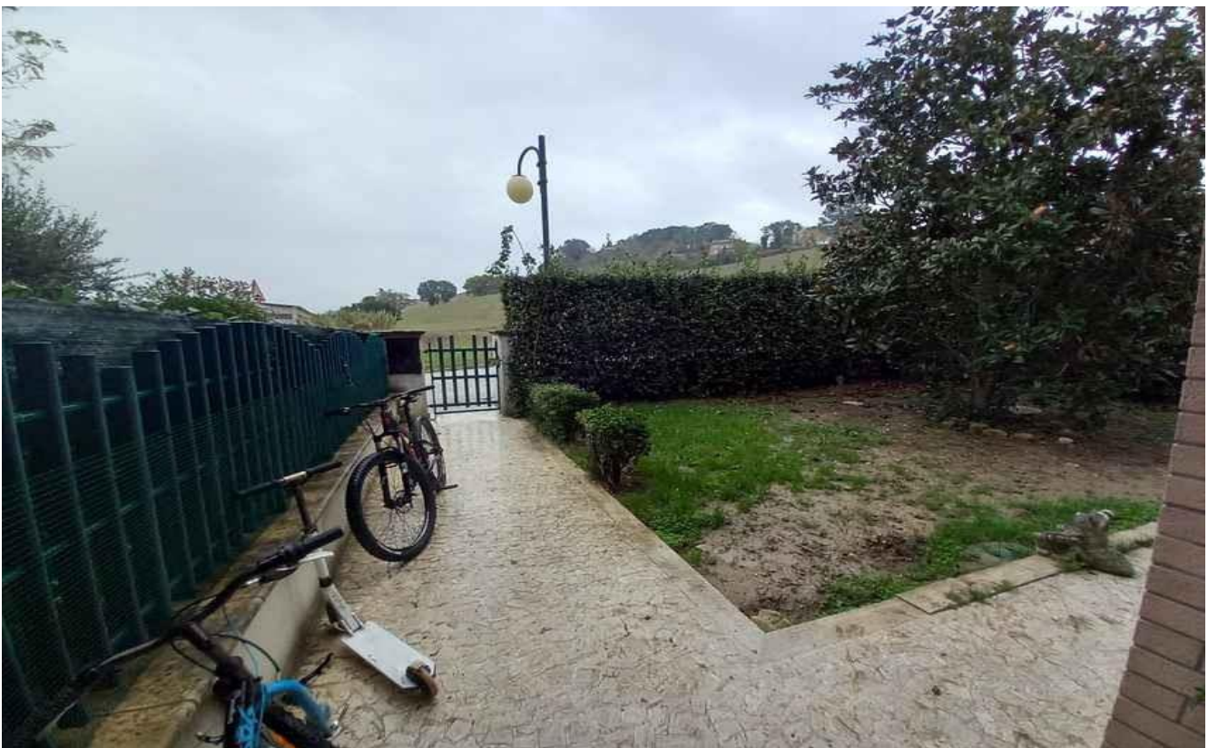
INGRESSO-CORTE DI PERTINENZA LATO EST