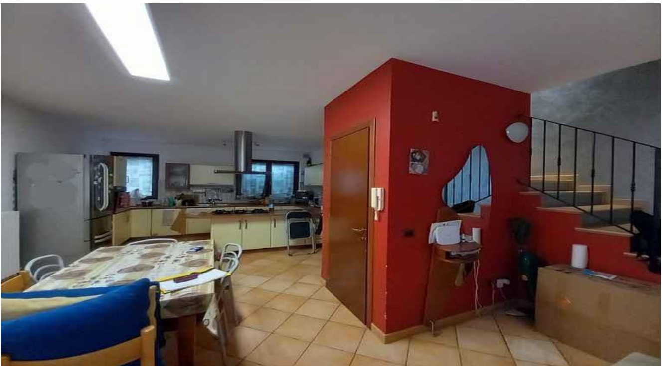
ZONA PRANZO/CUCINA E SCALA INTERNA (PS1-PT-P1)