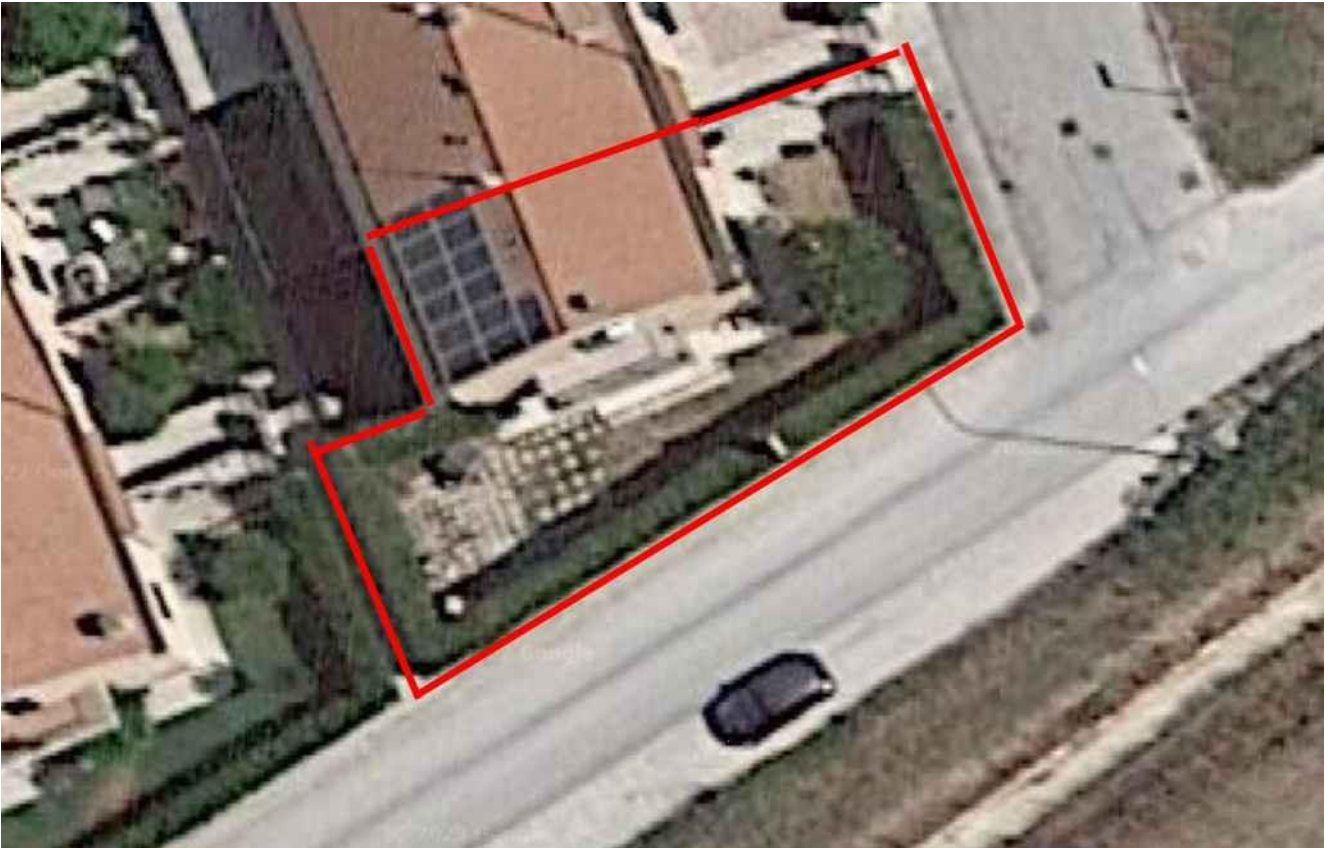
INDIVIDUAZIONE DELLA PORZIONE OGGETTO DI PERIZIA