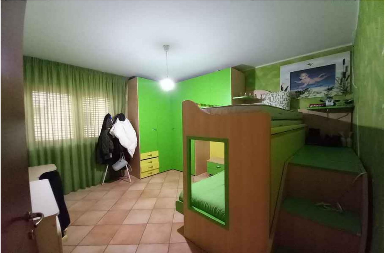
CAMERA LATO OVEST