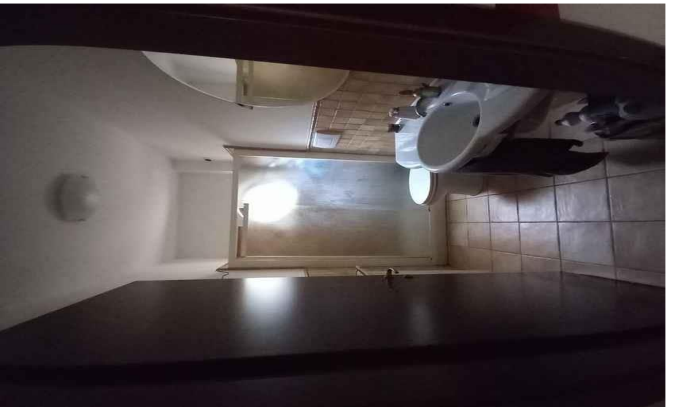
BAGNO PIANO TERRA