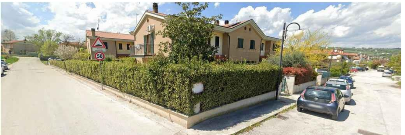
ANGOLO SUD-EST DELLA PROPRIETÀ, TRA VIA DE GASPERI E VIA DELL'ARTIGIANATO