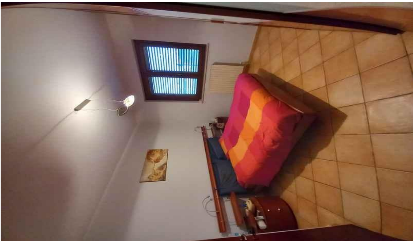
CAMERA MATRIMONIALE ANGOLO SUD-EST