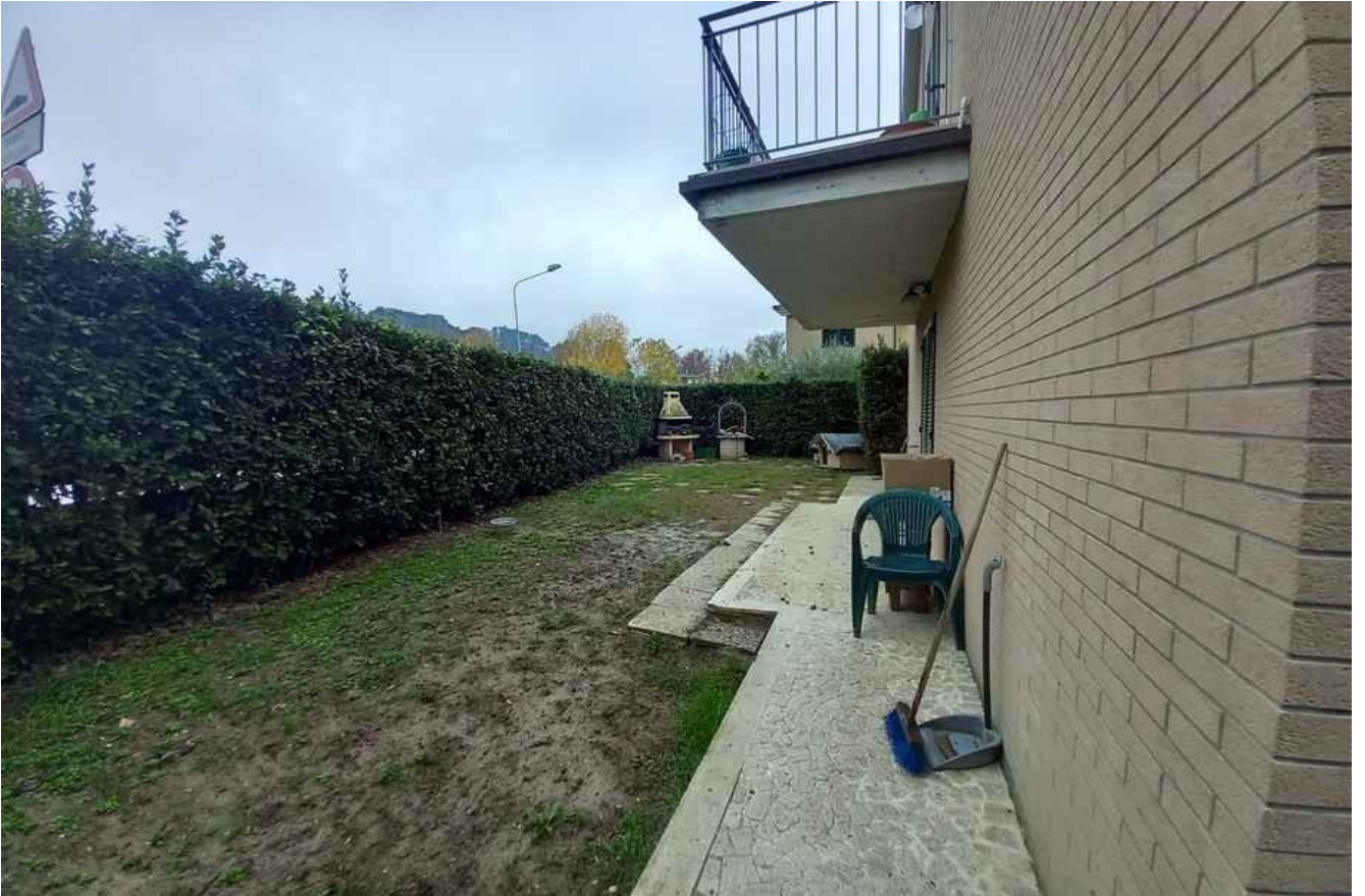
CORTE DI PERTINENZA LATO SUD