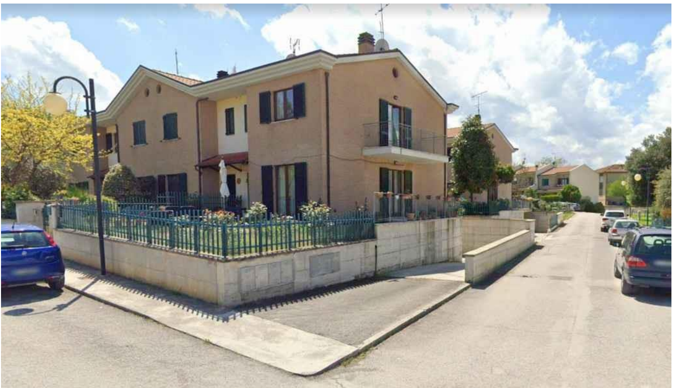
RAMPA DI ACCESSO AL PIANO GARAGE