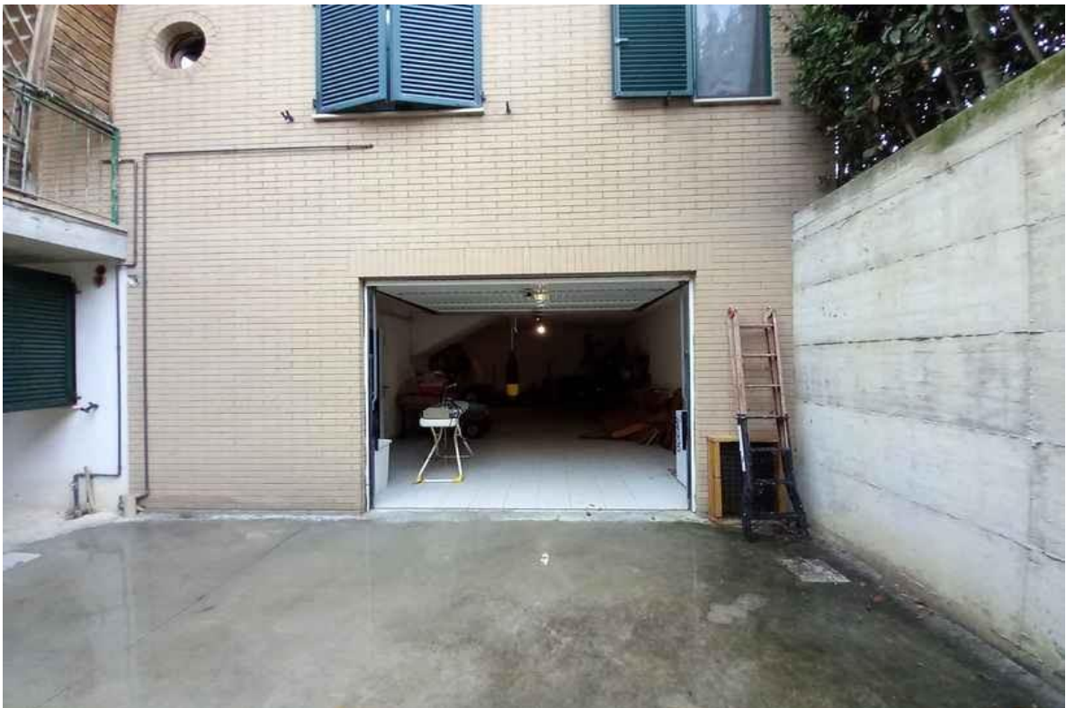
GARAGE – SUB 5