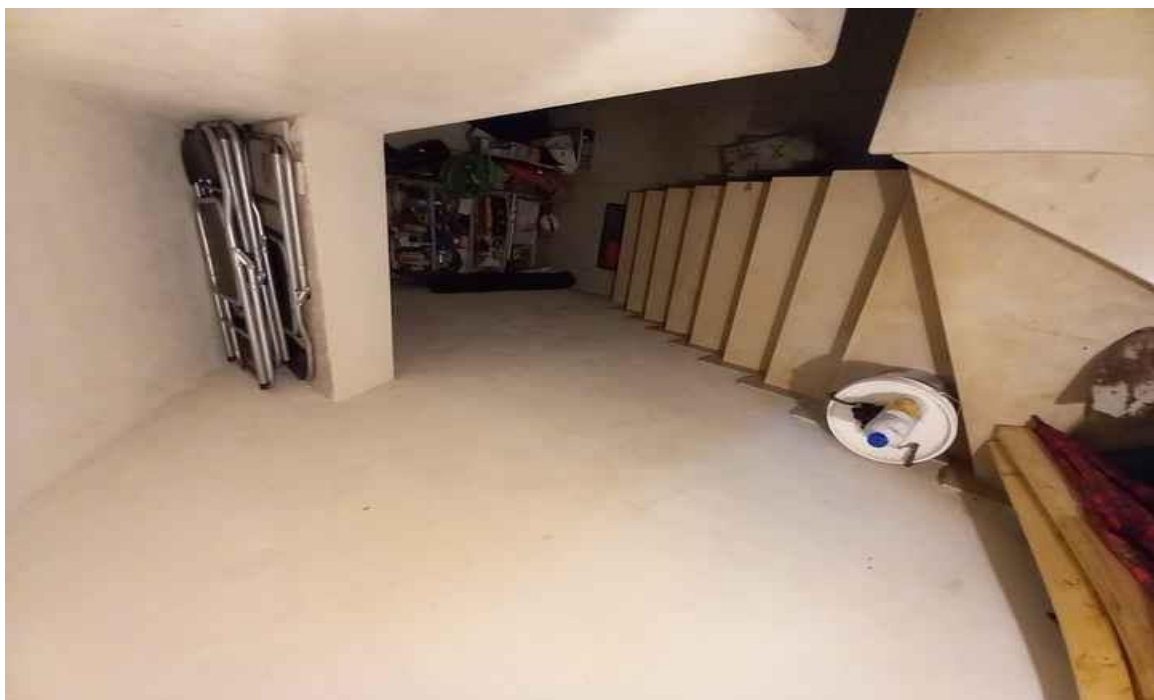
SCALA DI COLLEGAMENTO TRA IL GARAGE – SUB 5 – E L'ABITAZIONE – SUB 1