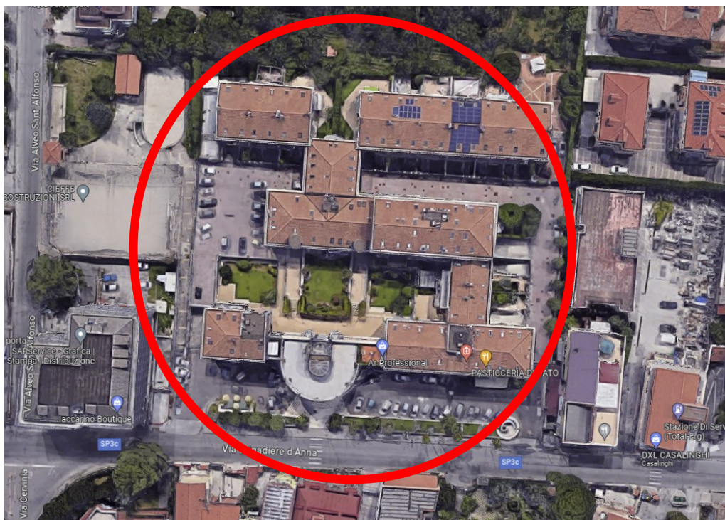
Figura 1 Stralcio ortofoto edificio al cui interno è presente l'immobile oggetto di stima

I beni oggetto di stima sono ubicati nel Comune di Anghi (SA) alla Via Brigadiere D'Anna e fanno parte del complesso edilizio denominato “Centro residenziale Rosato – Parco IRMA”