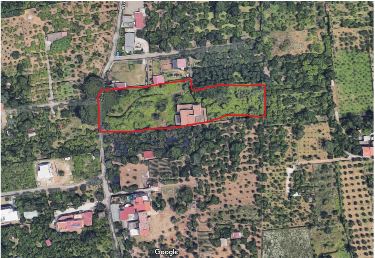
Lotto particelle 1675,1676,1677,1679

L'accesso al fondo avviene tramite l'alveo di San Leucio composto da una strada sterrata.