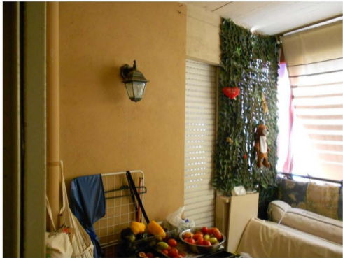
FOTO N. 6 - Loggia