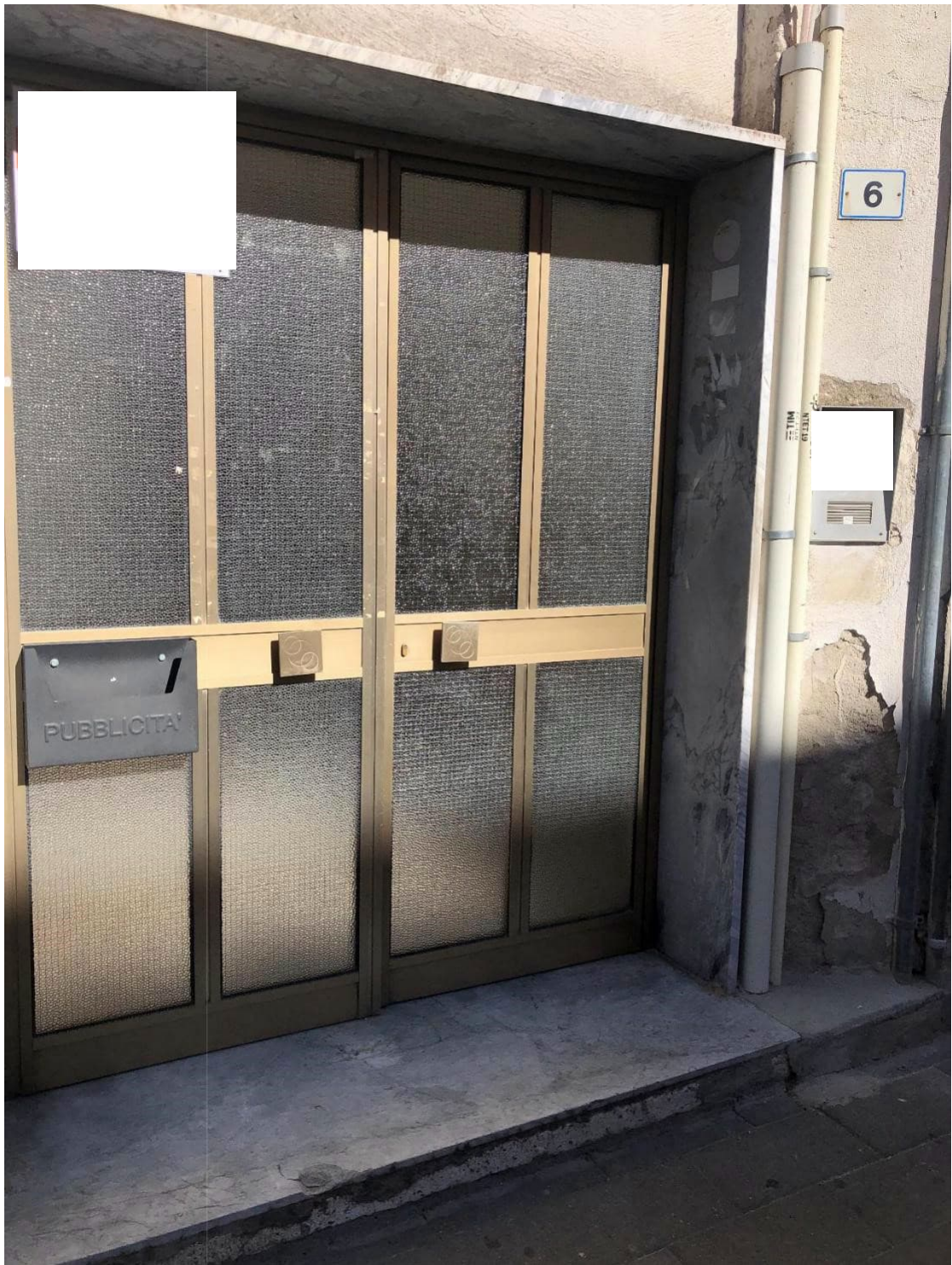
Foto n.5: Foto dell'accesso del palazzo dove insiste al 3 piano l'appartamento in Via Cesare Battisti n. 6 a Benevento NCEU al foglio 93 particella 102 sub 11.