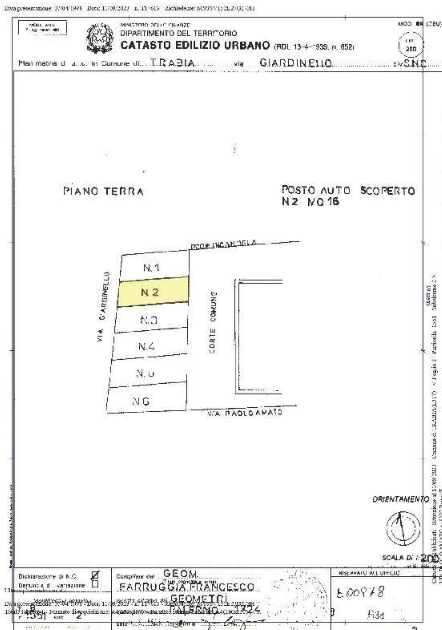
3. Planimetria catastale del posto auto scoperto con confini non materializzati. In giallo è evidenziato il sub 2.

Per il bene in questione non è stato effettuato un accesso forzoso.