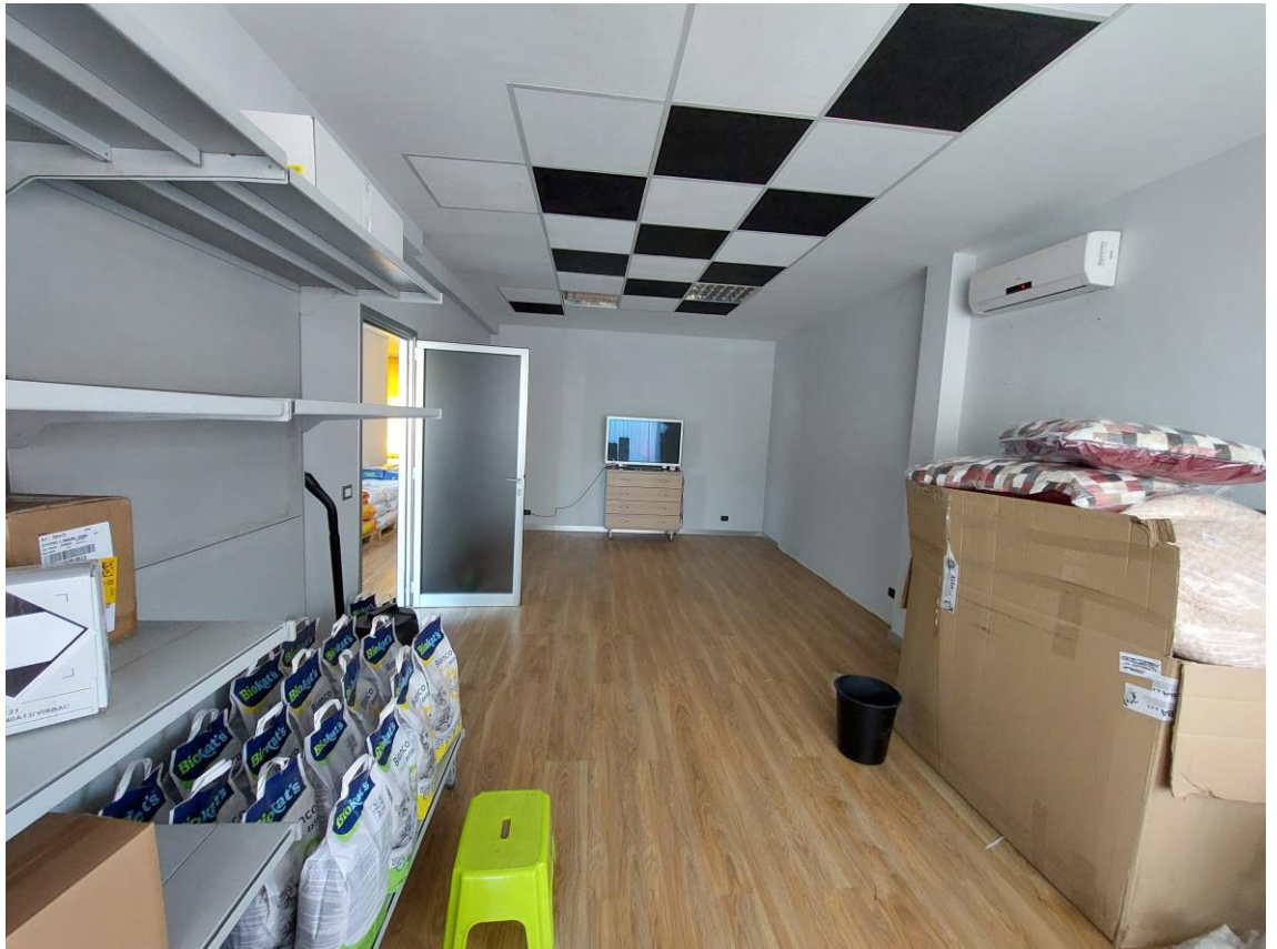
Foto n. 10 Locale caldaia Piano Terra Lotto 002