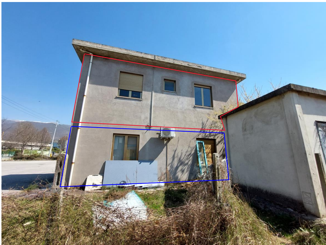
Foto n. 4 Esterno del Fabbricato Prospetto Sud-Est