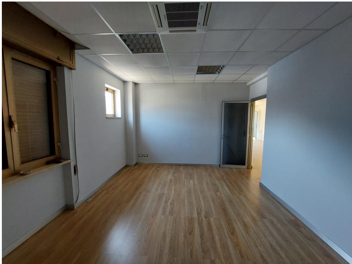
Foto n. 12 Ufficio 8 Piano Primo Lotto 002