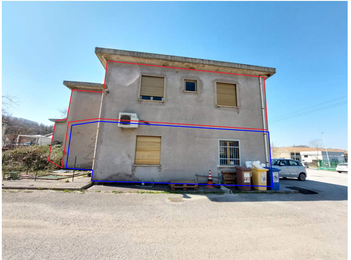
Foto n. 6 Locale vendita Piano Terra Lotto 001