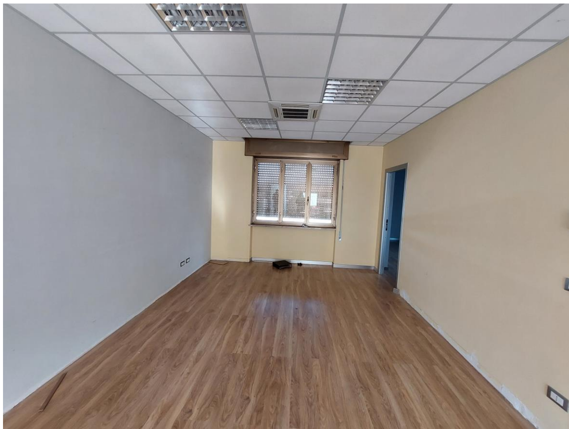
Foto n. 14 Ufficio 2 Piano Primo Lotto 002