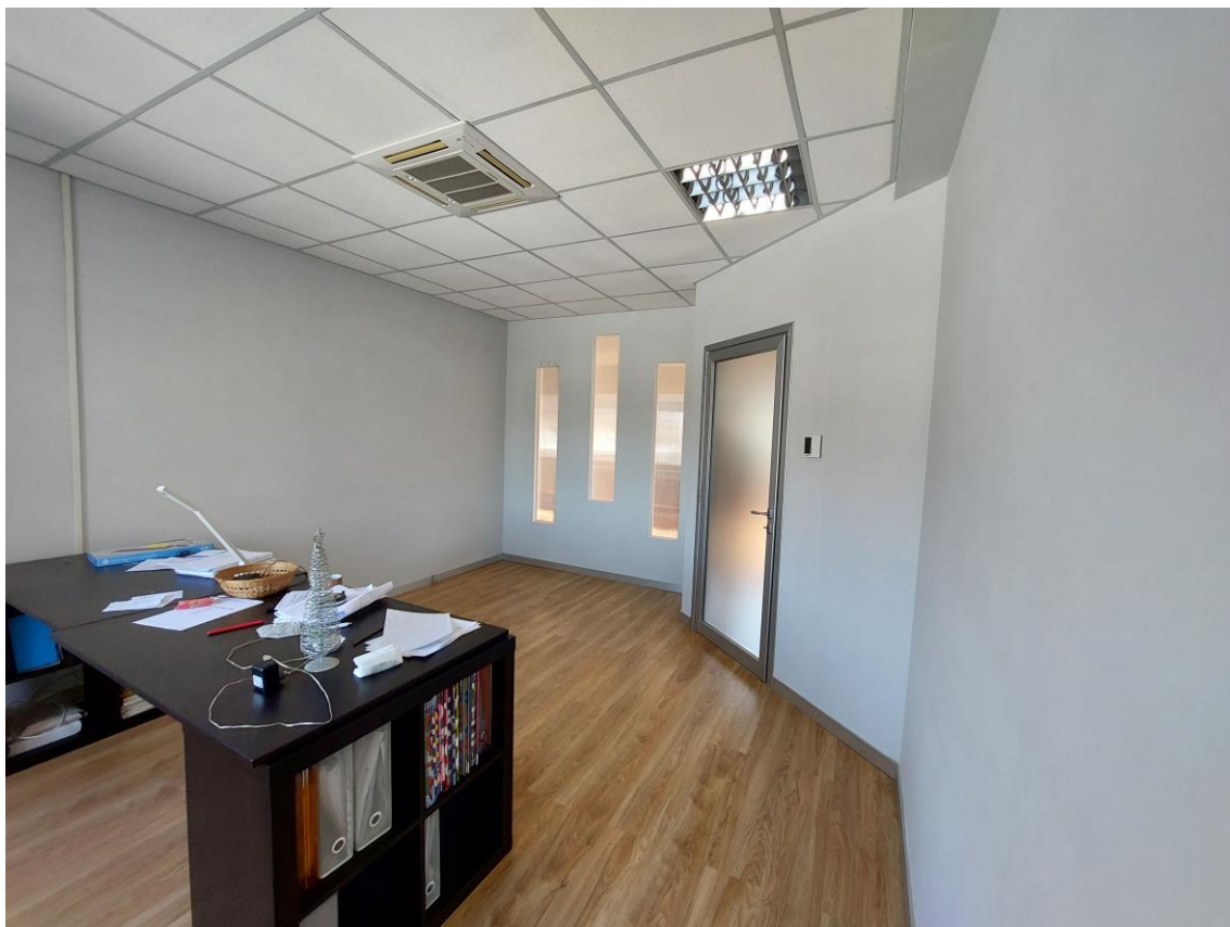
Foto n. 20 Ufficio 5 Piano Primo Lotto 002