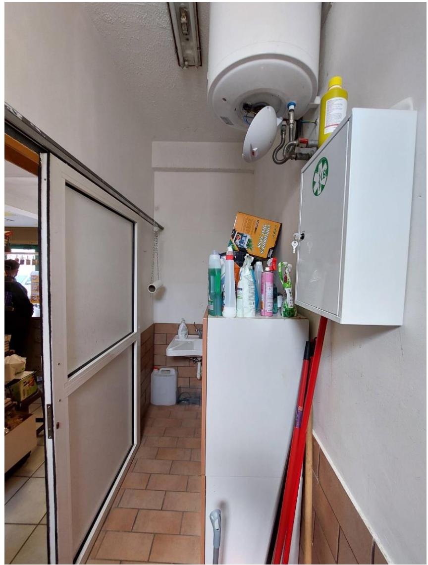
Foto n. 8 Magazzino 1 Piano Terra Lotto 001