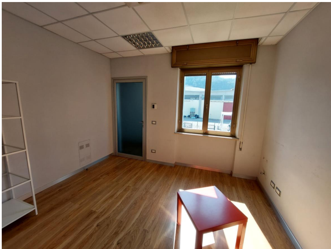
Foto n. 18 Ufficio 3 Piano Primo Lotto 002