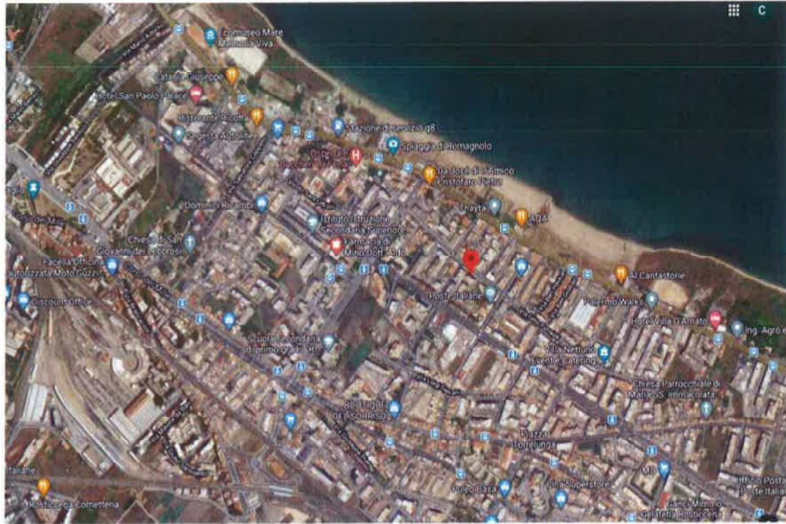
Foto1: Mappa territoriale