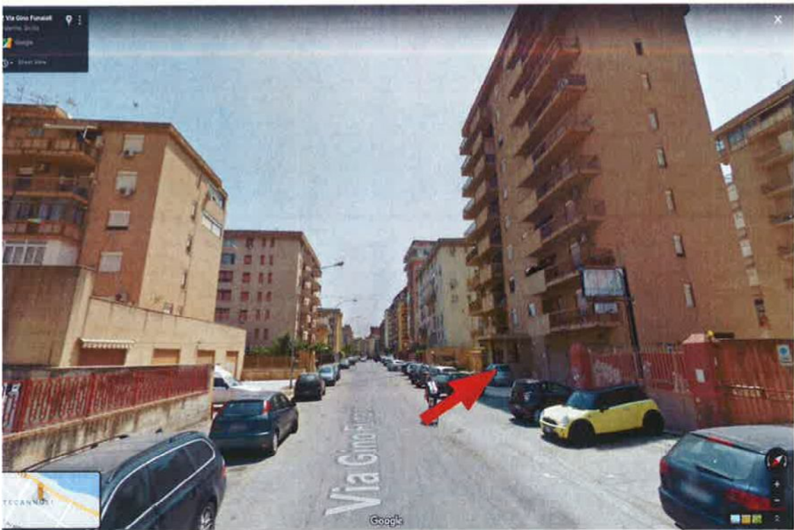
Fig. 4: Individuazione del fabbricato lungo via Gino Funaioli: vista verso sud-est