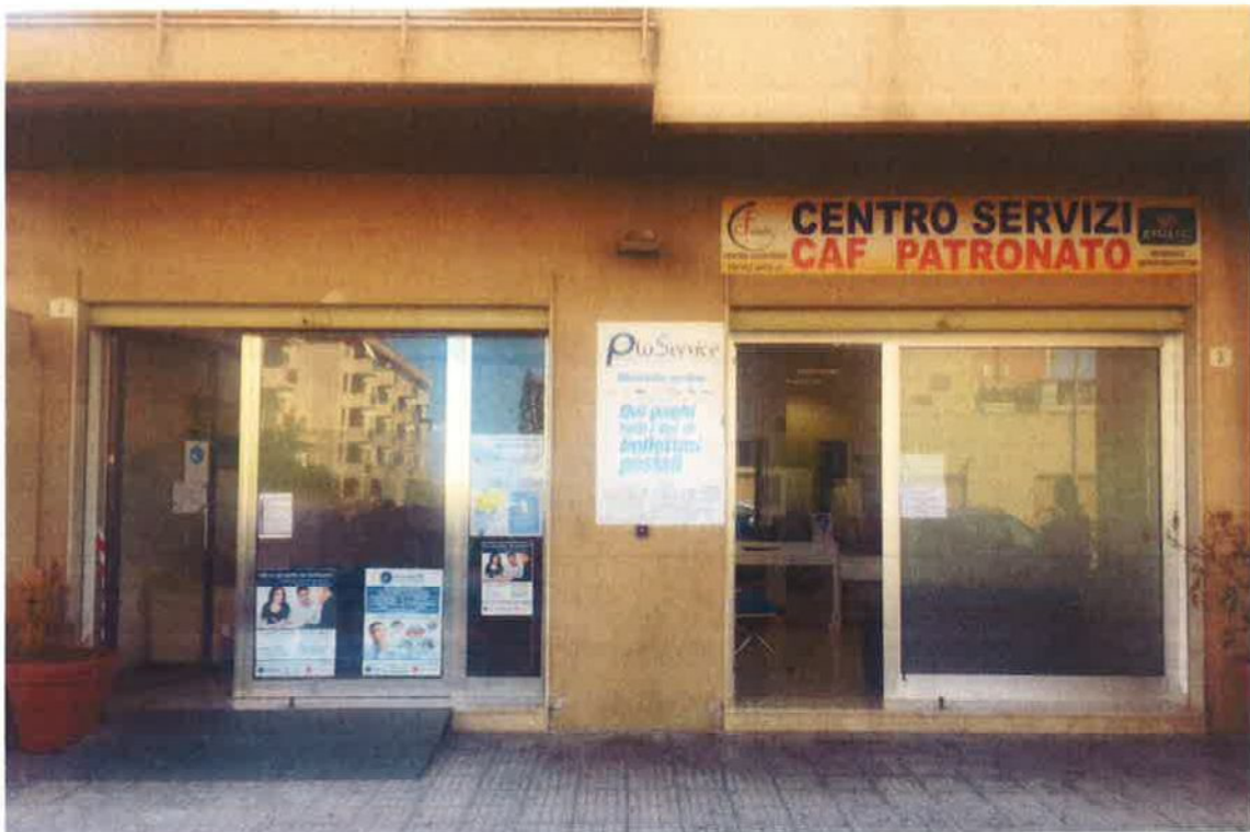
Fig.6: Ingressi all'unità immobiliare - civv.3e e 3f