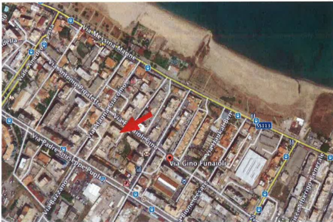
Foto2: Ubicazione del fabbricato