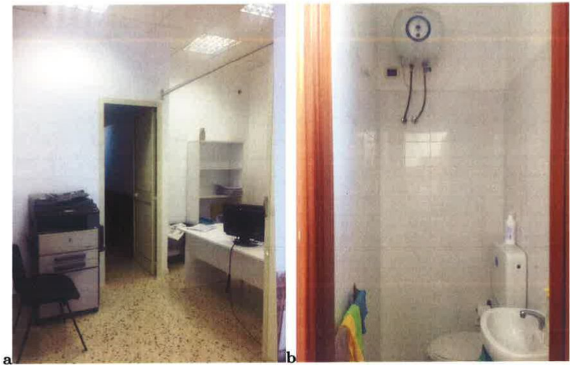
Fig. 10: a-Zona ufficio; b-servizio igienico