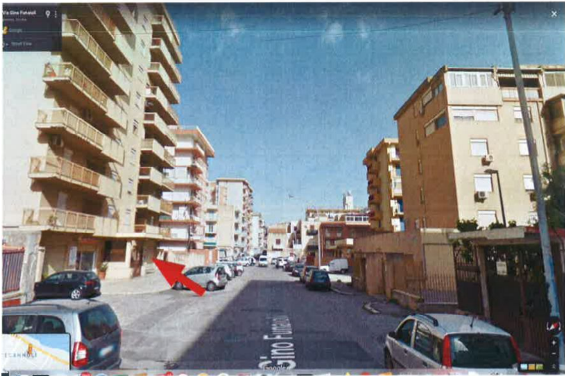
Fig.3: Individuazione del fabbricato lungo via Gino Funaioli: vista verso nord-ovest