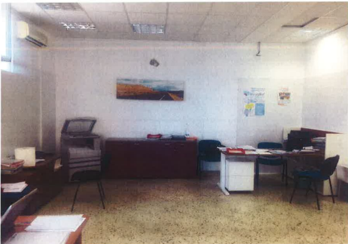
Fig. 8: Locale sul retro