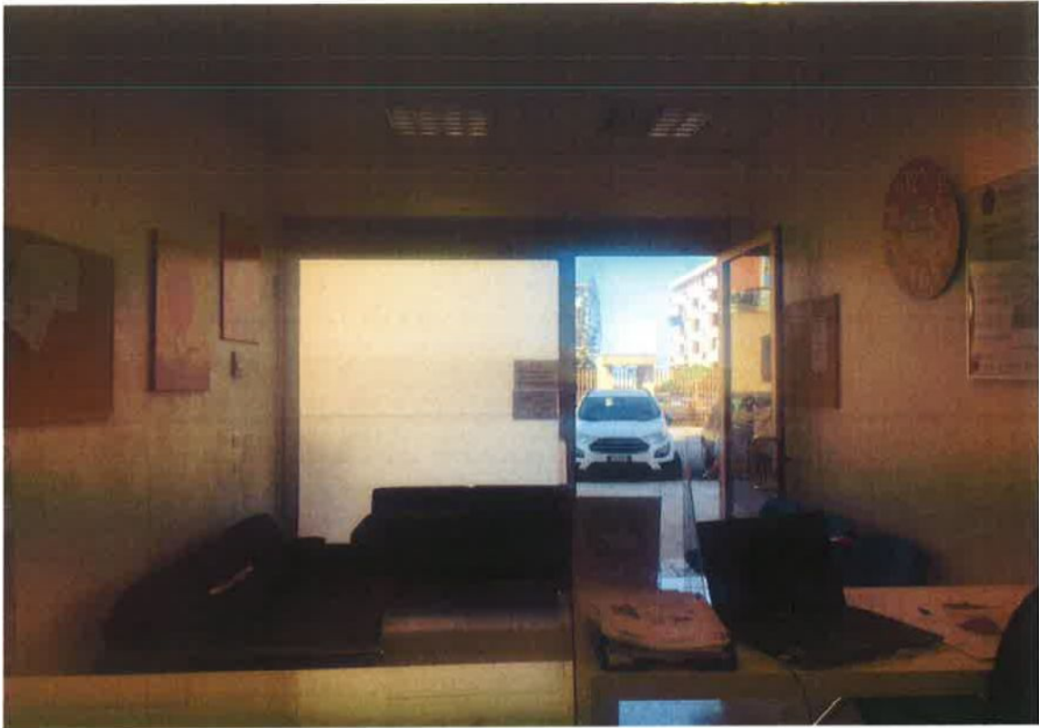
Fig. 9: Locale di ricevimento del pubblico