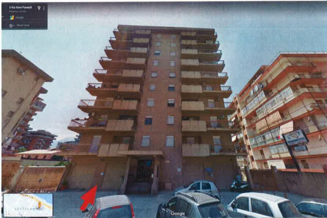
Fig. 5: Fronte principale del fabbricato prospiciente via Gino Funaioli