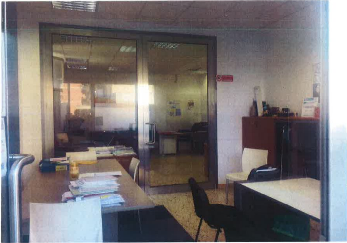
Fig. 7: Locale di ingresso