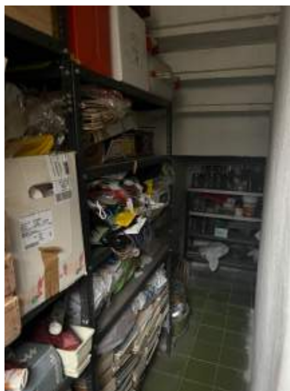
Piano meno 1