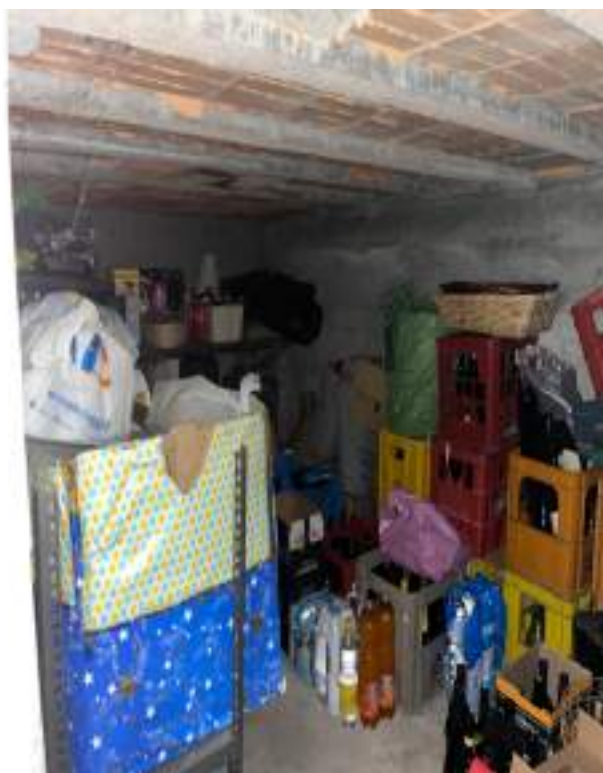
Piano meno 1