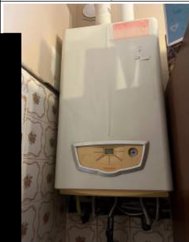
Caldaio cucina PT