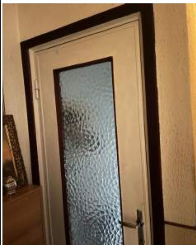
Porta Piano meno 1