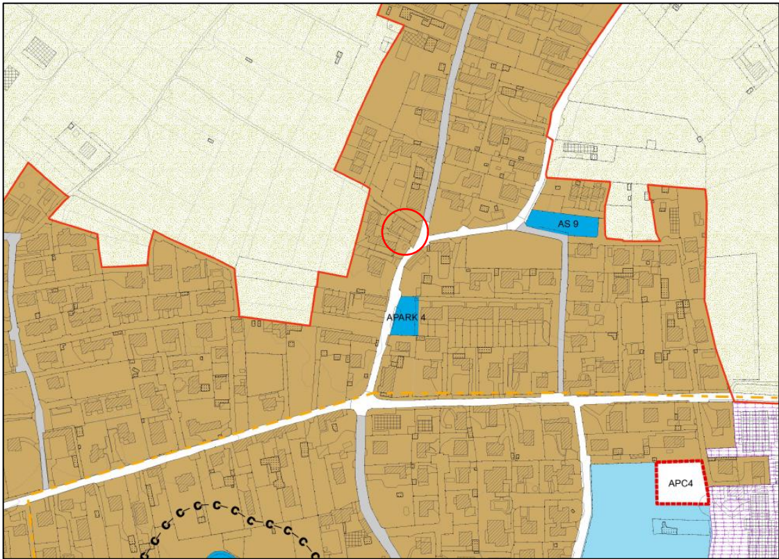
Stralcio Variante PGT