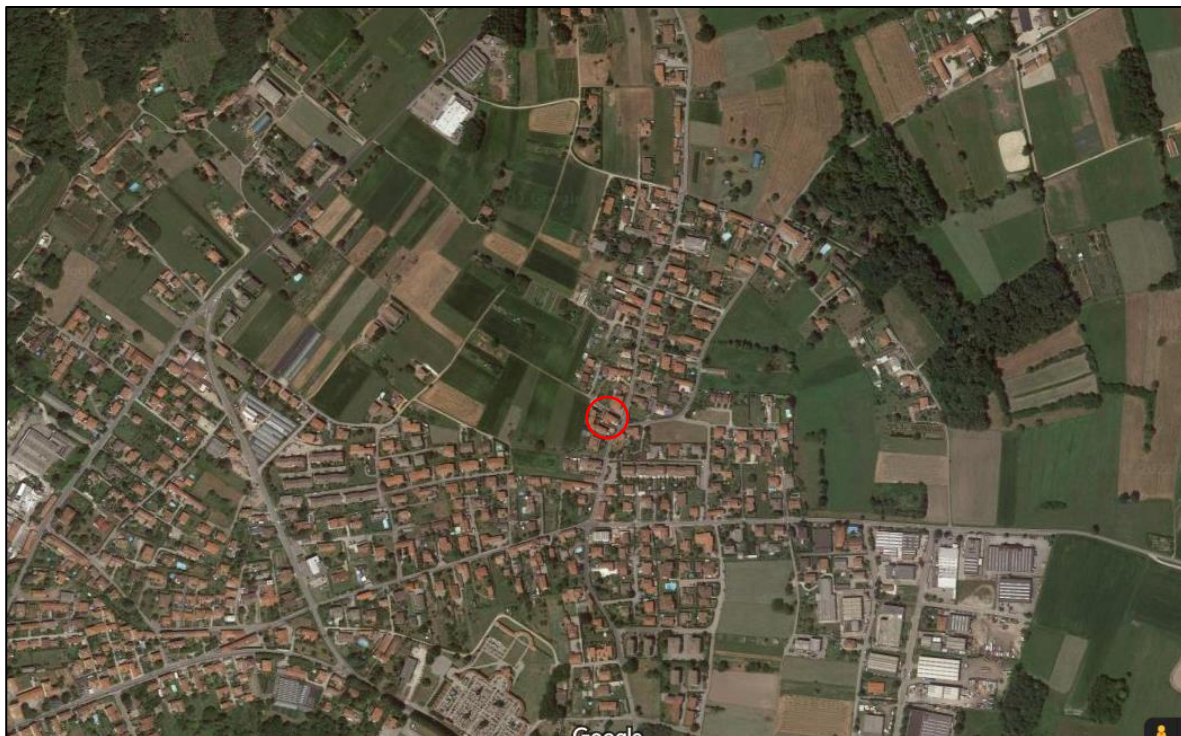
Vista aerea