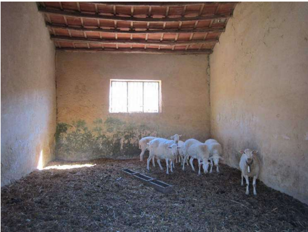
Allegato 5.56: vano adibito a ricovero animali