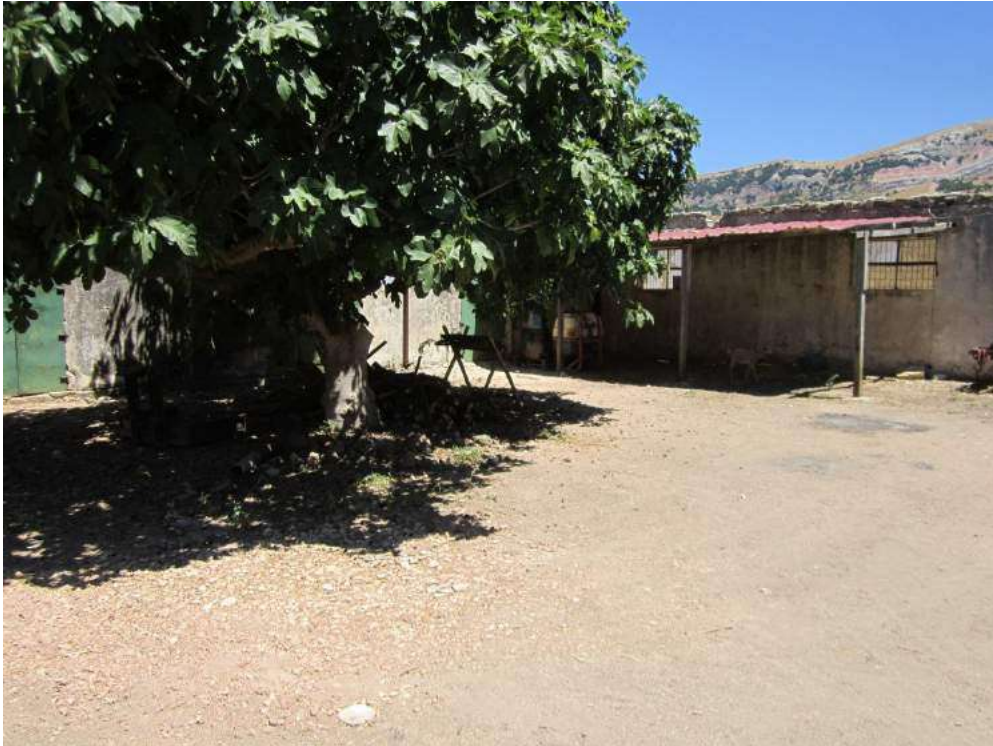
Allegato 5.25: corte secondaria