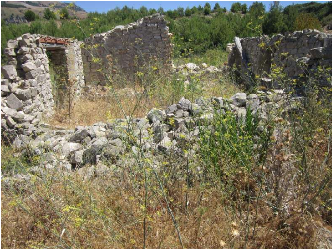
Allegato 5.50: rudere di fabbricato rurale (fg 104 part. 230 Corleone)