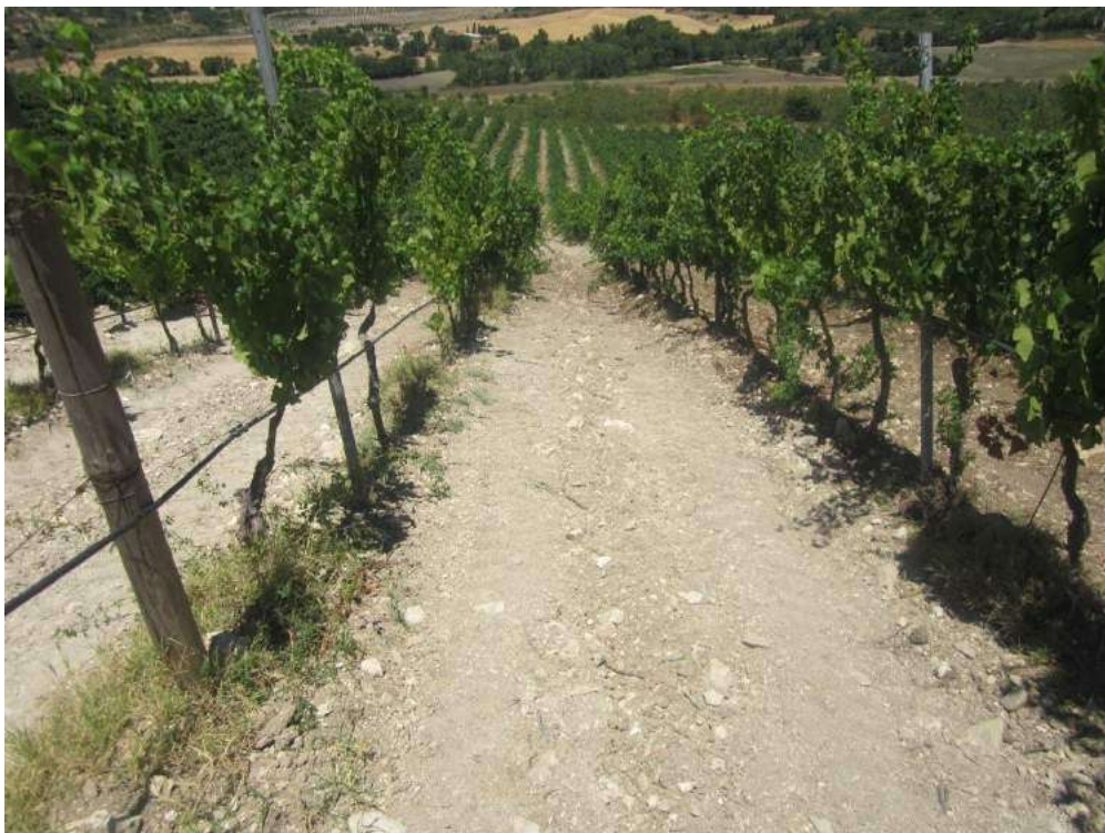
Allegato 5.46: lotto di terreno

(fg 104 part. 229 Corleone e fg 16 partt. 184-279-280-281 Campofiorito)