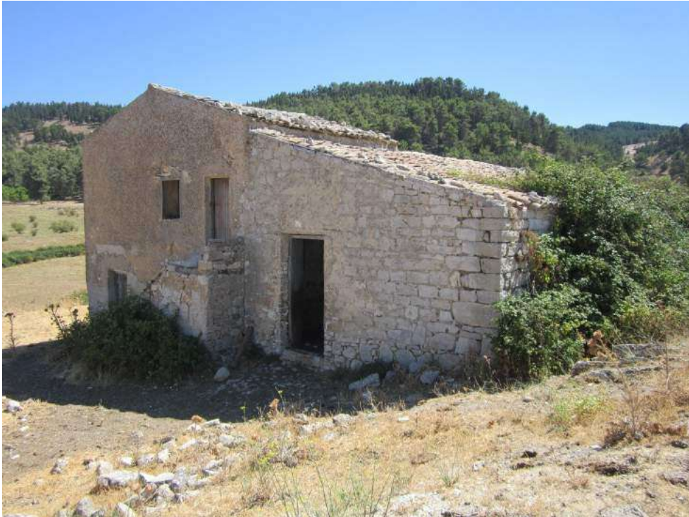
Allegato 5.59: fabbricato rurale (fg 107 Corleone part. 211)