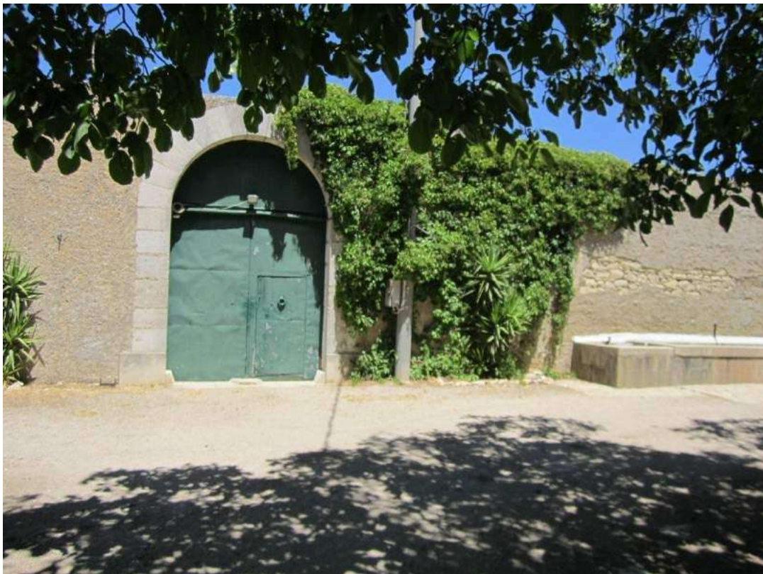
Allegato 5.2: portale della corte principale (fg 104 Corleone part. 228/2)