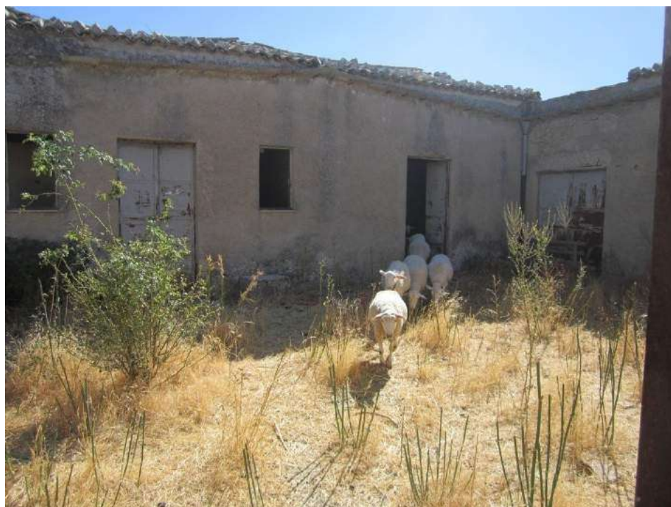
Allegato 5.54: corte principale