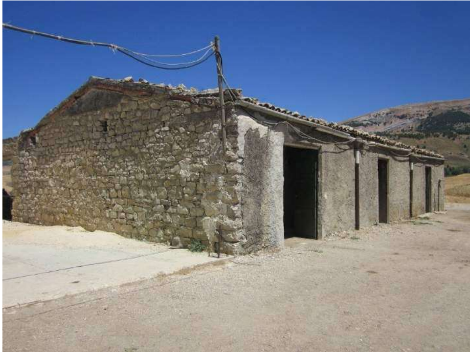
Allegato 5.33: ala Est adibita a magazzini agricoli