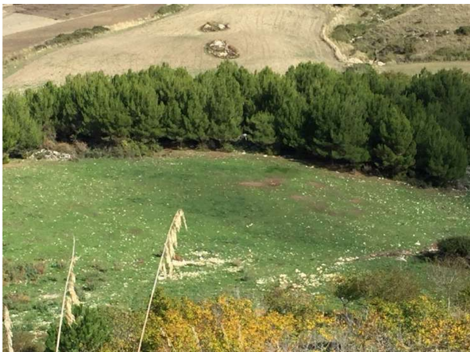
Allegato 13.5: Lotto composto dalle partt. 53-70-71 (fg. 104)