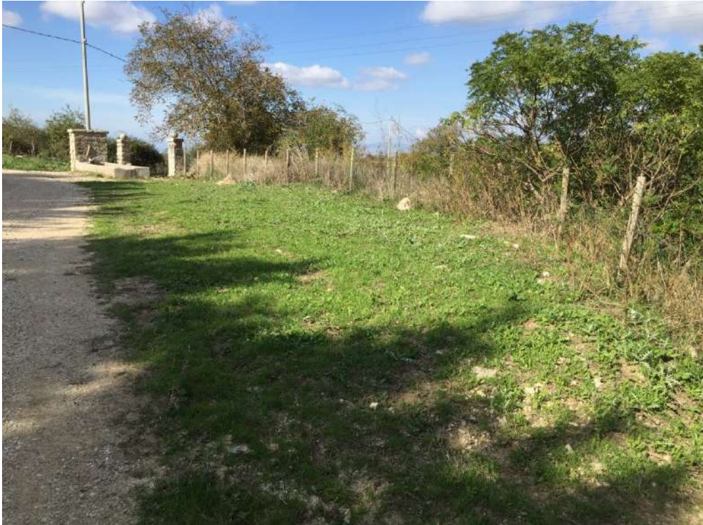
Allegato 13.9: Lotto composto dalla part. 67 (fg. 104)