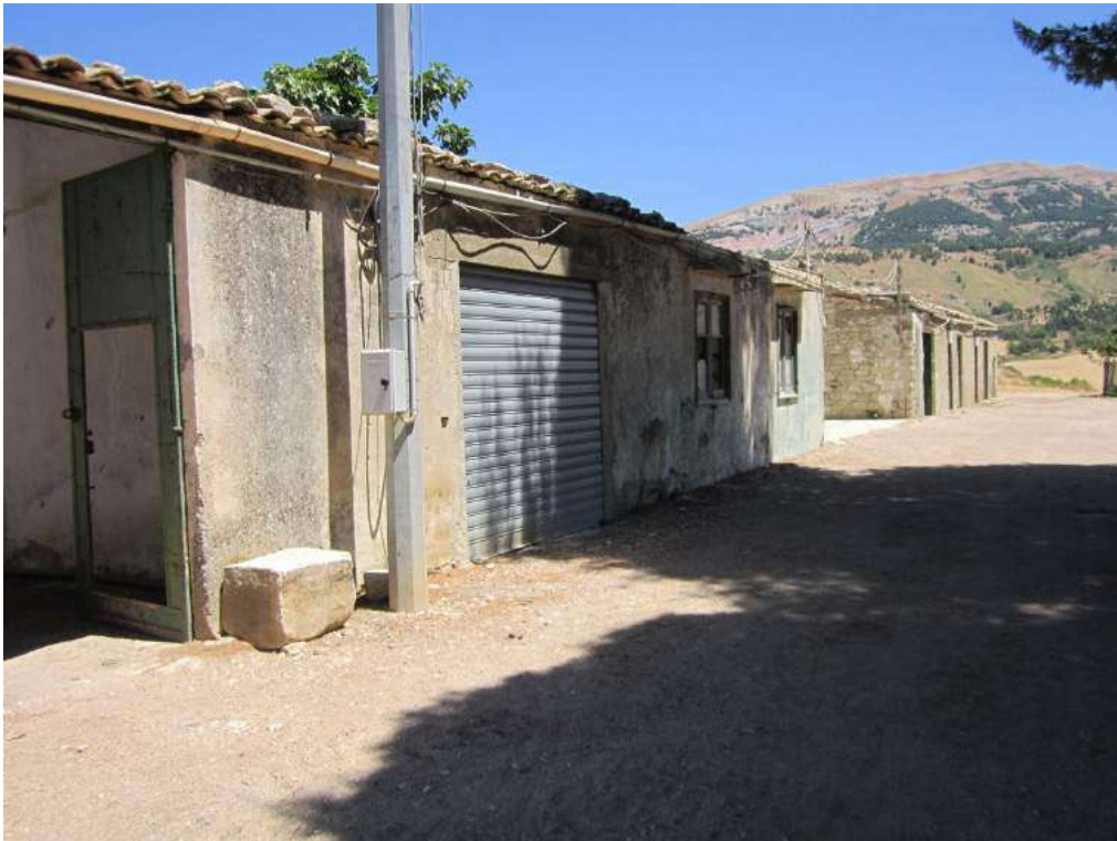
Allegato 5.4: viale di accesso