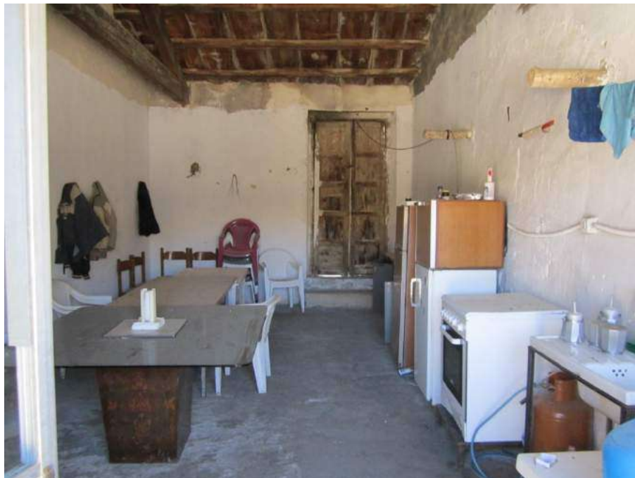
Allegato 5.18: locale di collegamento tra le due corti