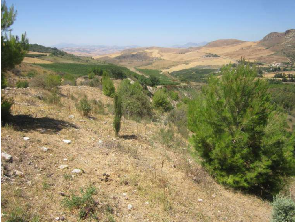
Allegato 5.39: lotto di terreno

(fg 104 part. 229 Corleone e fg 16 partt. 184-279-280-281 Campofiorito)