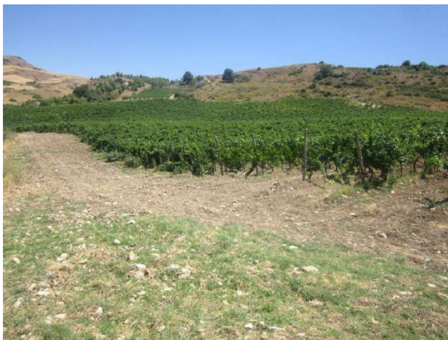
Allegato 5.48: lotto di terreno

(fg 104 part. 229 Corleone e fg 16 partt. 184-279-280-281 Campofiorito)