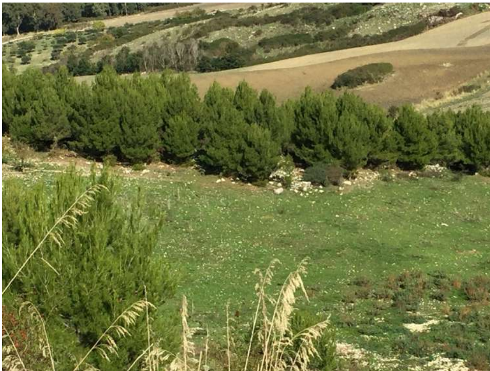
Allegato 13.4: Lotto composto dalle partt. 53-70-71 (fg. 104)