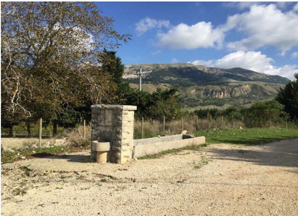
Allegato 13.8: Lotto composto dalla part. 67 (fg. 104)