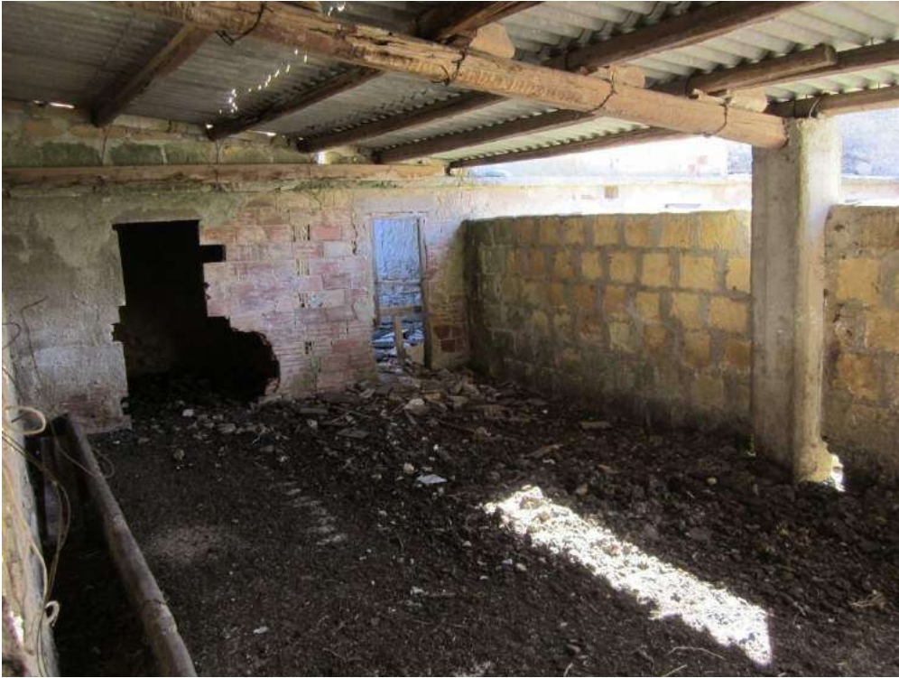
Allegato 5.55: cortile secondario