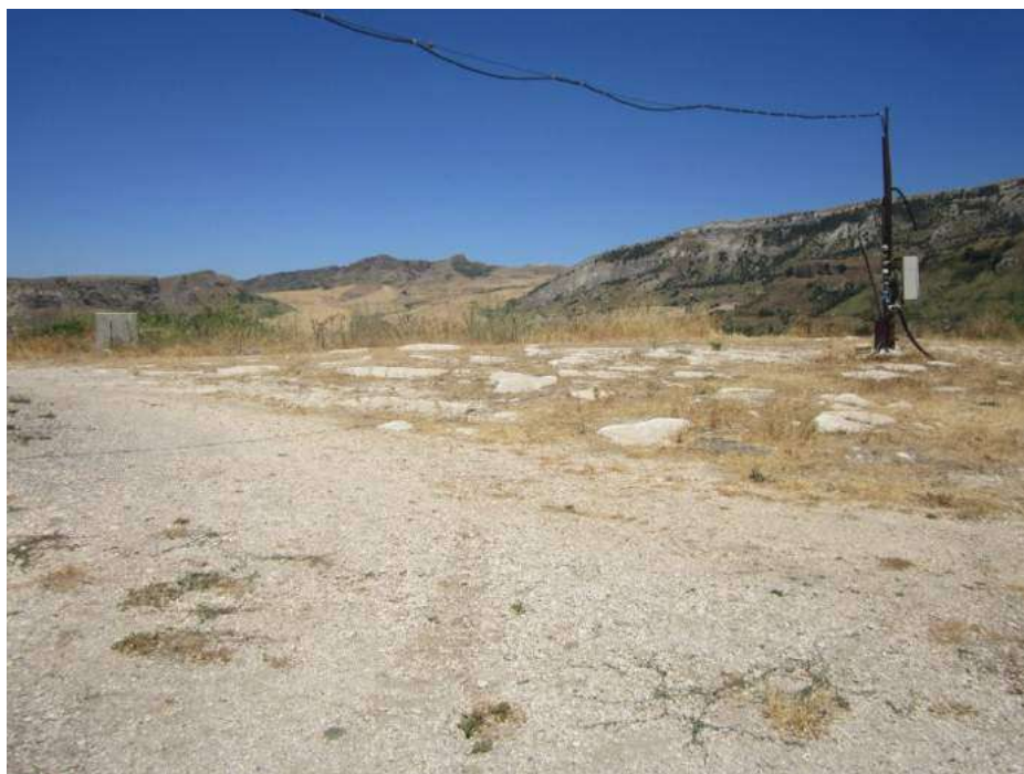
Allegato 5.37: spazio attorno al bene (corte di pertinenza)