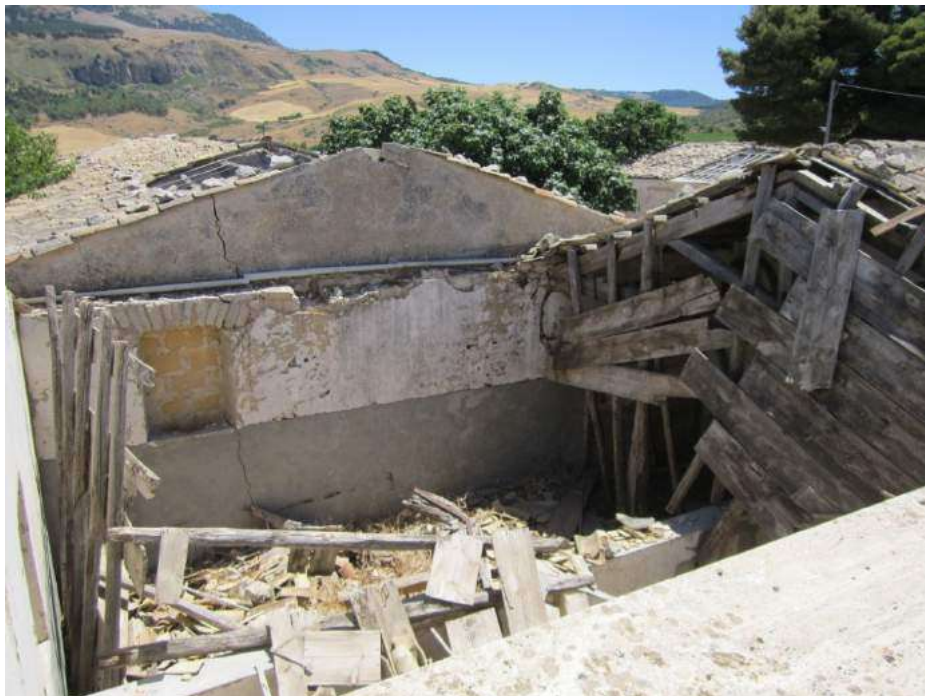
Allegato 5.16: vano distrutto