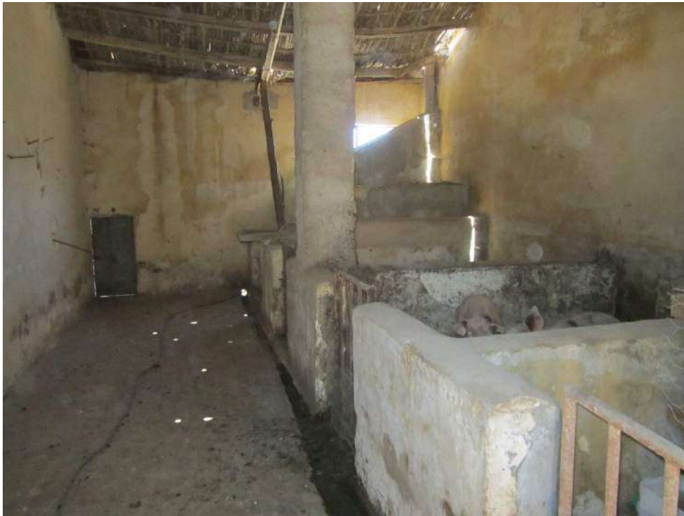
Allegato 5.30: locale adibito a ricovero di animali