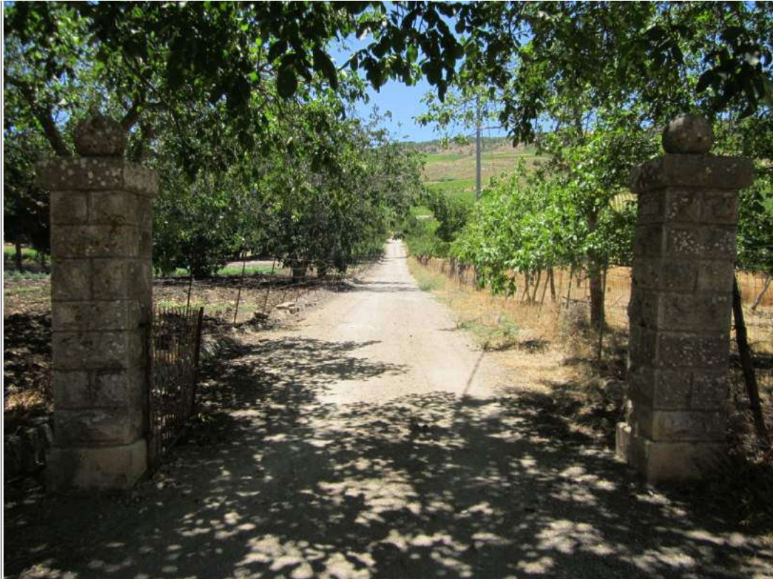
Allegato 5.1: viale d'ingresso alla casa padronale (fg 104 Corleone part. 228/2)