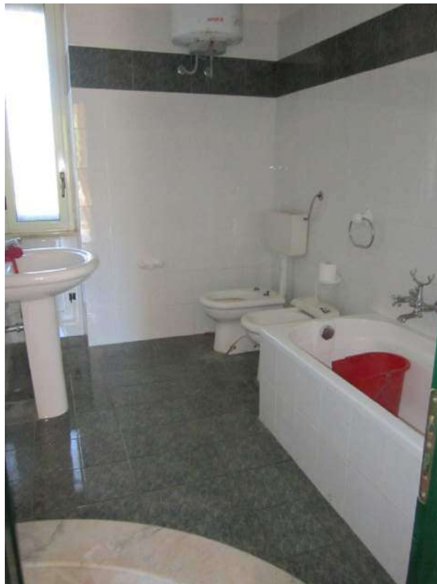
Allegato 5.12: bagno