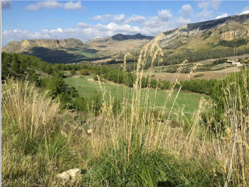
Allegato 13.1: Lotto composto dalle partt. 53-70-71 (fg. 104)