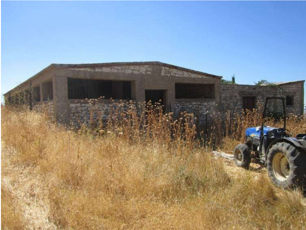
Allegato 5.63: fabbricato rurale (fg 107 Corleone part. 261)