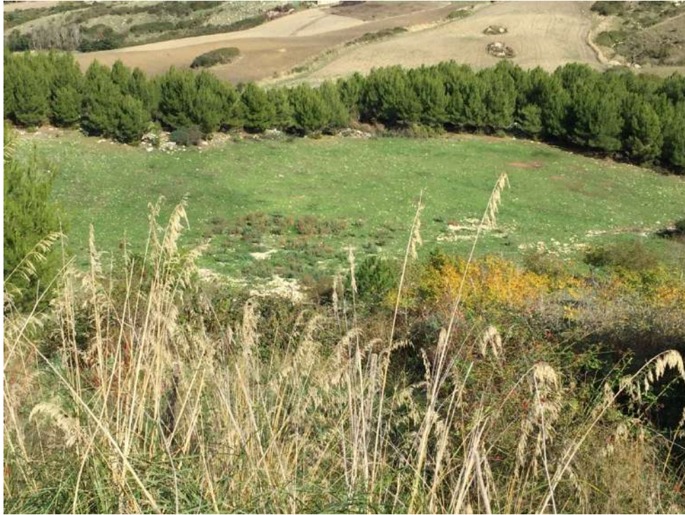
Allegato 13.3: Lotto composto dalle partt. 53-70-71 (fg. 104)