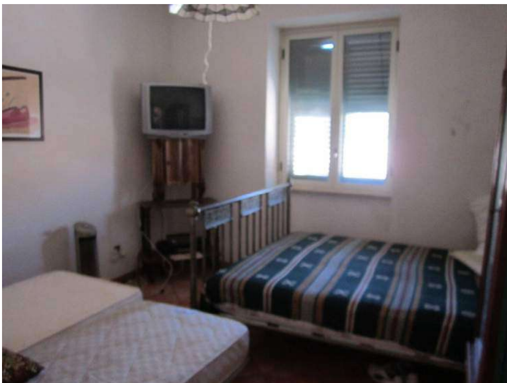
Allegato 5.13: camera