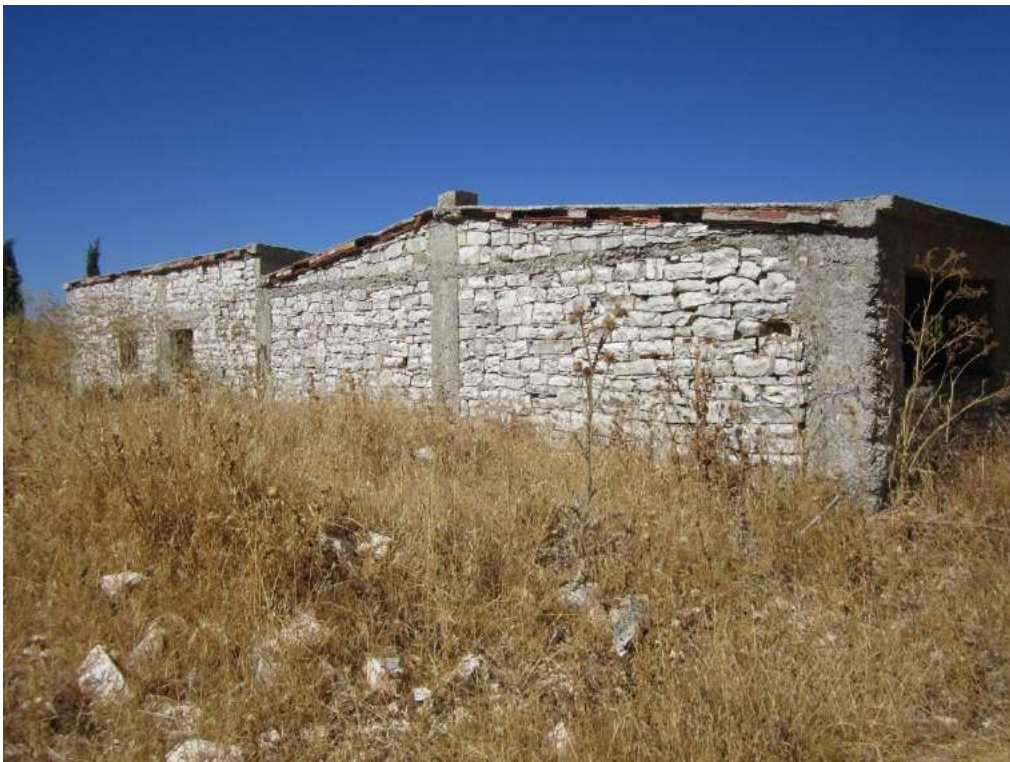
Allegato 5.64: fabbricato rurale (fg 107 Corleone part. 261)