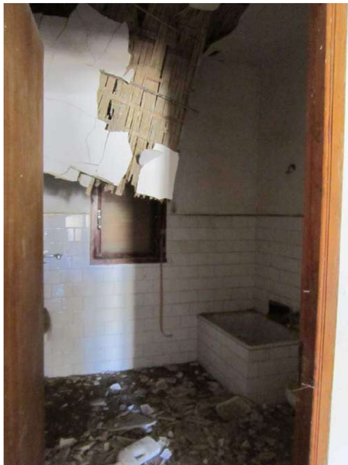
Allegato 5.26: bagno ex locale di ricovero