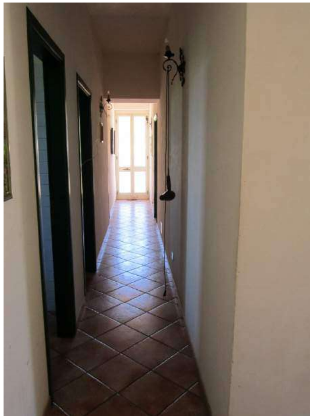
Allegato 5.10: disimpegno