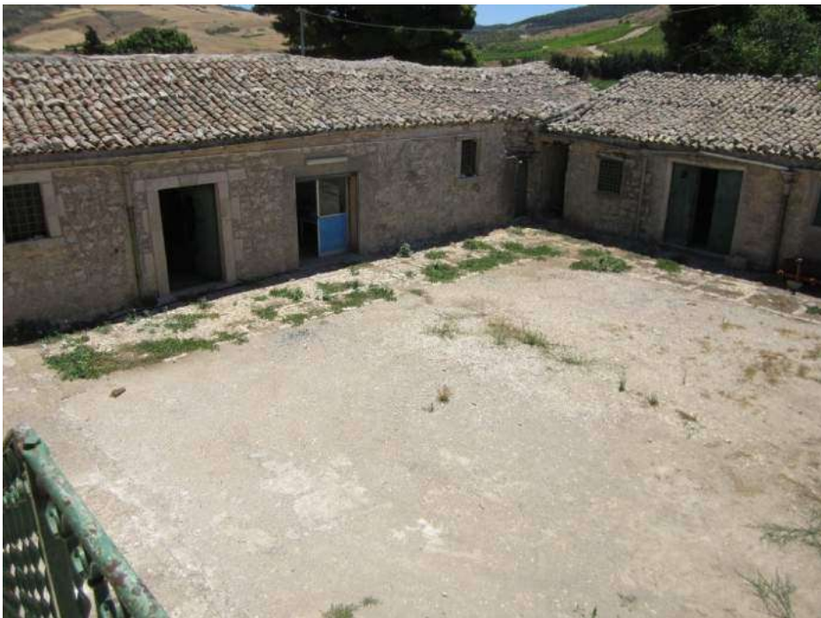
Allegato 5.8: locali distribuiti attorno alla corte