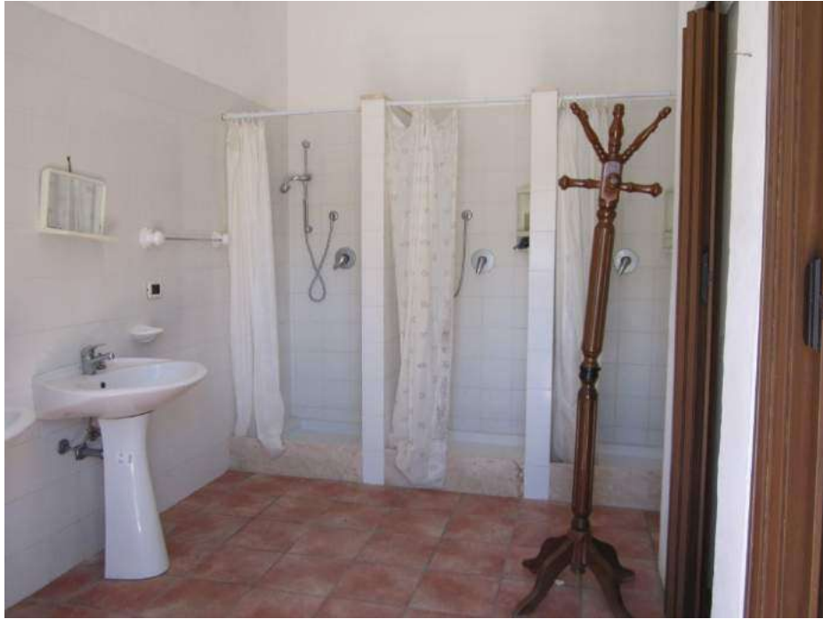
Allegato 5.15: locale spogliatoio (piano Terra)