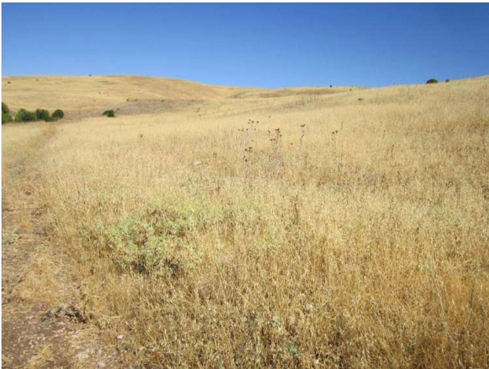
Allegato 5.70: lotto di terreno (fg 107 Corleone part. 23 e 260)