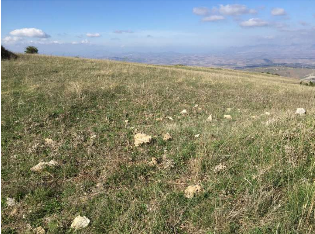
Allegato 13.11: Lotto composto dalle partt. 25-64-67-102-117-118-119-120 (fg. 107)