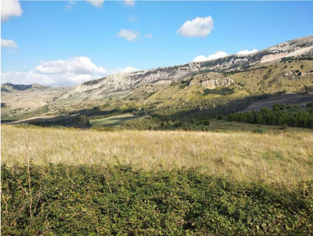
Allegato 13.7: Lotto composto dalla part. 52 (fg. 104)