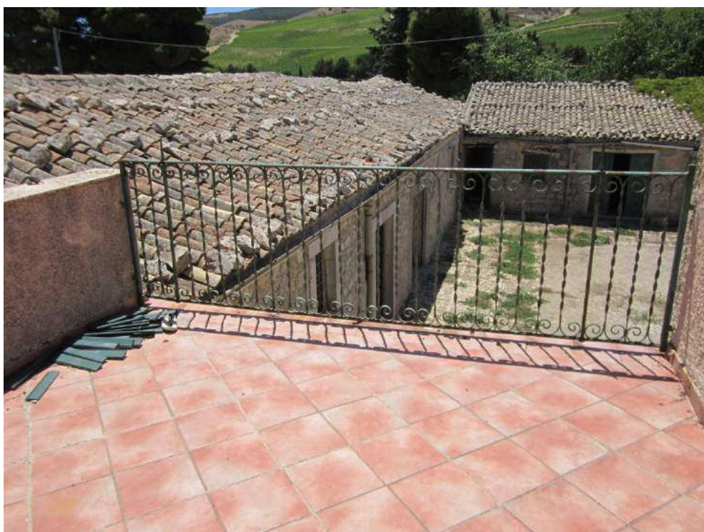
Allegato 5.14: terrazzo appartamento