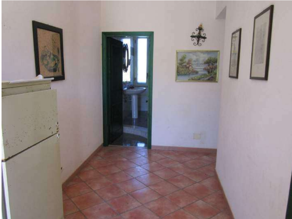
Allegato 5.9: ingresso all'appartamento (piano primo)