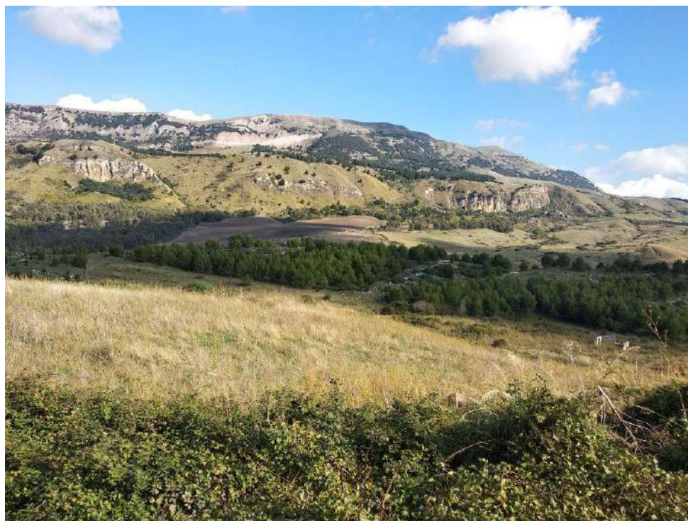
Allegato 13.6: Lotto composto dalla part. 52 (fg. 104)