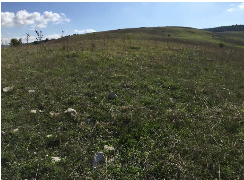
Allegato 13.15: Lotto composto dalle partt. 25-64-67-102-117-118-119-120 (fg. 107)