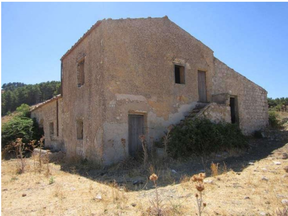
Allegato 5.58: fabbricato rurale (fg 107 Corleone part. 211)