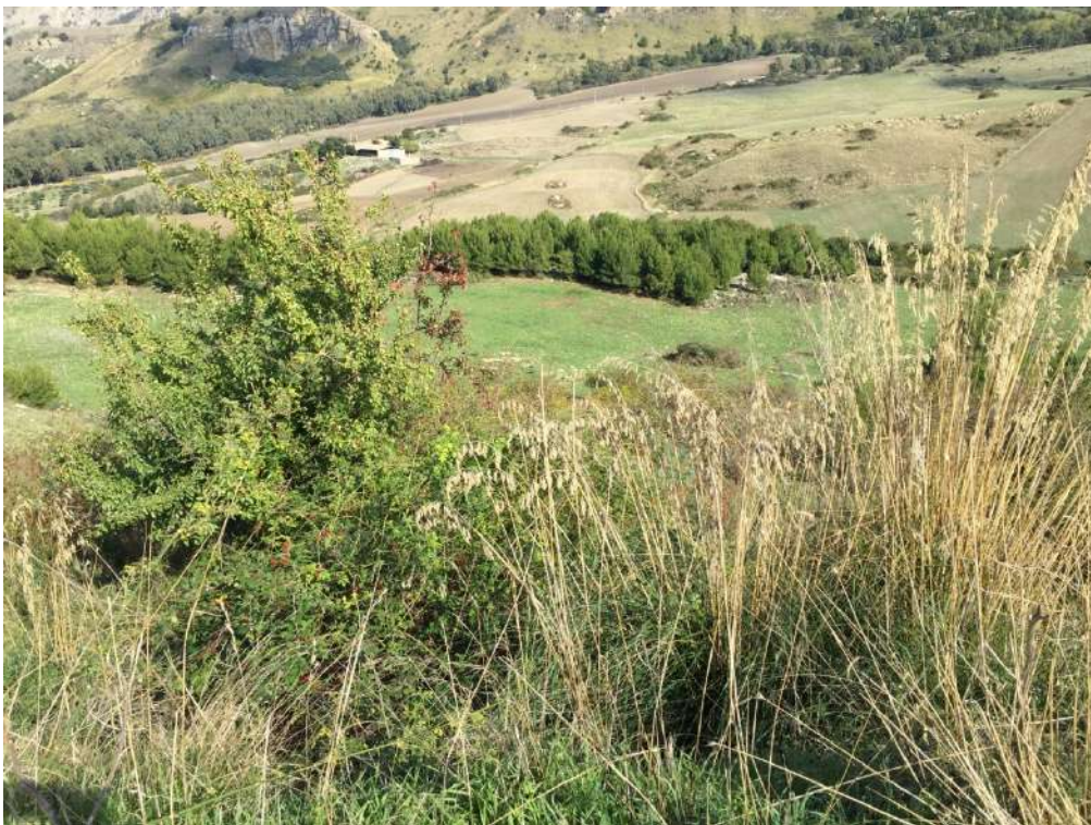
Allegato 13.2: Lotto composto dalle partt. 53-70-71 (fg. 104)