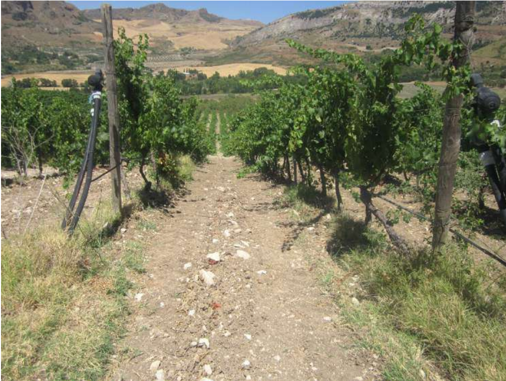
Allegato 5.45: lotto di terreno

(fg 104 part. 229 Corleone e fg 16 partt. 184-279-280-281 Campofiorito)