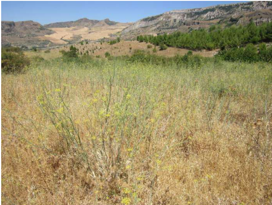
Allegato 5.42: lotto di terreno

(fg 104 part. 229 Corleone e fg 16 partt. 184-279-280-281 Campofiorito)