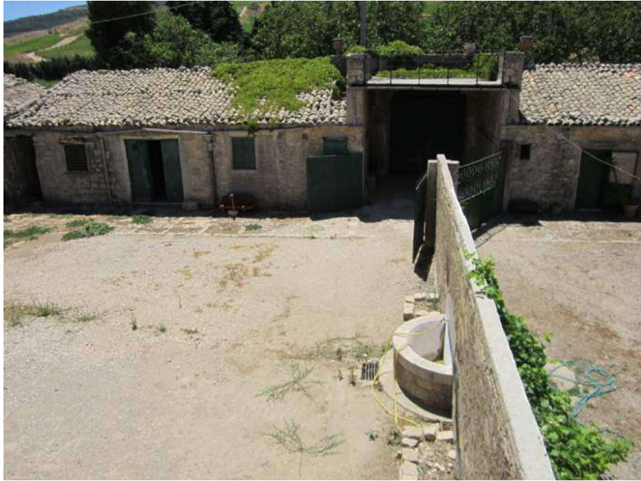
Allegato 5.7: corte principale