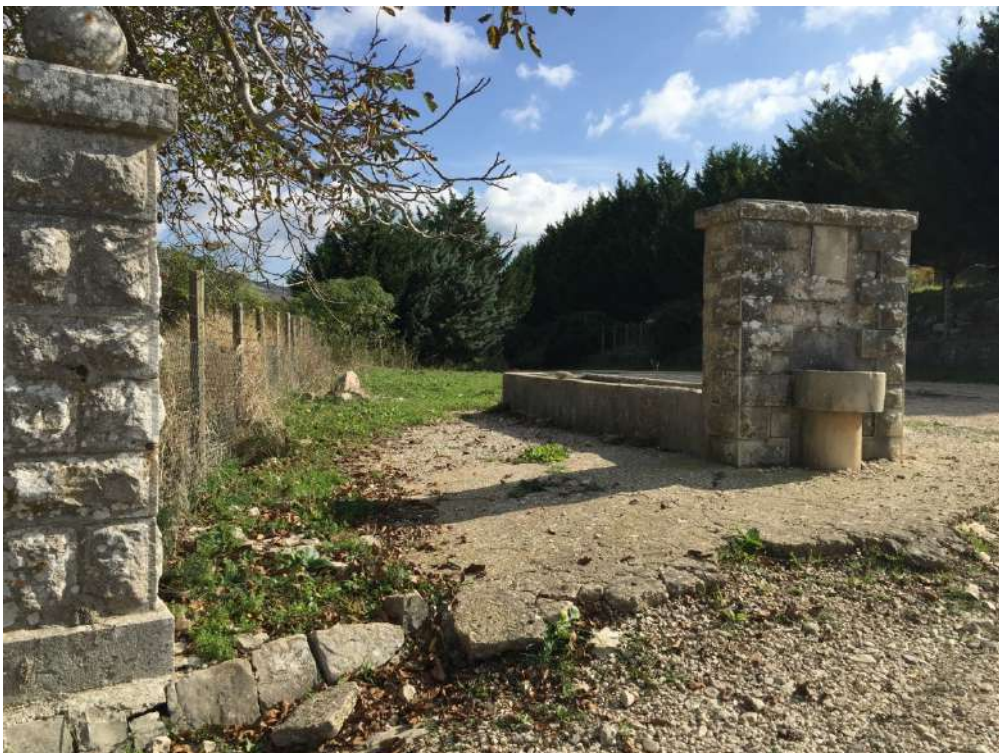
Allegato 13.10: Lotto composto dalla part. 67 (fg. 104)