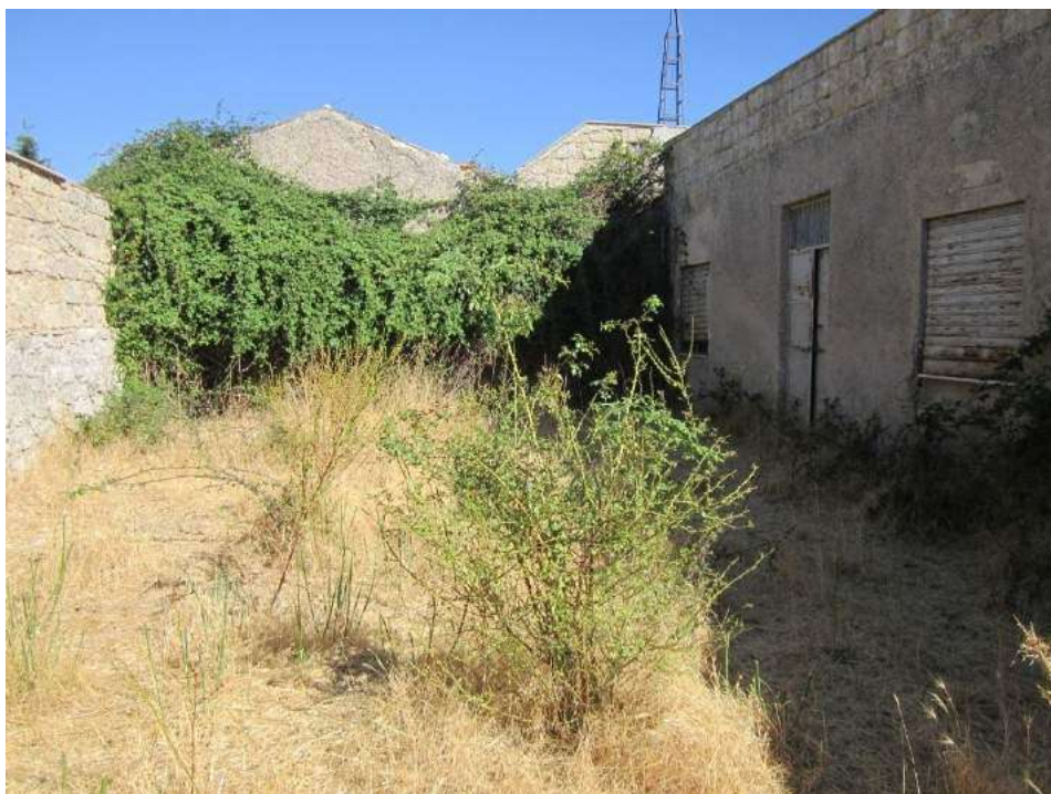
Allegato 5.53: corte principale