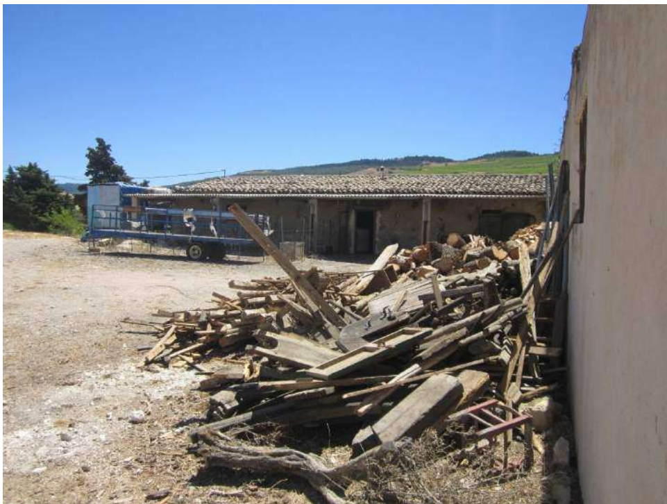
Allegato 5.34: porticato retrostante i locali agricoli