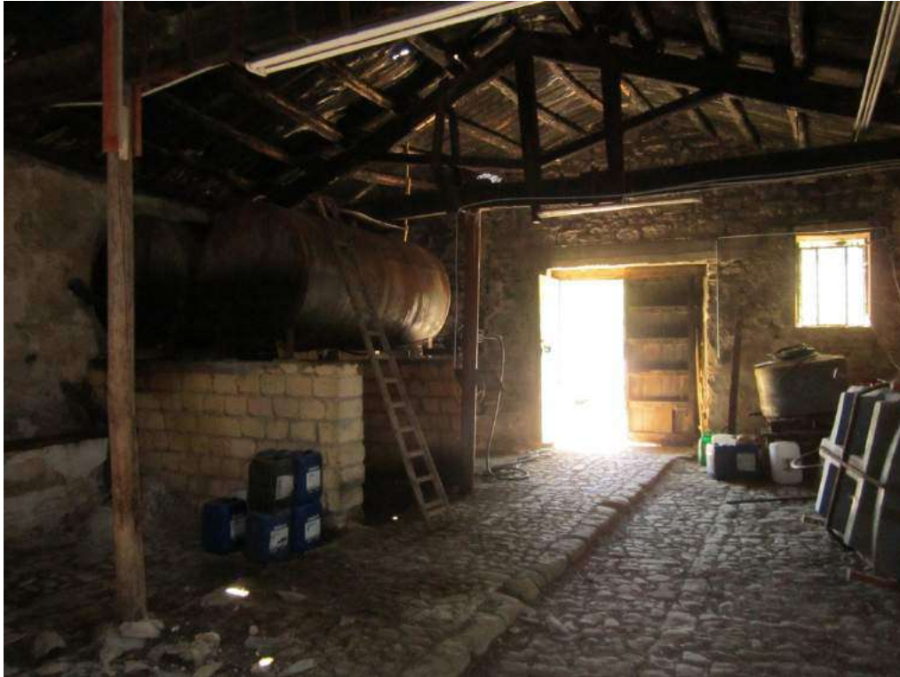
Allegato 5.29: locale di deposito