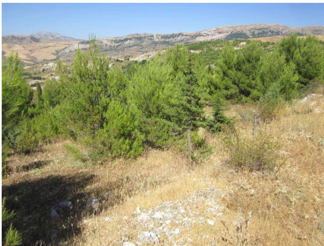
Allegato 5.68: lotto di terreno (fg 107 Corleone part. 23 e 260)