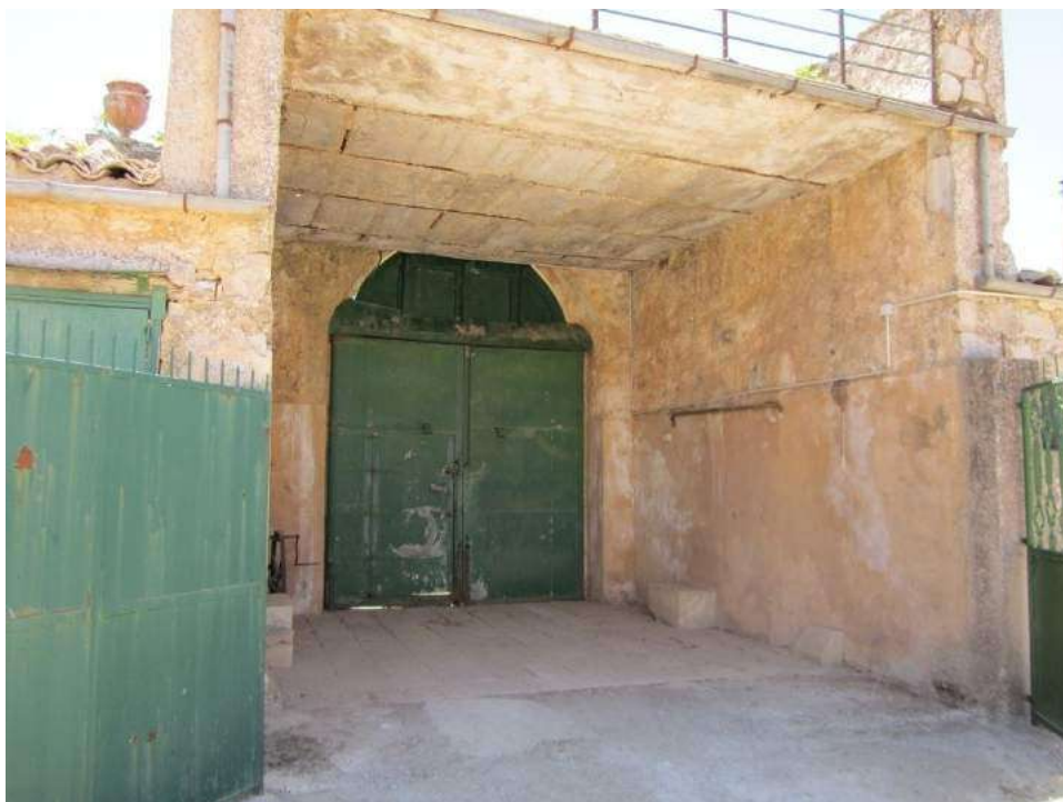
Allegato 5.5: portale in comune con ditta aliena