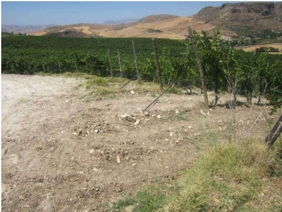
Allegato 5.44: lotto di terreno

(fg 104 part. 229 Corleone e fg 16 partt. 184-279-280-281 Campofiorito)