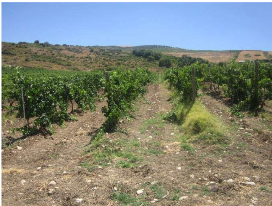
Allegato 5.47: lotto di terreno

(fg 104 part. 229 Corleone e fg 16 partt. 184-279-280-281 Campofiorito)