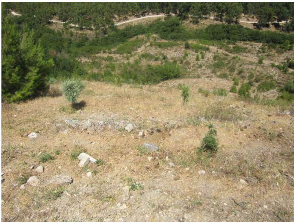
Allegato 5.40: lotto di terreno

(fg 104 part. 229 Corleone e fg 16 partt. 184-279-280-281 Campofiorito)