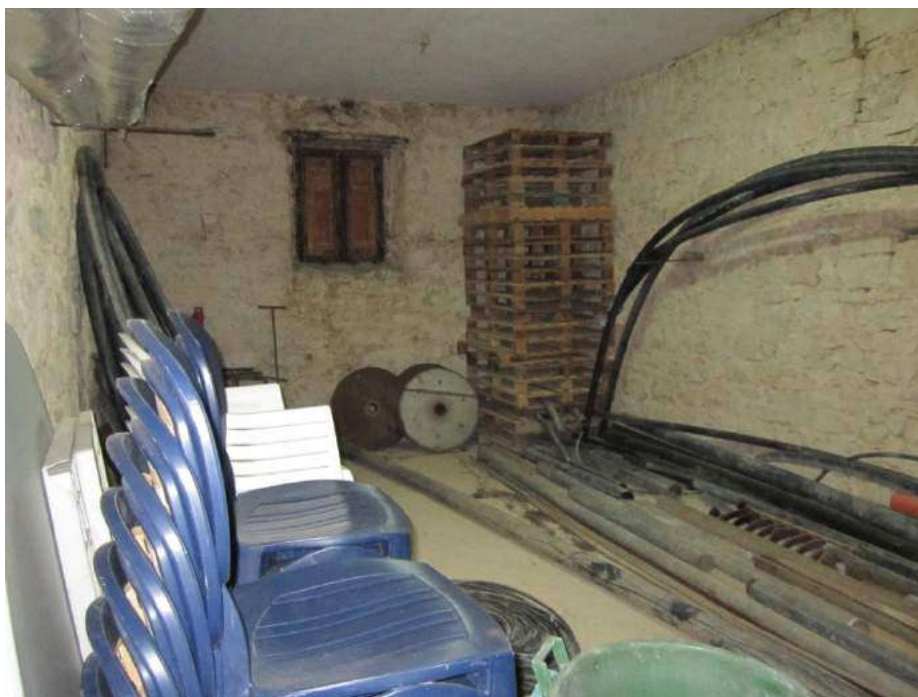
Allegato 5.17: locale adibito a magazzino