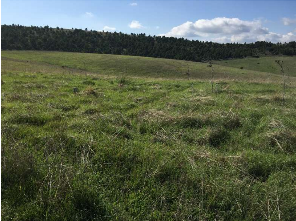
Allegato 13.13: Lotto composto dalle partt. 25-64-67-102-117-118-119-120 (fg. 107)