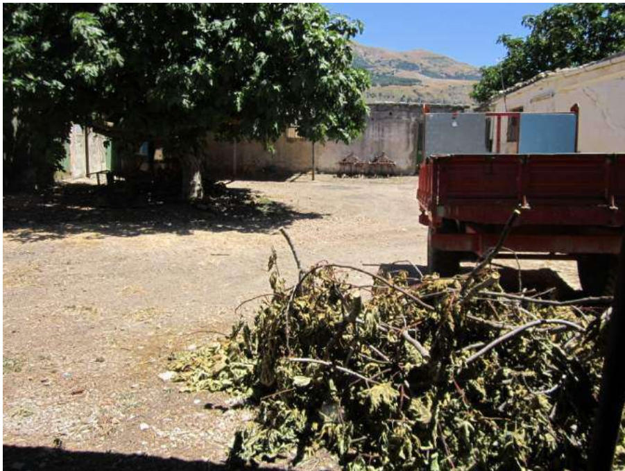
Allegato 5.24: corte secondaria