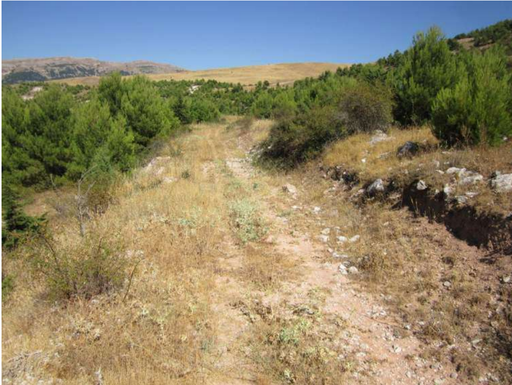
Allegato 5.69: lotto di terreno (fg 107 Corleone part. 23 e 260)