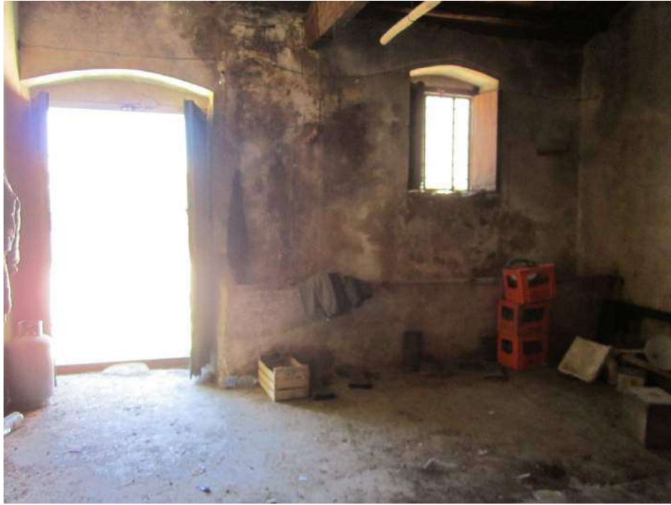
Allegato 5.21: ex locale di deposito