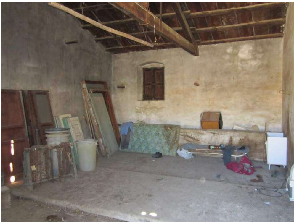
Allegato 5.19: ex stalla