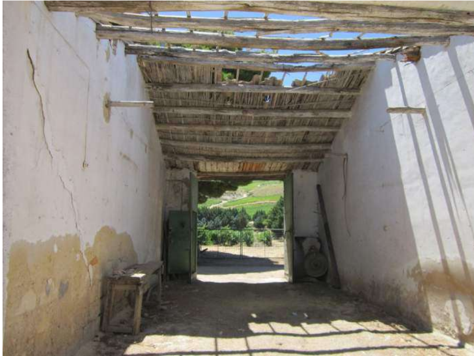
Allegato 5.23: ingresso alla corte secondaria