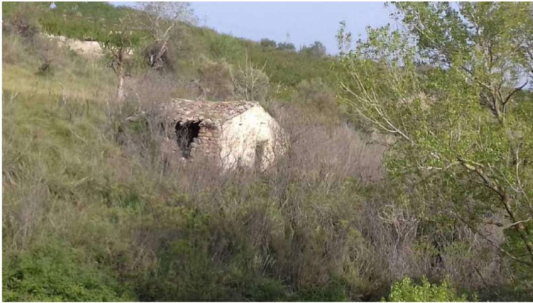
Allegato 5.49: edificio rurale (part. 442 fg 16 Campofiorito)