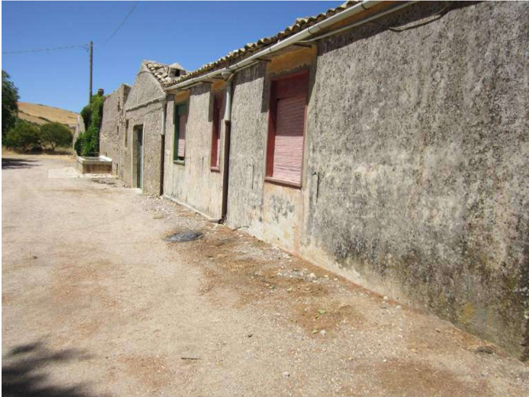
Allegato 5.3: viale di accesso