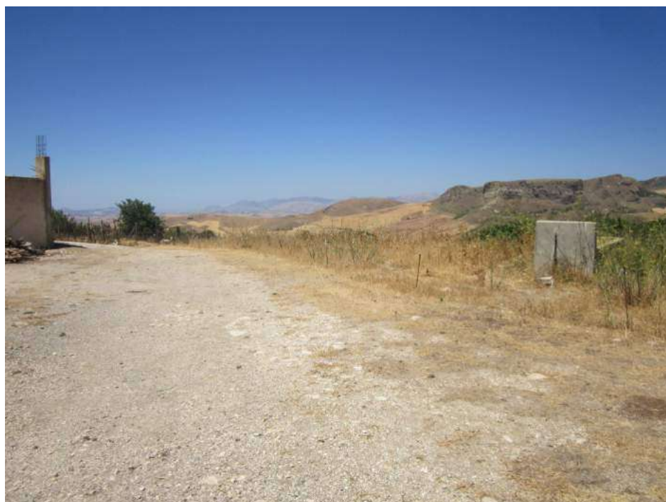
Allegato 5.38: spazio attorno al bene (corte di pertinenza)