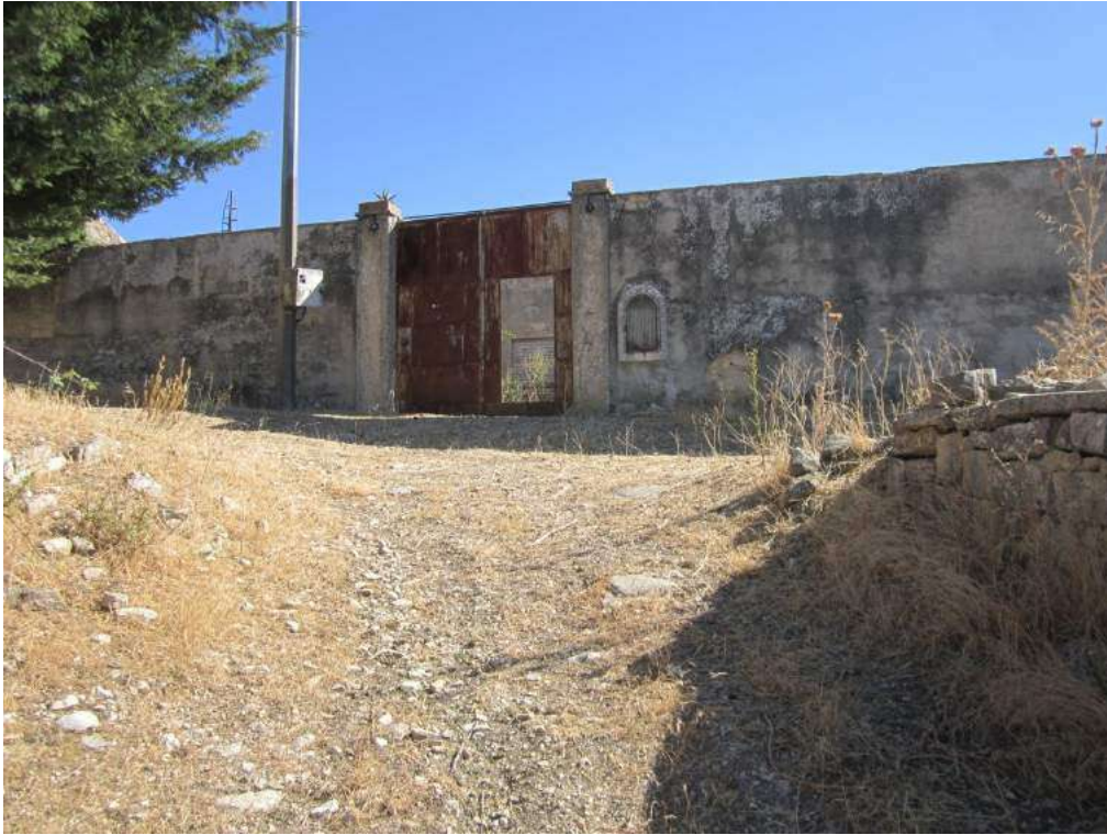
Allegato 5.51: edificio rurale (fg 107 part. 212 Corleone)