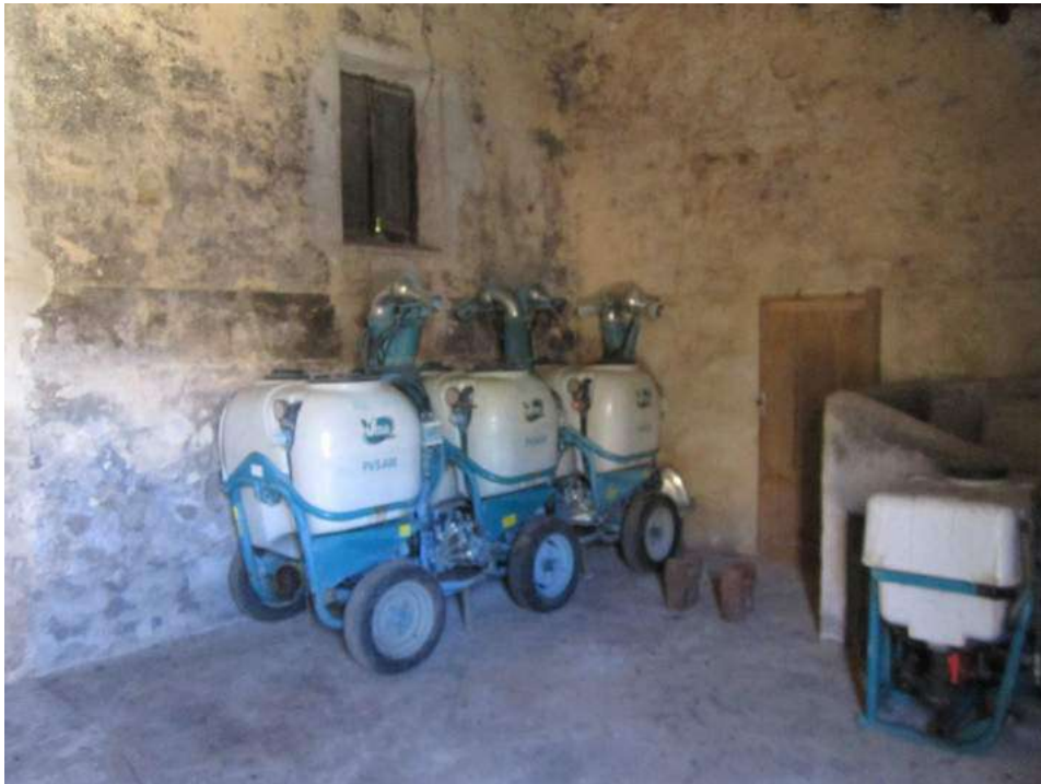
Allegato 5.22: ex locale di deposito