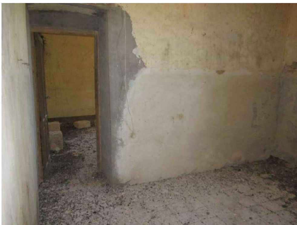
Allegato 5.20: ex locale di deposito