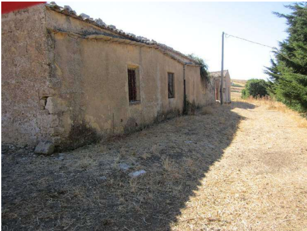
Allegato 5.52: edificio rurale (fg 107 part. 212 Corleone)