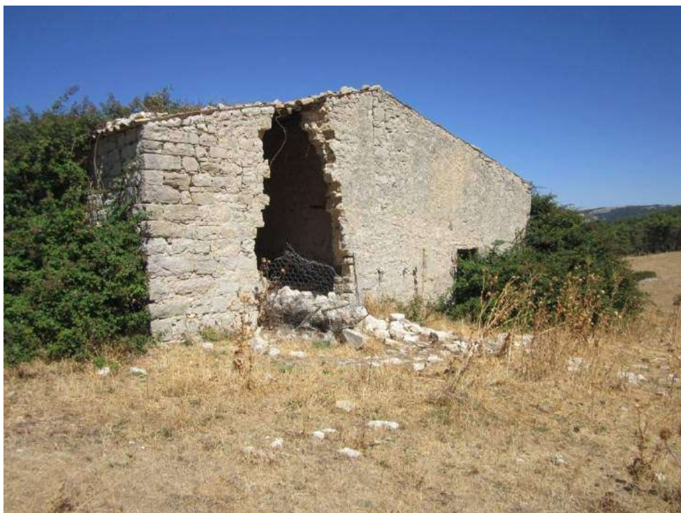
Allegato 5.60: fabbricato rurale (fg 107 Corleone part. 211)