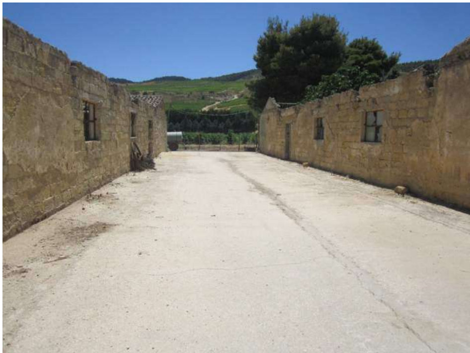
Allegato 5.32: spazio a cielo aperto