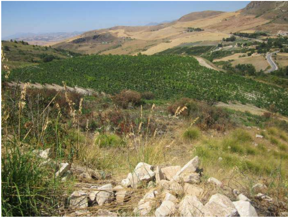
Allegato 5.43: lotto di terreno

(fg 104 part. 229 Corleone e fg 16 partt. 184-279-280-281 Campofiorito)