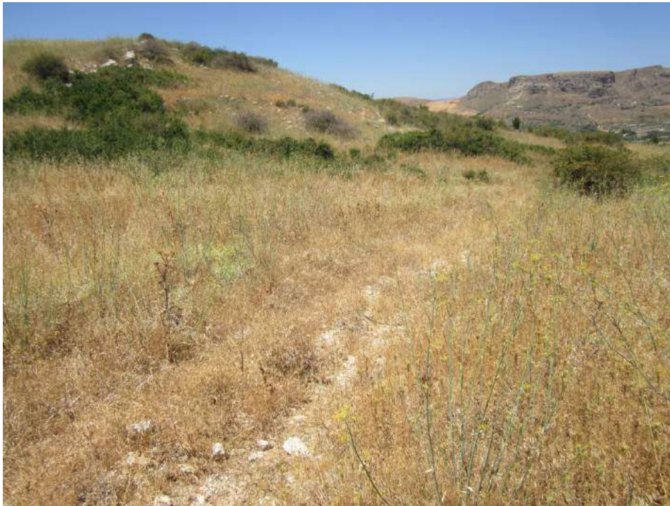
Allegato 5.41: lotto di terreno

(fg 104 part. 229 Corleone e fg 16 partt. 184-279-280-281 Campofiorito)