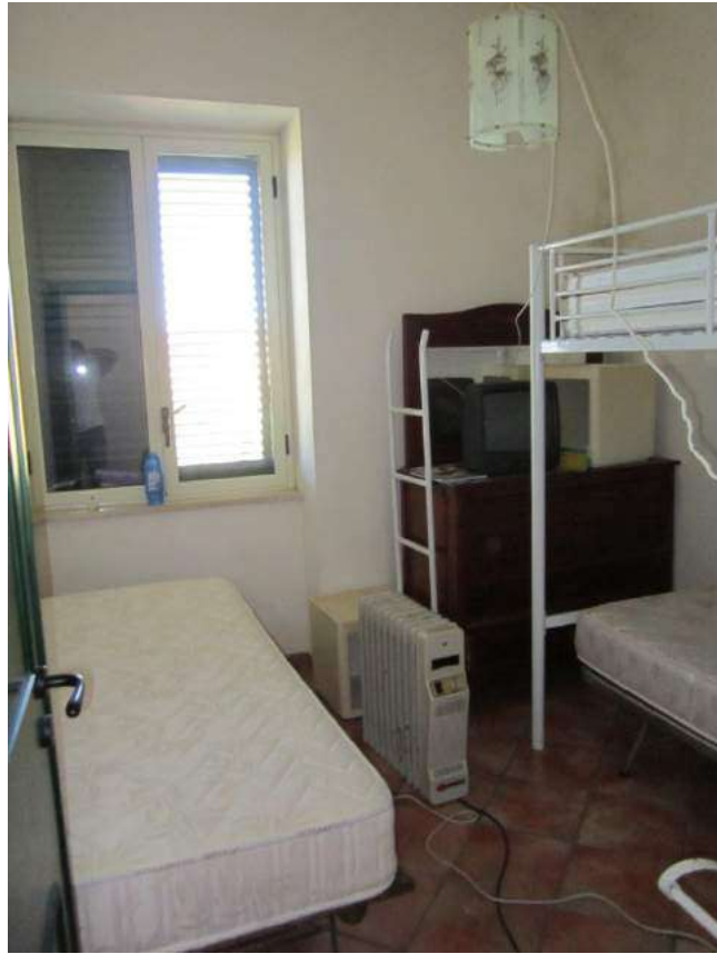
Allegato 5.11: camera