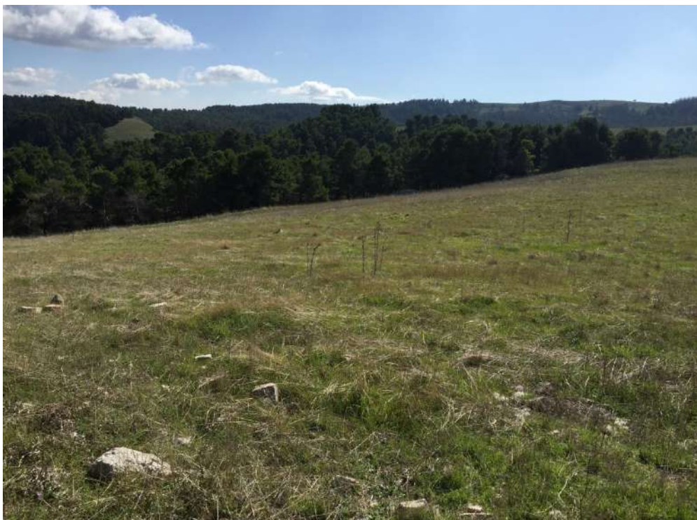
Allegato 13.14: Lotto composto dalle partt. 25-64-67-102-117-118-119-120 (fg. 107)