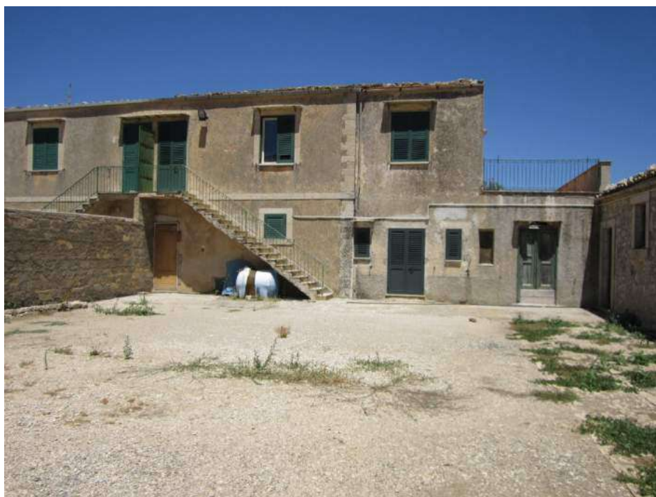
Allegato 5.6: corte principale (ala con residenza)