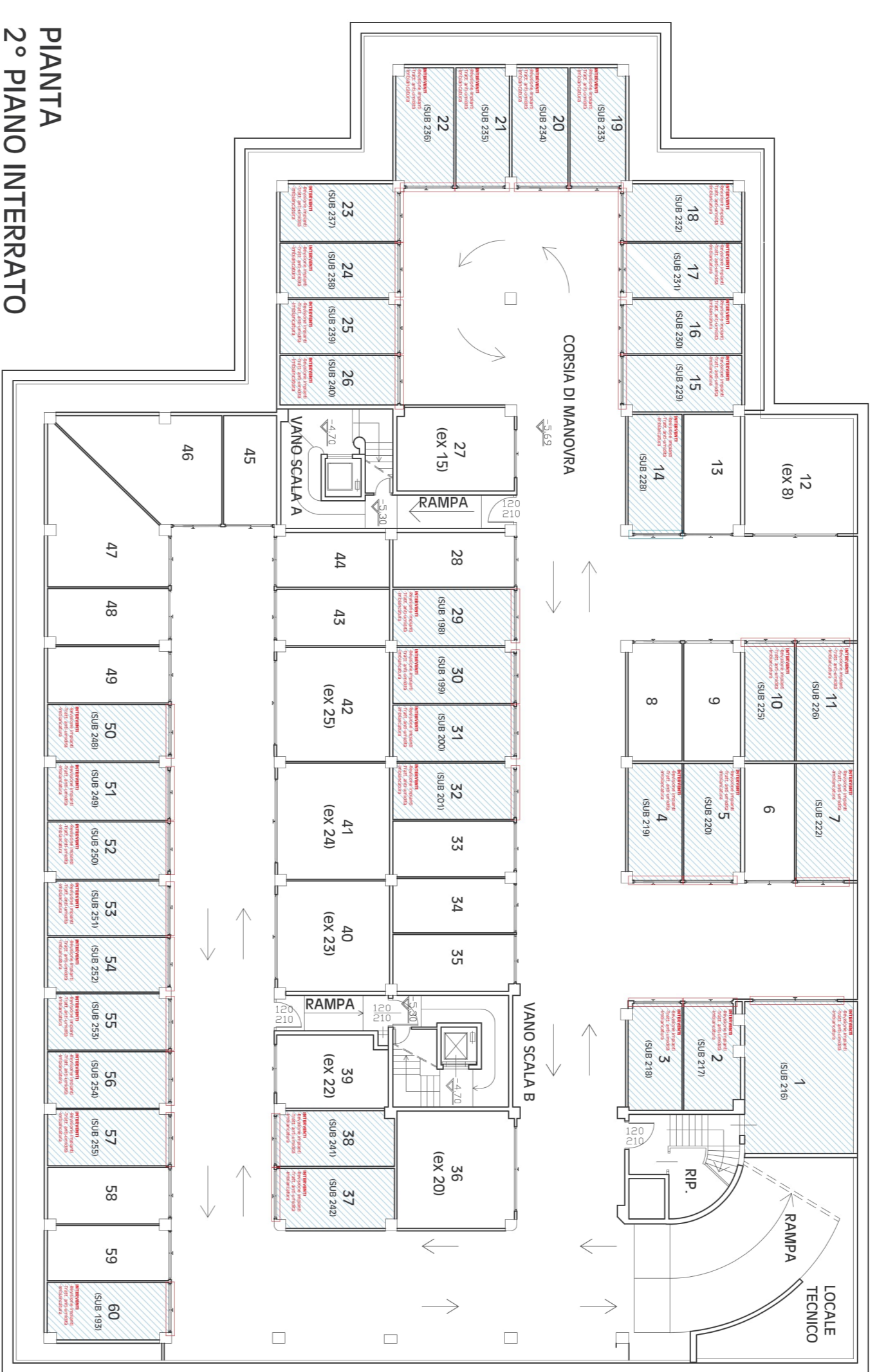
PIANTA 2° PIANO INTERRATO