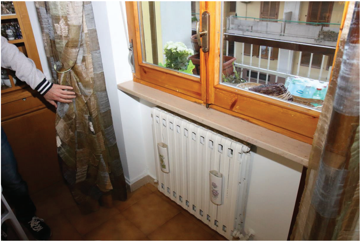
Foto n. 7: Lotto Unico, Pescara, foglio n° 41 particella n° 1780 sub 33, particolare interno del fabbricato.