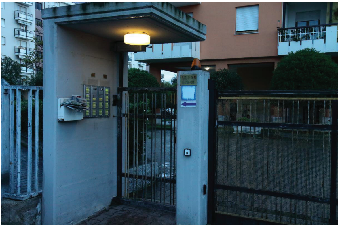
Foto n. 2: Lotto Unico, Pescara, foglio n° 41 particella n° 1780 sub 33, particolare esterno ingresso del fabbricato.