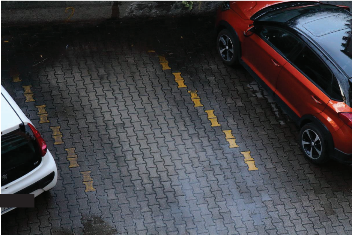
Foto n. 3: Lotto Unico, Pescara, foglio n° 41 particella n° 1780 sub 33, particolare esterno del posto auto.