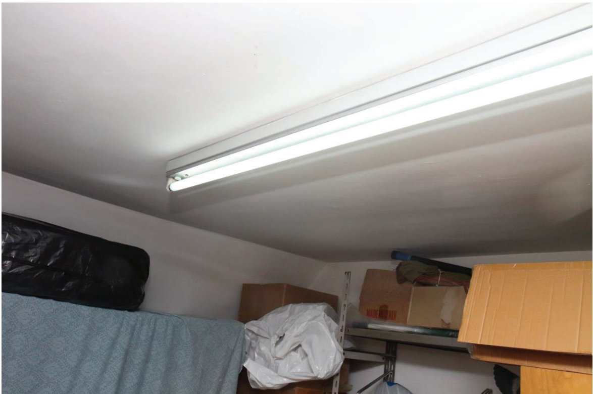
Foto n. 4: Lotto Unico, Pescara, foglio n° 41 particella n° 1780 sub 33, particolare interno del ripostiglio al nono piano.