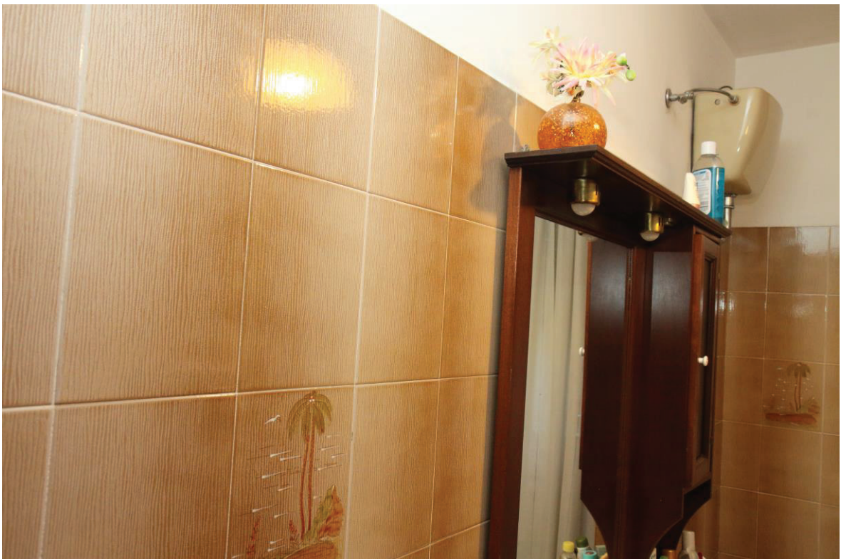
Foto n. 11: Lotto Unico, Pescara, foglio n° 41 particella n° 1780 sub 33, particolare interno del fabbricato.