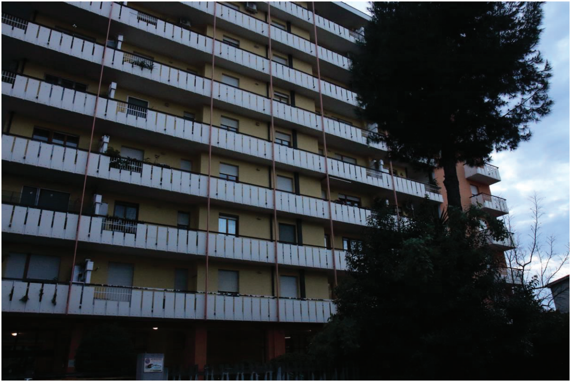
Foto n. 1: Lotto Unico, Pescara, foglio n° 41 particella n° 1780 sub 33, particolare esterno del fabbricato.