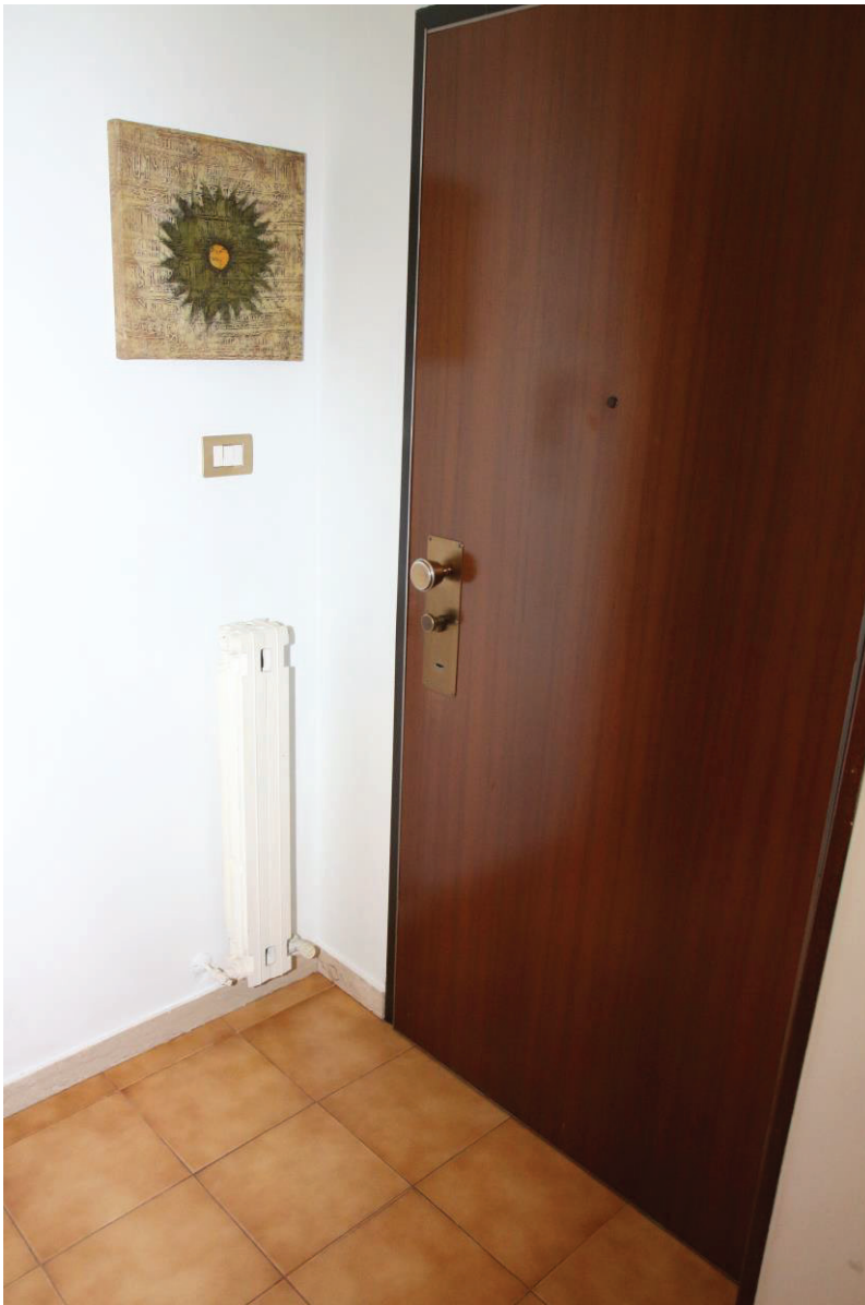
Foto n. 6: Lotto Unico, Pescara, foglio n° 41 particella n° 1780 sub 33, particolare interno del fabbricato.