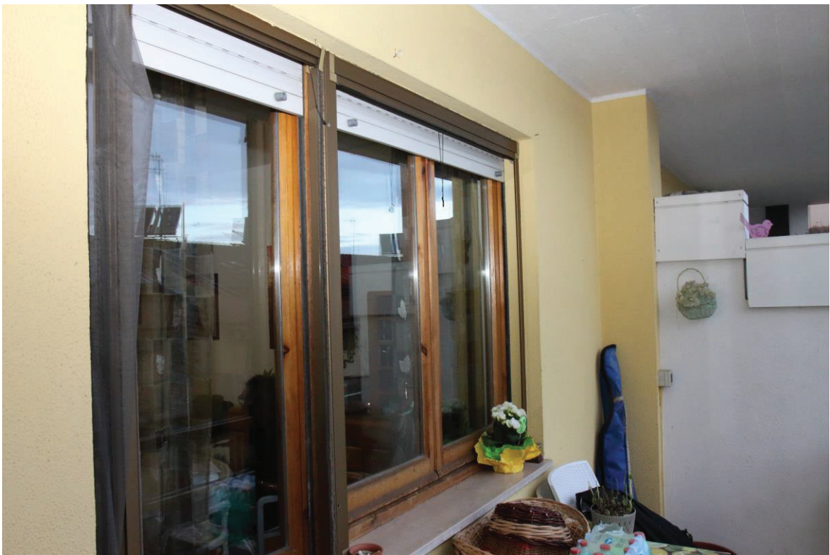
Foto n. 8: Lotto Unico, Pescara, foglio n° 41 particella n° 1780 sub 33, particolare esterno del fabbricato.