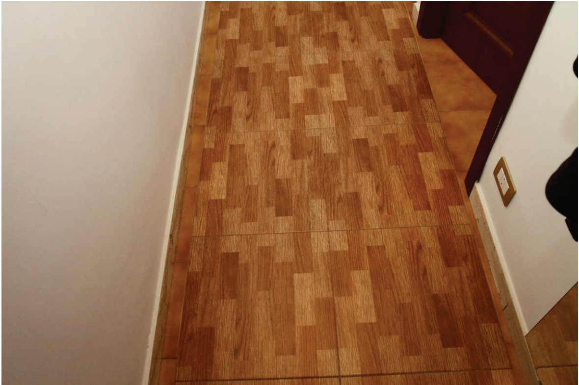
Foto n. 10: Lotto Unico, Pescara, foglio n° 41 particella n° 1780 sub 33, particolare interno del fabbricato.