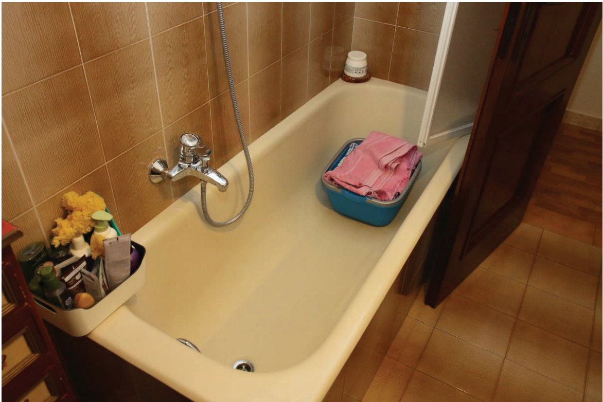
Foto n. 12: Lotto Unico, Pescara, foglio n° 41 particella n° 1780 sub 33, particolare interno del fabbricato.