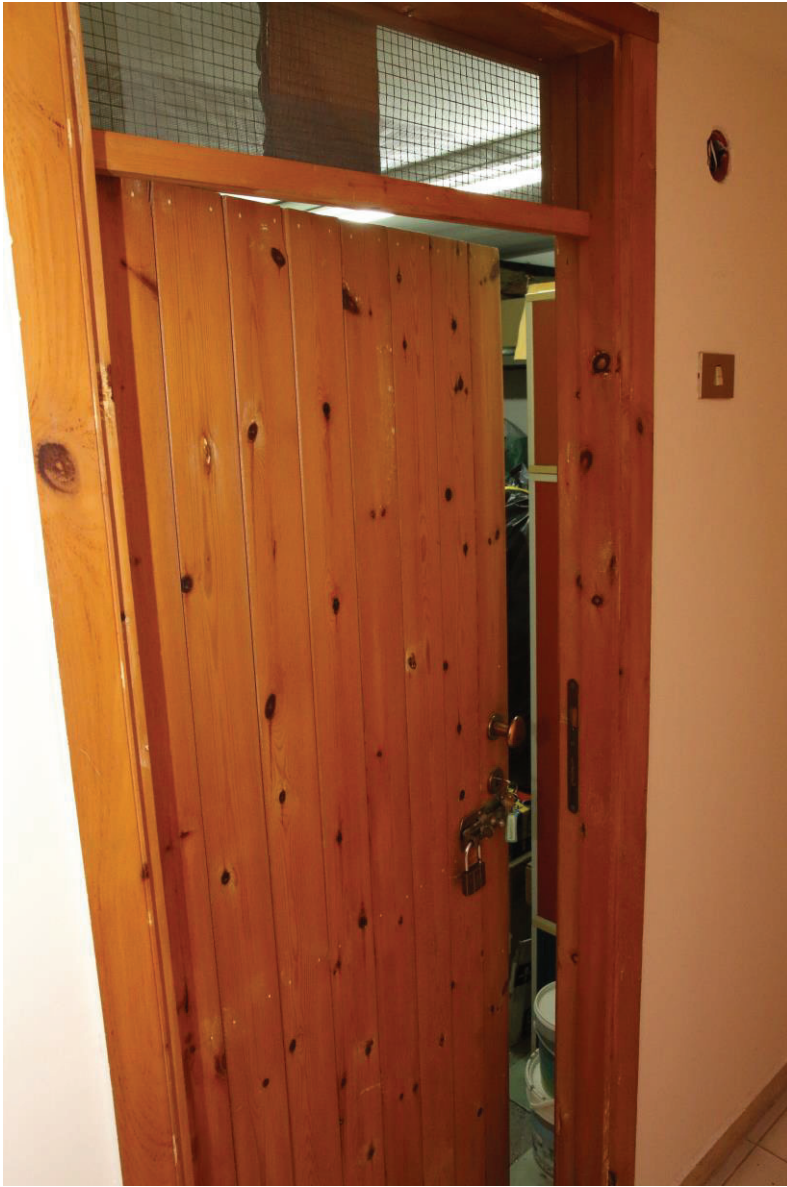
Foto n. 5: Lotto Unico, Pescara, foglio n° 41 particella n° 1780 sub 33, particolare interno del ripostiglio al nono piano.