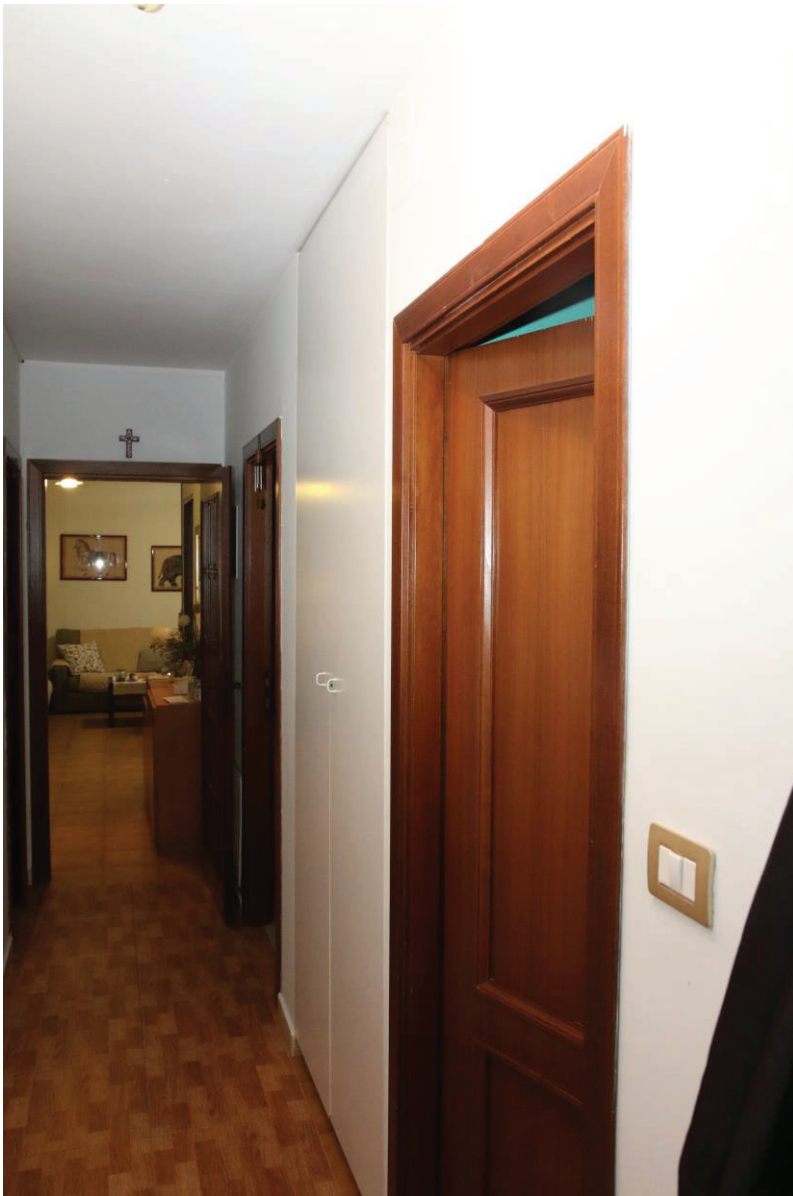
Foto n. 9: Lotto Unico, Pescara, foglio n° 41 particella n° 1780 sub 33, particolare interno del fabbricato.