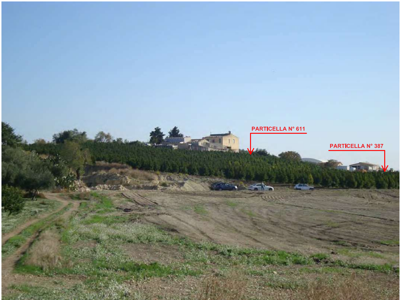
Terreni in Naro Fg. 191 part. 611 (ex 454) e 387 - Coltura Pescheto