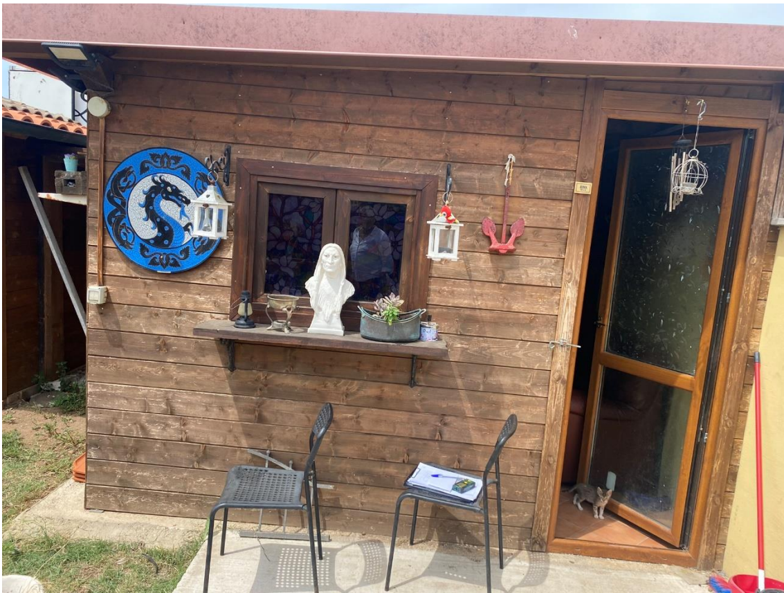
Foto 8 _ Vista esterna _ Edificio G4