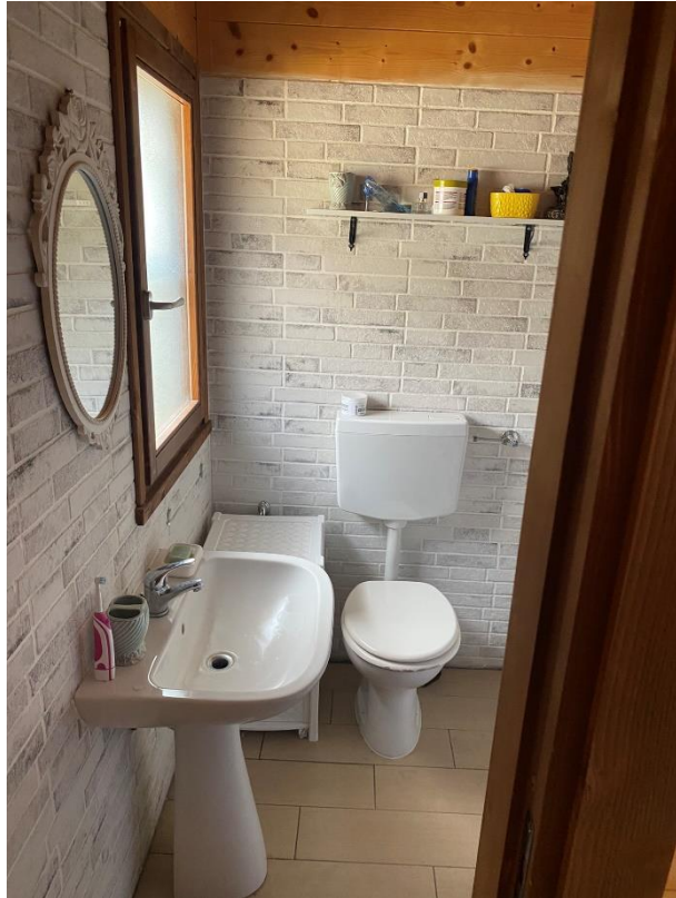
Foto 7 _ Vista interna _ Edificio G1