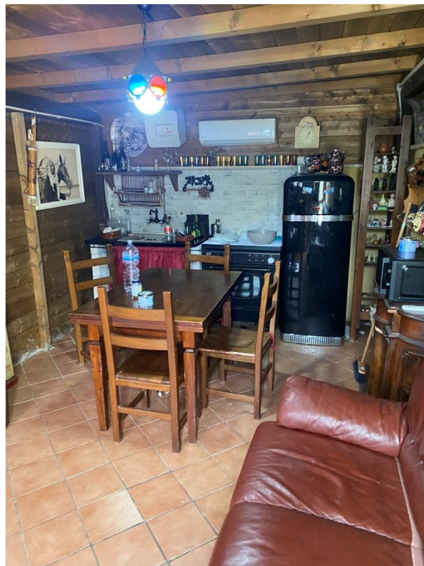
Foto 10 _ Vista interna _ Edificio G4