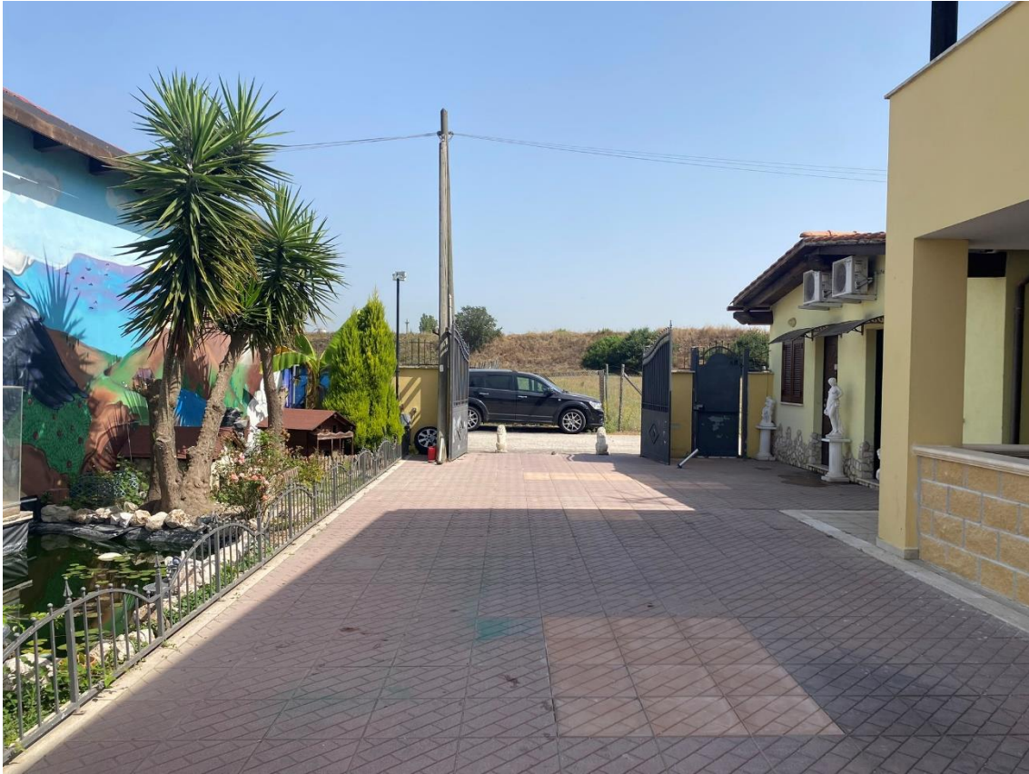
Foto 1 _ Vista esterna