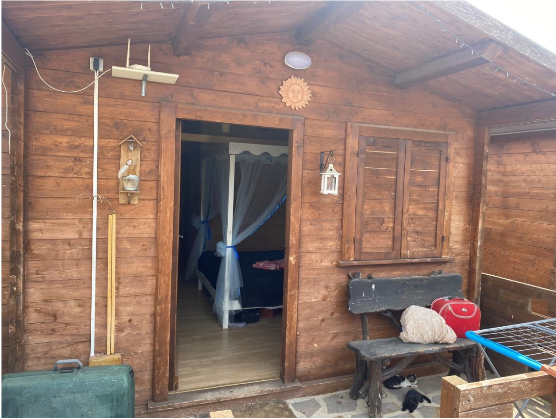
Foto 5 _ Vista esterna _ Edificio G1