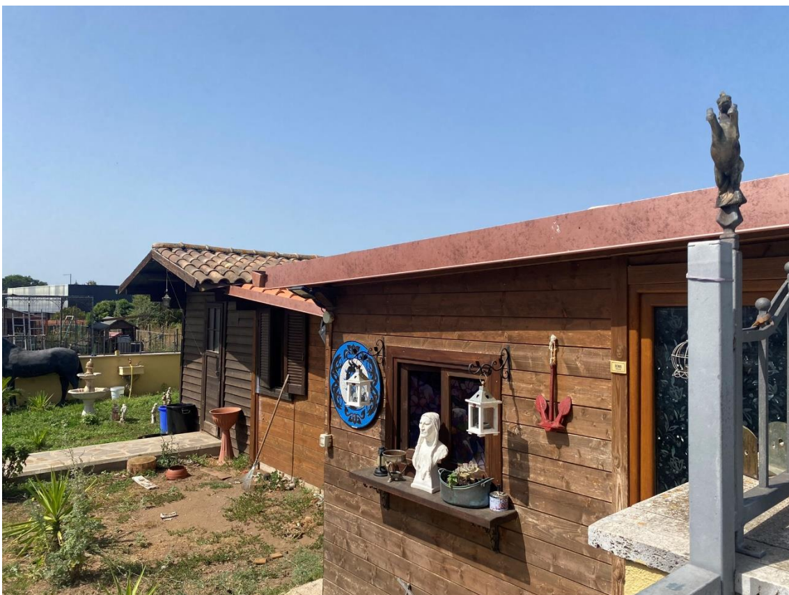
Foto 4 _ Vista esterna _ Edificio G4