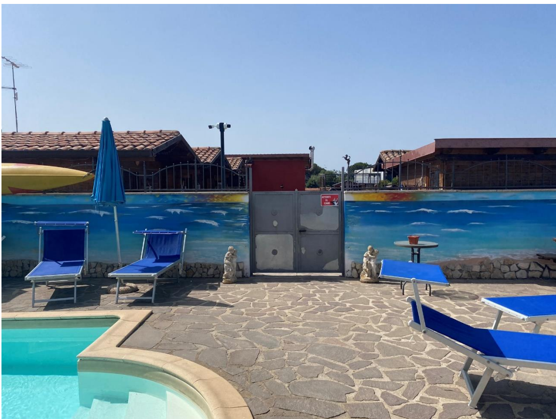
Foto 2 _ Vista esterna