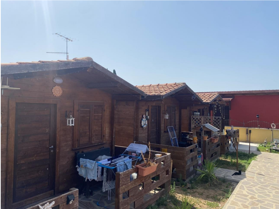
Foto 3 _ Vista esterna _ Edificio G1