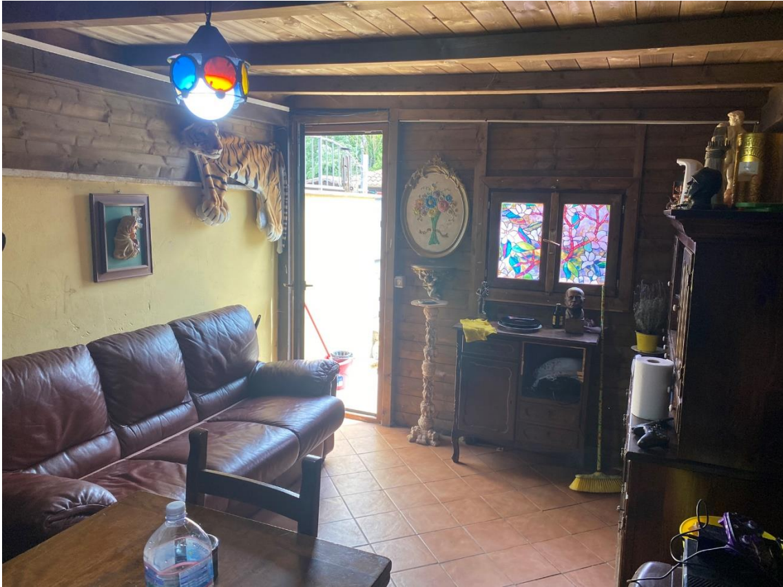
Foto 9 _ Vista interna _ Edificio G4