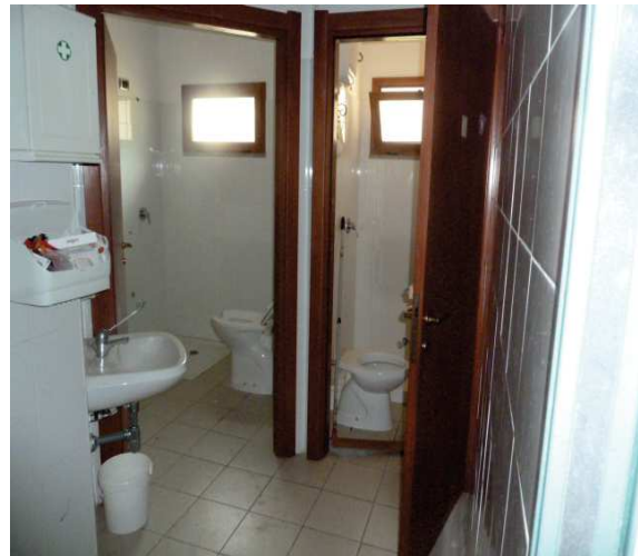
Foto n. 24 bagno personale