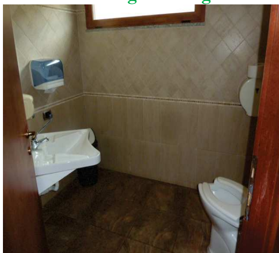
Foto n. 17 bagno 1