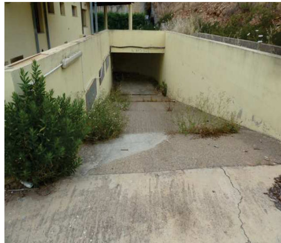
Foto n. 32 rampa carrabile