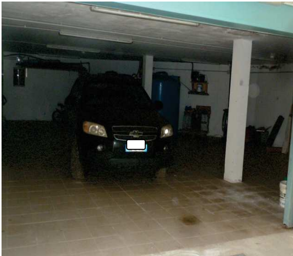
Foto n. 37 garage