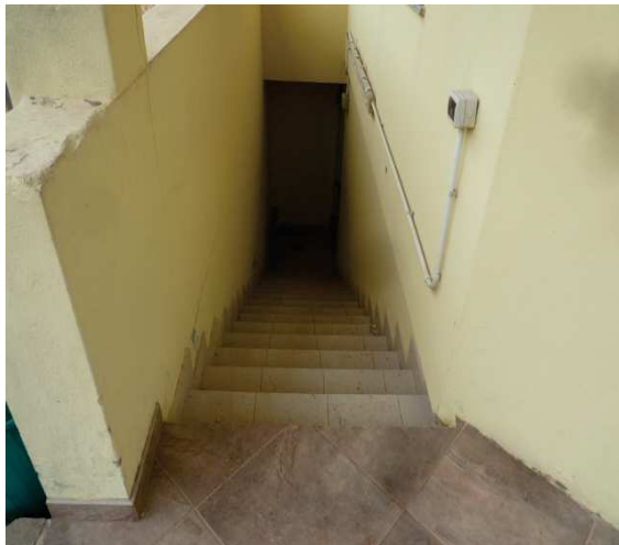
Foto n. 31 scale esterne

Nel solaio del garage sono presenti tracce di umidità che provengono dalla terrazza del piano terra (foto n. 41-42).