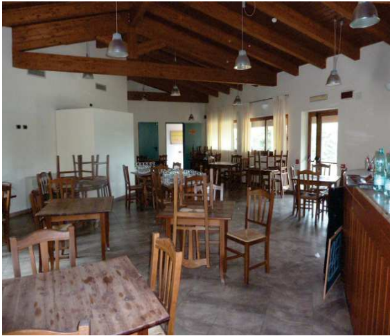
Foto n. 5 copertura sala