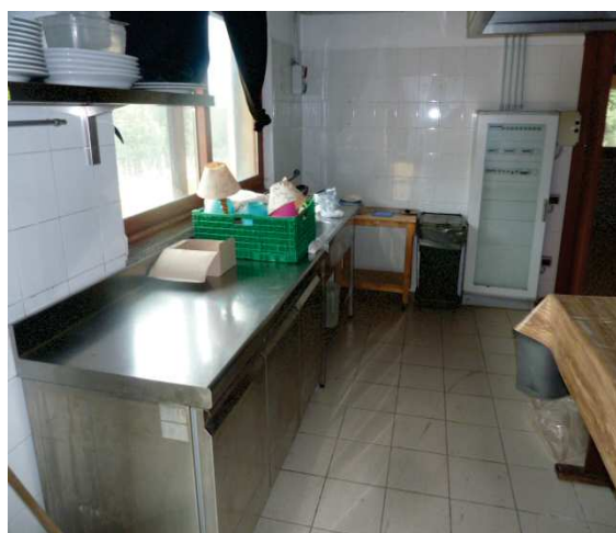
Foto n. 19 cucina