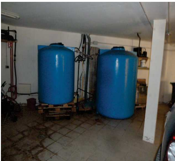
Foto n. 39 garage