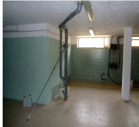
Foto n. 8 solaio piano interrato

Gli infissi esterni sono realizzati in PVC, e non in alluminio anodizzato esternamente ed in legno nella parte interna in rispetto alla relazione tecnica di progetto, e sono ultimati con vetrocamera con vetro mentre le porte per lo scarico delle merci sono antincendio. Gli infissi interni sono in legno tamburato e porte antincendio per la protezione della sala ristorante.