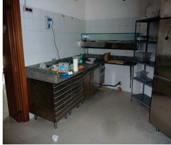
Foto n. 22 pizzeria