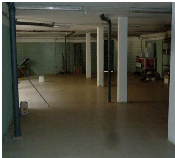
Foto n. 33 deposito