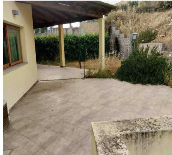
Foto n. 28 veranda

Il giardino è piantumato con piante e fiori e vegetazione tipica della macchia mediterranea. Attualmente è incolto e sono presenti erbacce e arbusti spontanei. Nella parte terrazzata è stata realizzata una zona probabilmente per permettere alla clientela di sfruttare gli spazi aperti (foto n. 29-30).