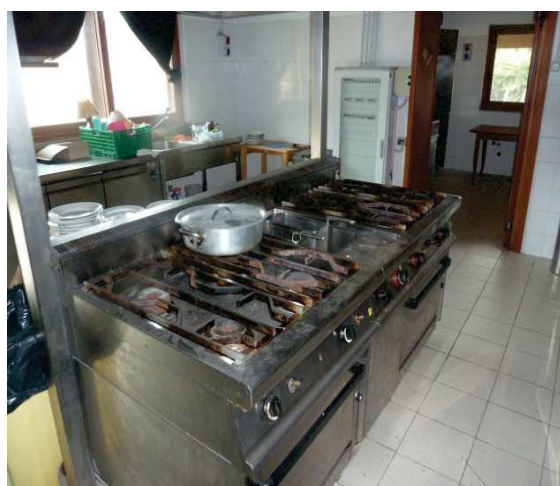
Foto n. 20 cucina