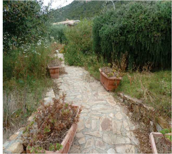
Foto n. 10 vialetto