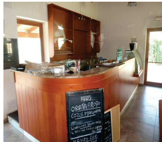
Foto n. 14 area bar