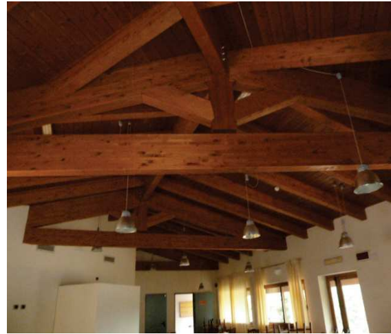
Foto n. 6 copertura interna