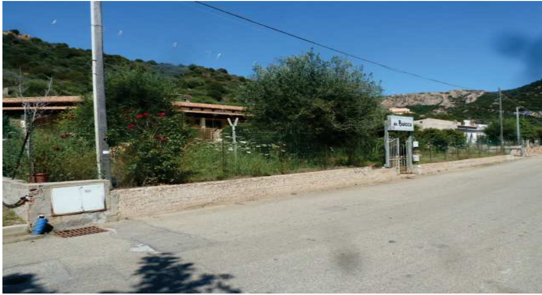
Foto n. 1 vista dalla via Pascoli