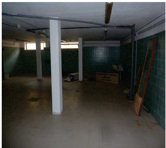
Foto n. 34 deposito