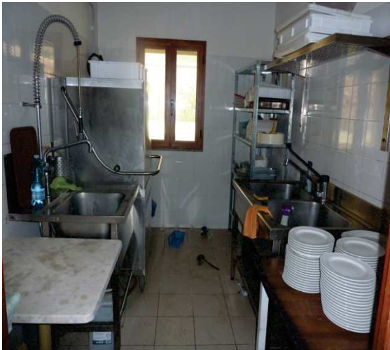
Foto n. 23 lavaggio