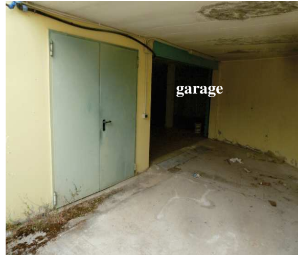
Foto n. 36 vano tecnico e garage