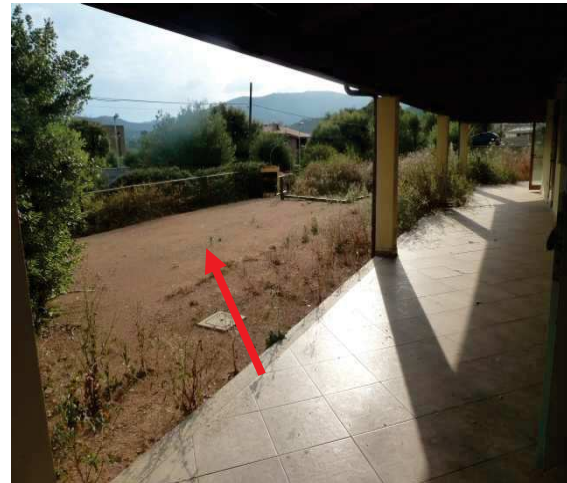
Foto n. 30 terrapieno

Al piano interrato si accede dalle scale esterne e dalla rampa carrabile (quest'ultima ricade su altra proprietà)(foto n. 31-32).