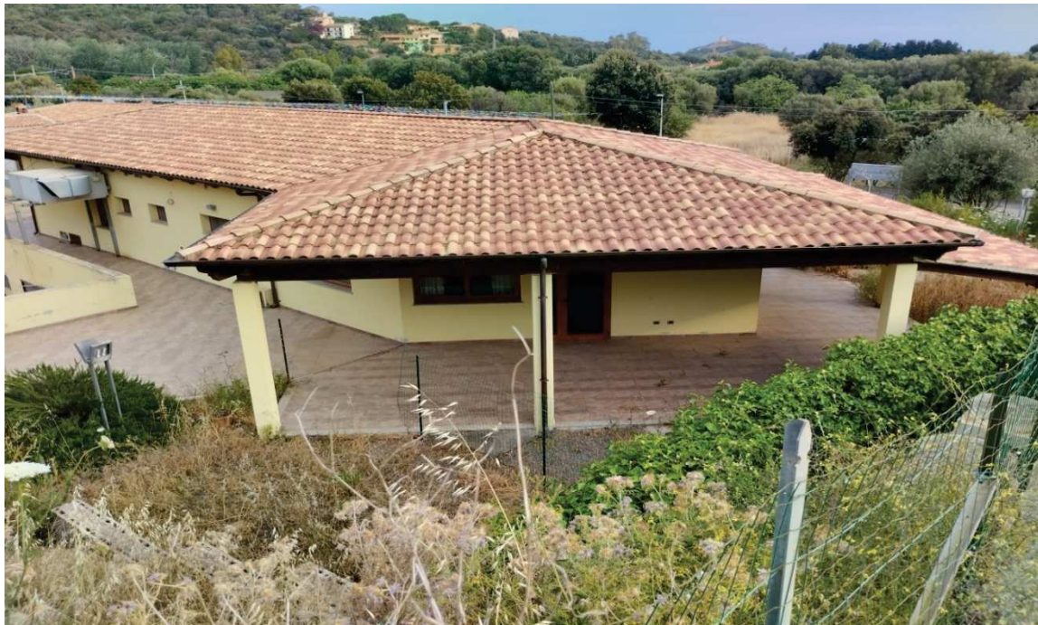
Foto n. 4 Copertura del fabbricato

La copertura del fabbricato è in legno a falde inclinate che poggiano su capriate a vista esteticamente gradevoli. La parte esterna è ultimata con tegole anticate (foto n. 4-5-6-7-8). I servizi interni (cucina, pizzeria, area lavaggio e bagno) sono controsoffittati con lastre di fibra minerale.