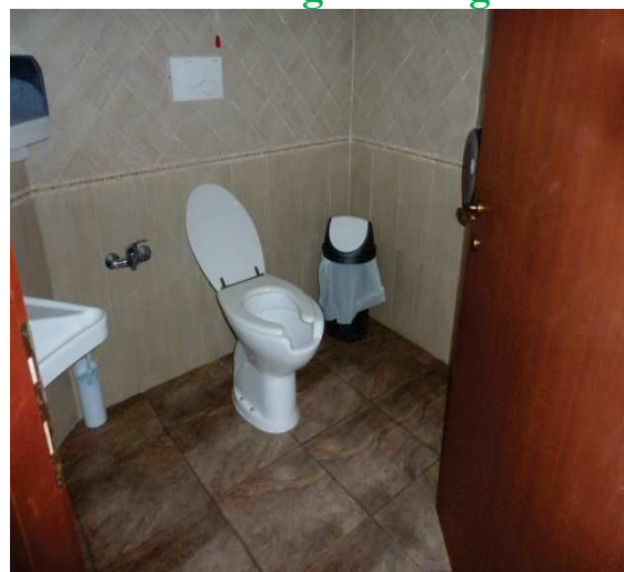
Foto n. 18 bagno 2