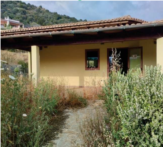
Foto n. 11 veranda e ingresso