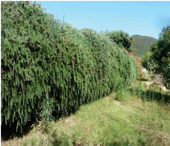
Foto n. 29 rosmarino coprente il muro

Il giardino è piantumato con piante e fiori e vegetazione tipica della macchia mediterranea. Attualmente è incolto e sono presenti erbacce e arbusti spontanei. Nella parte terrazzata è stata realizzata una zona probabilmente per permettere alla clientela di sfruttare gli spazi aperti (foto n. 29-30).