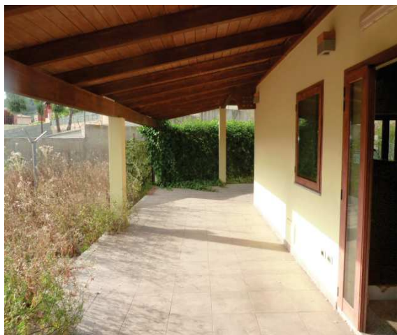
Foto n. 25 veranda