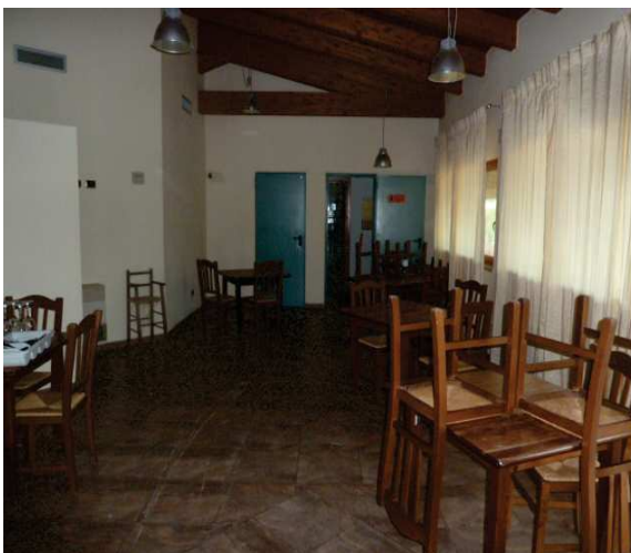
Foto n. 13 sala ristorante