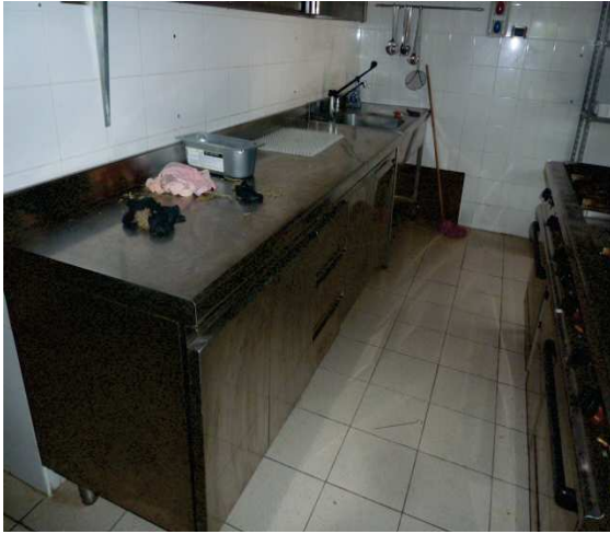
Foto n. 21 cucina