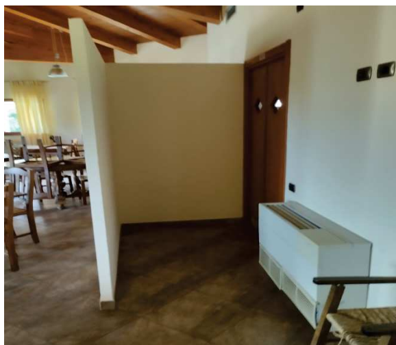
Foto n. 15 ingresso bagni