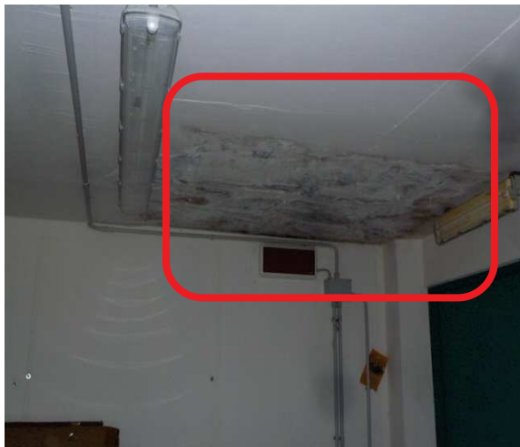
Foto n. 41 infiltrazioni garage