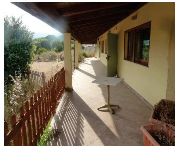
Foto n. 26 veranda