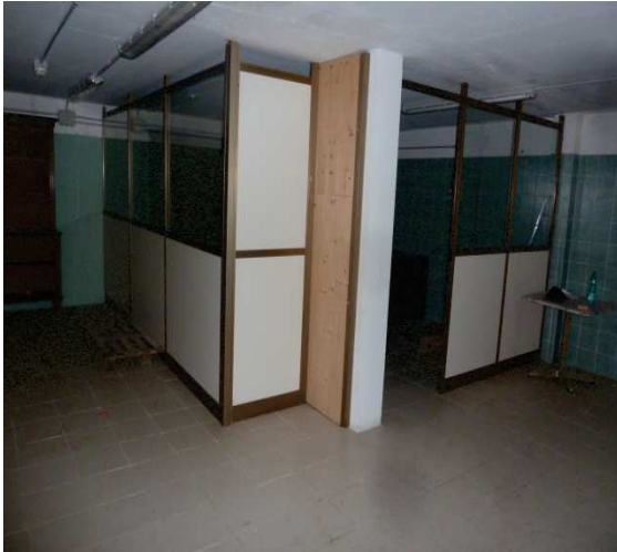
Foto n. 35 vano deposito