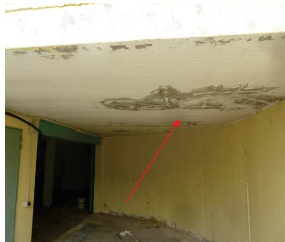
Foto n. 42 infiltrazioni lato garage