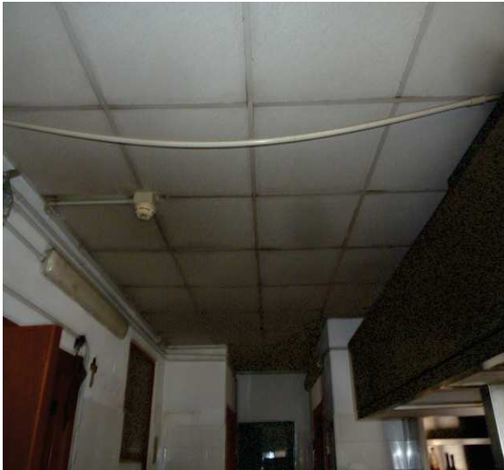
Foto n. 7 copertura cucina