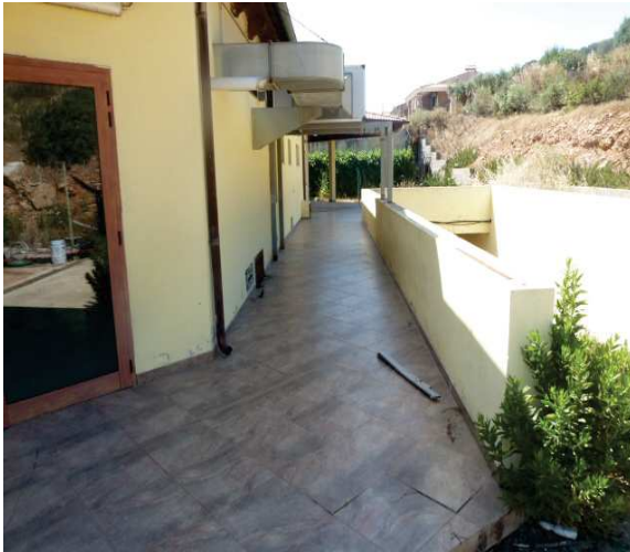
Foto n. 27 veranda