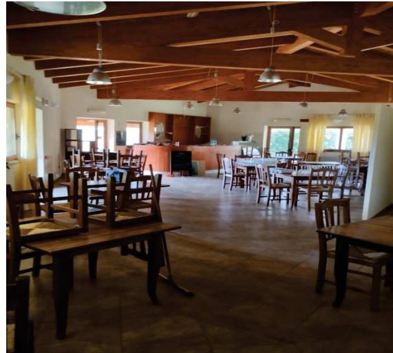
Foto n. 12 sala ristorante