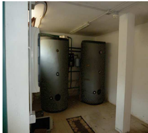
Foto n. 40 vano tecnico