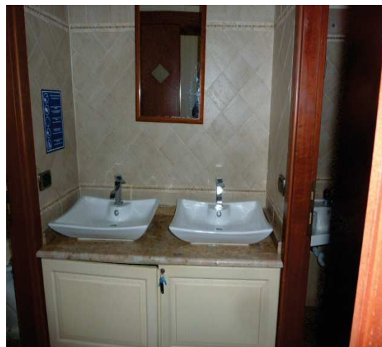
Foto n. 16 ingresso bagni