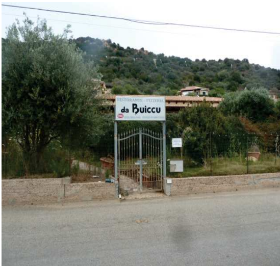
Foto n. 2 Ingresso pedonale