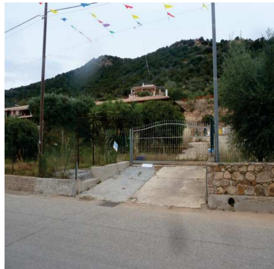
Foto n. 3 ingresso carraiato

Il fabbricato è articolato su due livelli di cui uno interrato e la costruzione è recente ed è stata edificata in opera con su fondazioni in calcestruzzo armato e la struttura in elevazione è realizzata presumibilmente con blocchi di calcestruzzo alveolati ultimati con intonaco e tinteggiatura.