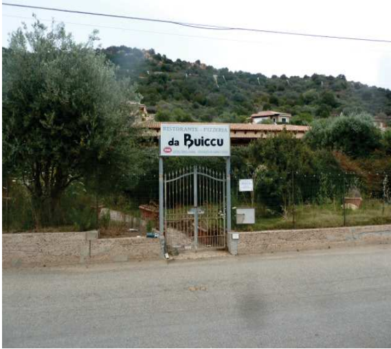
Foto n. 9 ingresso via Pascoli