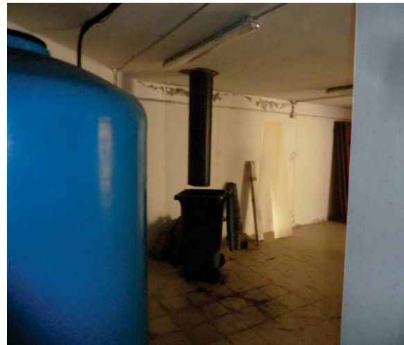
Foto n. 38 garage