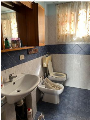
Vista interna – Piano terra – Servizio igienico