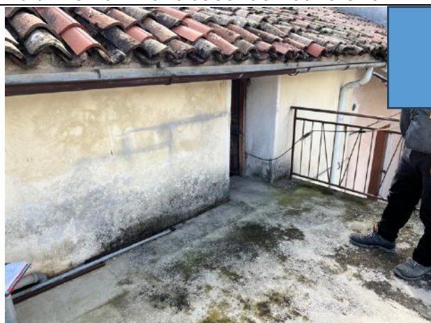
Vista interna – Piano Secondo – Porta accesso alla terrazza da sottotetto