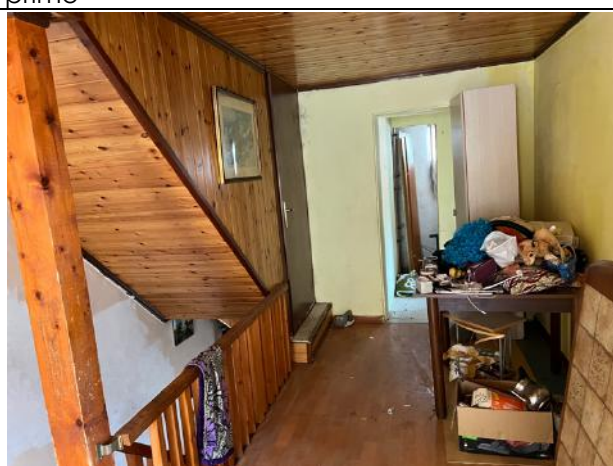
Vista interna – Piano Primo – Corridoio