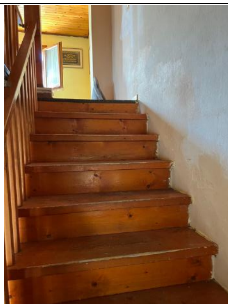
Vista interna – Piano Terra – Scala verso piano primo