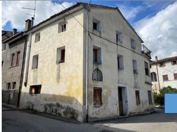
Vista esterna – Prospetto Est, su via Rialto e Prospetto Sud su via S.Giorgio