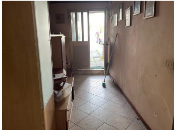
Vista interna – Piano terra – Ingresso da area esterna di pertinenza