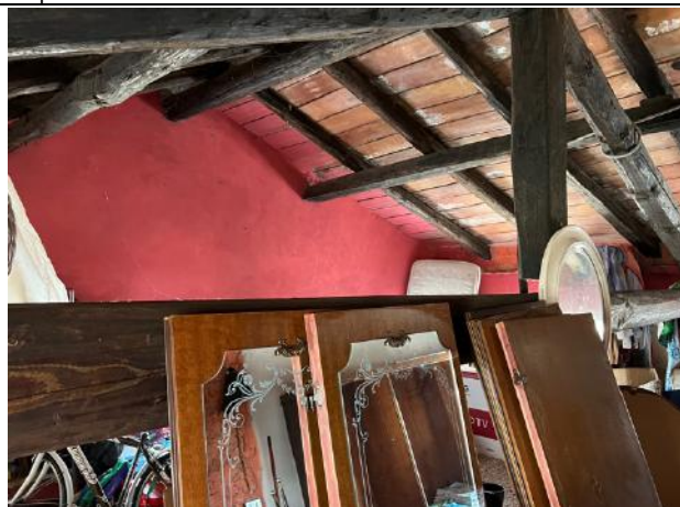
Vista interna – Piano Secondo – Sottotetto