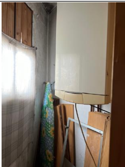
Vista interna – Piano Primo – Locale Centrale Termica