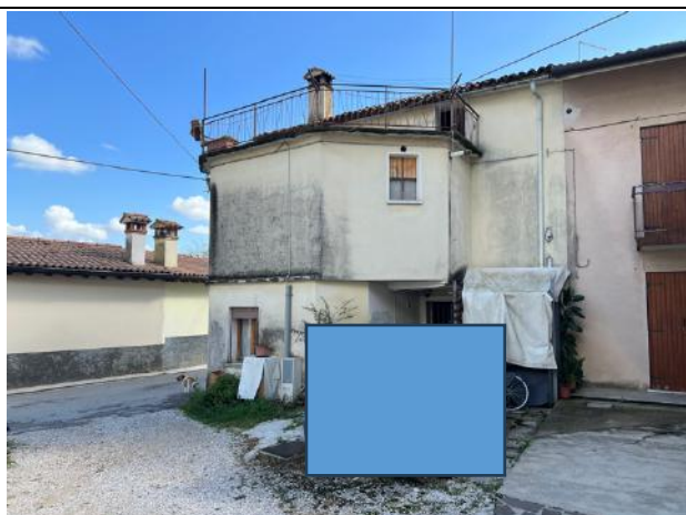
Vista esterna – Prospetto Nord su area pertinenza