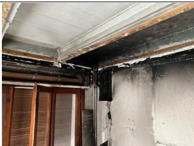
Vista interna – Piano Terra – Cucina (Zona contatore elettrico incendiato)