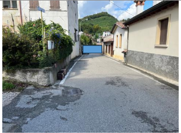
Vista esterna – Via Rialto