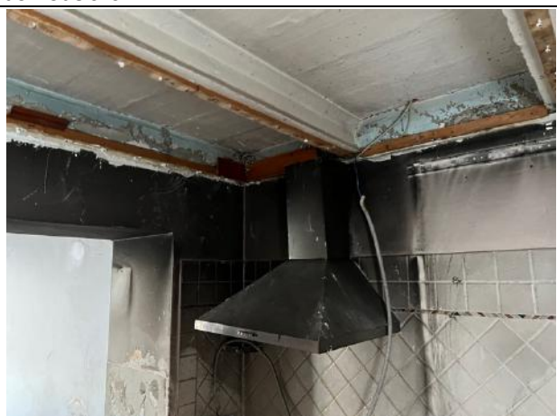
Vista interna – Piano terra - Cucina