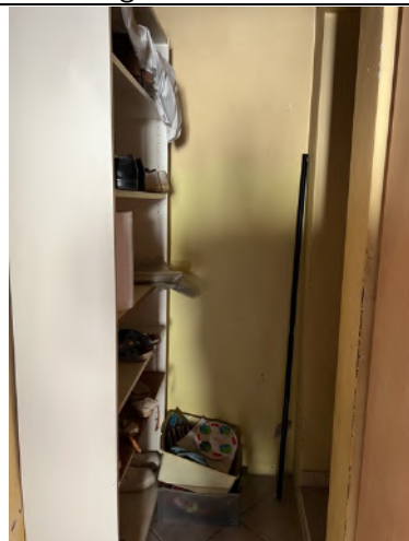
Vista interna – Piano terra – Ingresso verso sottoscala