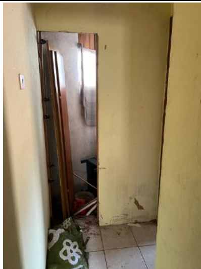
Vista interna – Piano Primo – Disimpegno