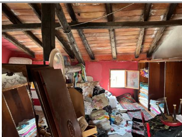
Vista interna – Piano Secondo – Sottotetto