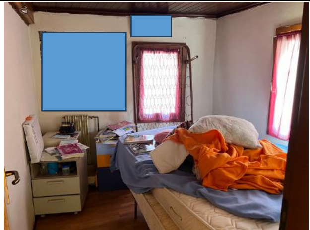
Vista interna – Piano Primo – Camera singola