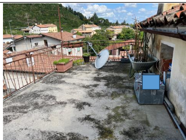
Vista interna – Piano Secondo – Terrazza