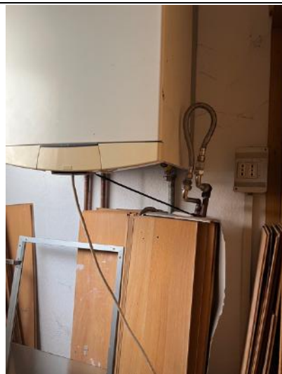
Vista interna – Piano Primo – Locale Centrale Termica (modifica impianto)