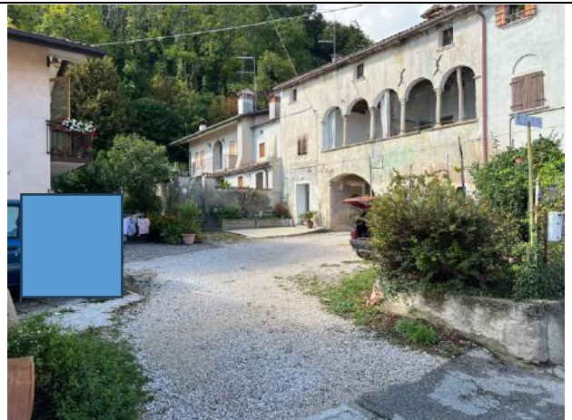
Vista esterna – Area esterna di pertinenza (gravata da servitù di passaggio)