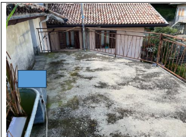
Vista interna – Piano Secondo – Terrazza