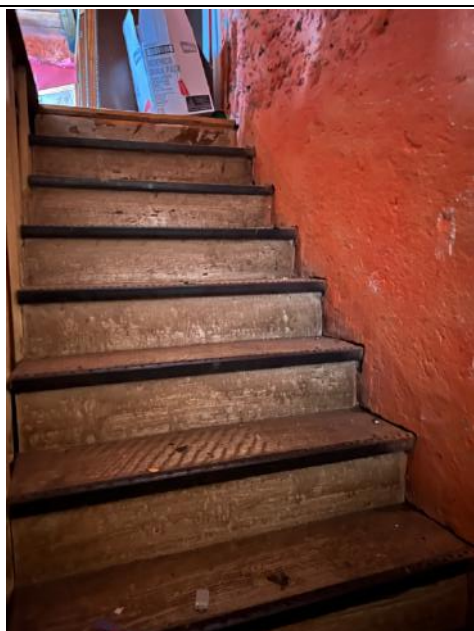
Vista interna – Piano Primo – Scala verso piano secondo