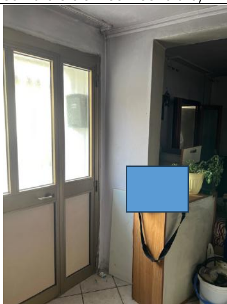
Vista interna – Piano Terra – Soggiorno-Ingresso da Via Rialto