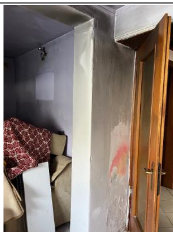
Vista interna – Piano Terra – Soggiorno