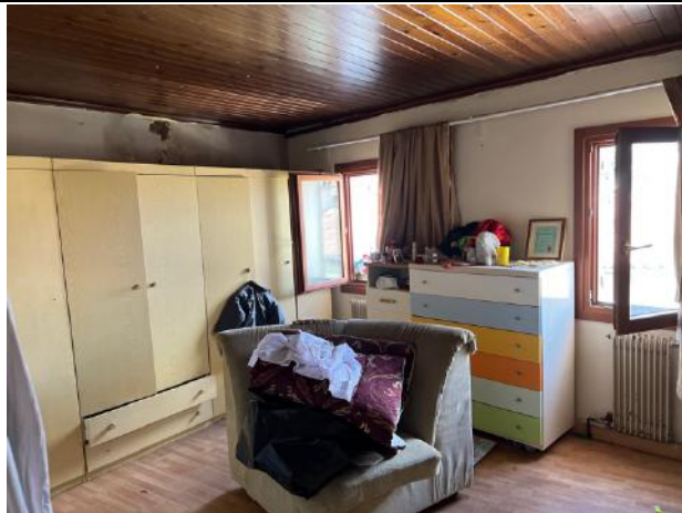
Vista interna – Piano Primo – Camera doppia