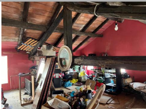
Vista interna – Piano Secondo – Sottotetto