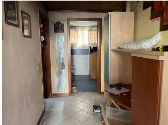
Vista interna – Piano terra – Ingresso verso servizio igienico