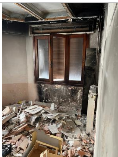
Vista interna – Piano terra - Cucina