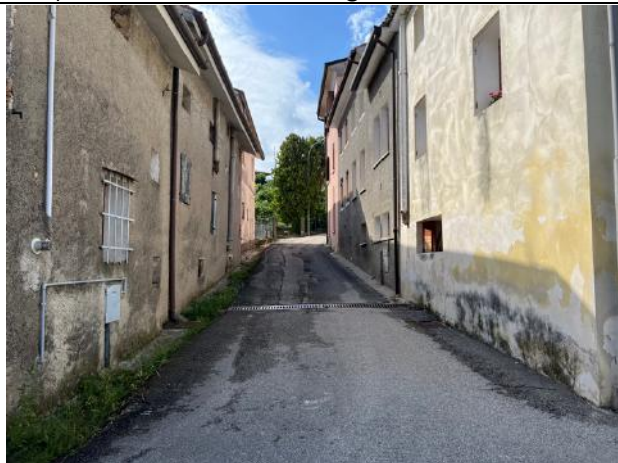
Vista esterna – Via S.Giorgio