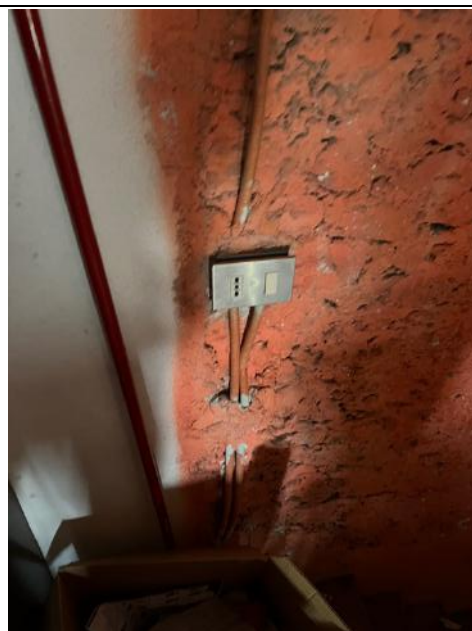
Vista interna – Piano Secondo – Particolare impianto elettrico