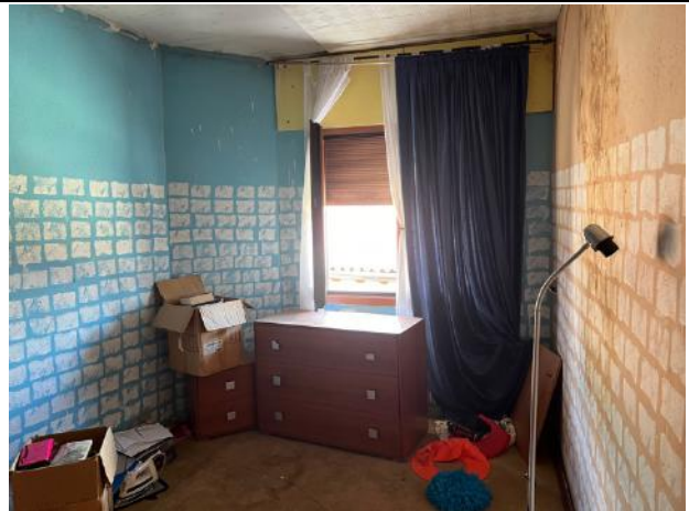
Vista interna – Piano Primo – Camera singola