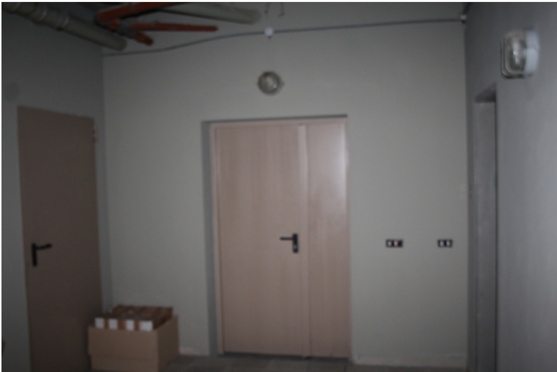
ingresso deposito piano seminterrato