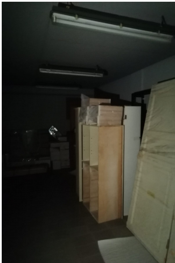
deposito piano seminterrato