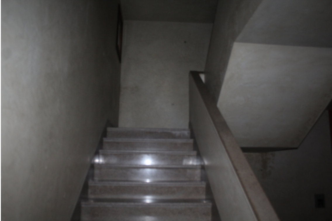
vano scala comune