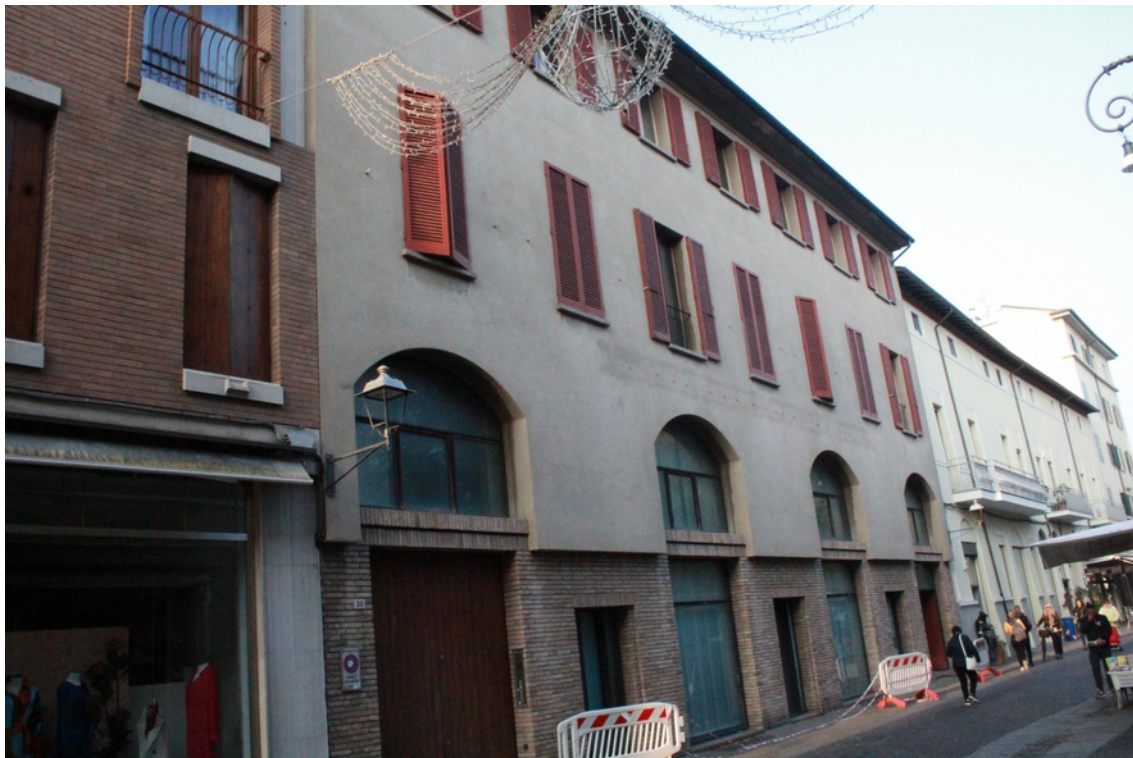
Vista esterna del fabbricato dalla pubblica Via delle Torri