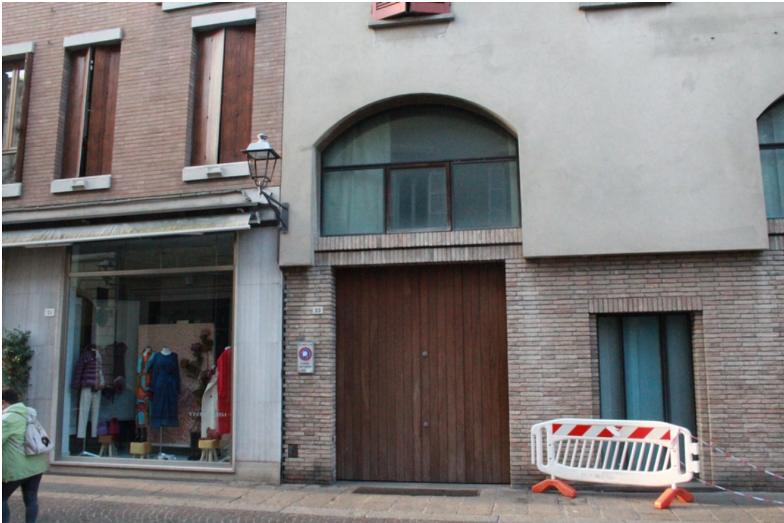
Ingresso del fabbricato dalla pubblica Via delle Torri