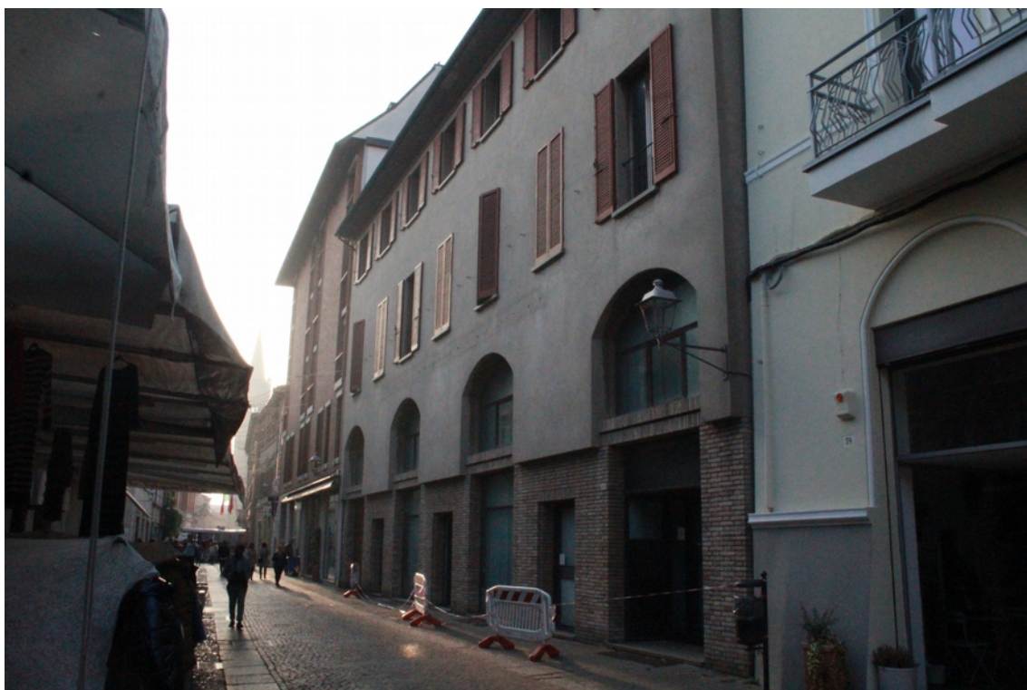
Vista esterna del fabbricato dalla pubblica Via delle Torri