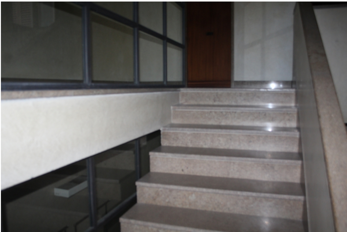
vano scala comune