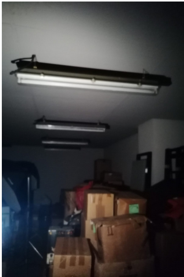
deposito piano seminterrato