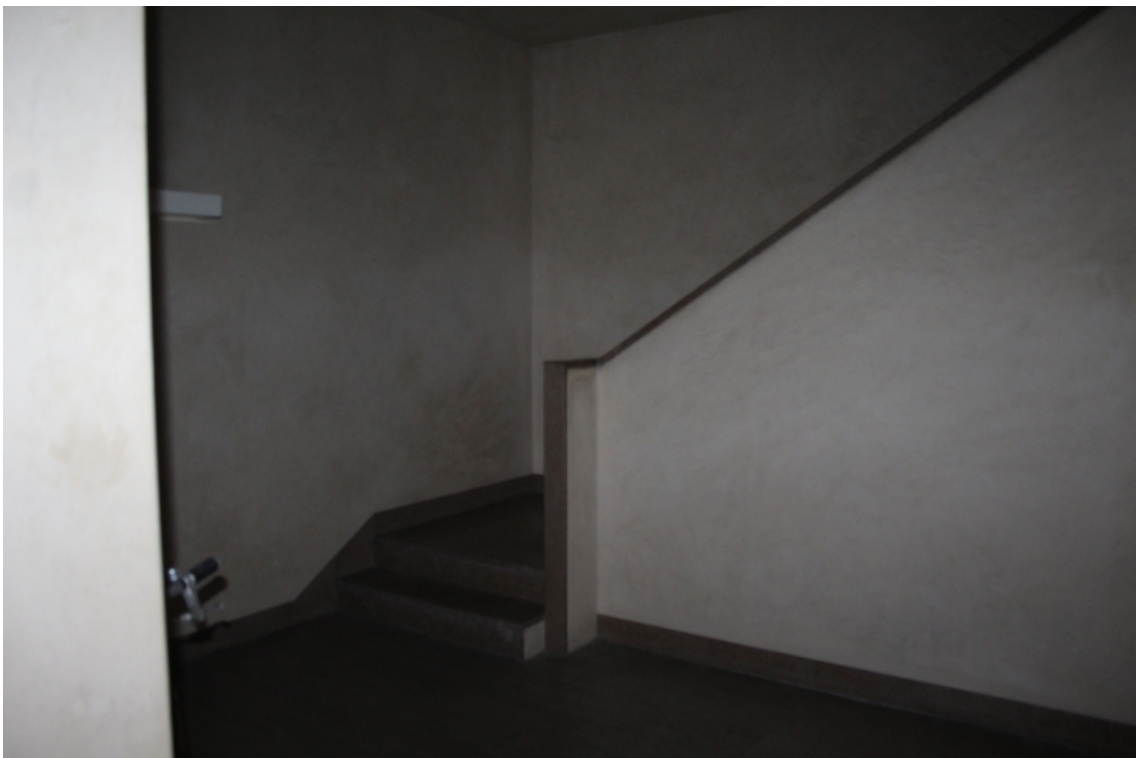
vano scala comune