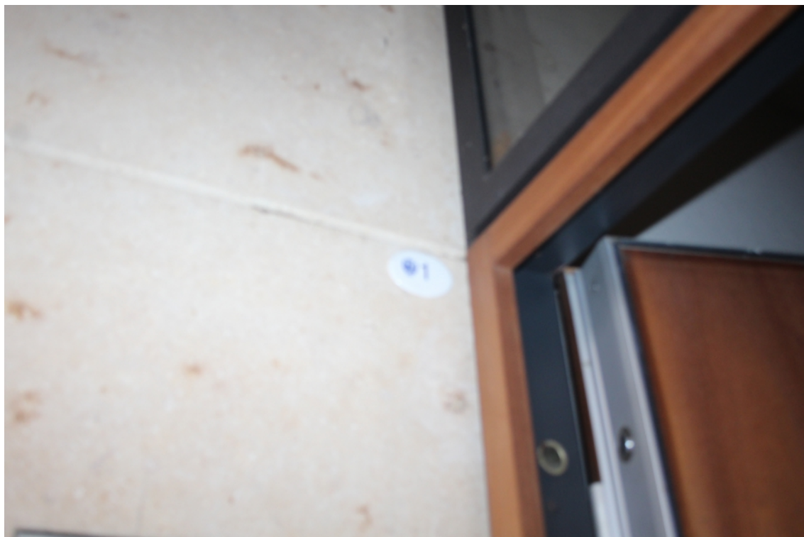
ingresso attico piano terzo interno 1