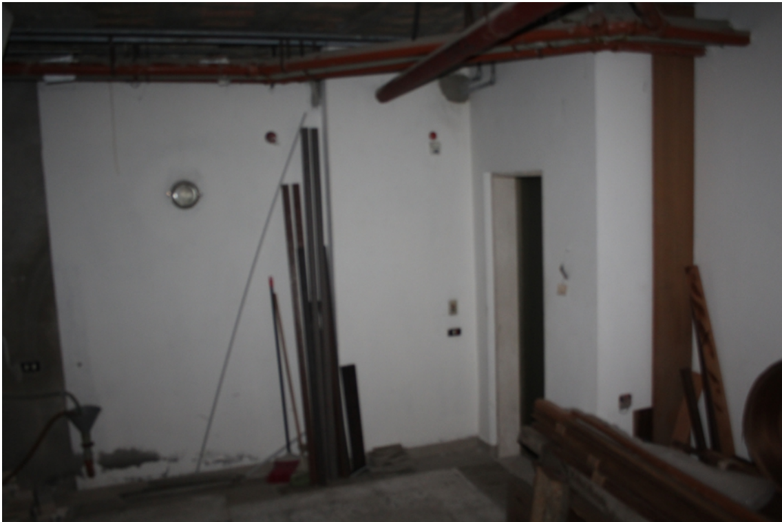
disimpegno piano seminterrato