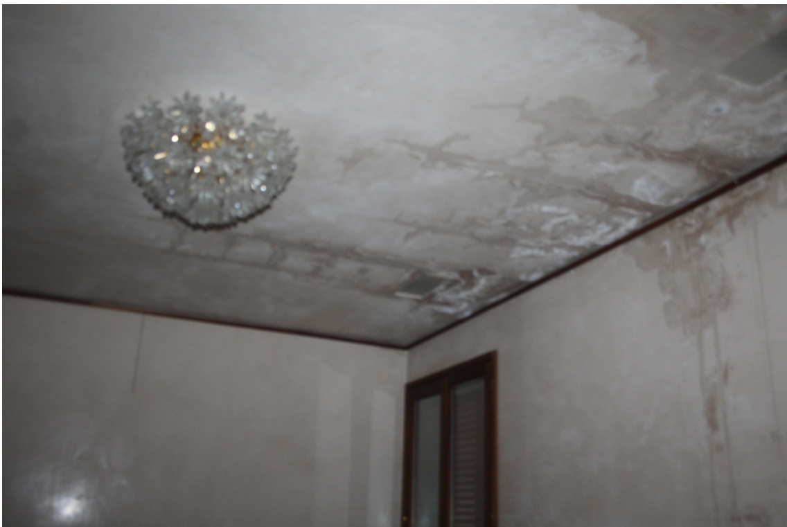
particolare soffitto camera da letto