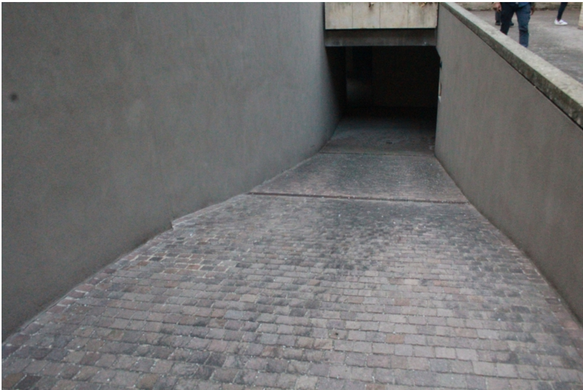
rampa di accesso al piano seminterrato