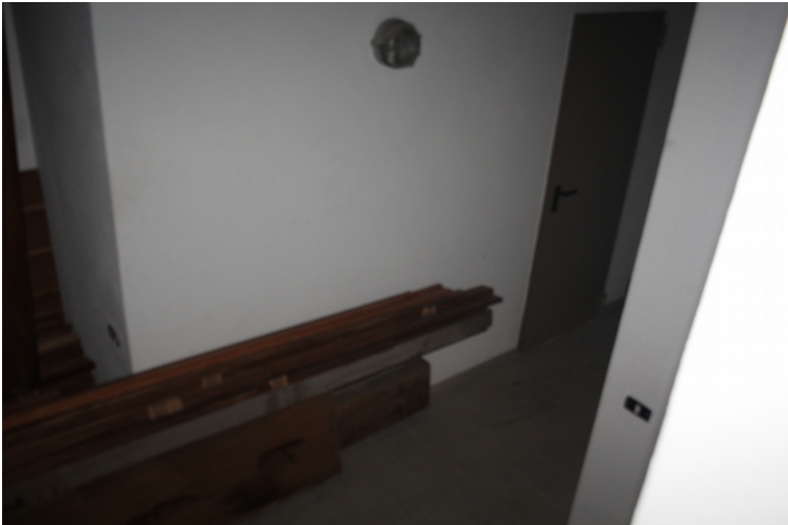
disimpegno piano seminterrato