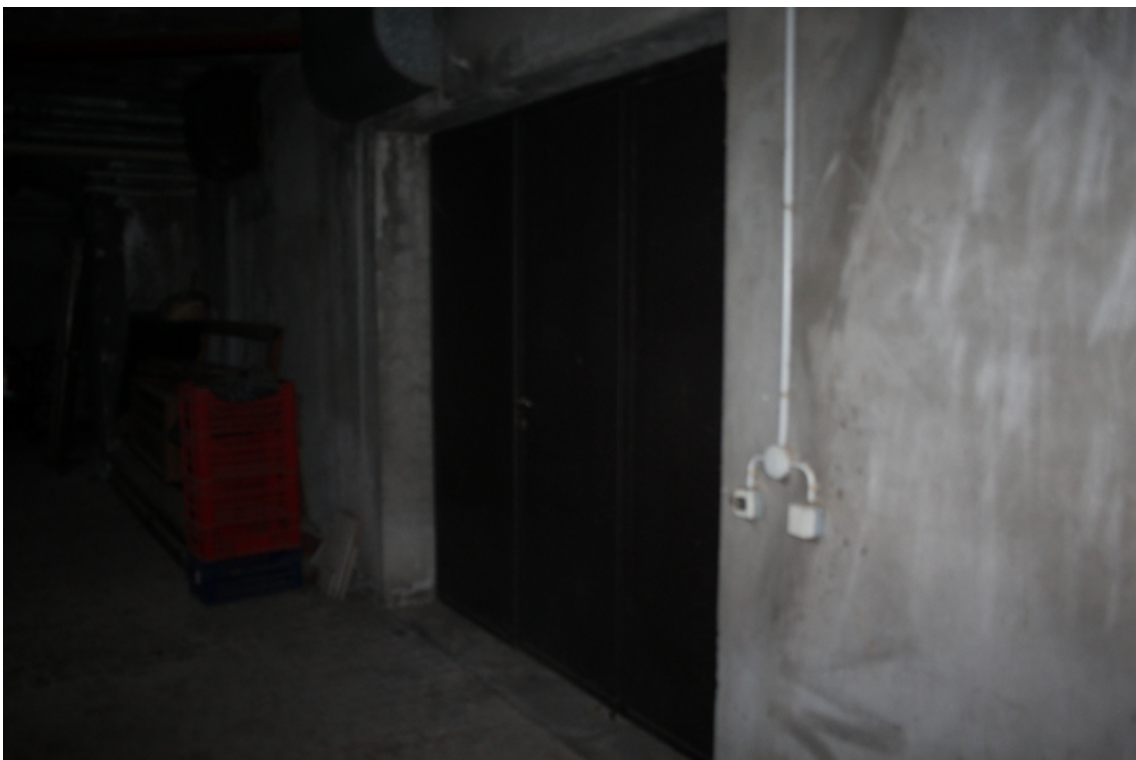
garage piano seminterrato