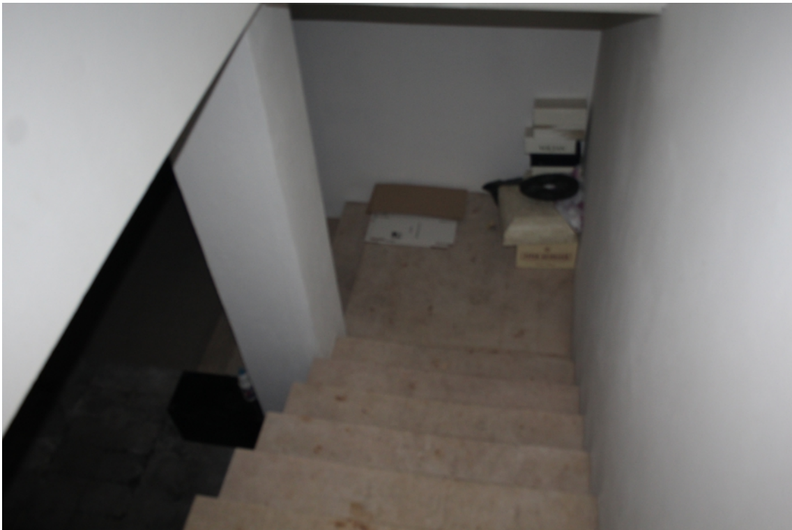
scala interna piano seminterrato