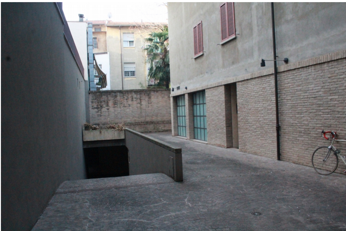
vista esterna rampa di accesso al piano seminterrato