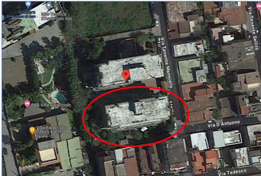
FIG. 1 - INQUADRAMENTO GENERALE

Per meglio comprendere quanto appena detto, a seguire si riporta la seguente ortofoto indicante il percorso stradale.