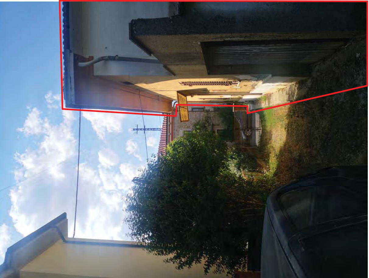
FOTO 72 e 73 - Viste resede a comune con lotto 1