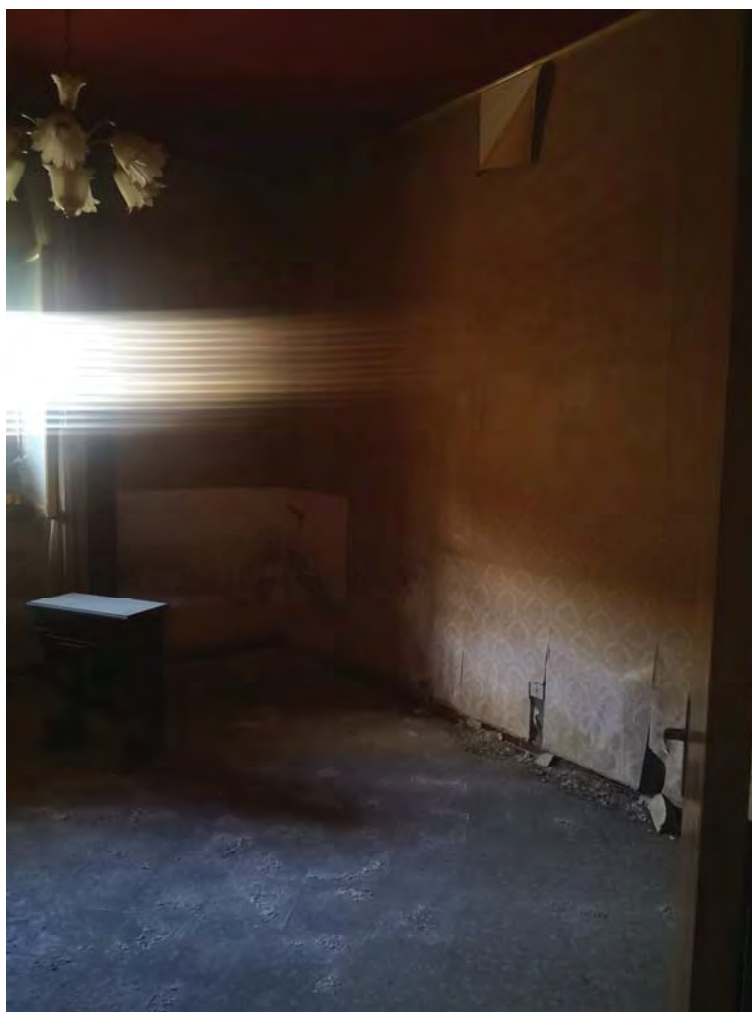
FOTO 55 - Soggiorno