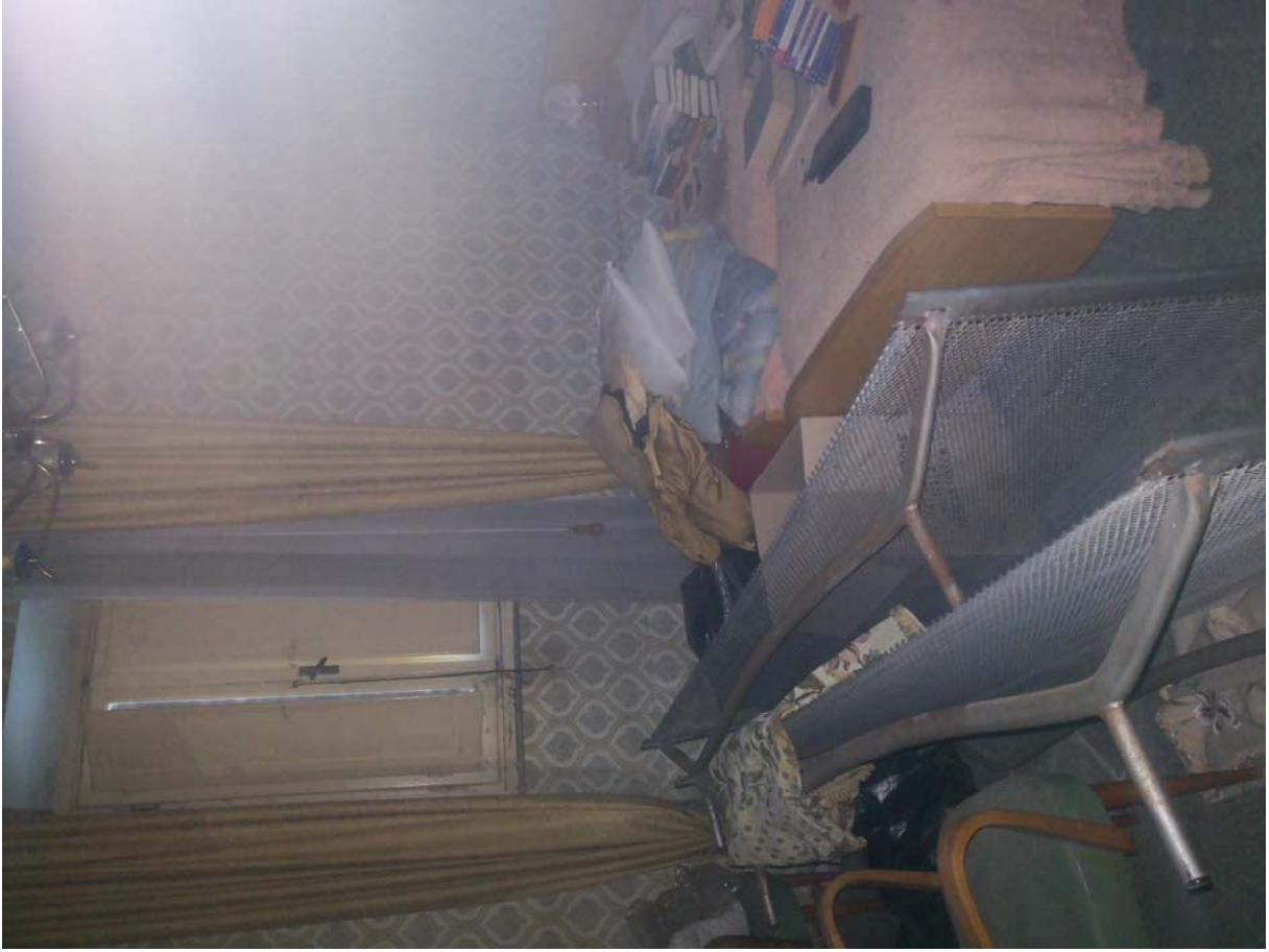
FOTO 58 - camera