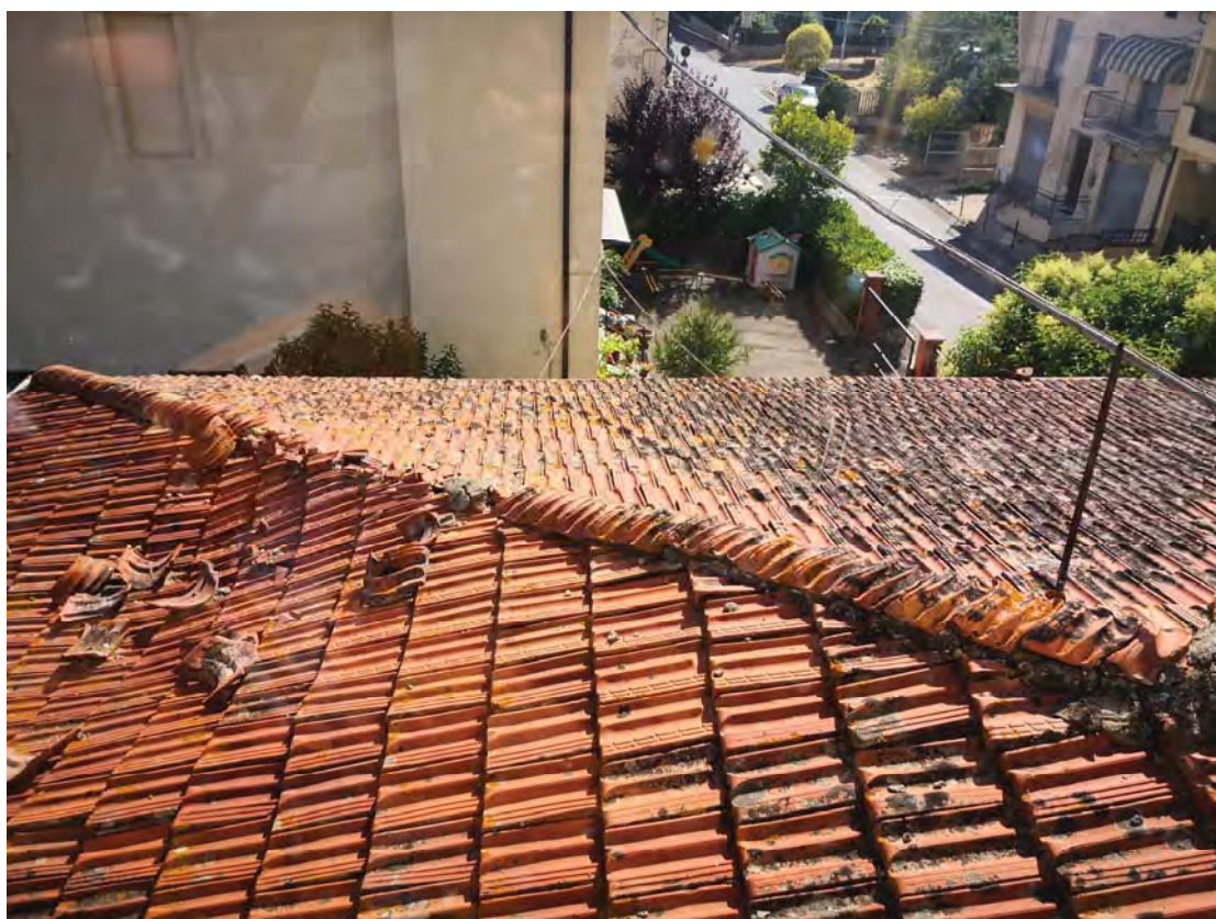
FOTO 68 e 69 - Viste esterne copertura