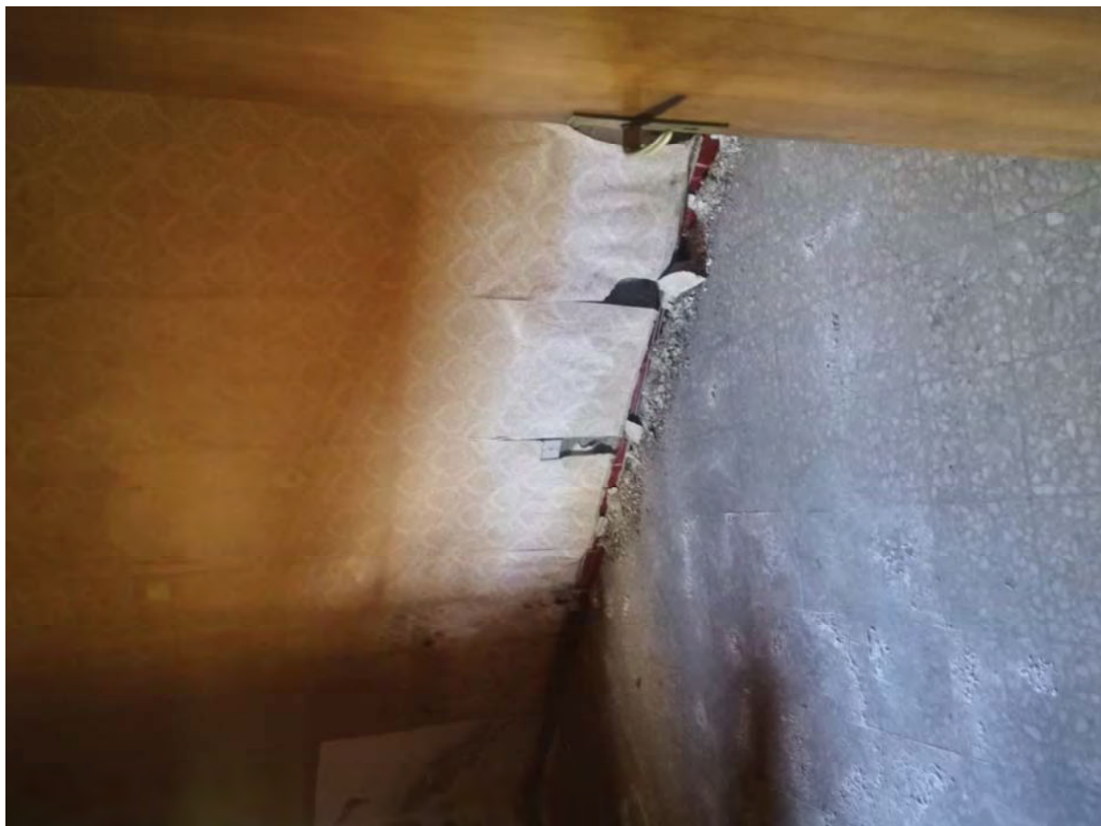
FOTO 56 - Particolare rivestimento e pavimento