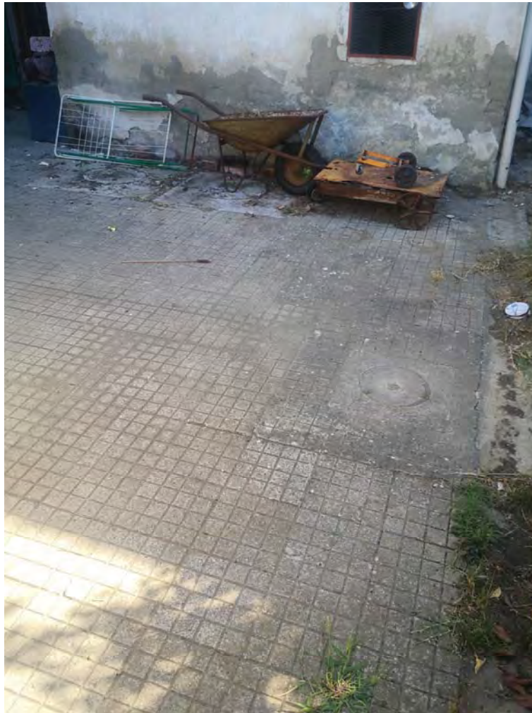
FOTO 76 - Viste retro da resede a comune con lotto 1