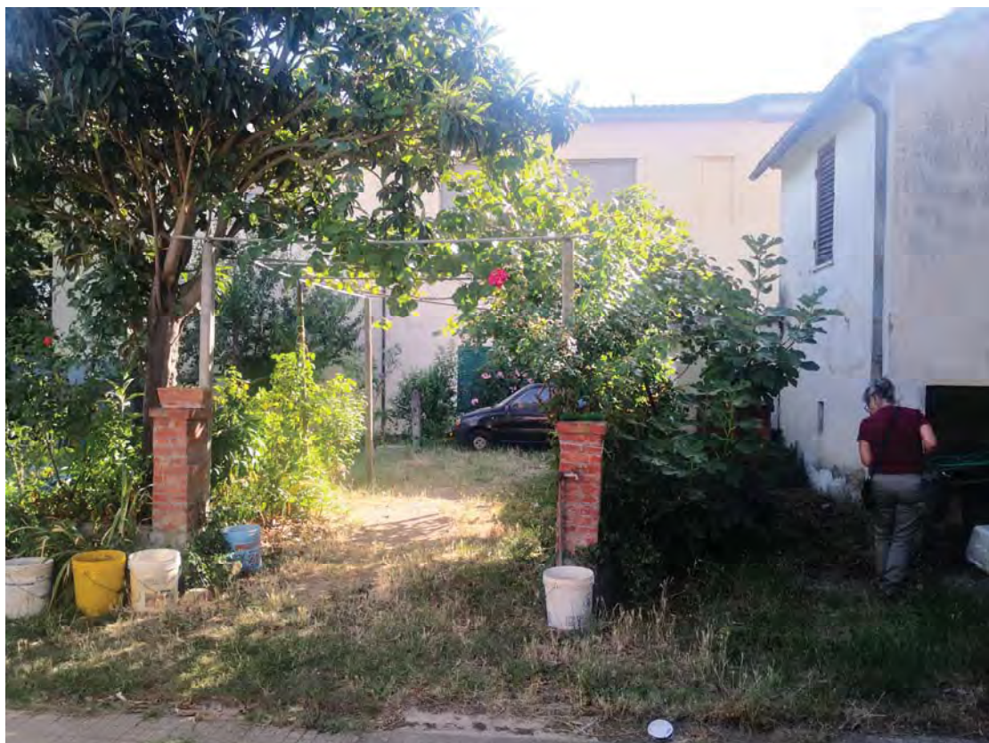
FOTO 77 - Vista resede a comune con lotto 1