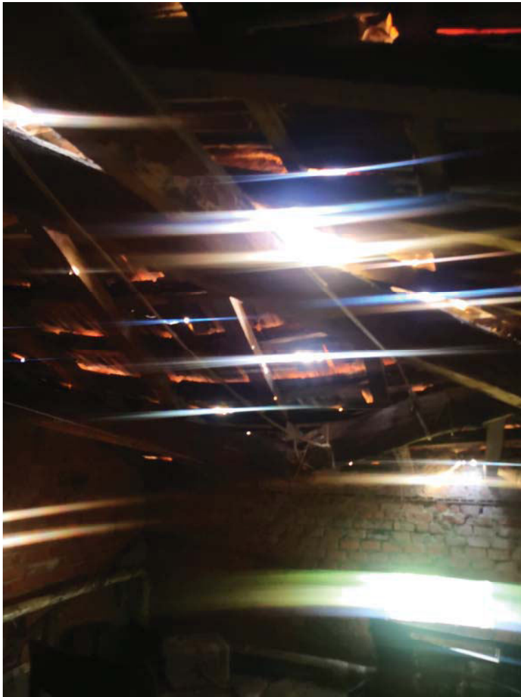
FOTO 66 - particolare intradosso copertura