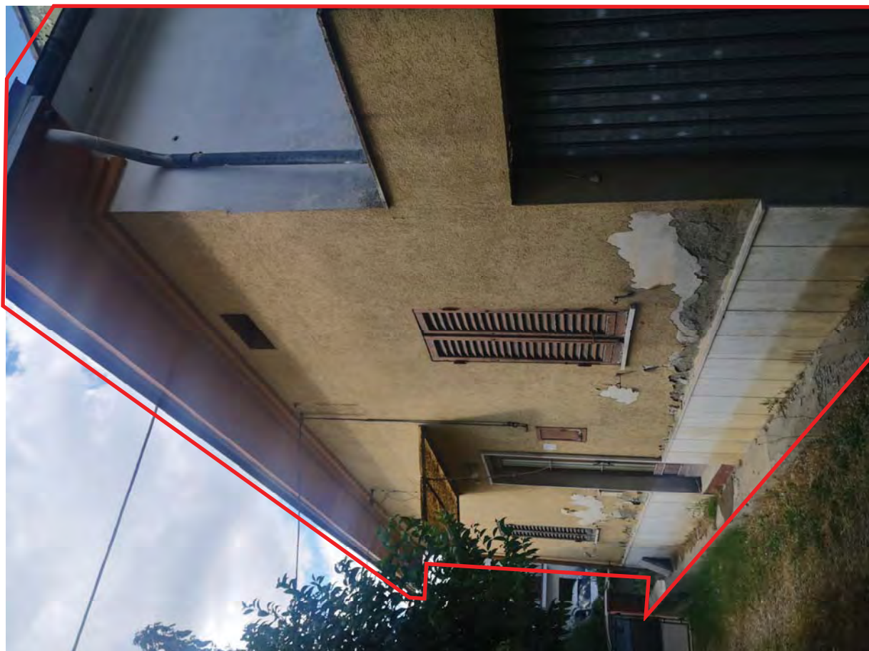
FOTO 53 - Accesso civico 118 da resede a comune con lotto 1