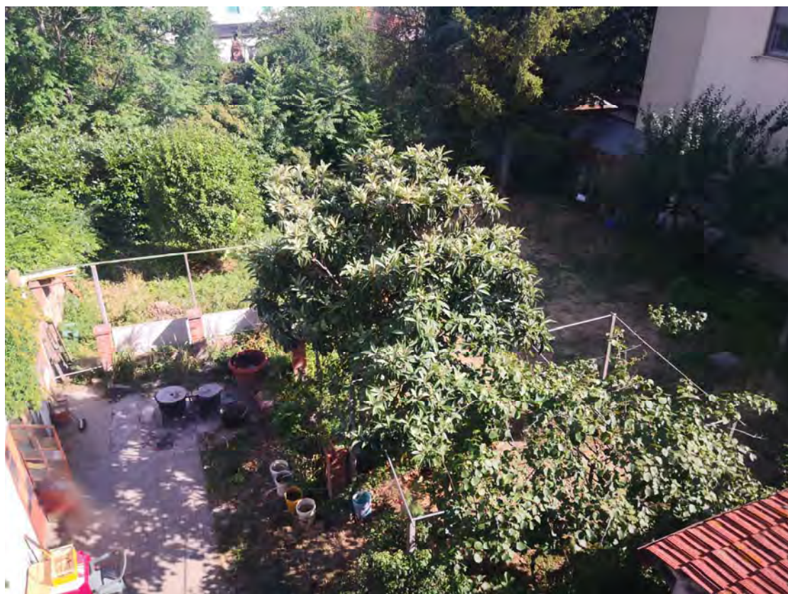
FOTO 75 - Vista resedi a comune con lotto 1