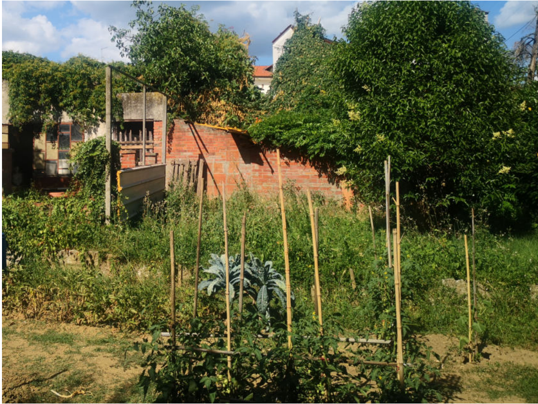
FOTO 78 - manufatto abusivo