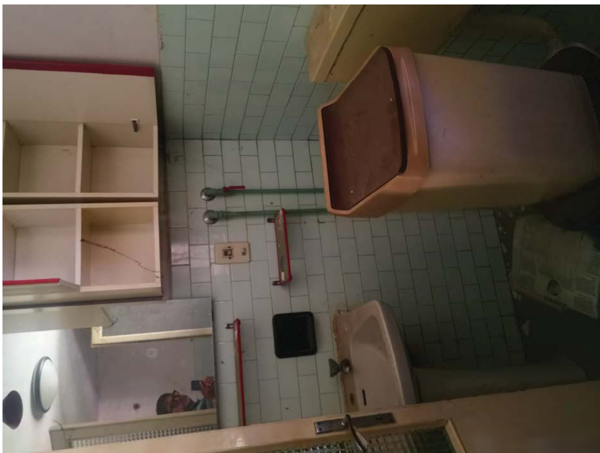
FOTO 63 - Servizio igienico