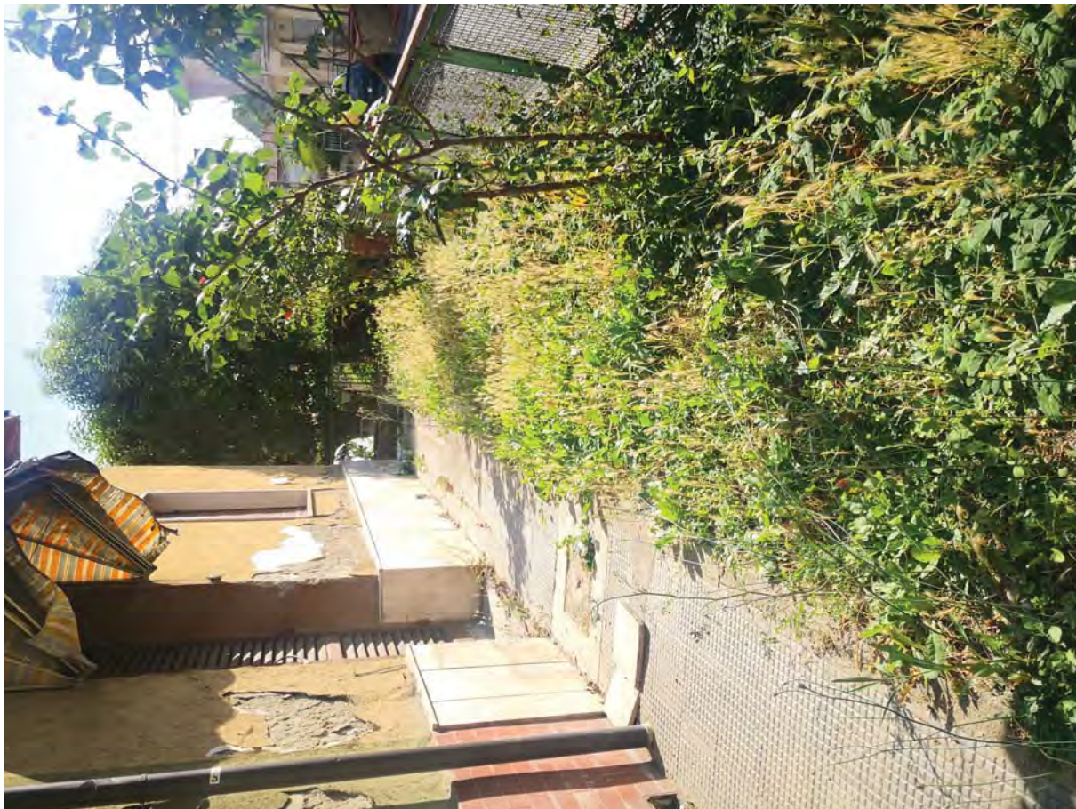
FOTO 52 - vista da resede di pertinenza esclusiva