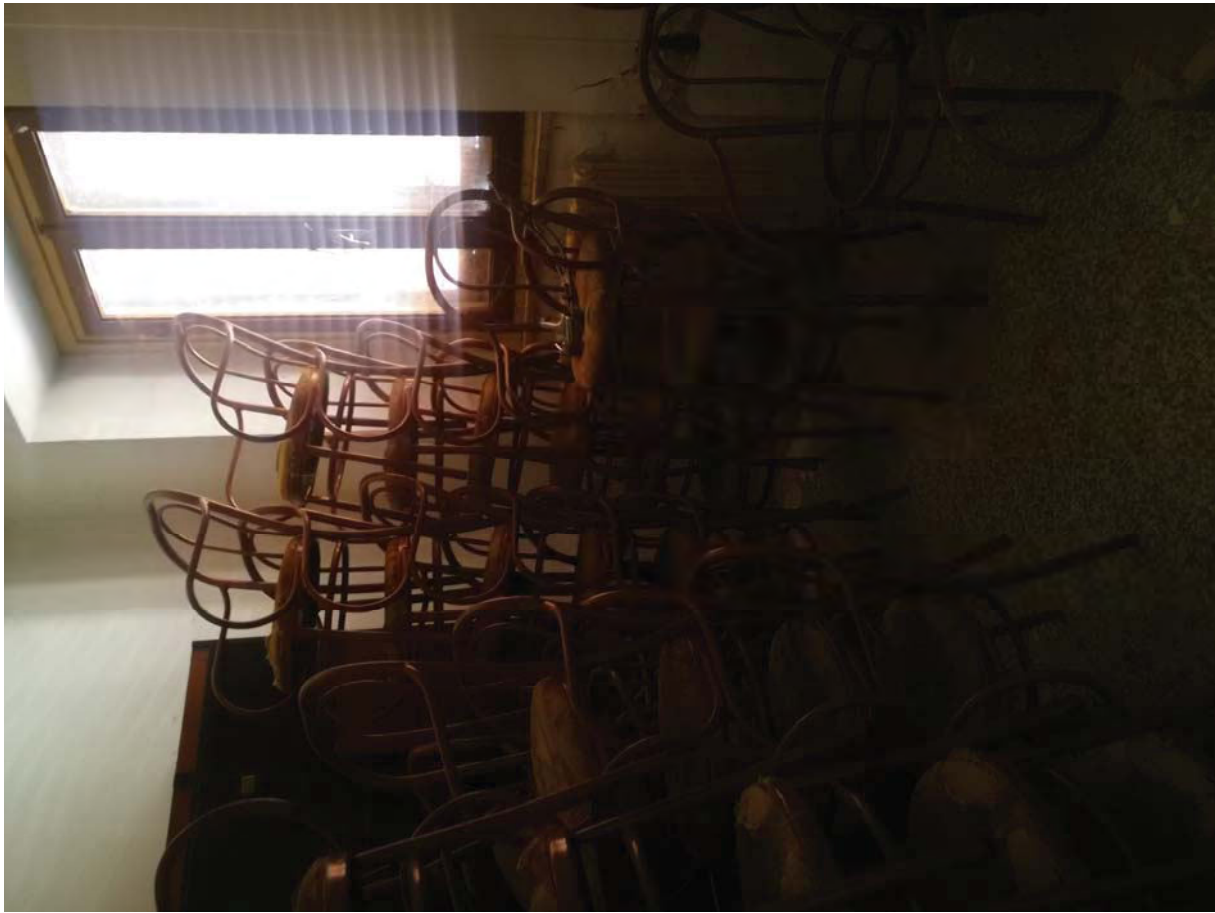
FOTO 60 - sala