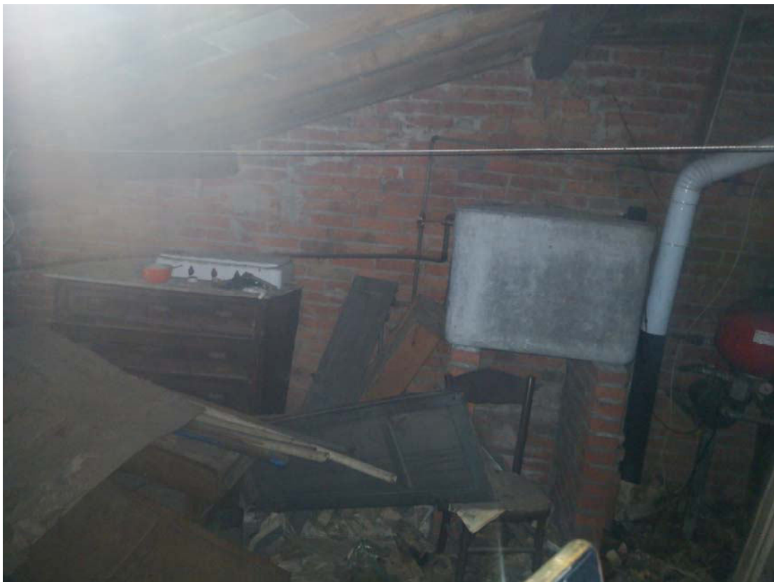
FOTO 67 - soffitta