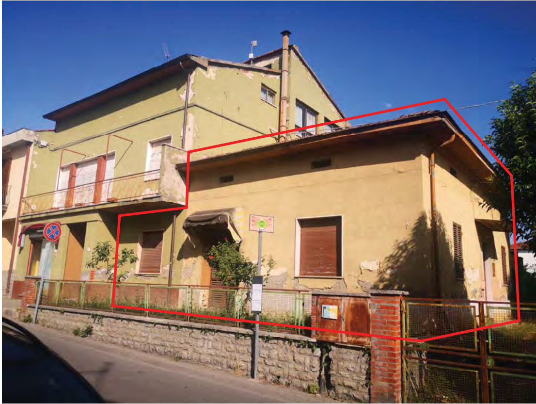
FOTO 50 - Vista lotto da via Rigutino Sud

Foglio 93/B, particella 260 sub 8 e particella 260 sub 5 Via Rigutino Sud n.118 e resedi a comune