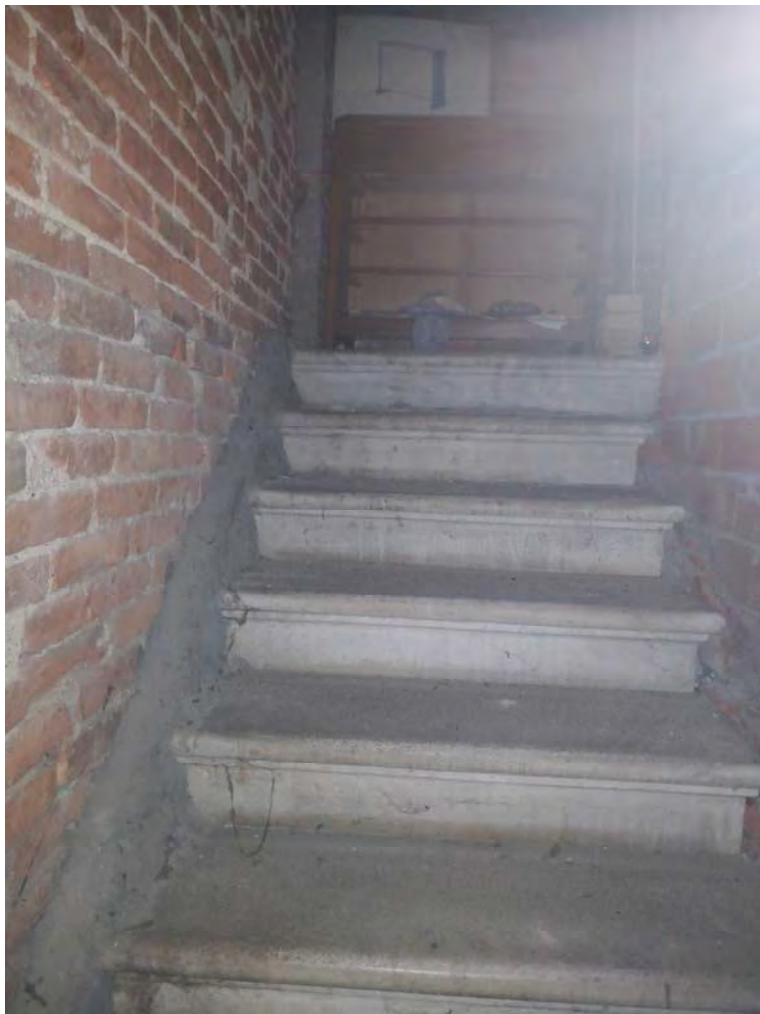
FOTO 64 - scala accesso piano soffitta