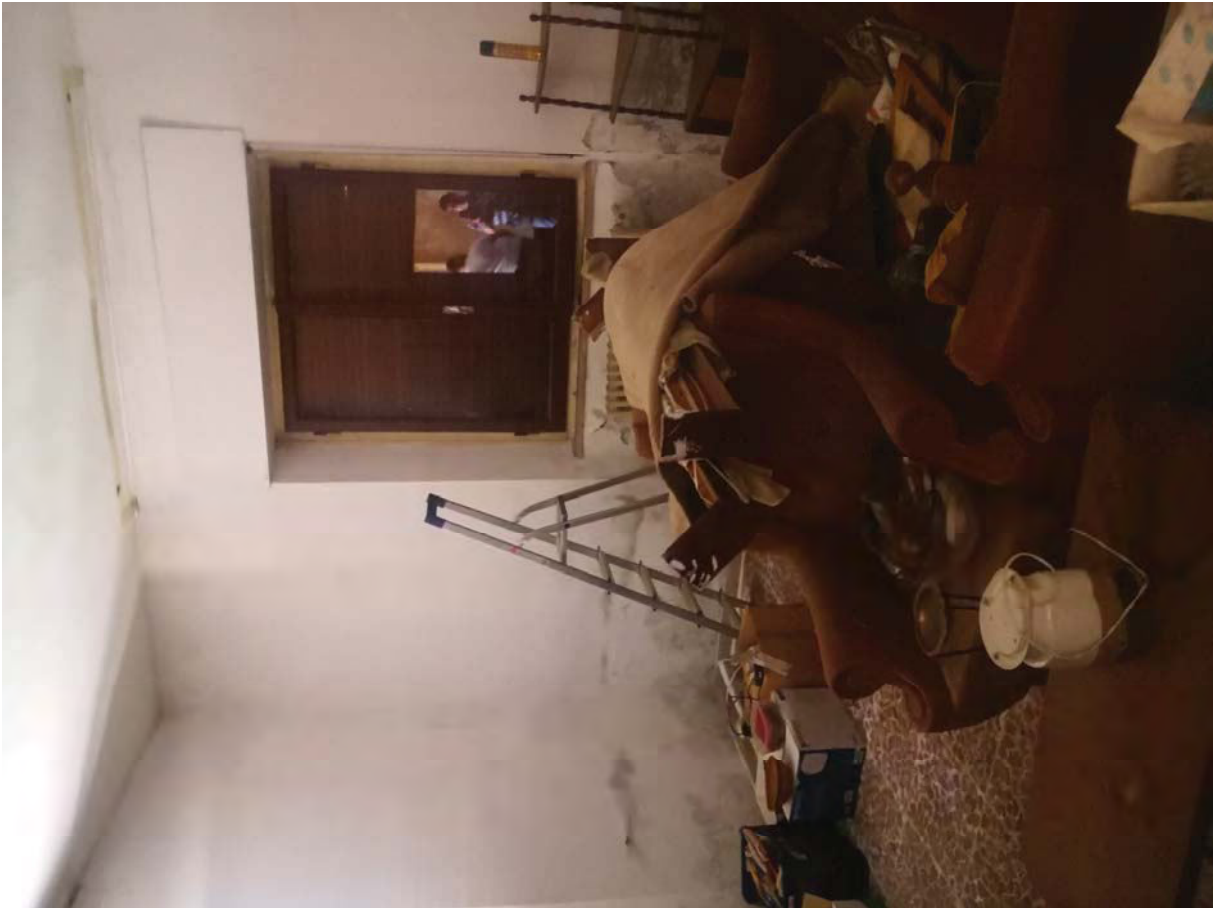
FOTO 59 - salottino