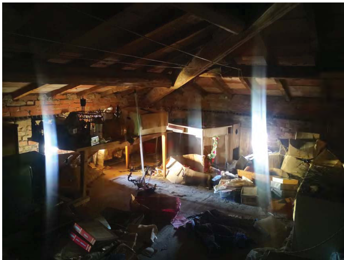
FOTO 65 - soffitta