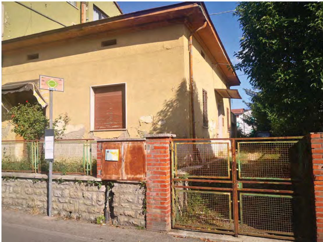
FOTO 51 - Accesso a resede a comune con lotto 1