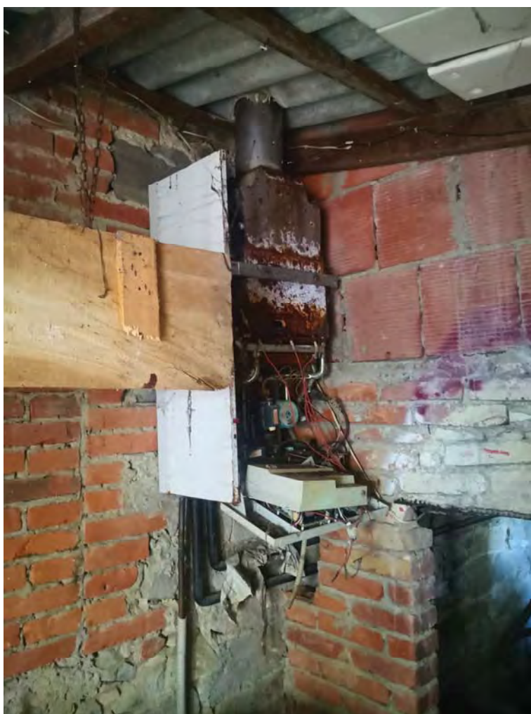
FOTO 71 - vista interna garage