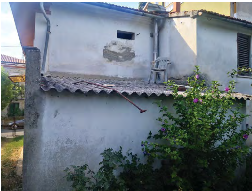
FOTO 70 - Vista esterna garage