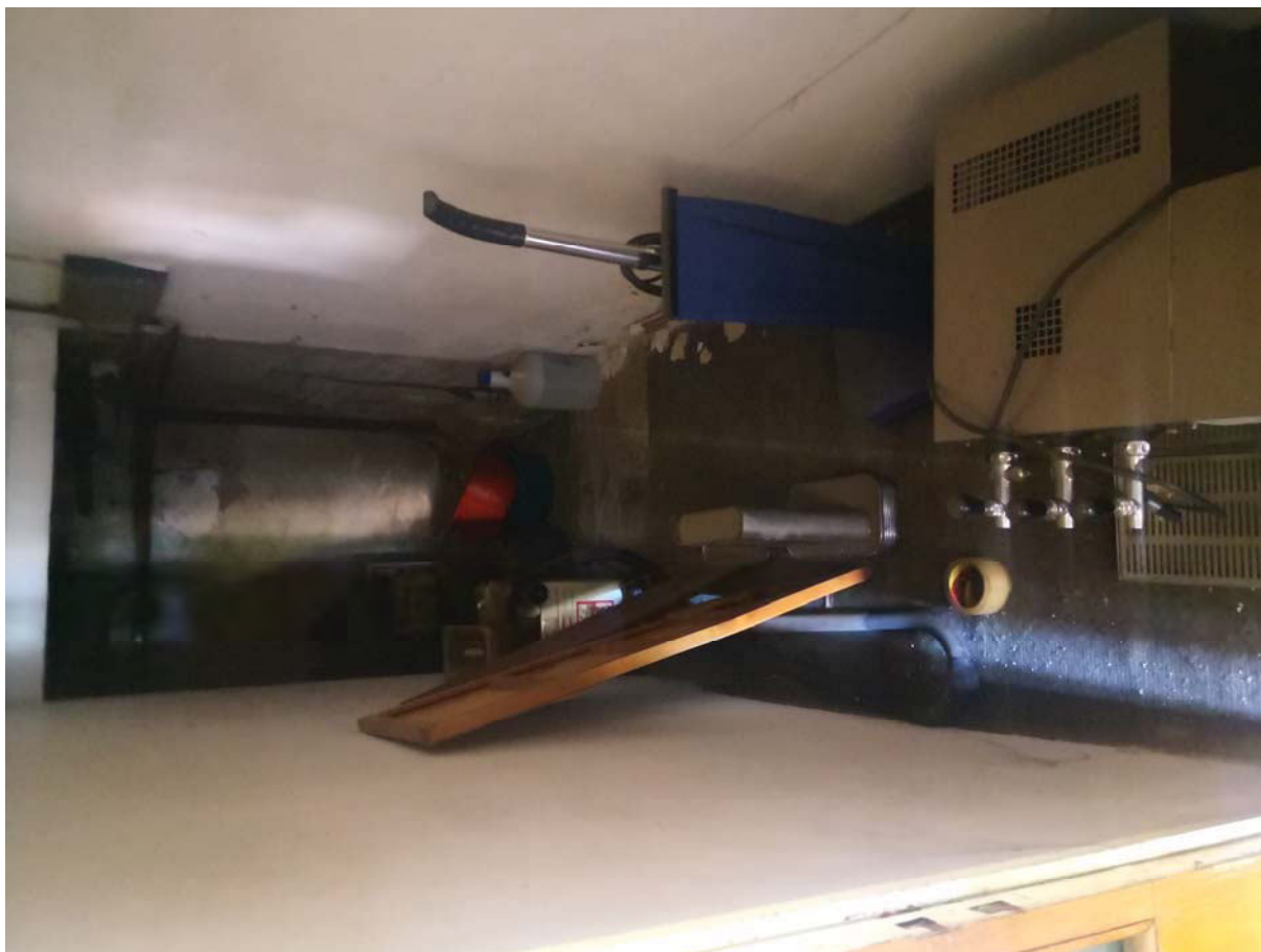
FOTO 62 - Ripostiglio sottoscala