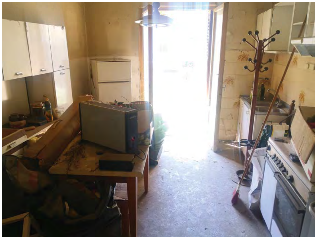
FOTO 54 - Cucina