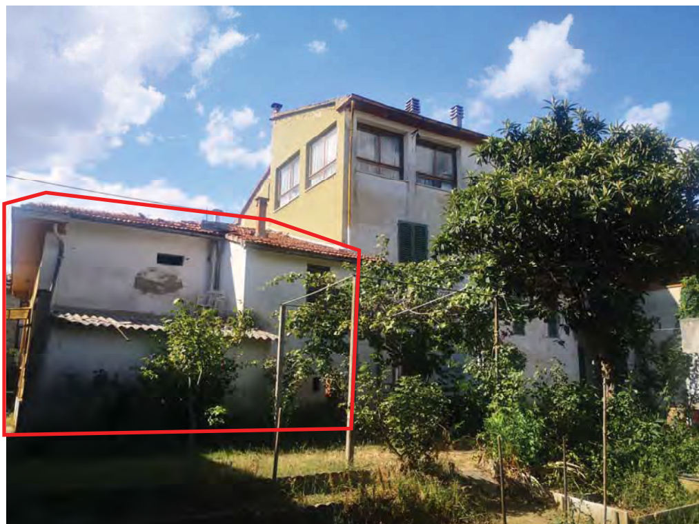
FOTO 74 - Vista da resede a comune con lotto 1