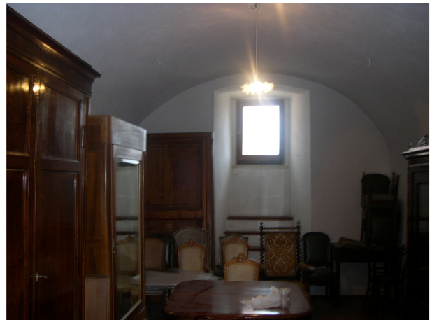
Interno sub 38