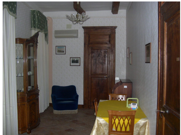
Interno sub 39