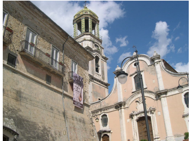
Esterno sub 30