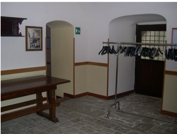
Interno sub 51(piano terra)