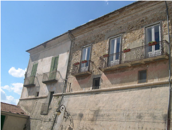
Esterno sub 30 e sub 38