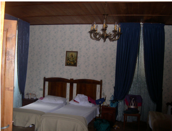
Interno sub 39