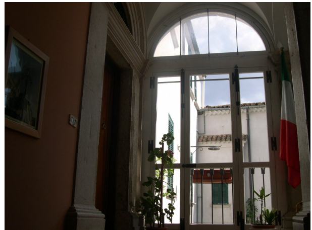
Ingresso sub 30