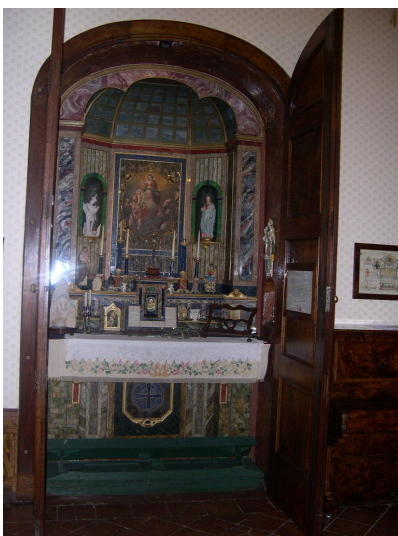
Interno sub 30