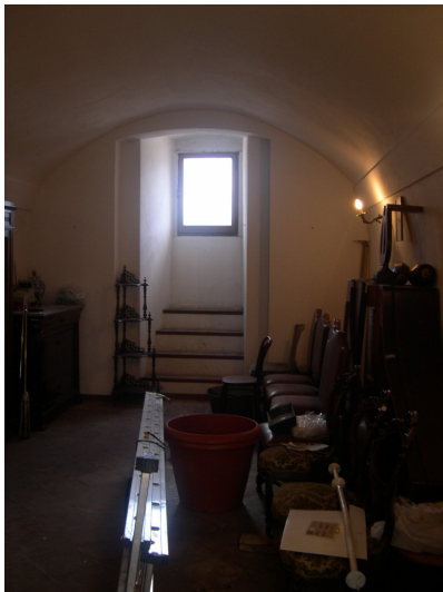
Interno sub 38