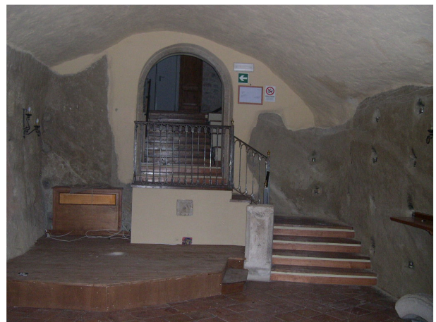
Interno sub 51 (piano seminterrato)