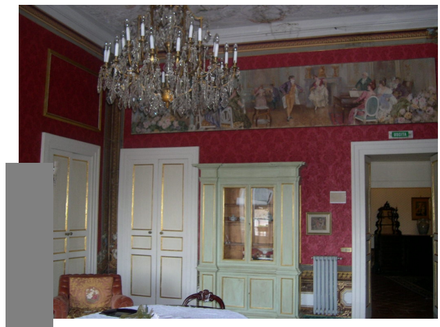
Interno sub 30