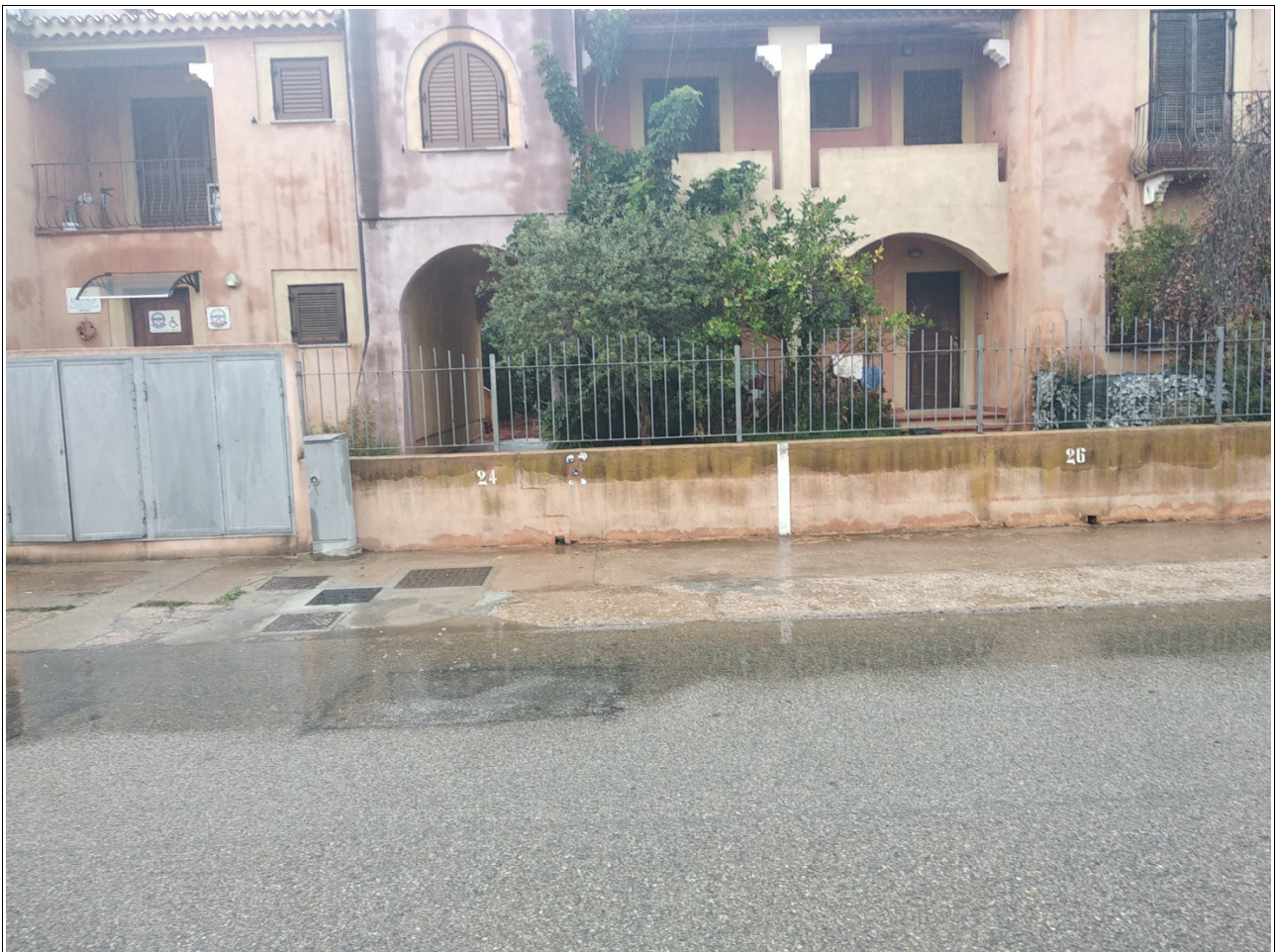
Figura 5: Posto auto scoperto esclusivo all'esterno del complesso immobiliare