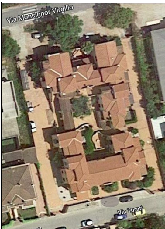
Figura 2: Ortofoto di dettaglio del complesso immobiliare nel quale è presente il posto auto scoperto oggetto della presente scheda