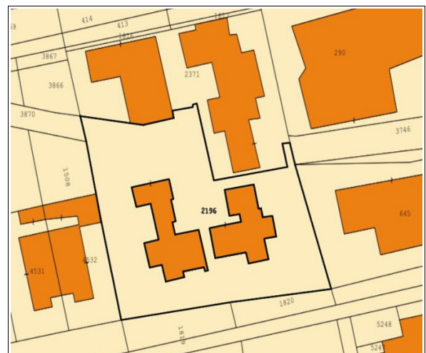
Figura 3: Mappa Catastale “Terreni”, della zona antistante Via Monsignor Virgilio e Via Turati, in cui ricade il posto auto scoperto oggetto della presente scheda distinta al Foglio 5 particella 2196 sub 27