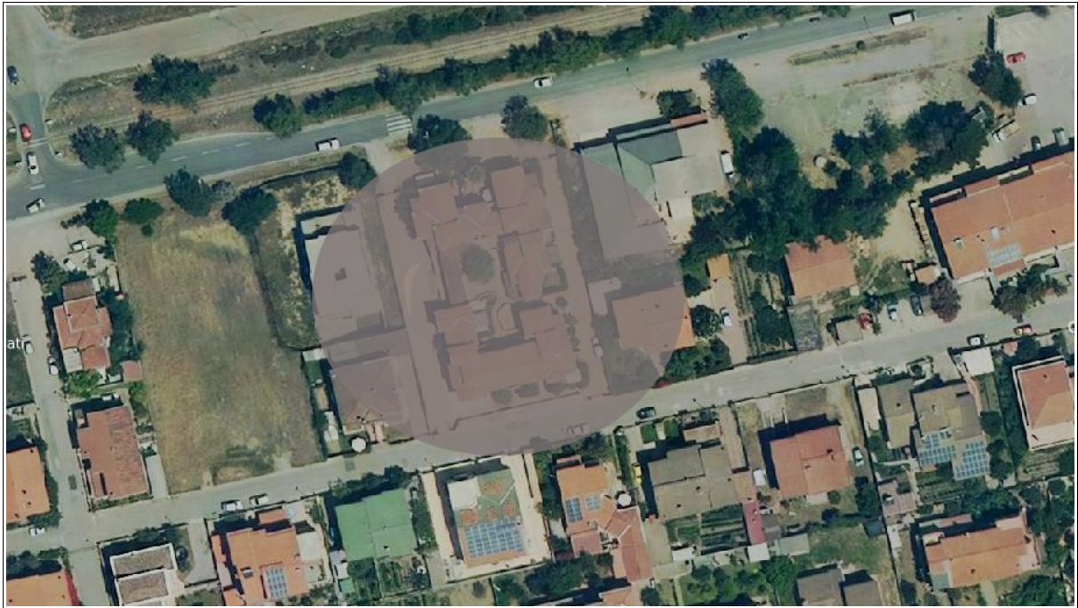
Figura 1: Ortofoto della zona antistante la Via Monsignor Virgilio e Via Turati, in cui ricade il complesso immobiliare nel quale è presente l'appartamento oggetto della presente scheda