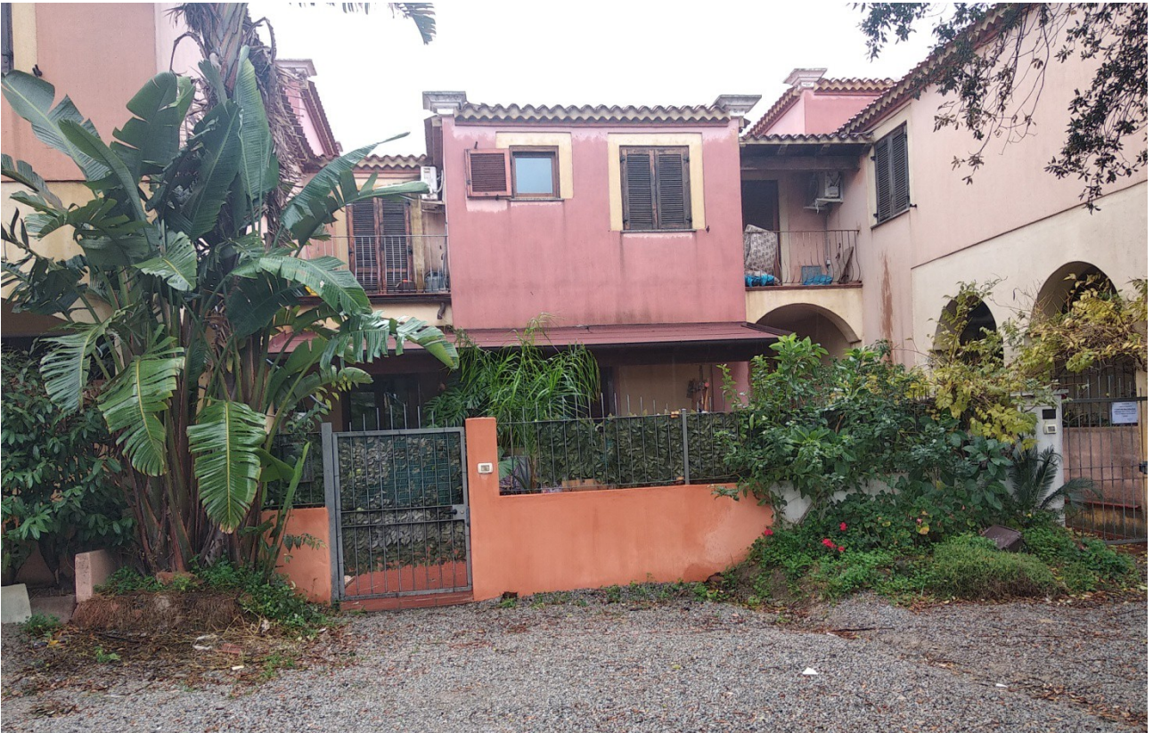
Figura 4: Prospetto Principale del fabbricato in cui è inserita l'unità immobiliare posta al pianoterra e seminterrato della presente scheda - Scatto fotografico realizzato dallo scrivente dalla Via Monsignor Virgilio