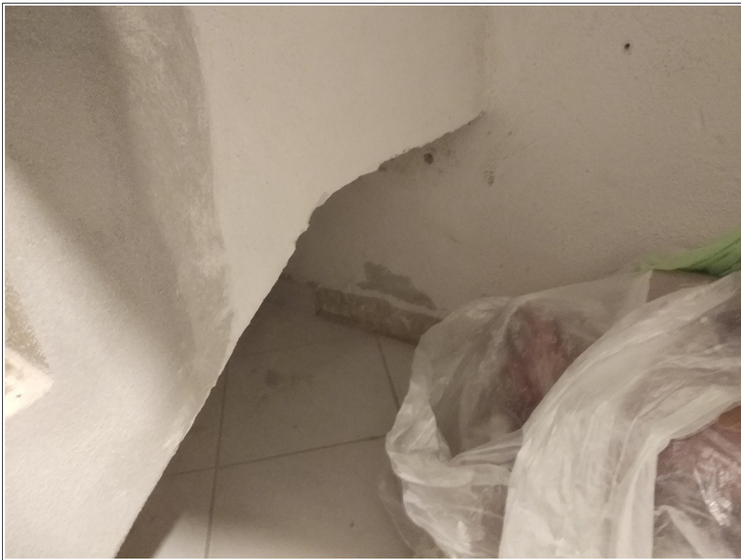
Figura 19: Cantina posta al piano seminterrato - Tracce di umidità