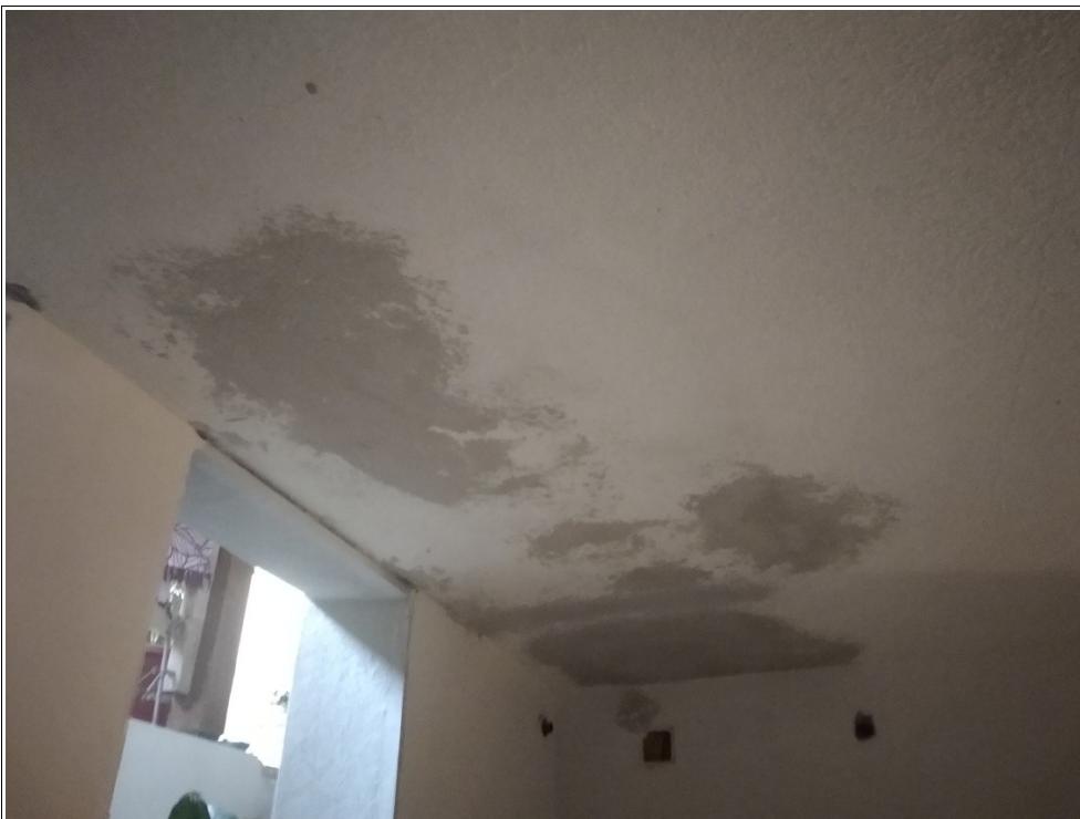
Figura 17: Cantina posta al piano seminterrato - Tracce di umidità