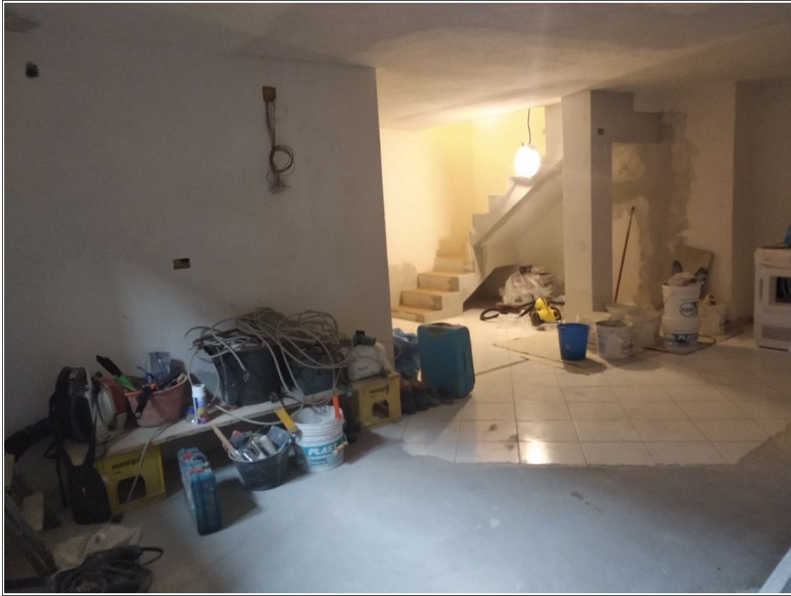
Figura 16: Cantina posta al piano seminterrato