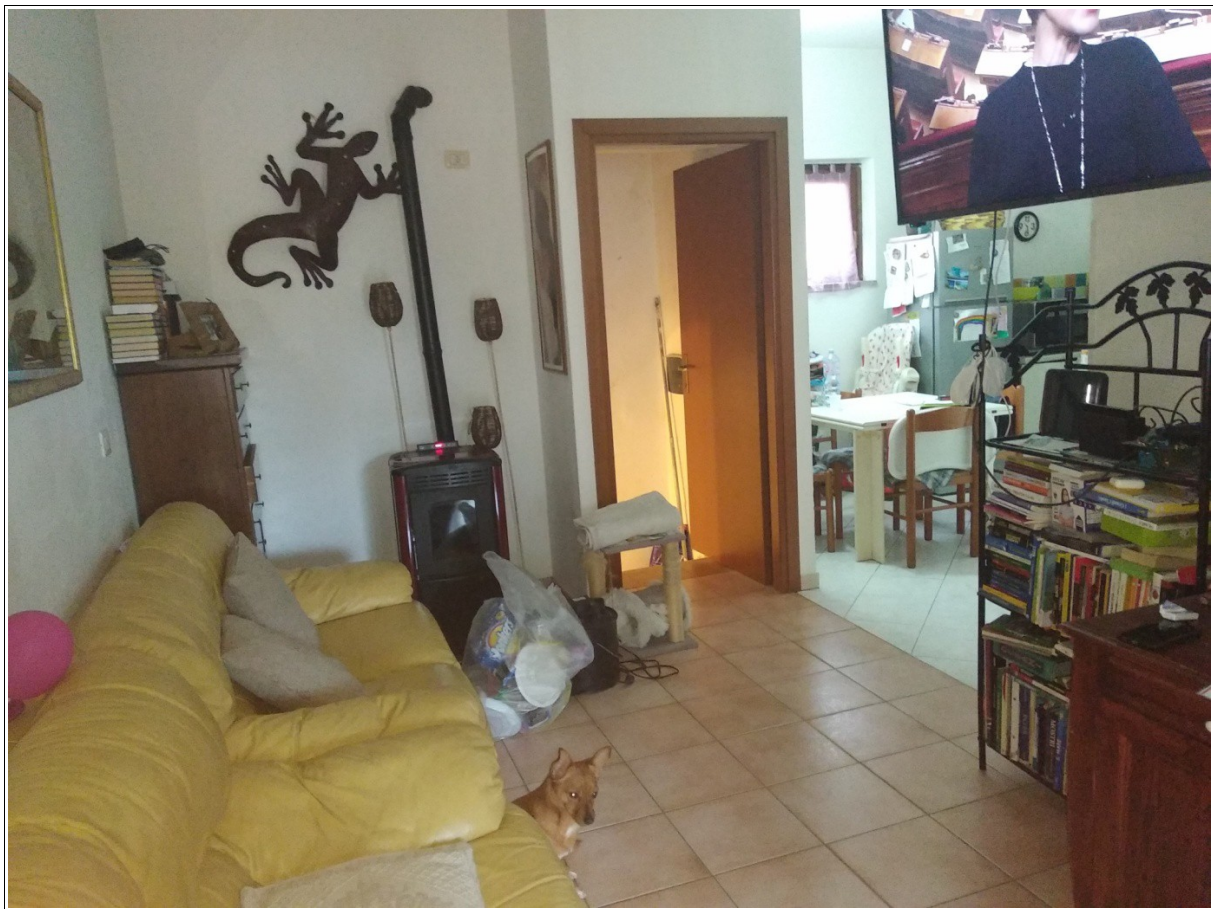
Figura 10: Zona giorno dell'unità immobiliare - Scatto fotografico realizzato dallo scrivente