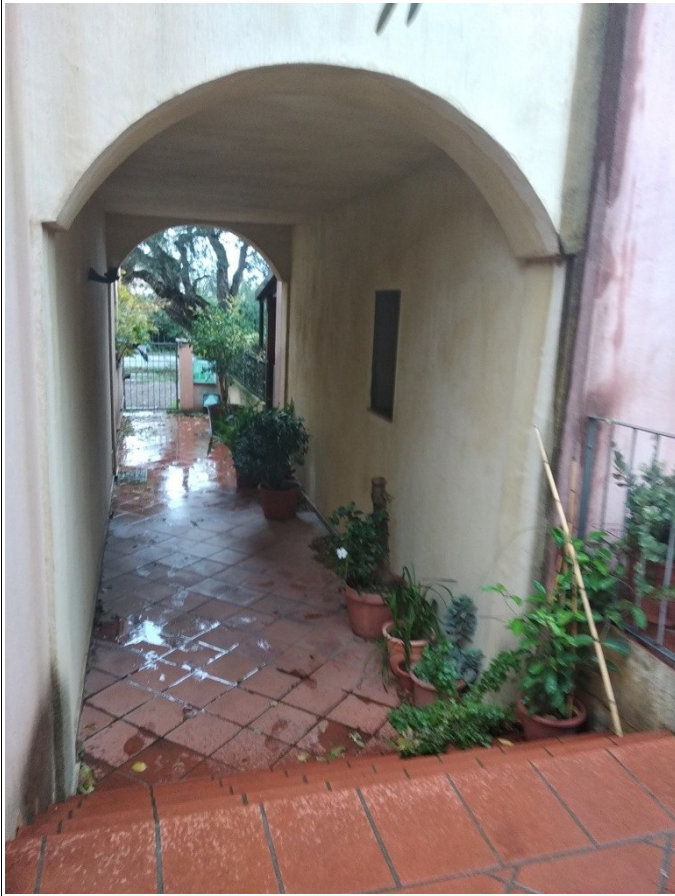
Figura 6: Inquadratura parziale prospetto ovest dell'unità immobiliare della presente scheda - Scatto fotografico realizzato dallo scrivente dall'interno del complesso immobiliare