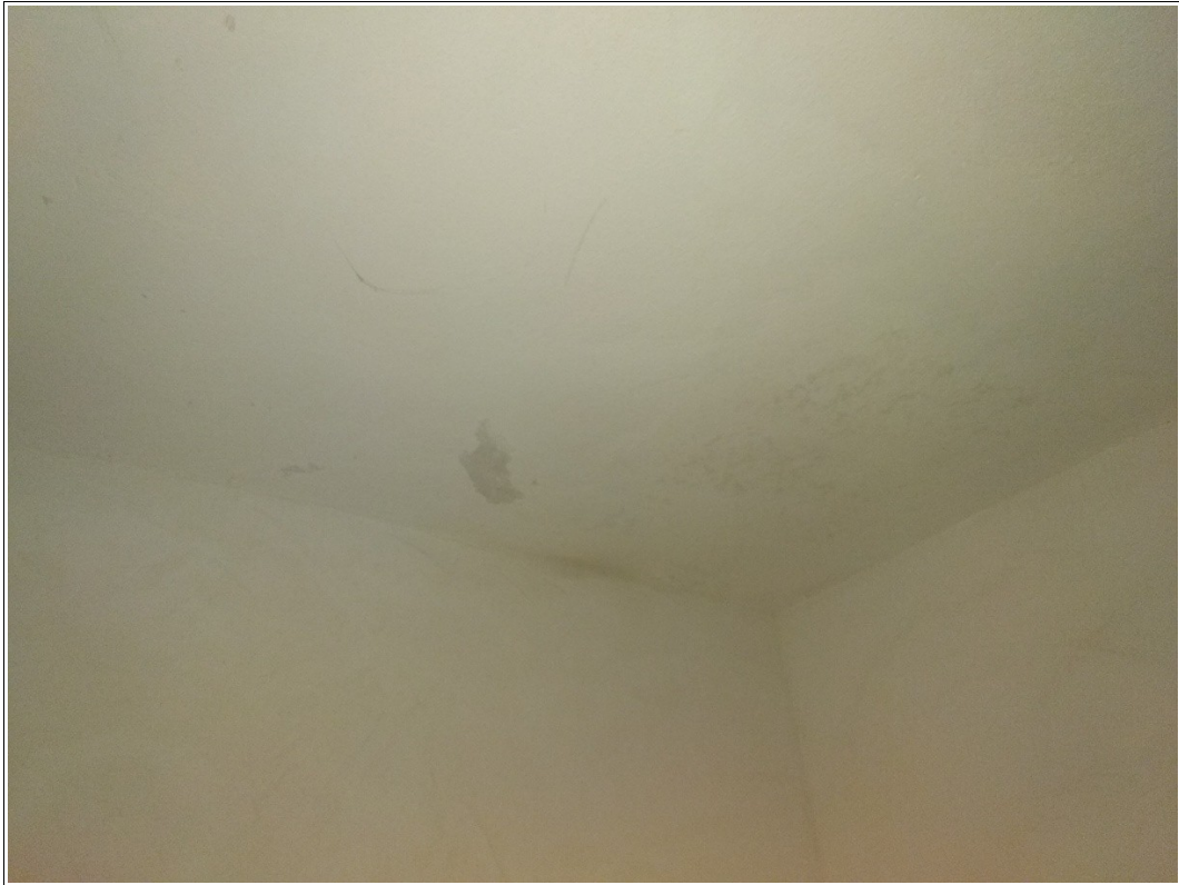
Figura 18: Cantina posta al piano seminterrato - Tracce di umidità - Scatto fotografico realizzato dallo scrivente