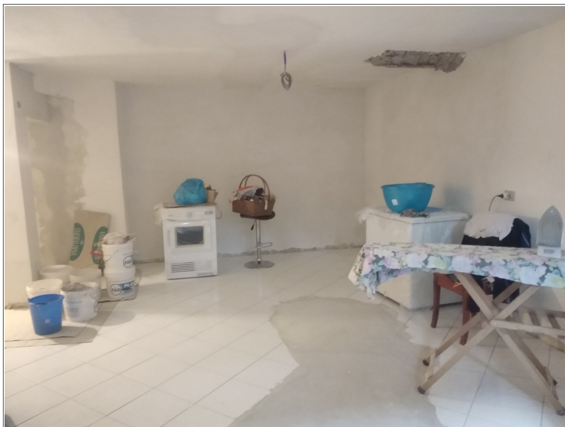
Figura 15: Cantina posta al piano seminterrato - Scatto fotografico realizzato dallo scrivente