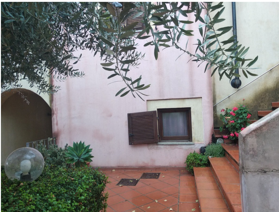
Figura 5: Inquadratura parziale prospetto sud dell'unità immobiliare della presente scheda