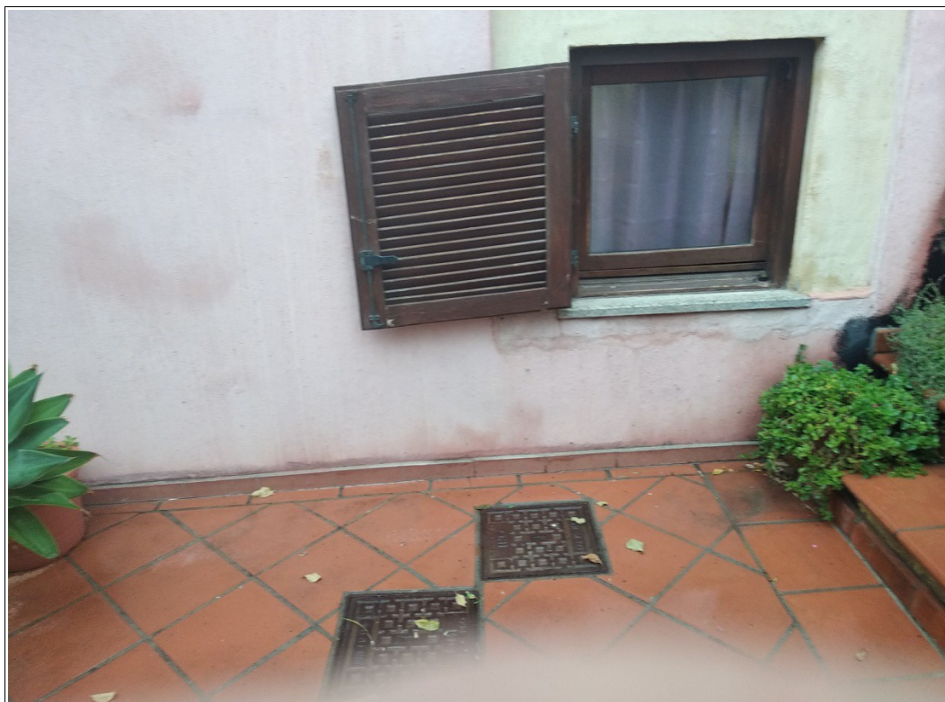
Figura 23: Zona esterna scoperta posta nel lato sud dell'appartamento - Tracce di umidità ed ammaloramento nella facciata