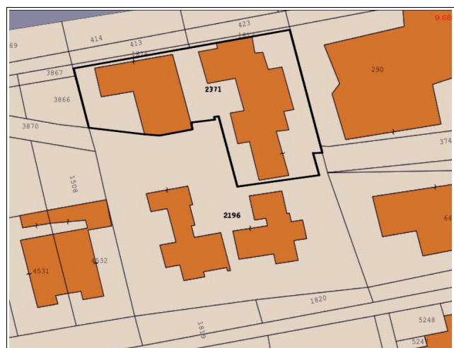
Figura 3: Mappa Catastale "Terreni", della zona antistante Via Monsignor Virgilio e Via Turati, in cui ricade l'unità immobiliare oggetto della presente scheda distinta al Foglio 5 particella 2371 sub 35