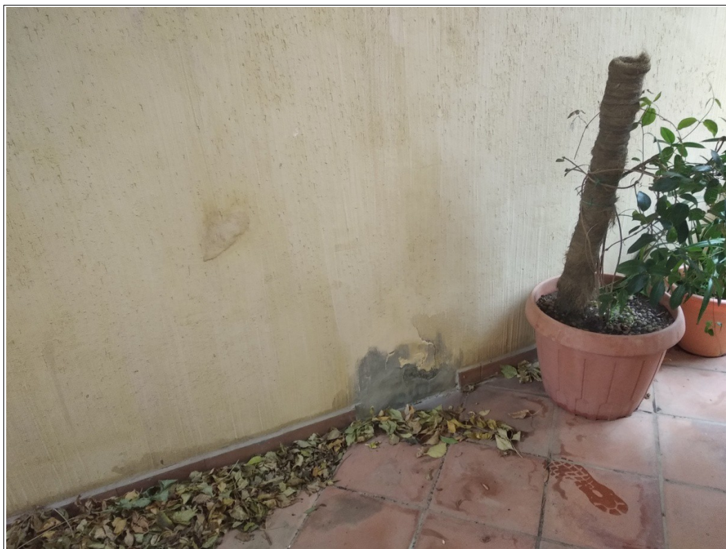
Figura 22: Zona esterna coperta posta nel lato ovest dell'appartamento - Tracce di umidità - Scatto fotografico realizzato dallo scrivente