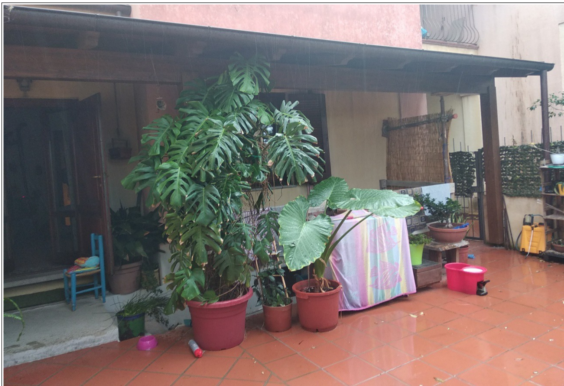
Figura 7: Inquadratura parziale prospetto principale dell'unità immobiliare della presente scheda - Scatto fotografico realizzato dallo scrivente dall'interno della corte