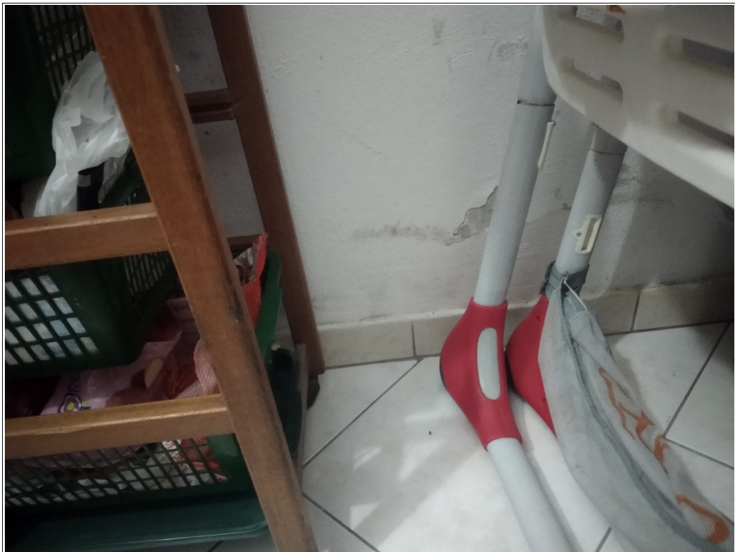
Figura 21: Zona giorno posta al piano terra - Tracce di umidità