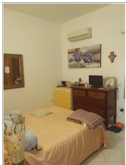
Figura 11: Camera da letto dell'unità immobiliare della presente scheda