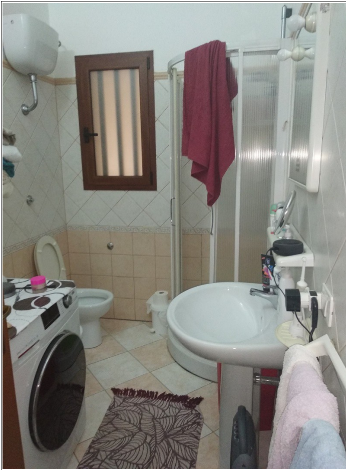
Figura 12: Servizio igienico dell'unità immobiliare