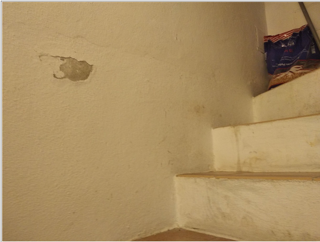
Figura 20: Vano scala interno - Tracce di umidità - Scatto fotografico realizzato dallo scrivente