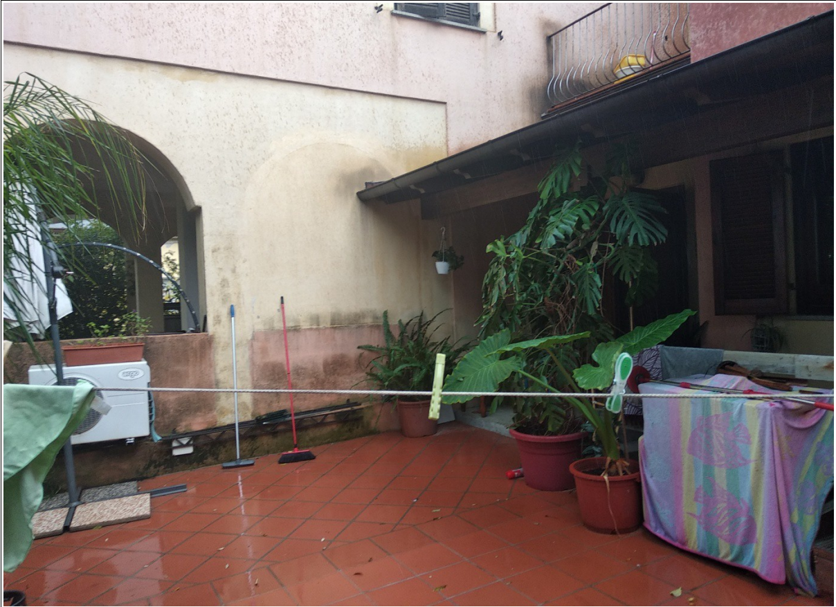
Figura 8: Inquadratura parziale e laterale del prospetto principale, dell'unità immobiliare della presente scheda