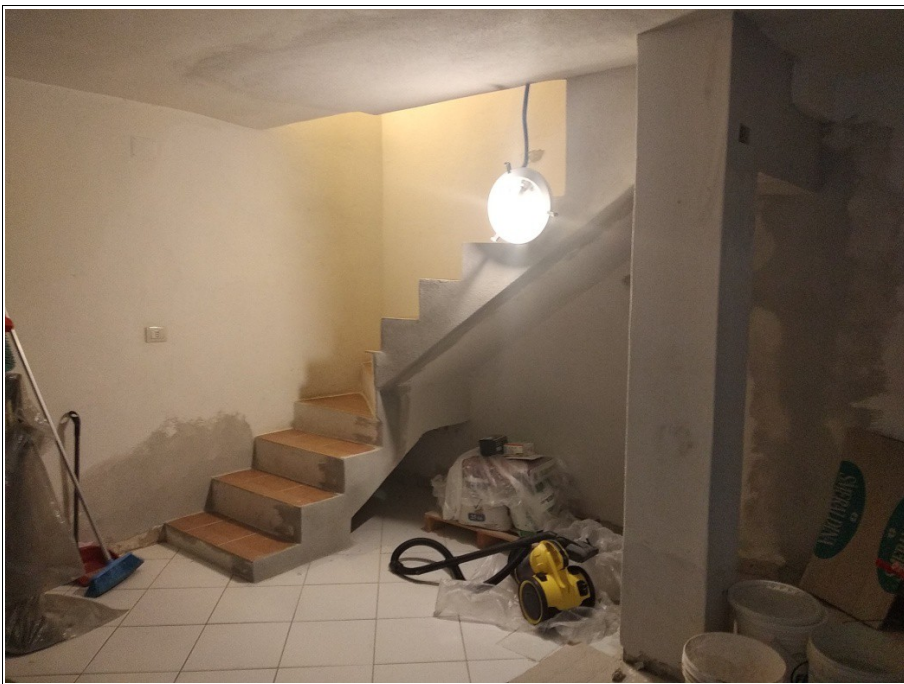
Figura 13: Scala interna - atto fotografico realizzato dallo scrivente dalla cantina posta al piano seminterrato