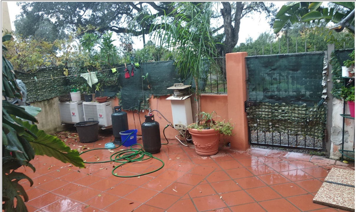
Figura 9 Inquadratura parziale e laterale della corte da cui si accede all'unità immobiliare della presente scheda - Scatto fotografico realizzato dallo scrivente dall'ingresso dell'appartamento verso la via Monsignor Virgilio