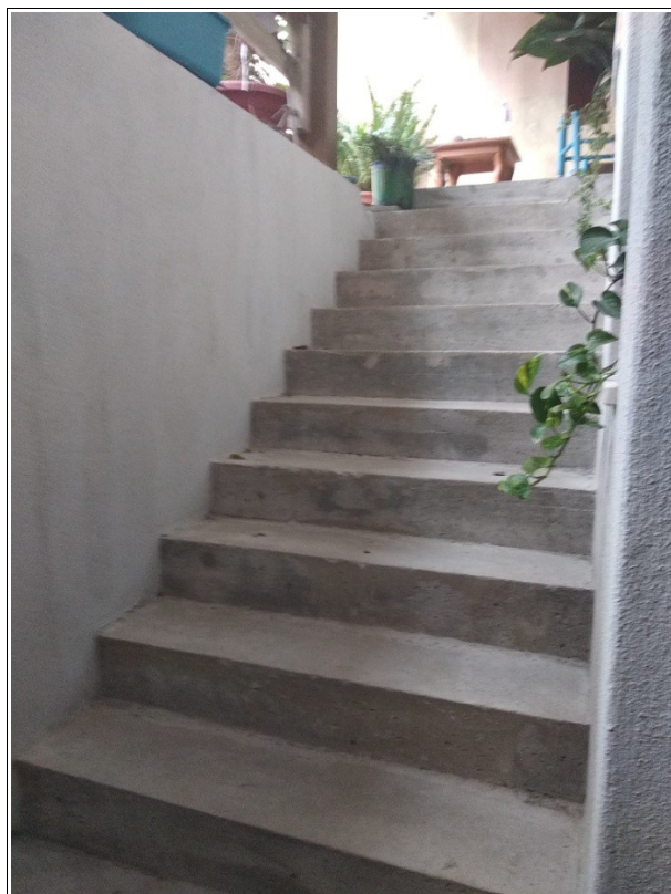
Figura 14: Scala esterna che collega la corte del piano terra con la cantina posta al piano seminterrato - N° 2 scatti fotografici realizzati dallo scrivente