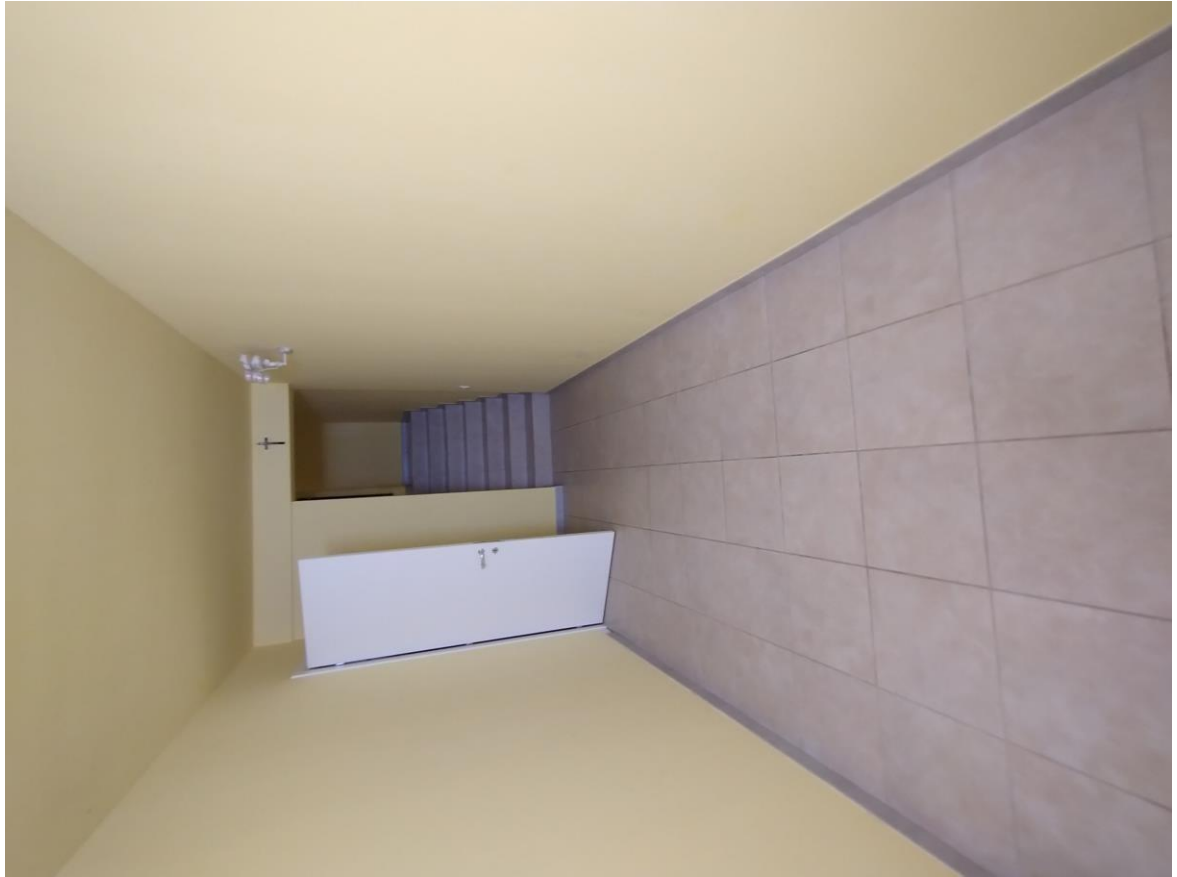
Foto n° 4 - Scala interna di collegamento Piani Terra e Primo - Sub 7