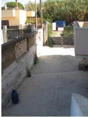
Figura 9 cortile comune di accesso di cui al sub 6 della particella 1496 del foglio 25