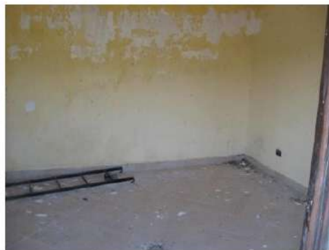
Figura 18 camera da letto 1