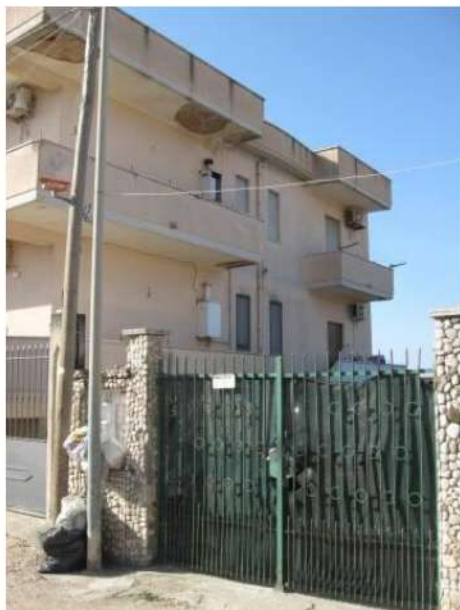
Figura 7 facciata nord del fabbricato a cui appartengono gli immobili pignorati

L'appartamento al secondo piano con accesso dalla rampa di scale esterna è composto da una cucina, un disimpegno, un bagno, un ripostiglio, due camere da letto e due balconi; completa il LOTTO N.4 un cortile ed un deposito al piano terra pertinenziali [all. n. 41] (Figure 7 - 20).