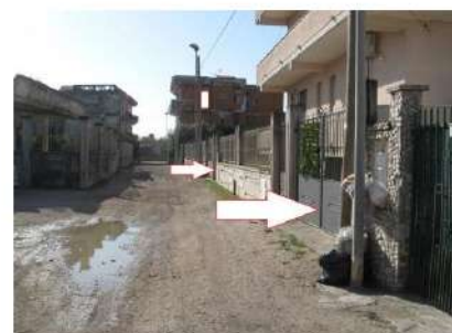
Figura 5 Accesso pedonale e carrabile dalla traversa di via Sancello snc in Mondragone

Il contesto in cui sorge il LOTTO N.4 è completamente urbanizzato, ovvero l'immobile è localizzato nella zona residenziale sud/ovest del Comune di Mondragone a pochi metri dal mare e della spiaggia ed a pochi chilometri dalla SS 7 quater che collega il Comune di Mondragone con i Comuni limitrofi di Castel Volturno e Cellole (Figura 6).