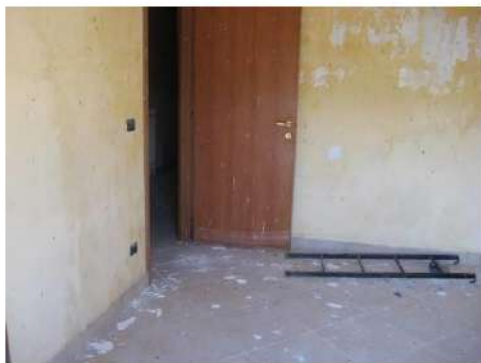
Figura 17 camera da letto 1