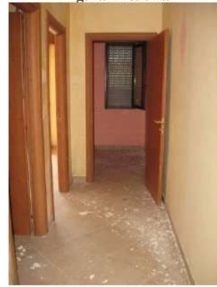
Figura 14 disimpegno