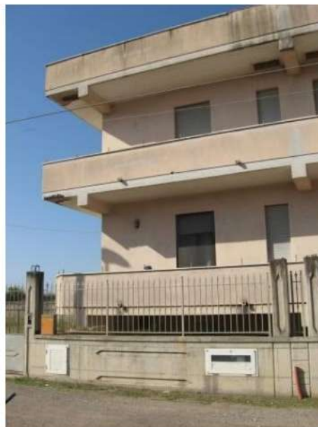
Figura 8 facciata est del fabbricato a cui appartengono gli immobili pignorati