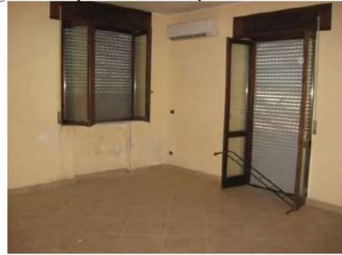
Figura 12 cucina