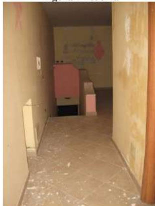
Figura 13 disimpegno