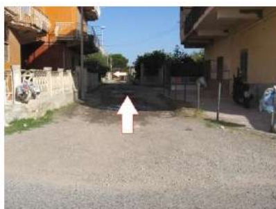
Figura 4 traversa di via Sancello in Mondragone