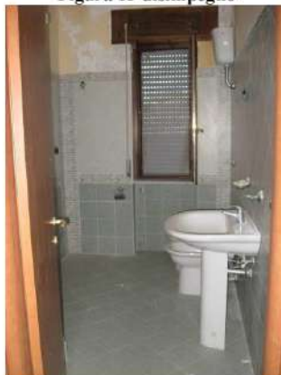
Figura 15 bagno