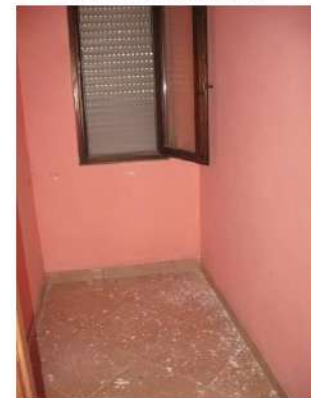
Figura 16 ripostiglio