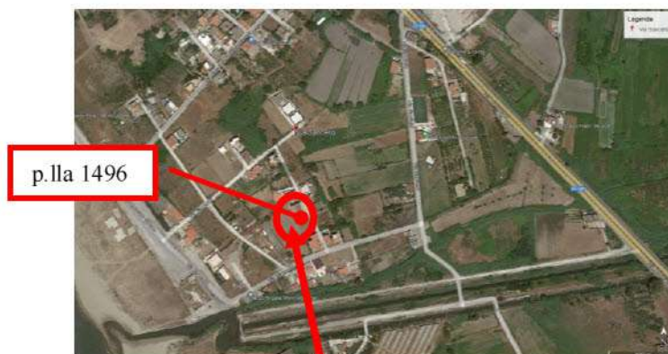
Figura 1 Localizzazione dei beni pignorati

Inoltre, a seguito della sovrapposizione [all. n. 5] tra la foto satellitare e la mappa catastale elaborata dalla SOGEI [all. n. 6] , è stata riportata l'individuazione dei beni oggetto del pignoramento (Figure 1 e 2).