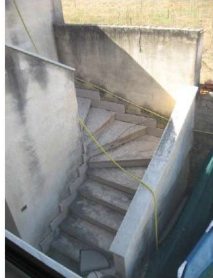
Figura 10 rampa di scale esterna per accesso al LOTTO N.4