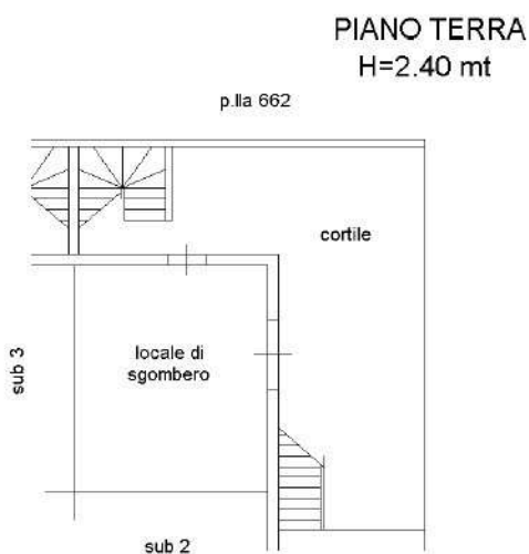
Figura 22 Planimetria catastale del piano terra del Lotto N.4

Il LOTTO N.4 è dotato della planimetria catastale [all. n. 43] cui è conforme lo stato dei luoghi, a meno dell'assenza del muro divisorio del deposito al piano terra da quello confinante di cui al sub 2 e della presenza del vano2 nel deposito al piano terra (Figure 22, 23) [all. n. 44].