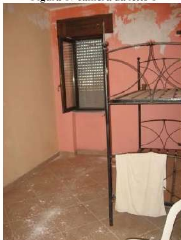
Figura 19 camera da letto 2