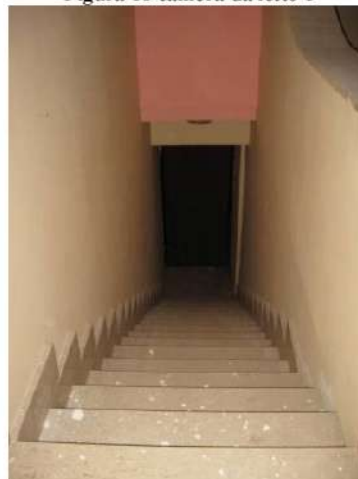
Figura 20 scala per accesso al secondo piano

Dalle planimetrie [all. n. 42] del LOTTO N.4, è possibile dedurre la superficie utile interna complessiva di 114,10 mq, così suddivisa tra i vari ambienti (Figura 21):