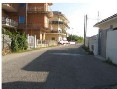
Figura 3 via Sancello in Mondragone

Tale LOTTO N.4 è situato in un fabbricato disposto nella zona residenziale sud/ovest del Comune di Mondragone con accesso dalla traversa di via Sancello; pertanto, è accessibile dai mezzi rotabili (Figure 3 - 5).