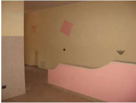
Figura 11 cucina