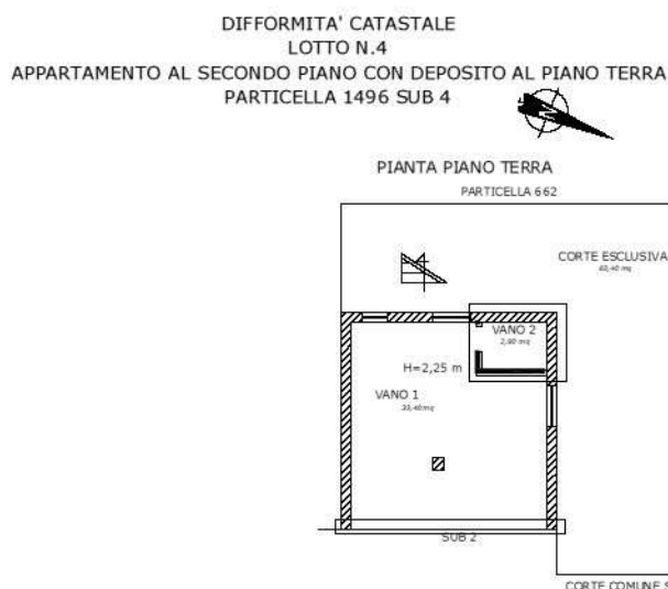
Figura 23 Planimetria delle difformità catastali del piano terra del Lotto N.4

Il costo necessario per l'aggiornamento della planimetria catastale con la procedura doc.fa, comprensivo degli oneri catastali e degli onorari professionali, è stimabile in € 500,00.