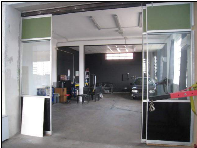
FOTO 10 ALTRA VISTA INTERNA PORZIONE DI CAPANNONE OGGETTO DI PROCEDURA.

LOTTO 3 U.I. MAPPALE 1191 SUB. 1 PIANO TERRA