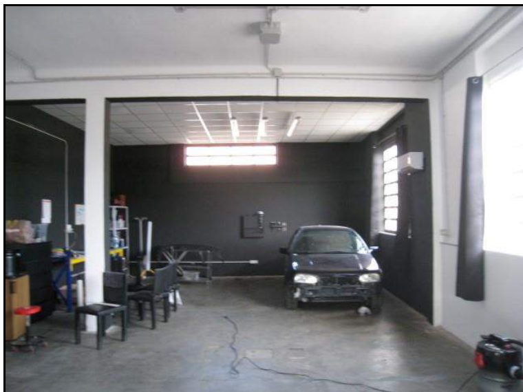
FOTO 11 ALTRA VISTA INTERNA PORZIONE DI CAPANNONE OGGETTO DI PROCEDURA.

LOTTO 3 U.I. MAPPALE 1191 SUB. 1 PIANO TERRA