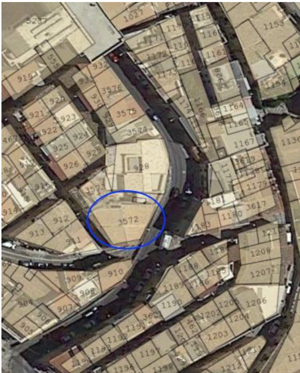
Foto satellitare con sovrapposizione dello stralcio catastale

I dati di identificazione catastale indicati nell'atto di pignoramento (Comune Censuario, foglio, part.lla e sub) corrispondono con le risultanze catastali alla data del pignoramento ( vedi visura catastale storica in allegati 3 ). Per quanto riguarda la conformità catastale si rimanda a quanto avanti relazionato al quesito n. 3 .