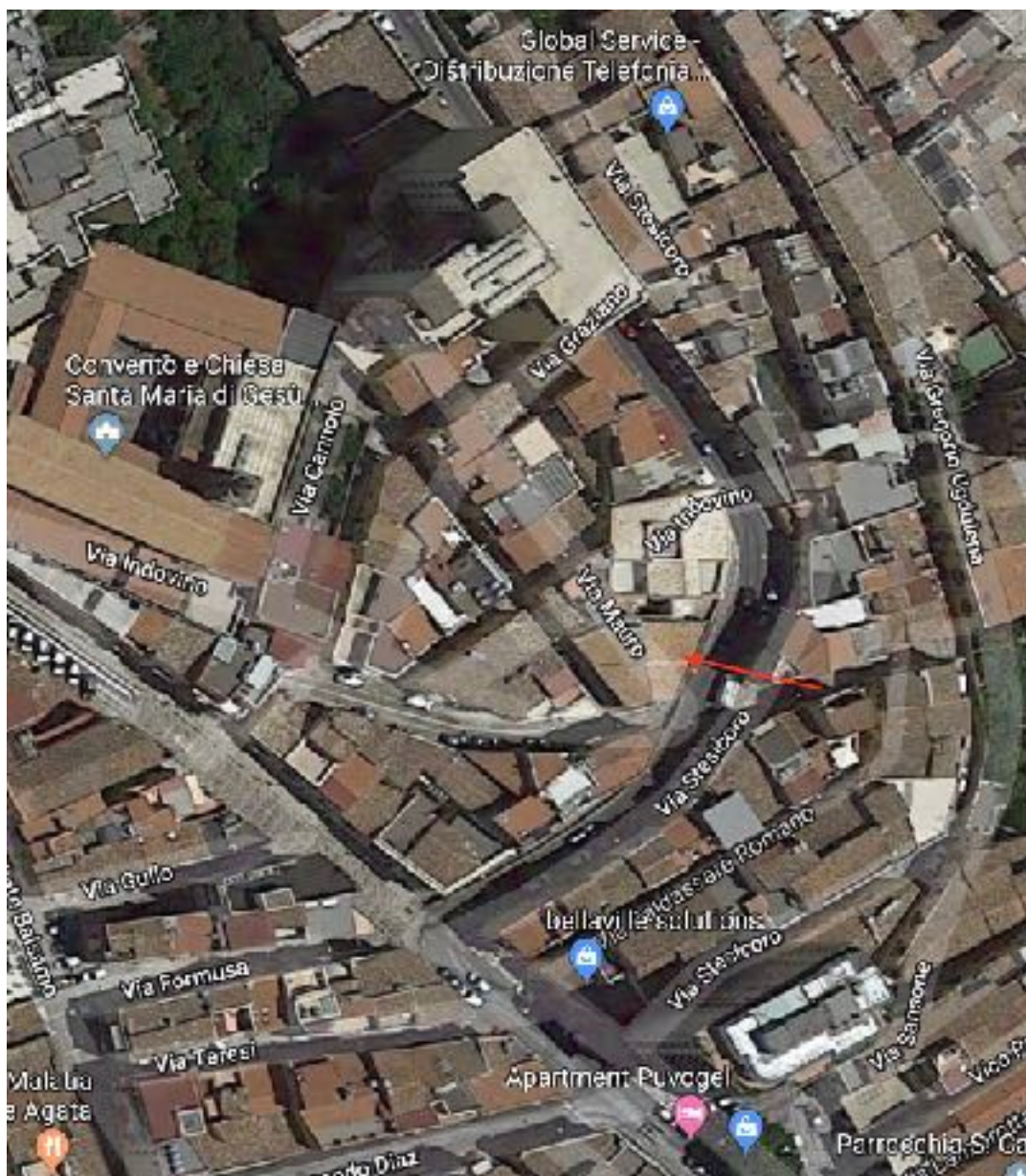
Foto satellitare estratta da Google Maps

Lo stesso di antica costruzione, costituito da due elevazione fuori terra rispetto la strada, il lotto presenta strutture portanti in muratura e rifiniture del tipo civile.