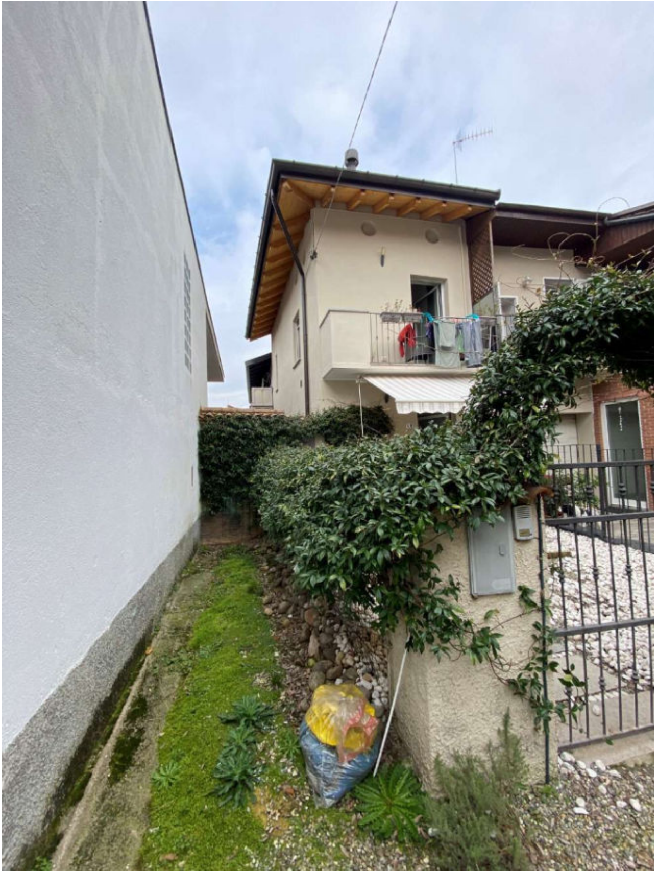
ALTRA VISTA IDENTIFICATIVA LA SERVITU' COME INDICATA NELLA PLANIMETRIA CATASTALE