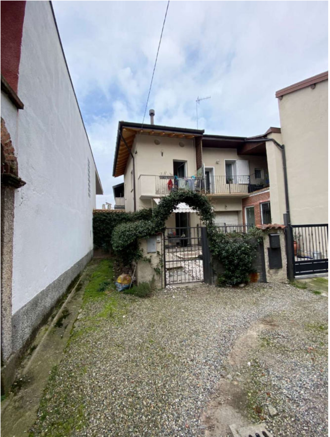
VISTA AREA ESTERNA DESCRITTIVA INGRESSO E ZONA SOGGETTA A SERVITU' COME INDICATA NELLA PLANIMETRIA CATASTALE