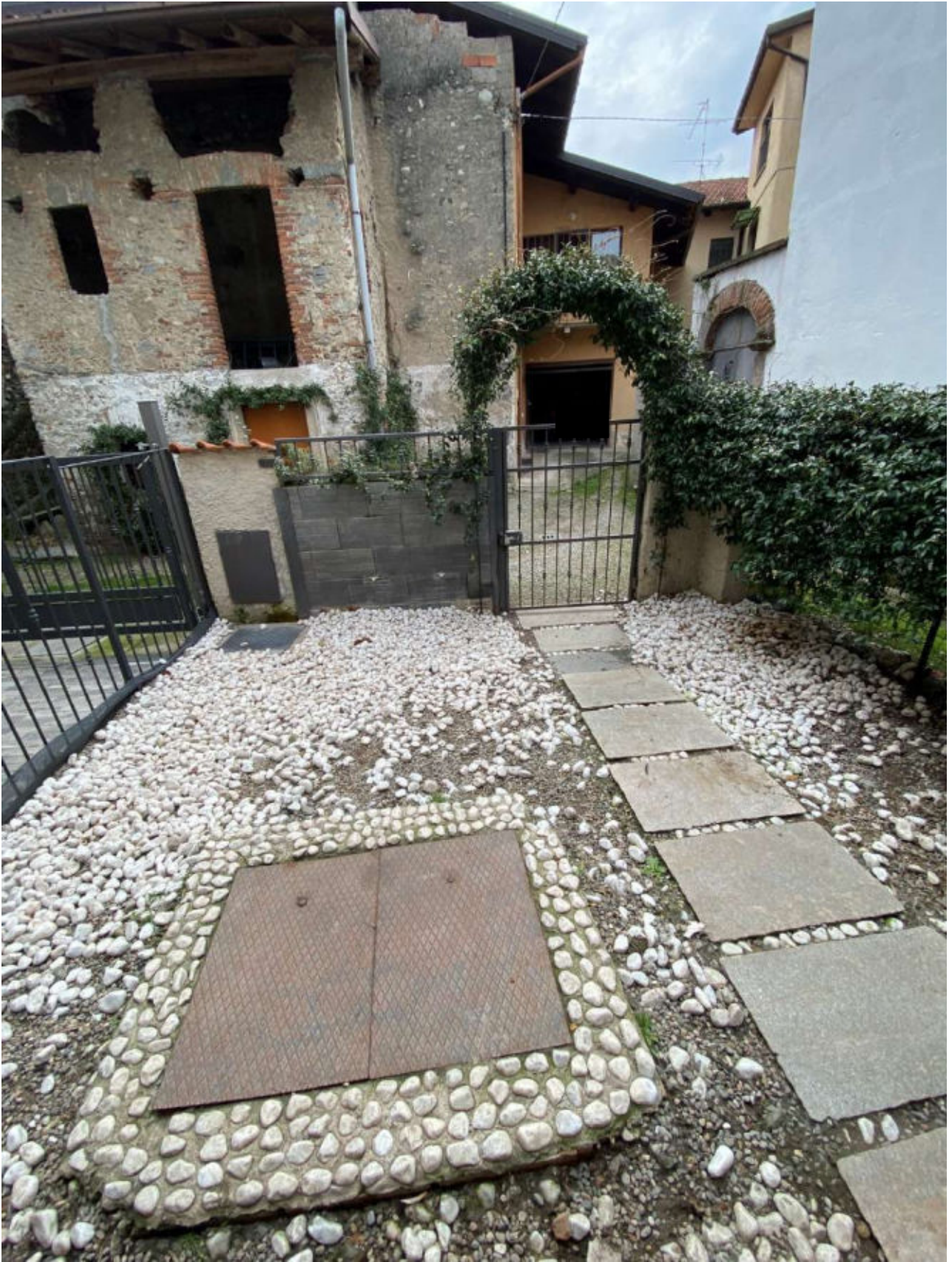
VISTA SISTEMAZIONE AREA IN PROPRIETA' A SERVIZIO DELL' ABITAZIONE