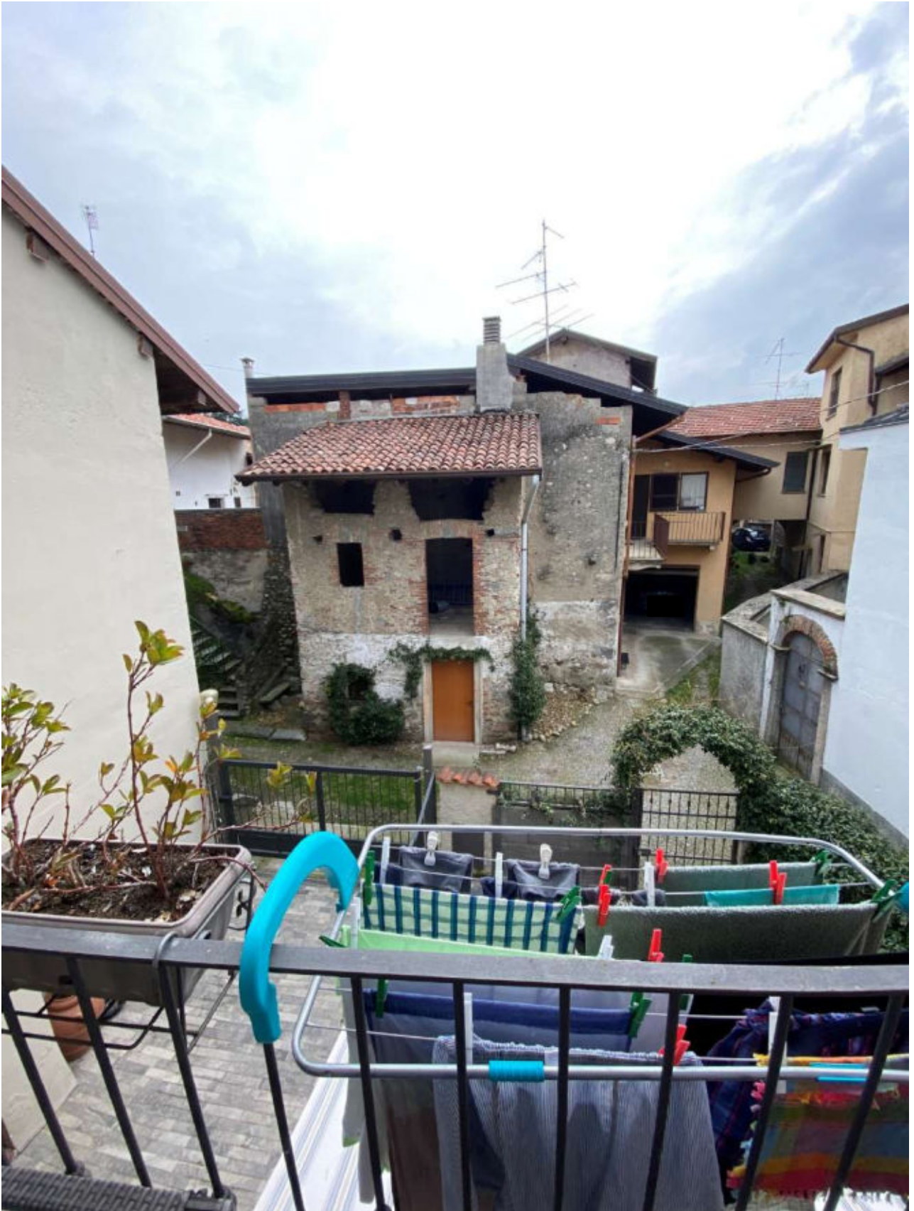
DOCUMENTAZIONE FOTOGRAFICA RELATIVA ALL' ABITAIZONE