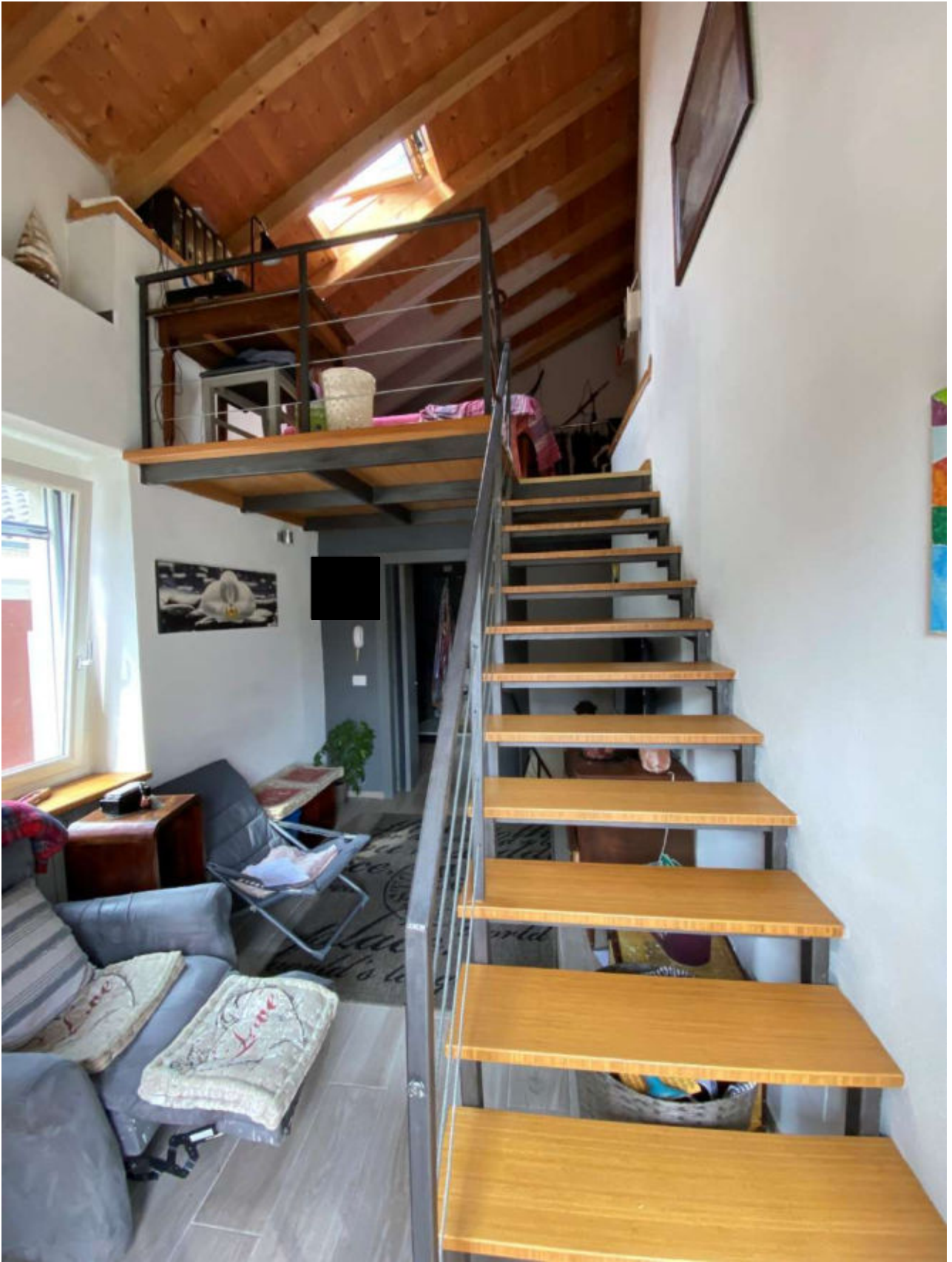
PIANO PRIMO E SCALA COMUNICANTE CON SOPPALCO