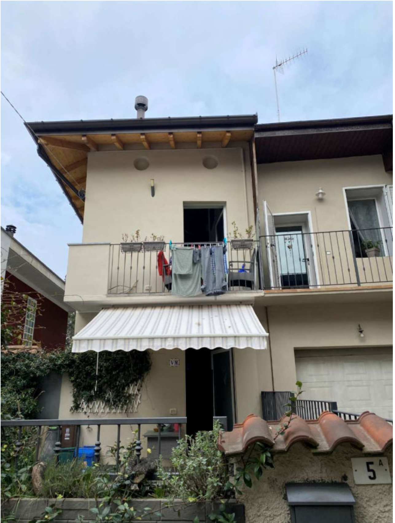
ALTRA VISTA ESTERNA FACCIATA PRINCIPALE EDIFICIO