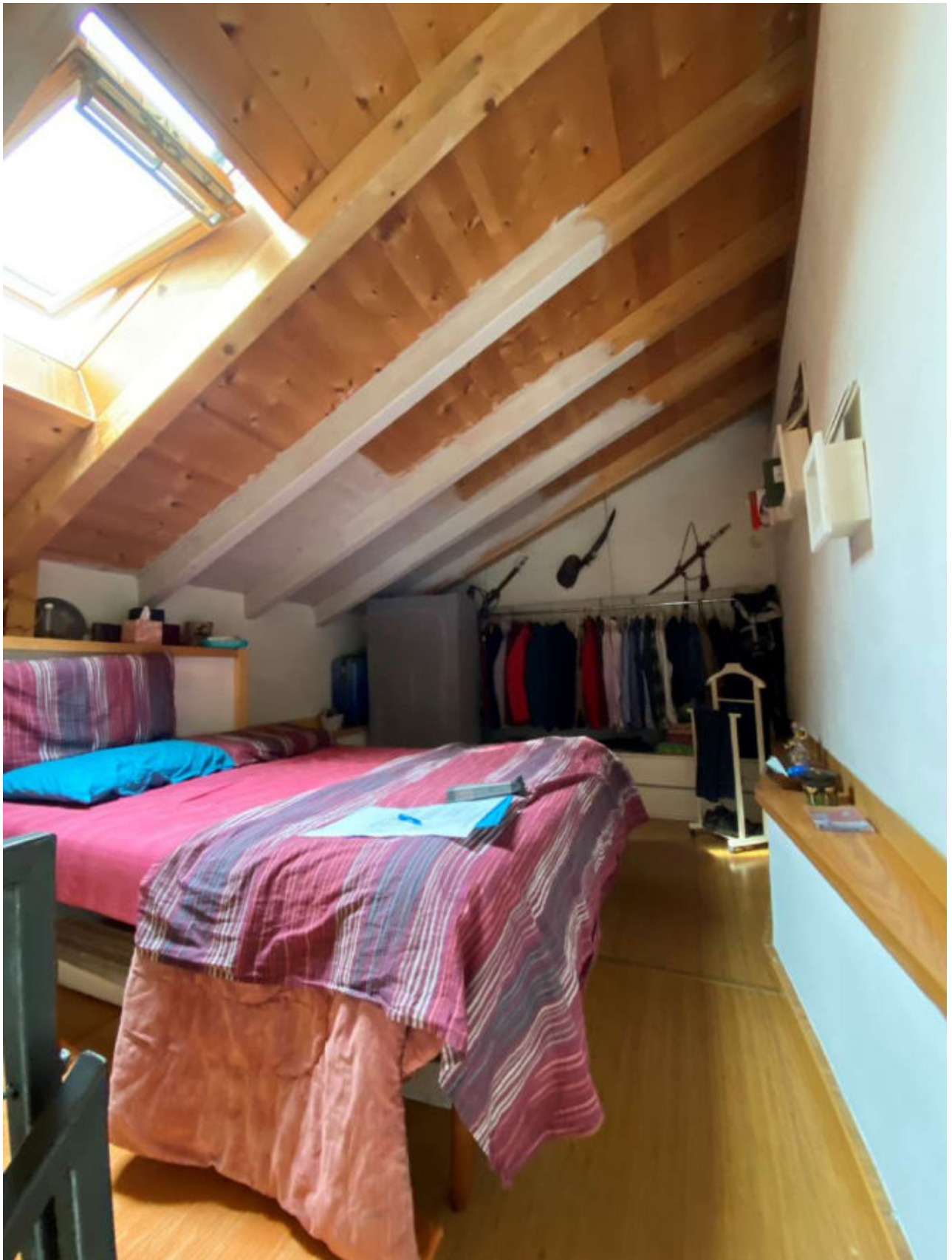
ZONA SOPPALCO A DESTINAZIONE RIPOSTIGLIO ALLESTITA COME CAMERA