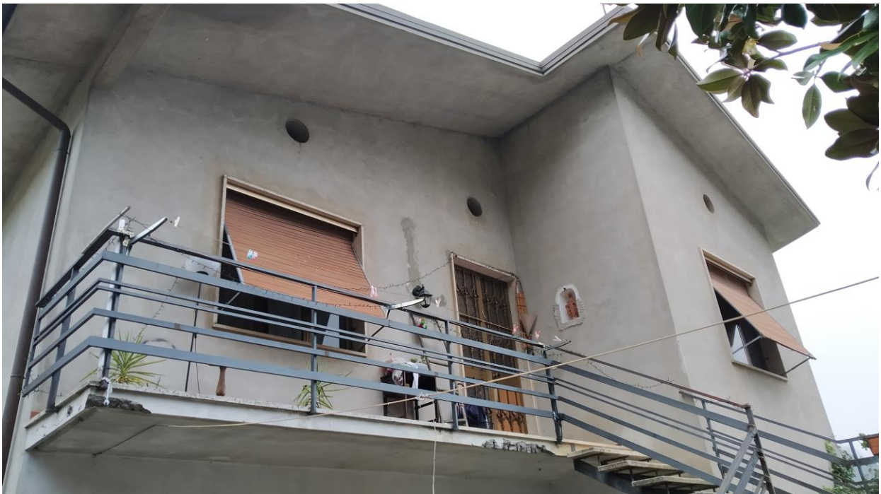
Particolare prospetto (lato Sud)