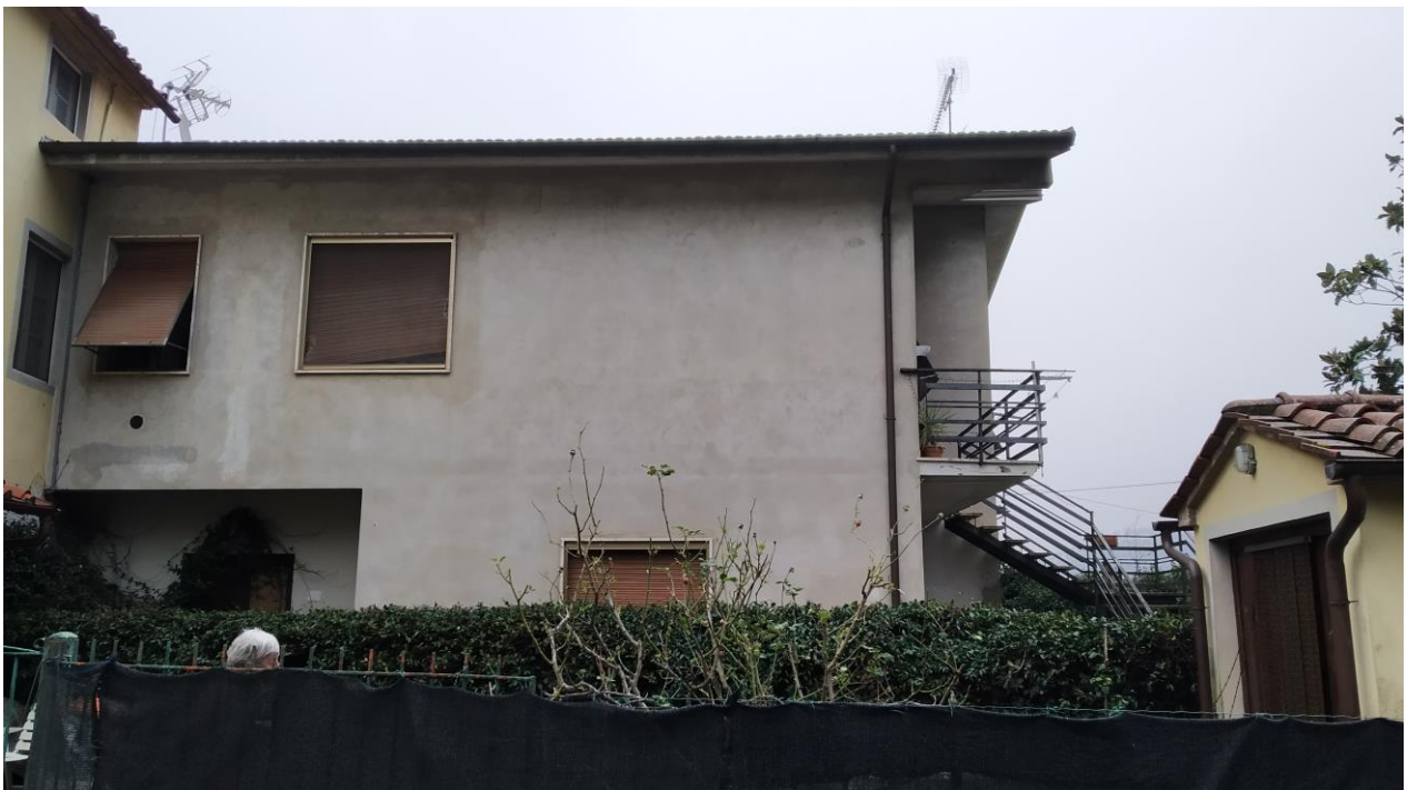
Prospetto (lato Ovest)