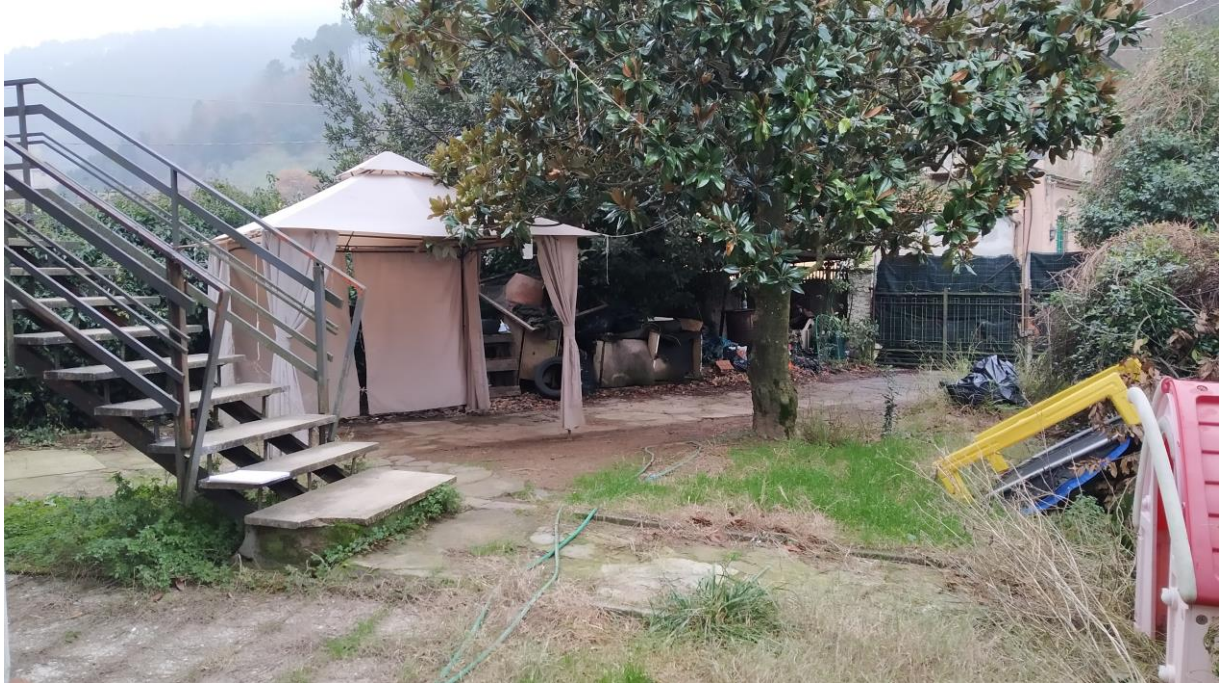
Resede comune (lato Sud)