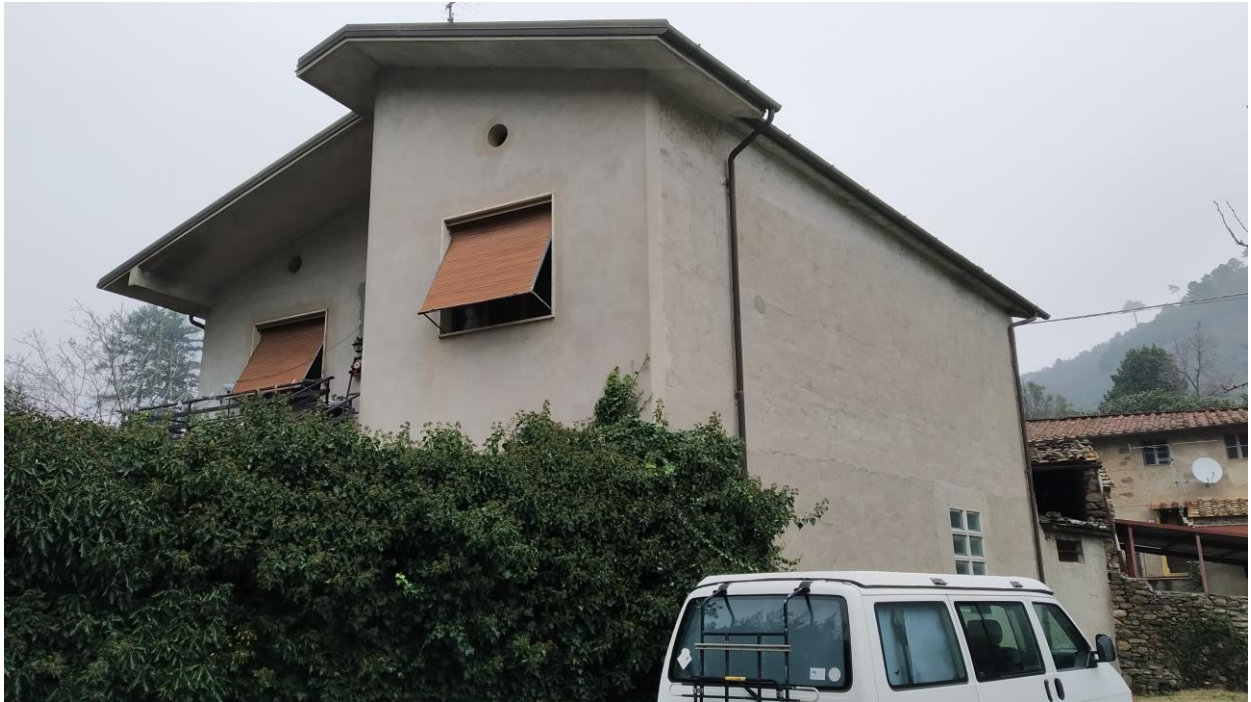
Prospetto (lato Sud-Est)