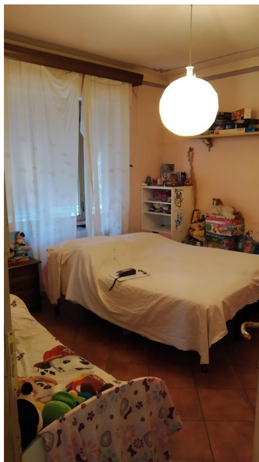
Sala (adibita a camera)