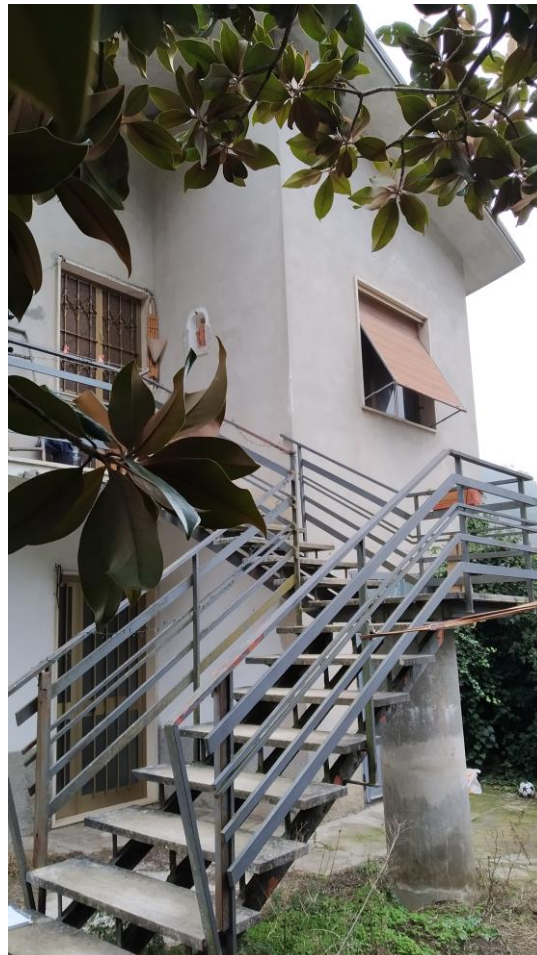
Particolare scala di accesso (lato Sud)