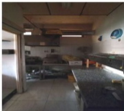
FOTO 11 - CANTINA