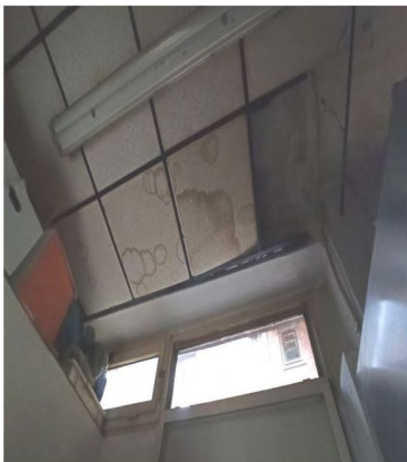
FOTO 18 - INFILTRAZIONE SU SOLAIO E CONTROSOFFITTO