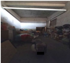
FOTO 3 - VISTA INTERNA AL DEPOSITO