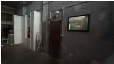
FOTO 28 – DEPOSITO: VISTA INTERNA CON PORTA VERSO ALTRO MAGAZZINO NON OGGETTO DI VENDITA