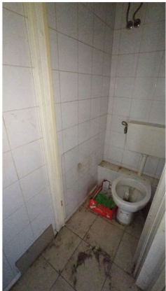
FOTO 16 - WC