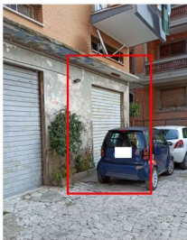
FOTO 2 -VISTA SERRANDA D'ACCESSO AL BENE