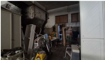
FOTO 29 – DEPOSITO: VISTA INTERNA CON PORTA VERSO IL LOCALE CALDAIA