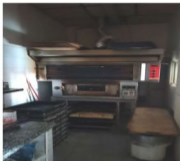
FOTO 13 - CUCINA