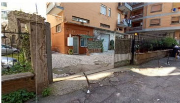
FOTO 3 – VISTA CANCELLO D'ACCESSO DA VIA SECONDARIA LARGO PARADISO (EX ORTI DEL PARADISO)