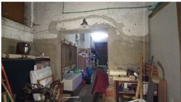
FOTO 4 – VISTA DELL'APERTURA DI COLLEGAMENTO DAL BNE 3 (DEPOSITO PART. 877, SUB. 503)