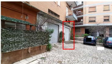
FOTO 1- VISTA DALL'AREA ESTERNA