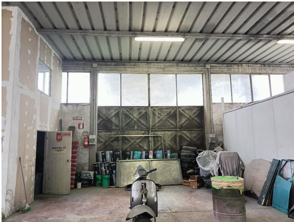
Foto n.12: Particolare interno con la porta di accesso al deposito vernici.