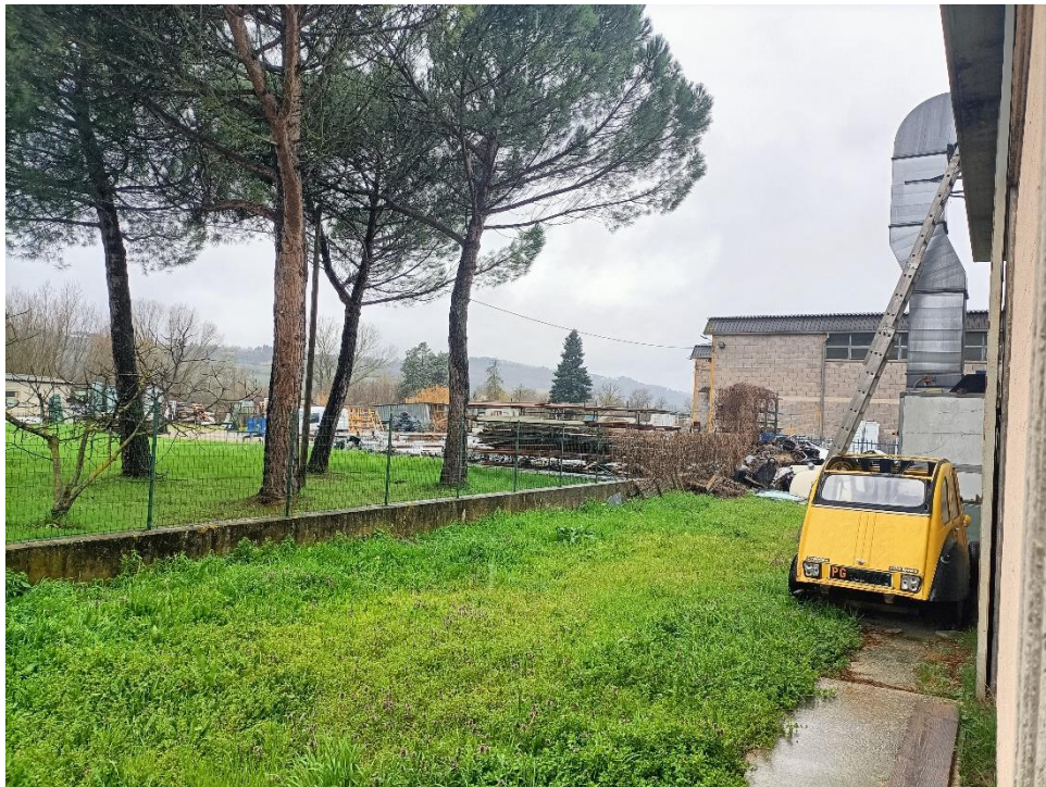
Foto n.6: Particolare della corte esclusiva posta sul retro del capannone delimitata da muretto e rete.