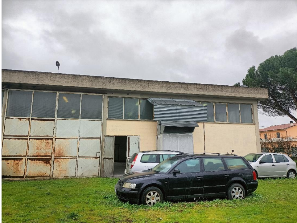
Foto n.7: Particolare del prospetto ovest del capannone dove è visibile la porzione eseguita dotata di porta per l'accesso pedonale dalla corte esclusiva.