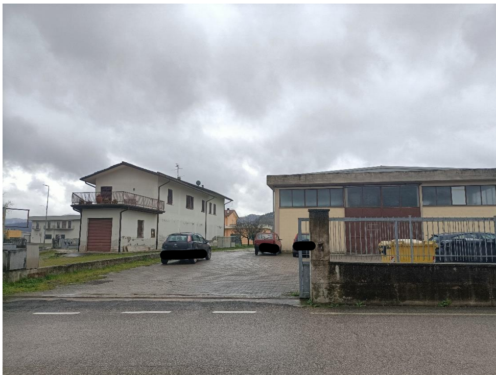
Foto n.1: Veduta dell'accesso dalla pubblica via Leonardo da Vinci al bene oggetto di esecuzione costituito da porzione di un capannone di maggiore consistenza adibita a laboratorio artigianale al piano terra con ingresso indipendente e annessa corte ad uso esclusivo.