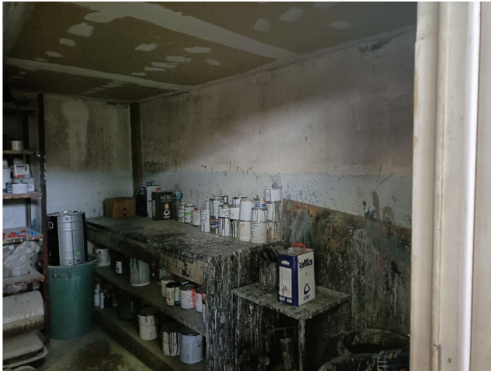
Foto n.13: Particolare interno del locale al piano terra adibito a deposito vernici.