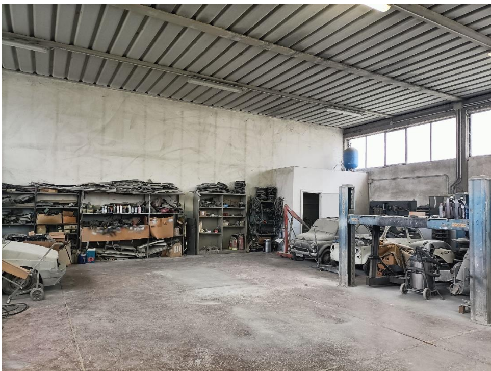
Foto n.10: Particolare interno. Sullo sfondo il bagno con disimpegno.