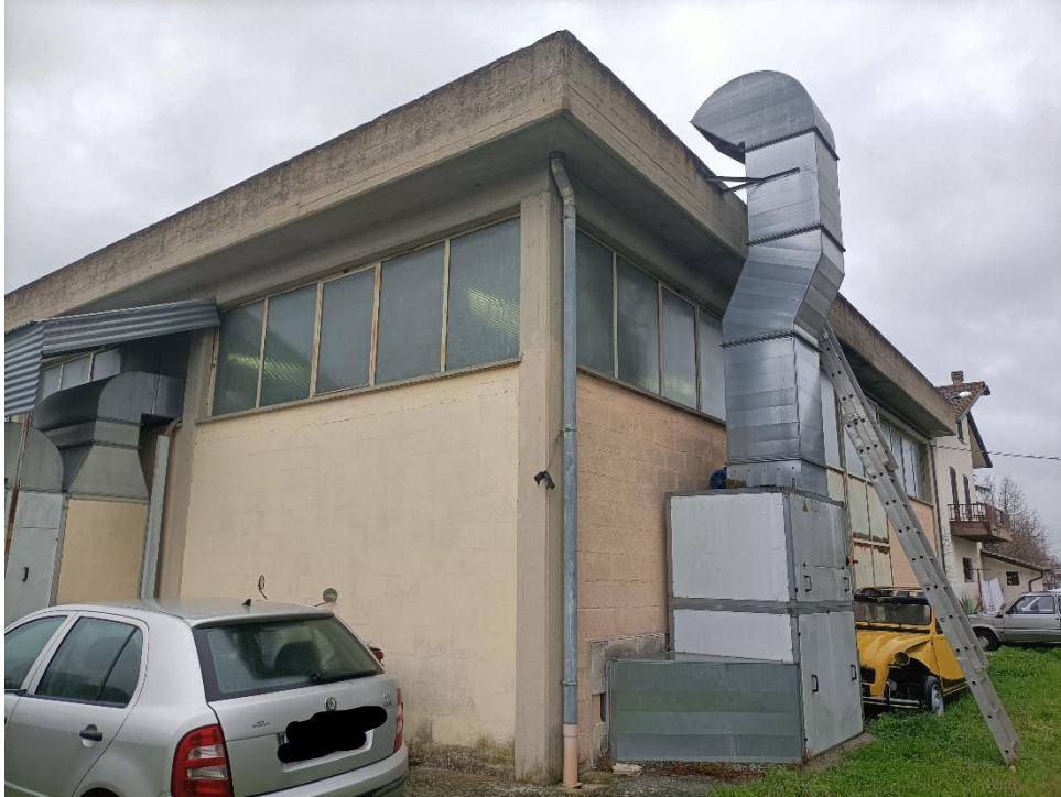
Foto n.5: Particolare dei prospetti sud ed ovest del bene esecutato con parte della corte esclusiva posta sul retro del capannone.