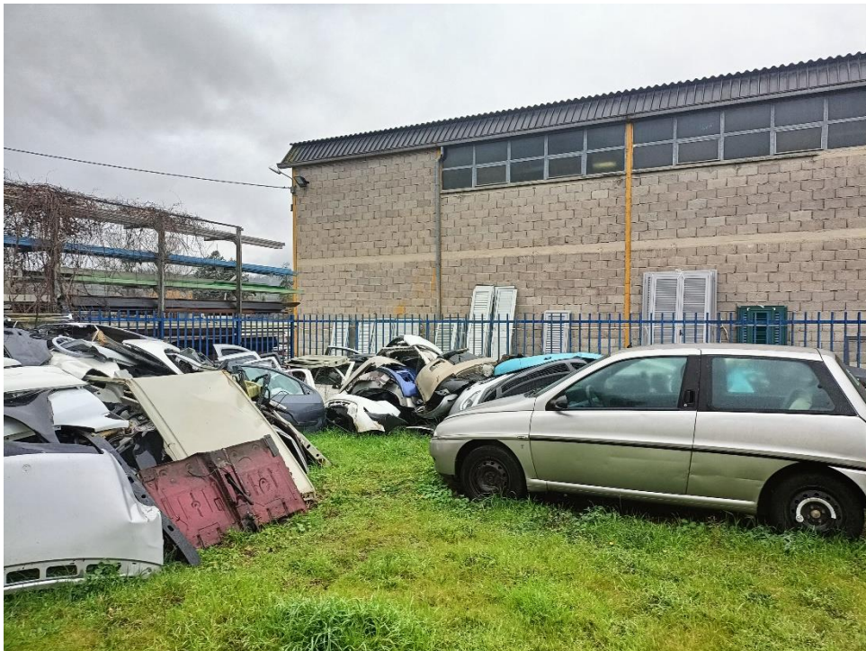
Foto n.8: Particolare della corte esclusiva in corrispondenza del prospetto ovest della porzione eseguita delimitata da muretto e ringhiera.