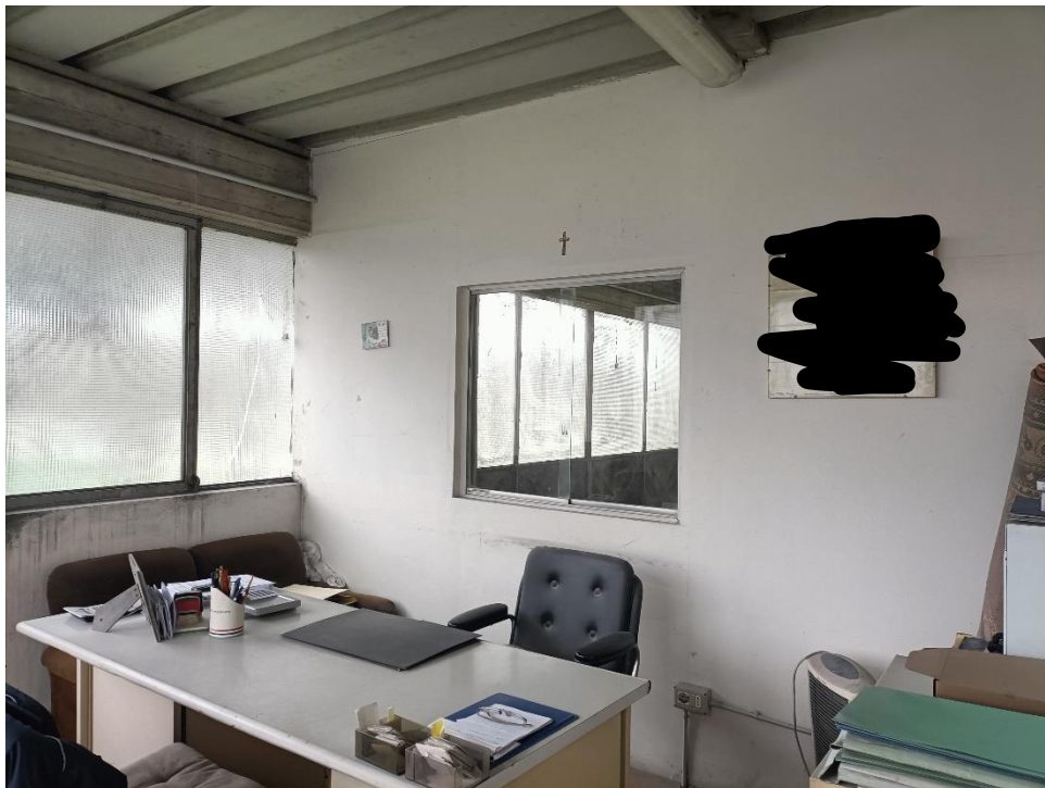
Foto n.14: Particolare del locale ripostiglio/ufficio al piano primo.