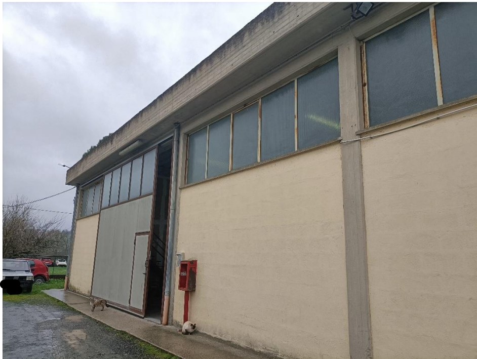
Foto n.4: Particolare della porzione eseguita e dell'accesso pedonale e carrabile delimitato da una porta scorrevole.