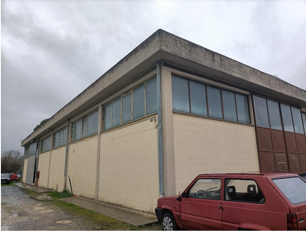
Foto n.3: Particolare dei prospetti nord ed est del capannone cui appartiene la porzione eseguita di cui è visibile la porta scorrevole di accesso (a sinistra nella foto posta nel fondo del prospetto est).