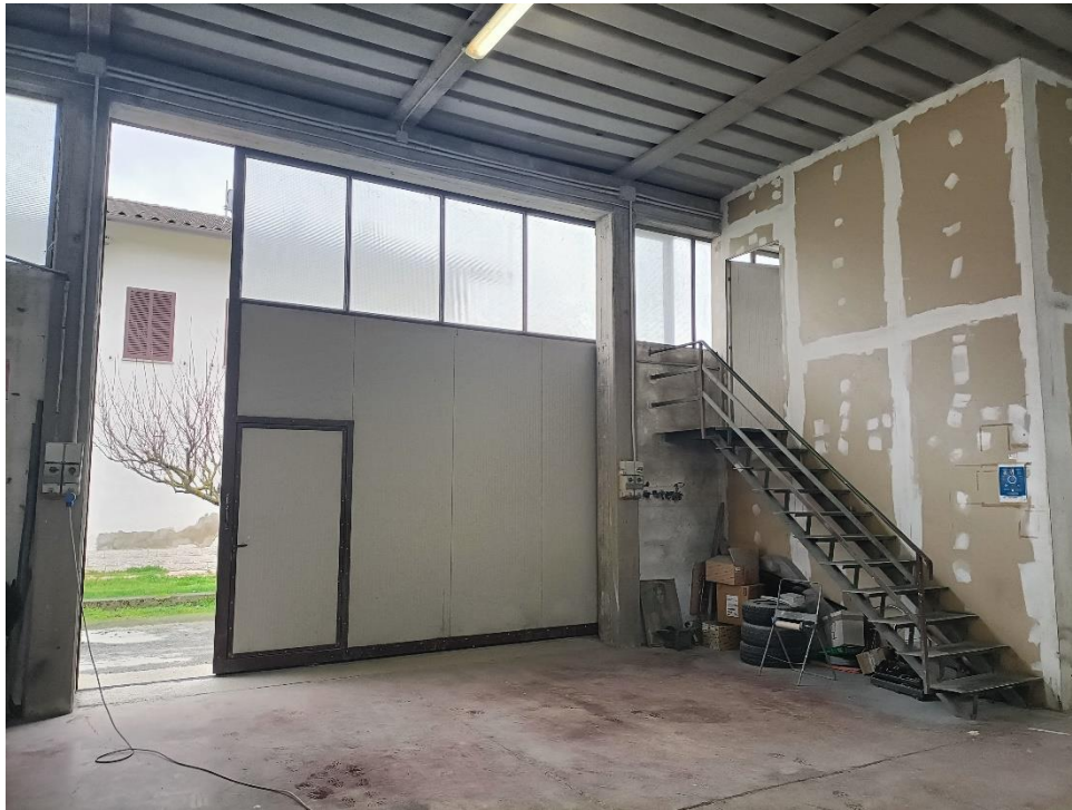
Foto n.9: Particolare interno. Sulla destra il vano su due livelli realizzato con pareti in cartongesso.