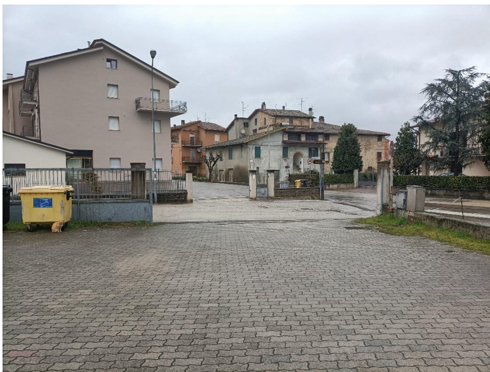
Foto n.2: Particolare dell'accesso, delimitato da cancello scorrevole, ripreso da angolazione opposta alla precedente.