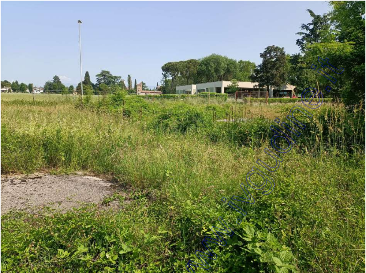
vedute della platea in c.a. e del corpo al grezzo ricadente in parte sul terreno oggetto di stima