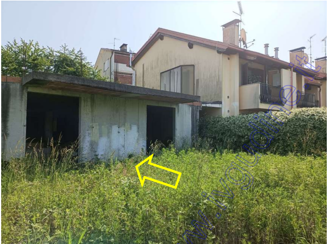
dettaglio del fabbricato al grezzo ricadente in parte sul bene Foglio 13 particella 641 sub 34