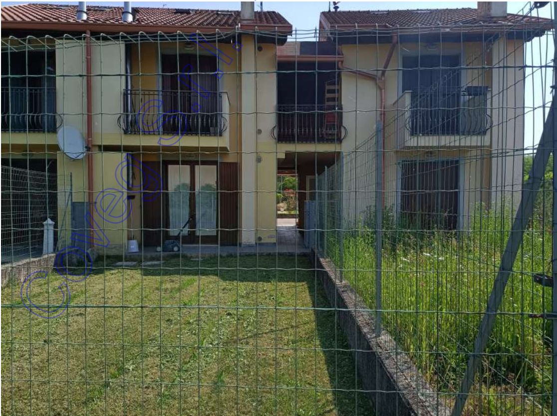
veduta delle ville a schiera poste a confine