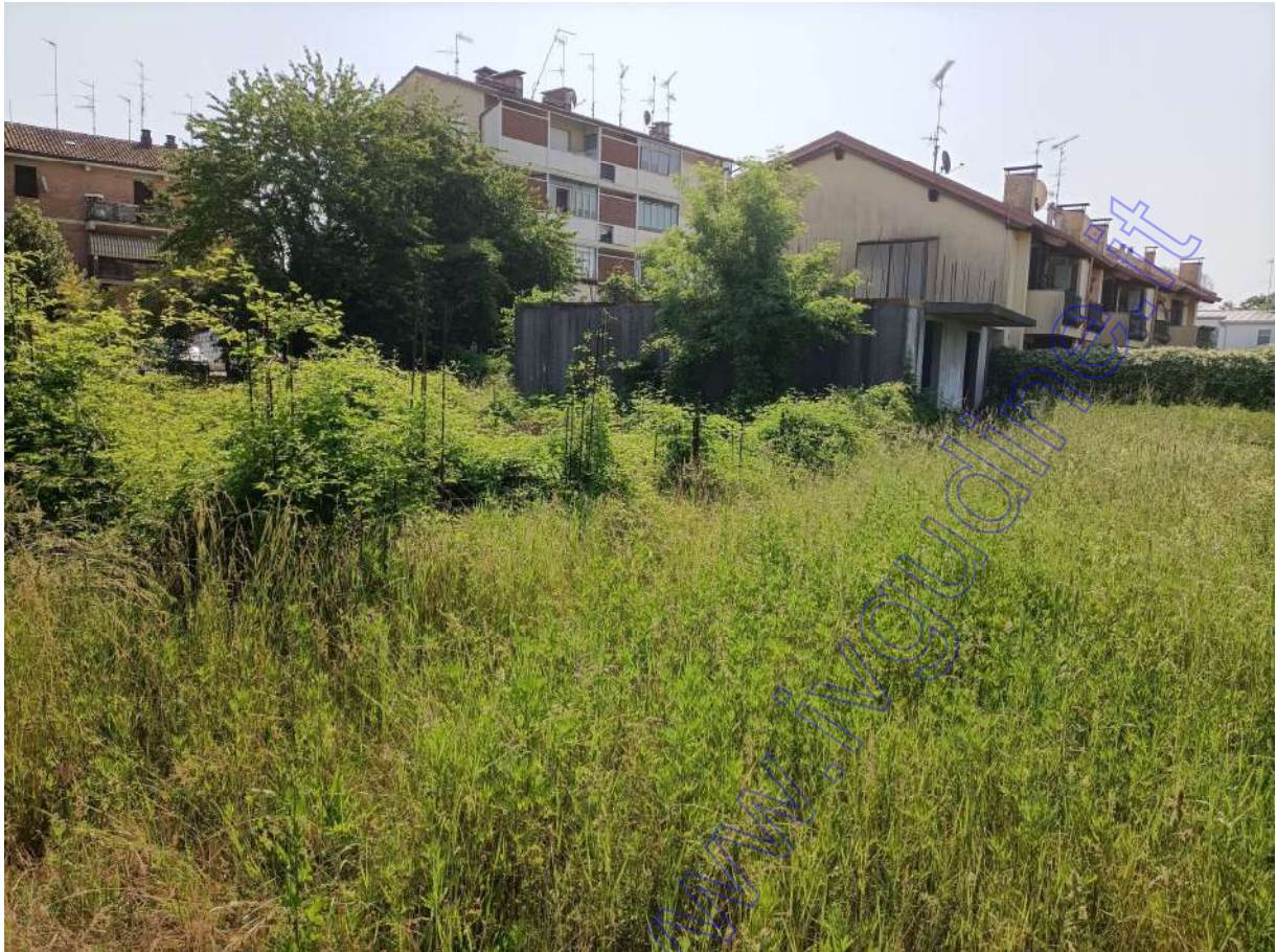
vedute della platea in c.a. e del corpo al grezzo ricadente in parte sul terreno oggetto di stima