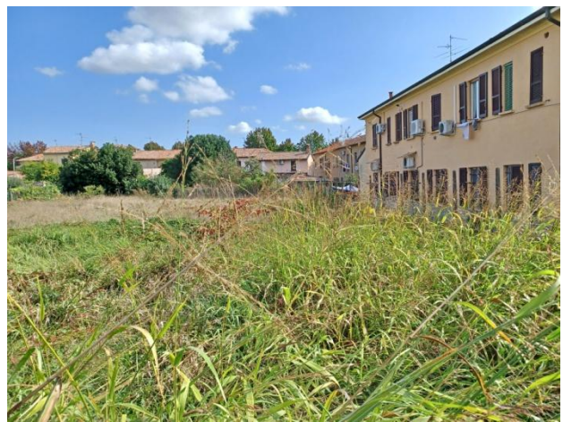
Mapp. 65, vista da O