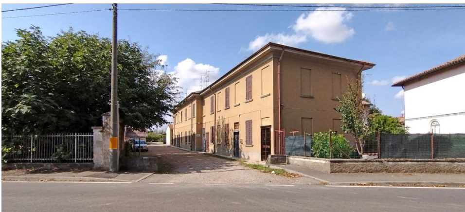
Via Fossarmato, strada laterale a fondo chiuso