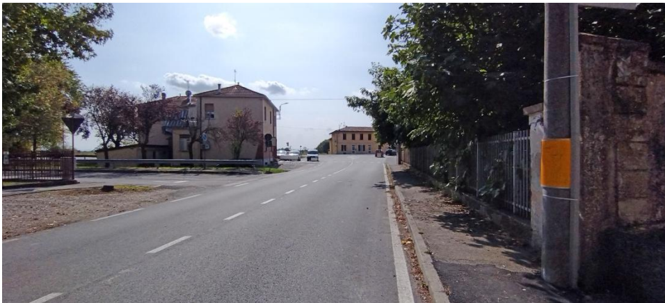
Accesso a Via Fossarmato da SP235