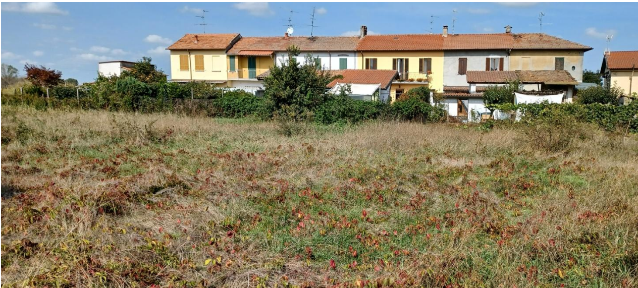
Mapp. 65, confine N