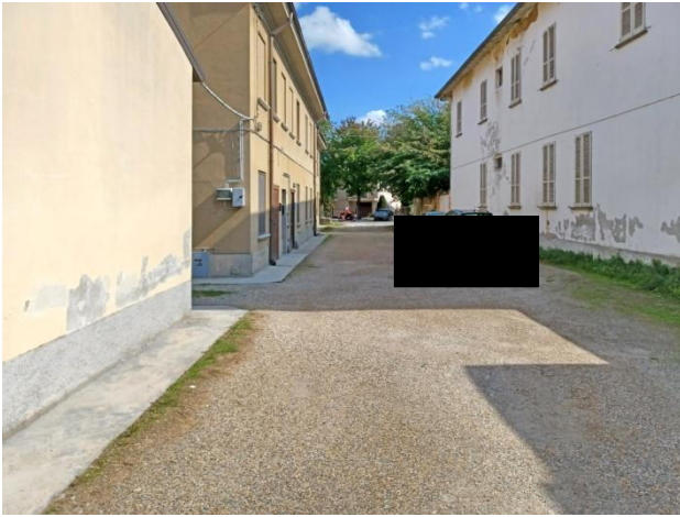
Via Fossarmato, controcampo