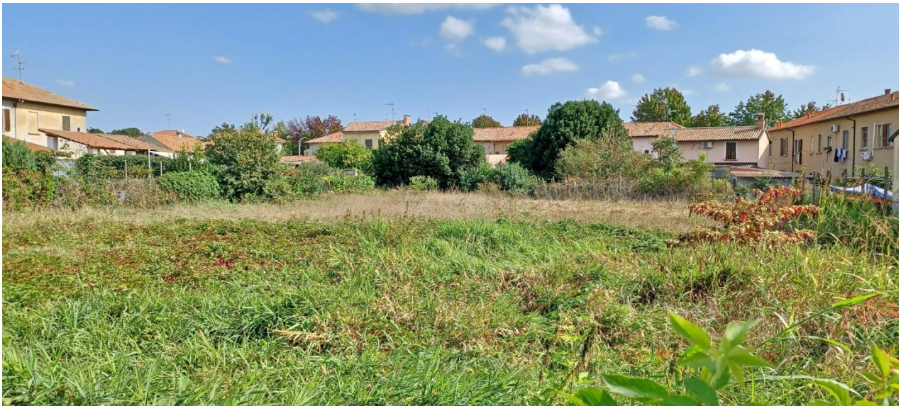
Mapp. 65, confine E