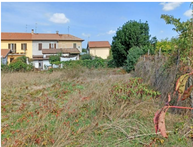
Mapp. 65, vista da S/E