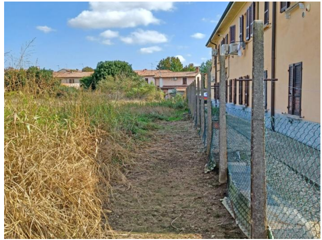
Mapp. 65, recinto lato S