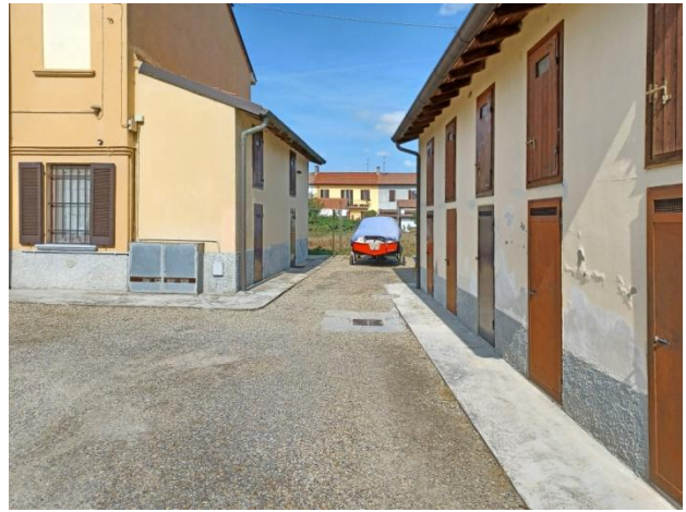
Via Fossarmato, accesso al Mapp. 65