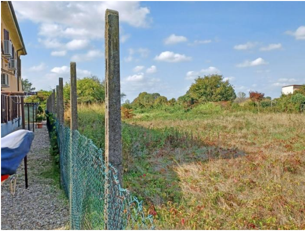
Mapp. 65, vista da S/O