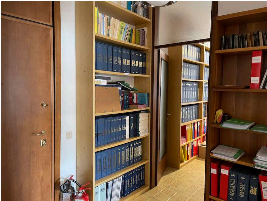
02. Ingresso e corridoio