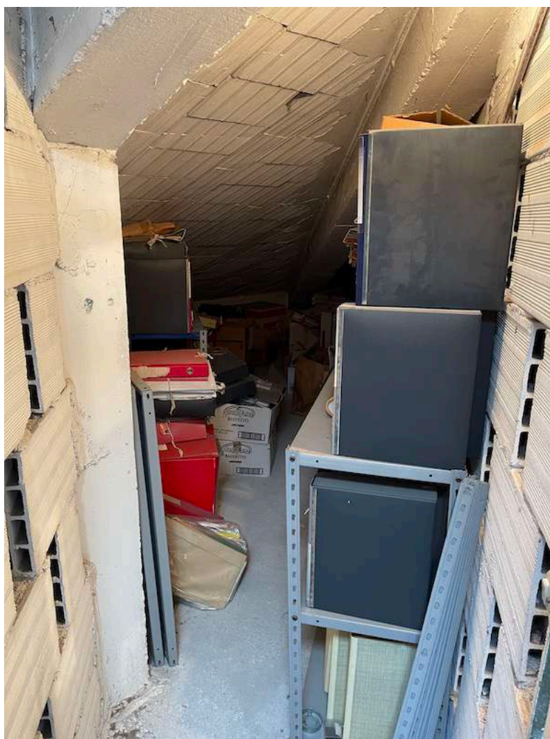
10. Soffitta utilizzata n. 9