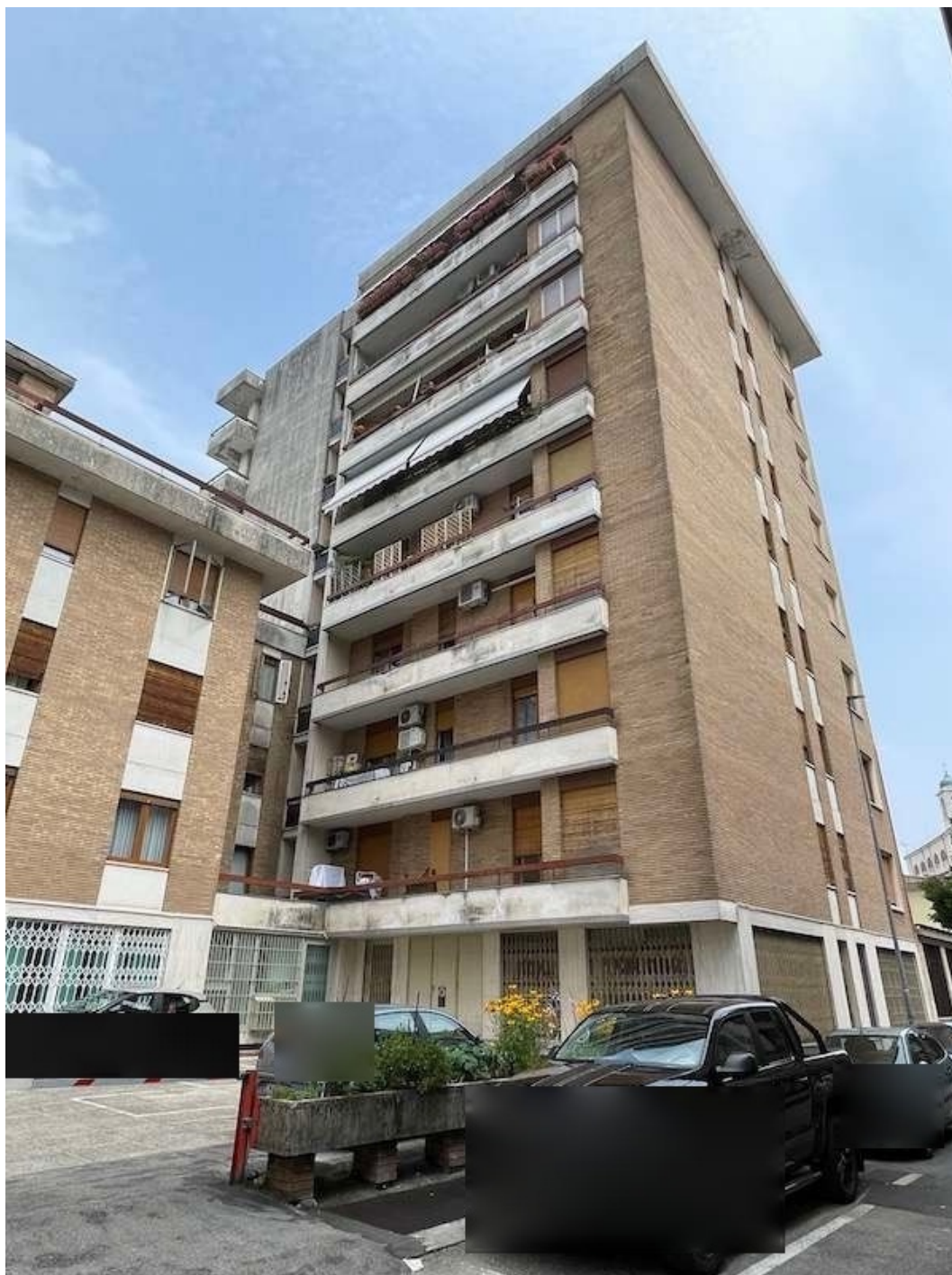
01. Prospetto Sud-Ovest