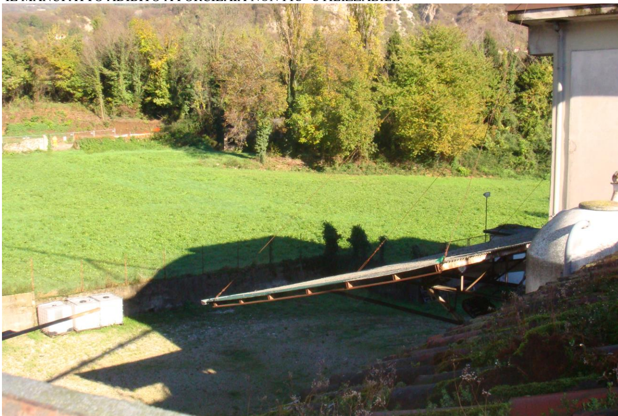
IL LOTTO DI TERRENO VISTO DALL'ALTO