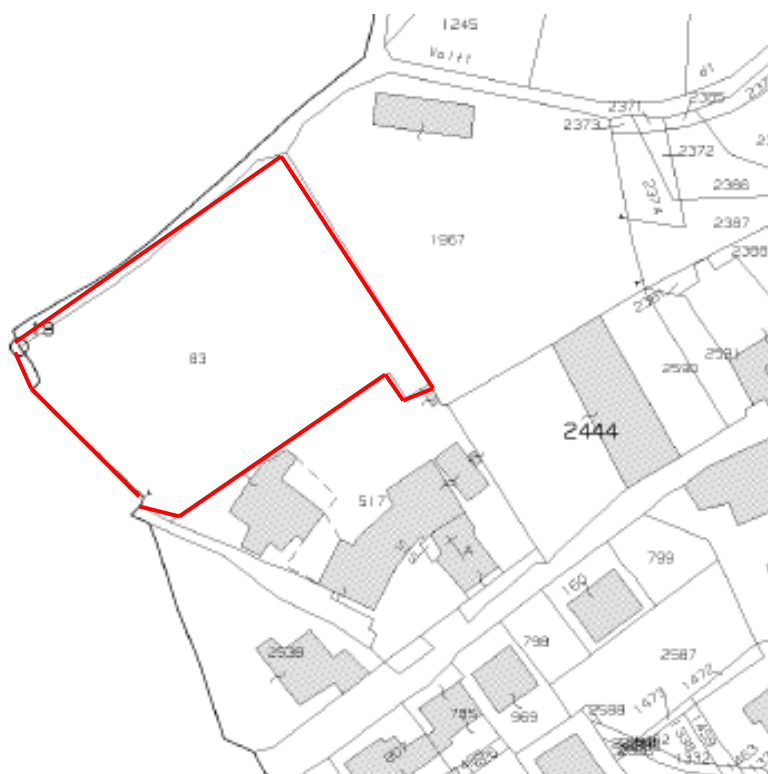
Estratto di mappa