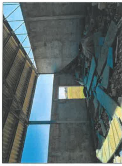
FOTO 18 - Capannone