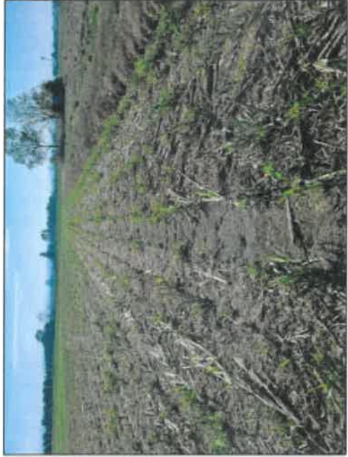
FOTO 07 - PSeminativo