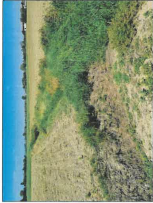
FOTO 13 - Fosso di bonifica