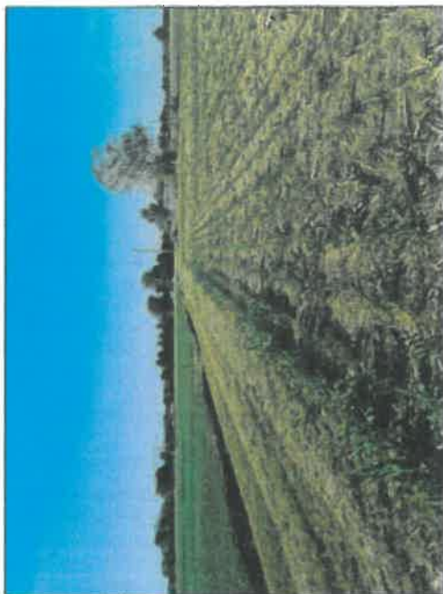
FOTO 03 - seminativo