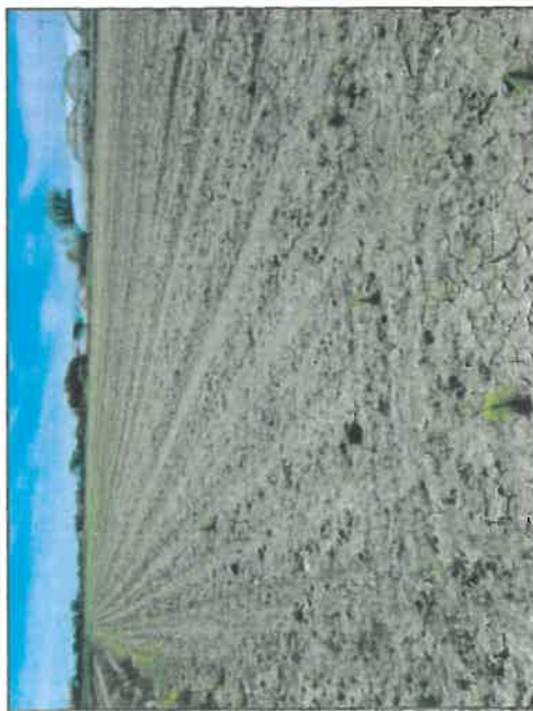
FOTO 01 - Podere agricolo