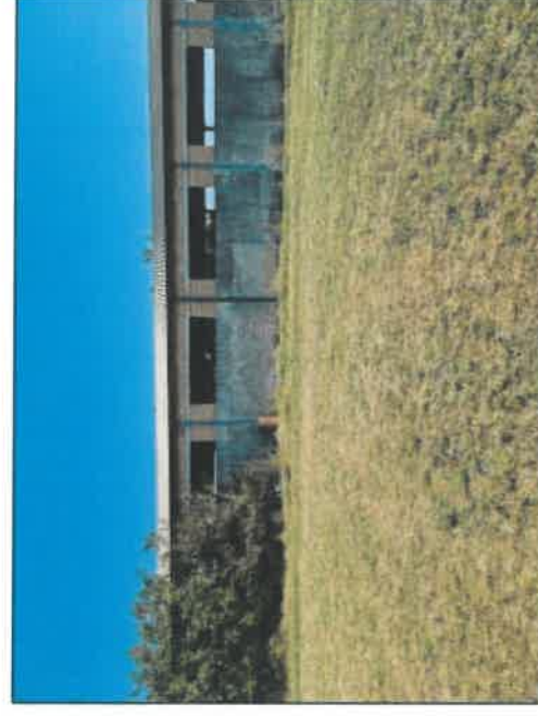
FOTO 12 - Fronte laterale