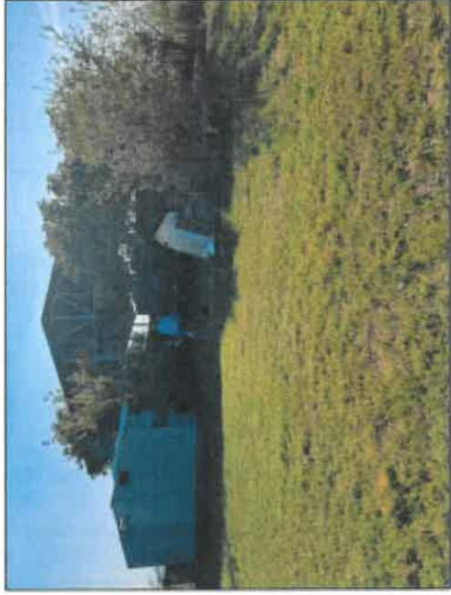
FOTO 22 - Capanno agricolo