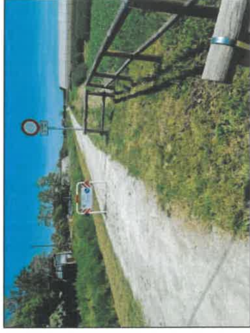
FOTO 06 - Viali d'accesso priv.