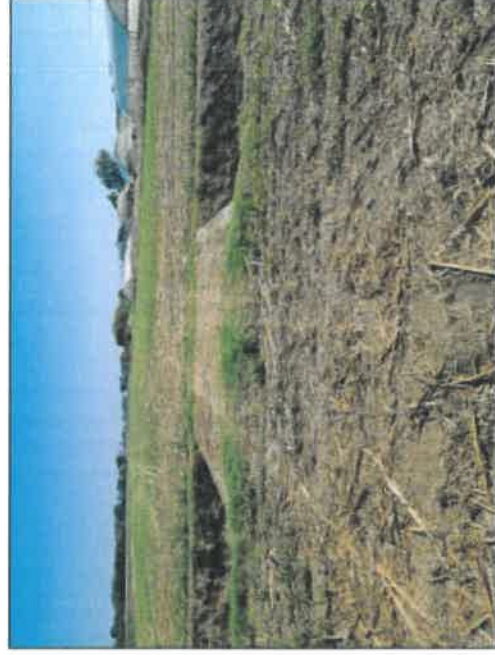
FOTO 14 - Passaggio carrabile