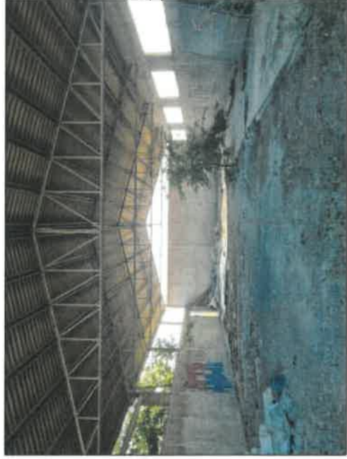
FOTO 17 - Struttura capannone