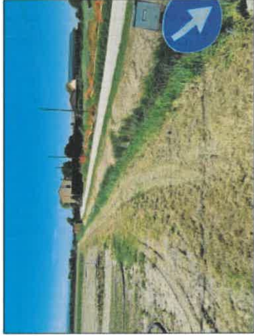
FOTO 05 - Viali d'accesso priv.