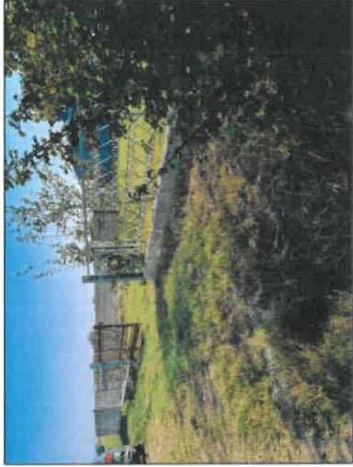
FOTO 26 - Ingresso area recint.