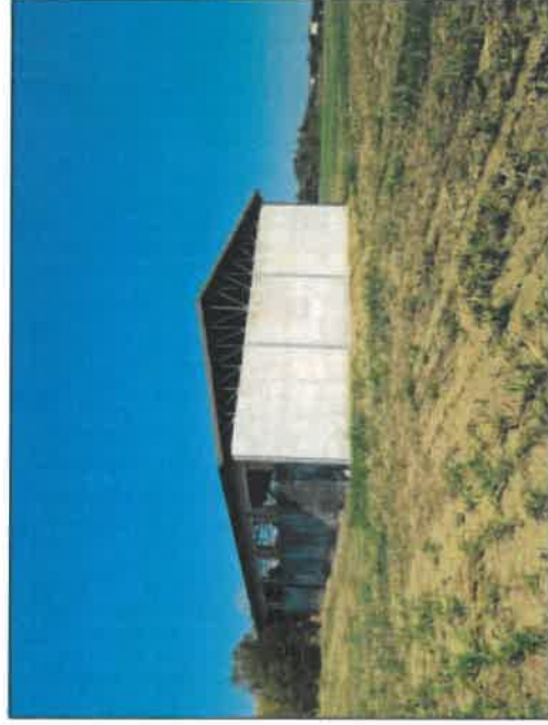
FOTO 11 - Capannone agricolo