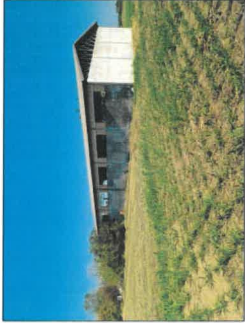
FOTO 10 - Capannone agricolo