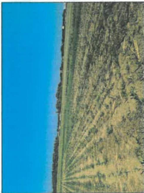
FOTO 02 - Podere agricolo