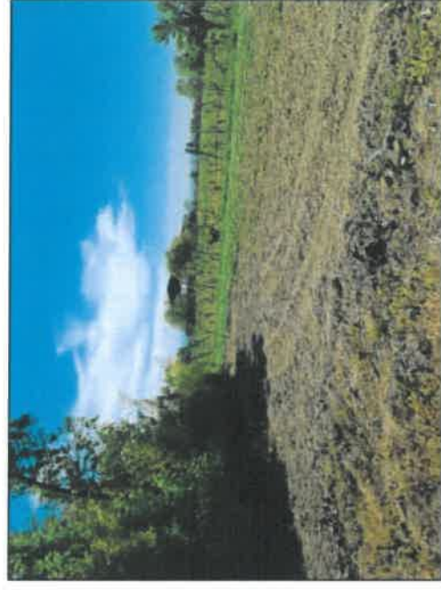
FOTO 09 - Altra porzione podere