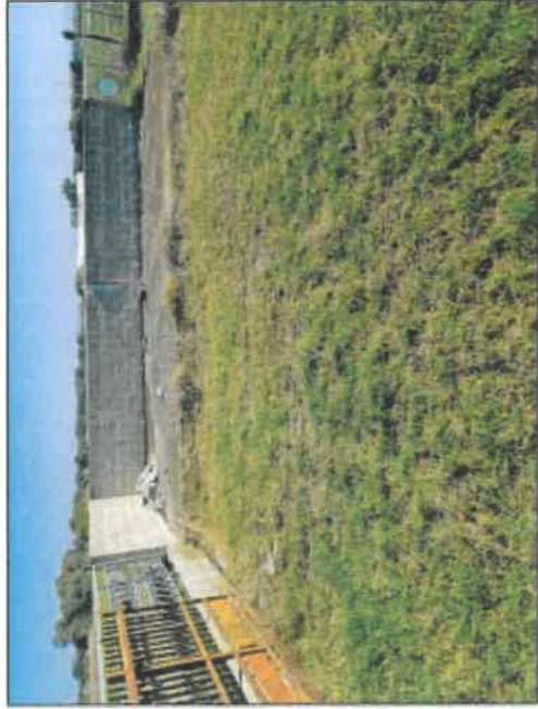
FOTO 25 - Area recintata