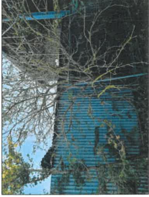
FOTO 23 - Capanno agricolo