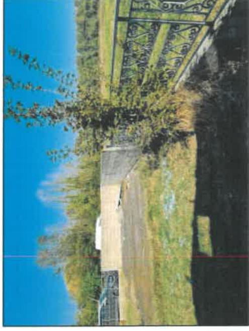
FOTO 27 - Recinzione