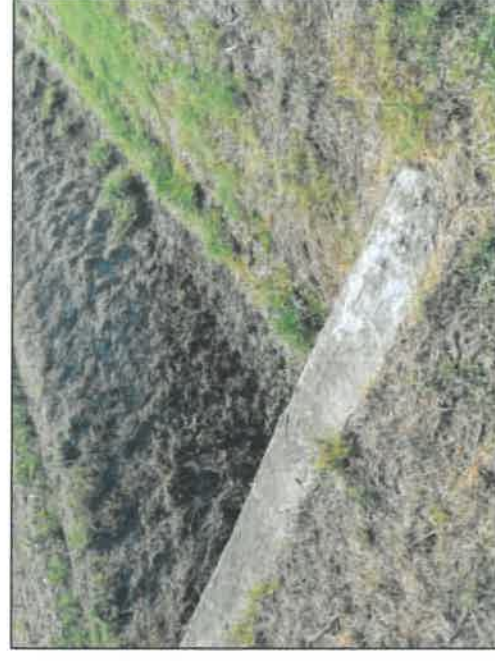
FOTO 15 - Fosso di bonifica