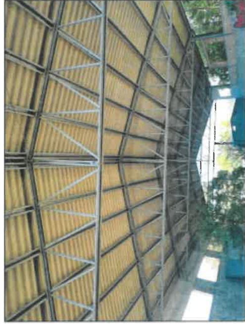
FOTO 19 - Dettaglio copertura