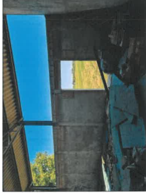
FOTO 20 - Tamponamenti