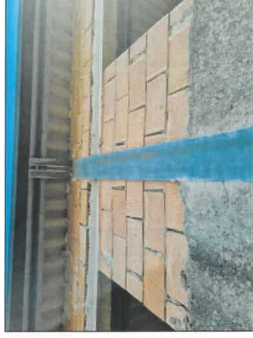
FOTO 21 - Tamponamenti esterni