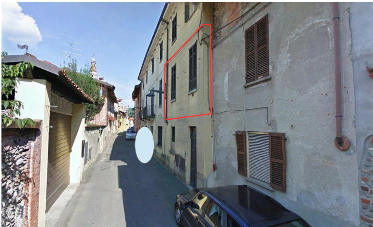
prospetto fabbricato principale su Via Garibaldi