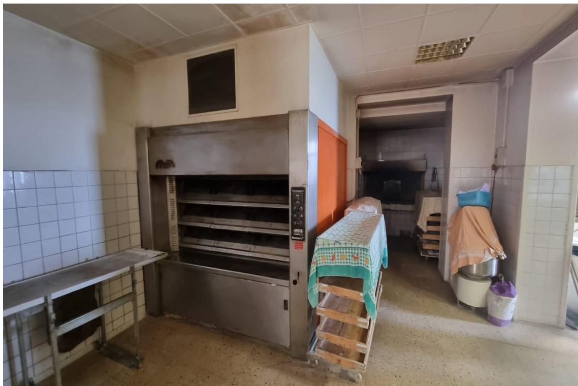
Foto n. 6 Laboratorio 2 Piano Terra