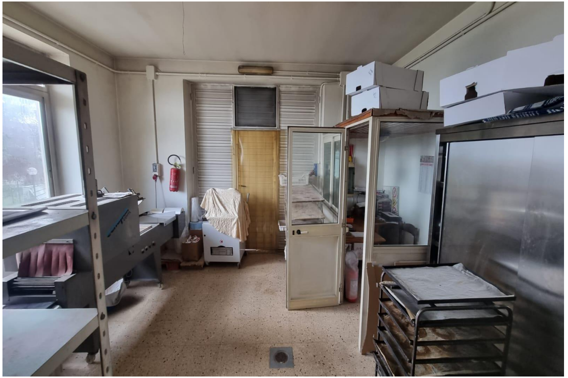
Foto n. 8 Spogliatoio Piano Terra