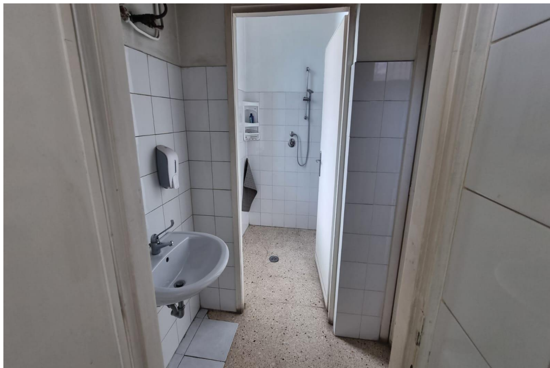
Foto n. 10 W.c.2 Piano Terra