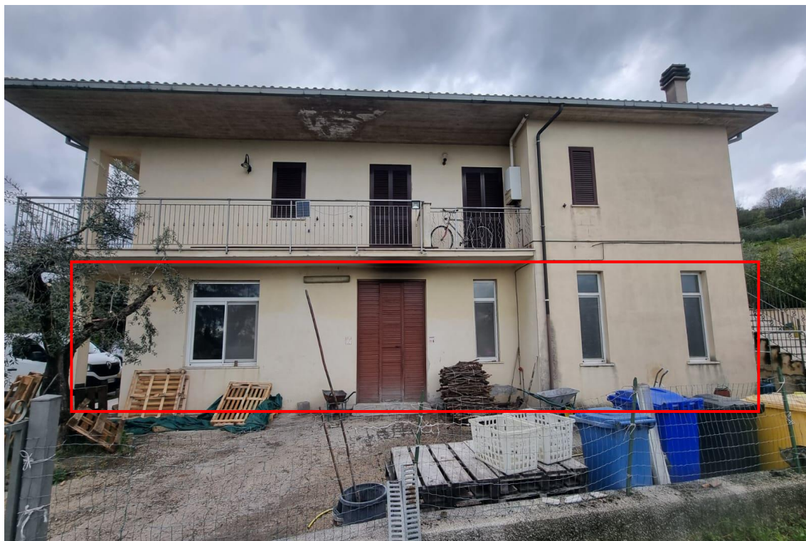
Foto n. 4 Magazzino 1 Piano Terra