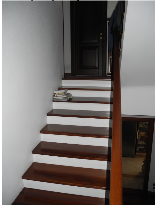
FOTO 41 – seconda rampa scala di salita verso zona notte al primo piano – parte non condominiale