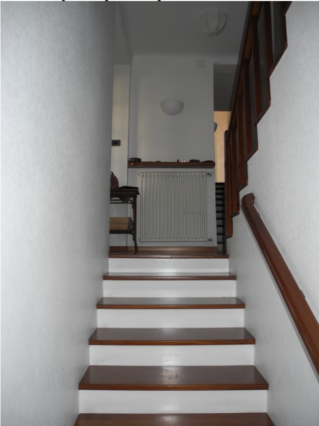
FOTO 39 – prima rampa scala di salita verso zona notte al primo piano – parte non condominiale