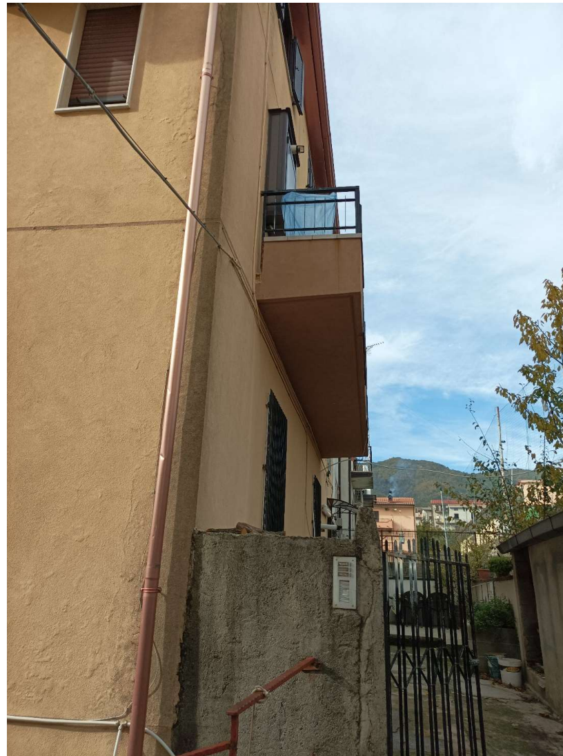
ESTERNO INGRESSO EDIFICIO