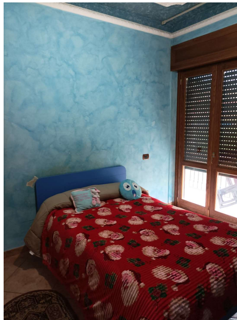
STANZA DA LETTO