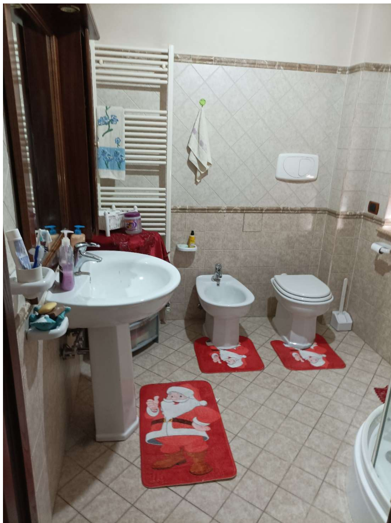
BAGNO (IN STANZA MATRIMONIALE)