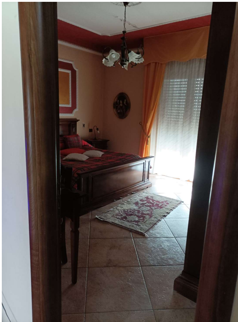
STANZA DA LETTO MATRIMONIALE