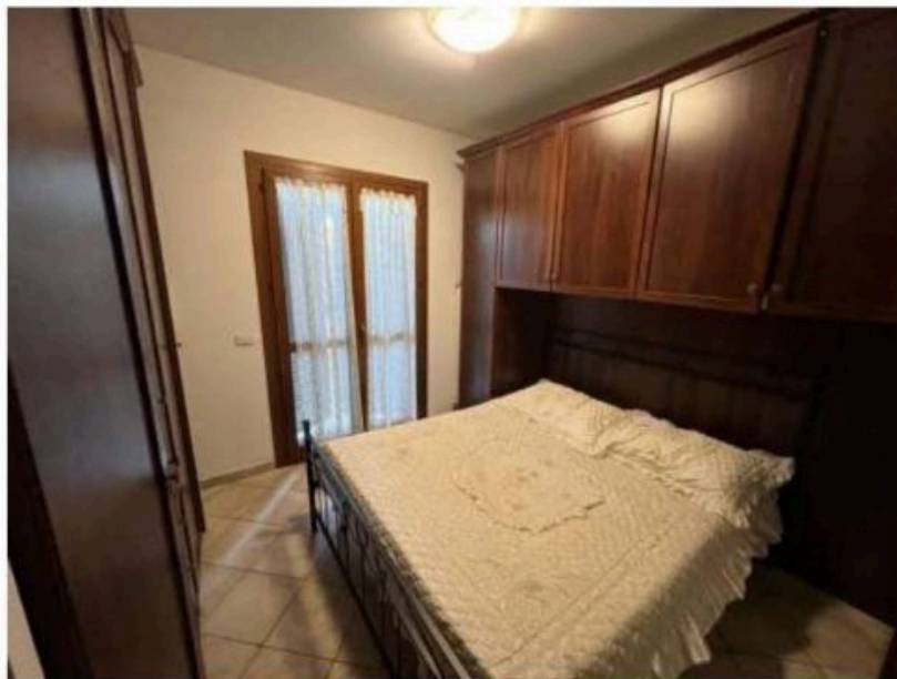
Foto 5. Vista interna