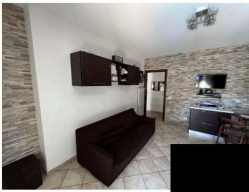
Foto 4. Vista interna