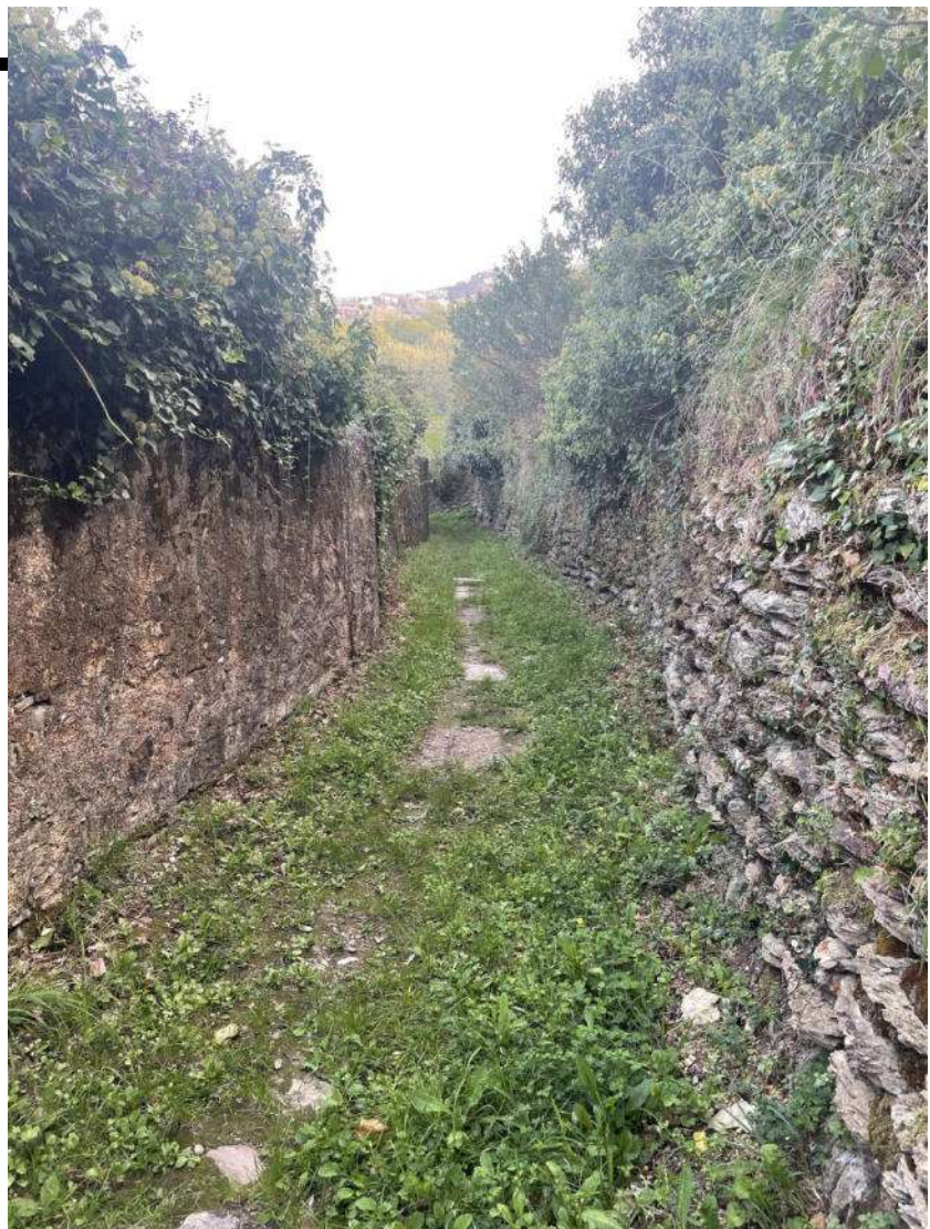
Foto 4 SENTIERO PEDONALE