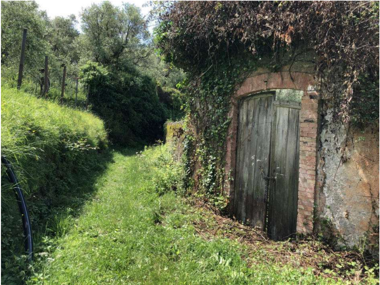
Foto 1 ACCESSO PEDONALE