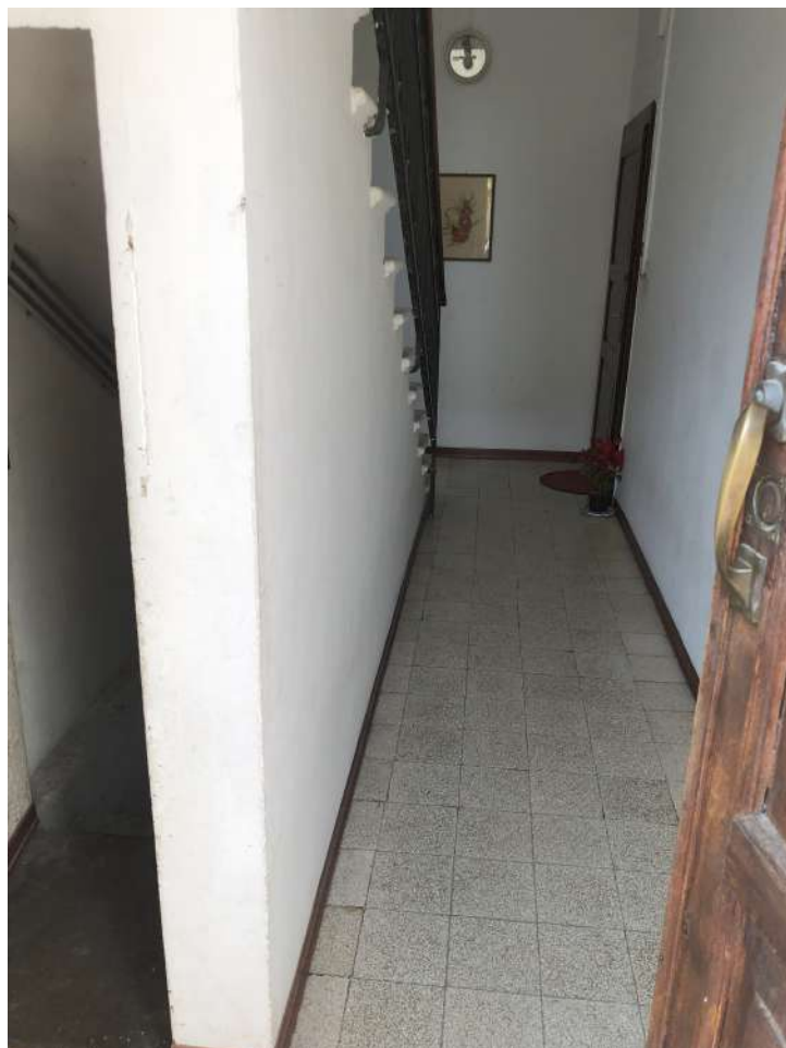
Foto 6- Androne comune