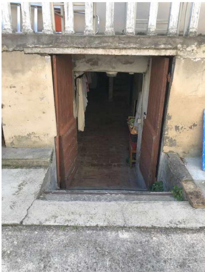
Foto 5- Accesso esterno al piano seminterrato