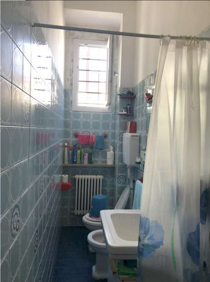
Foto 11- Sub.1 - bagno