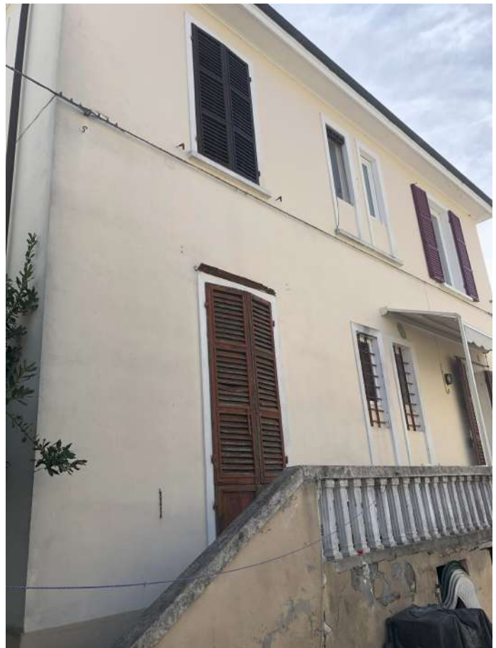
Foto 4- retro prospetto