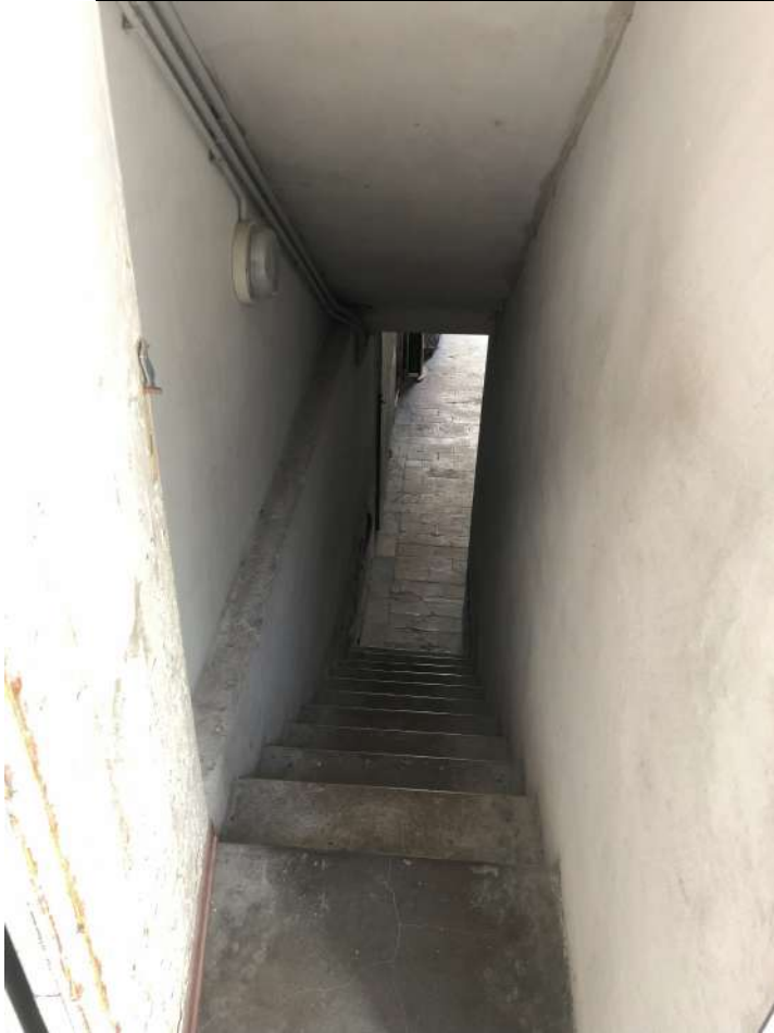
Foto 7- scala interna comune al seminterrato