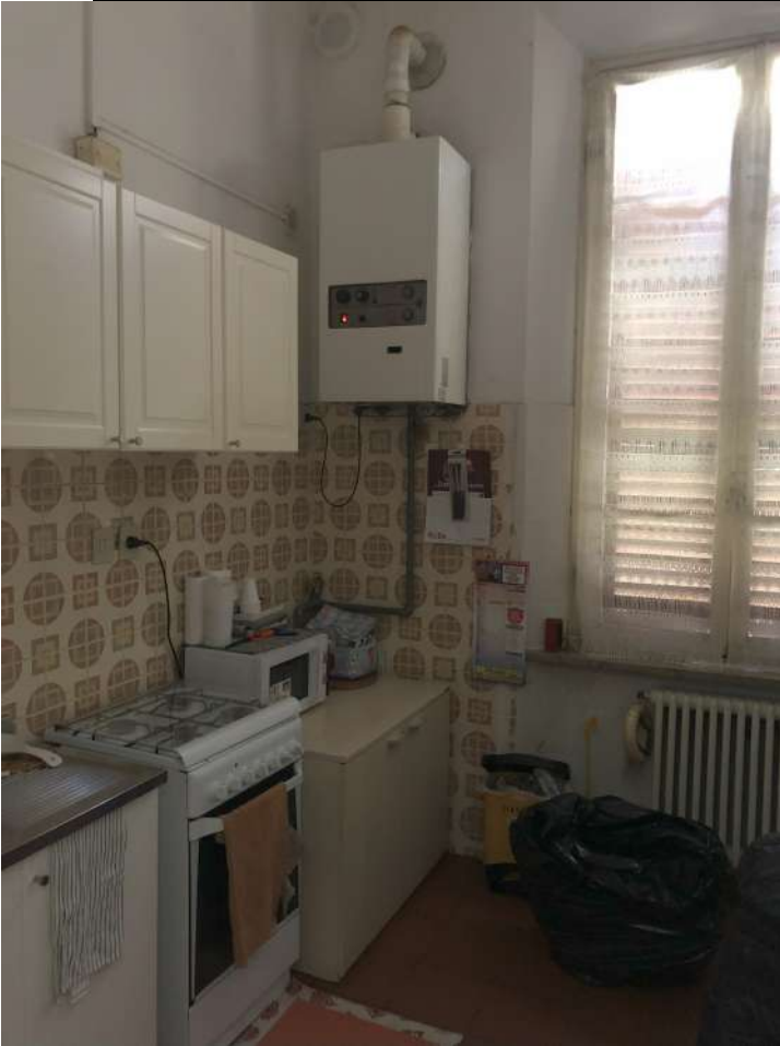
Foto 9- Sub.1 - cucina