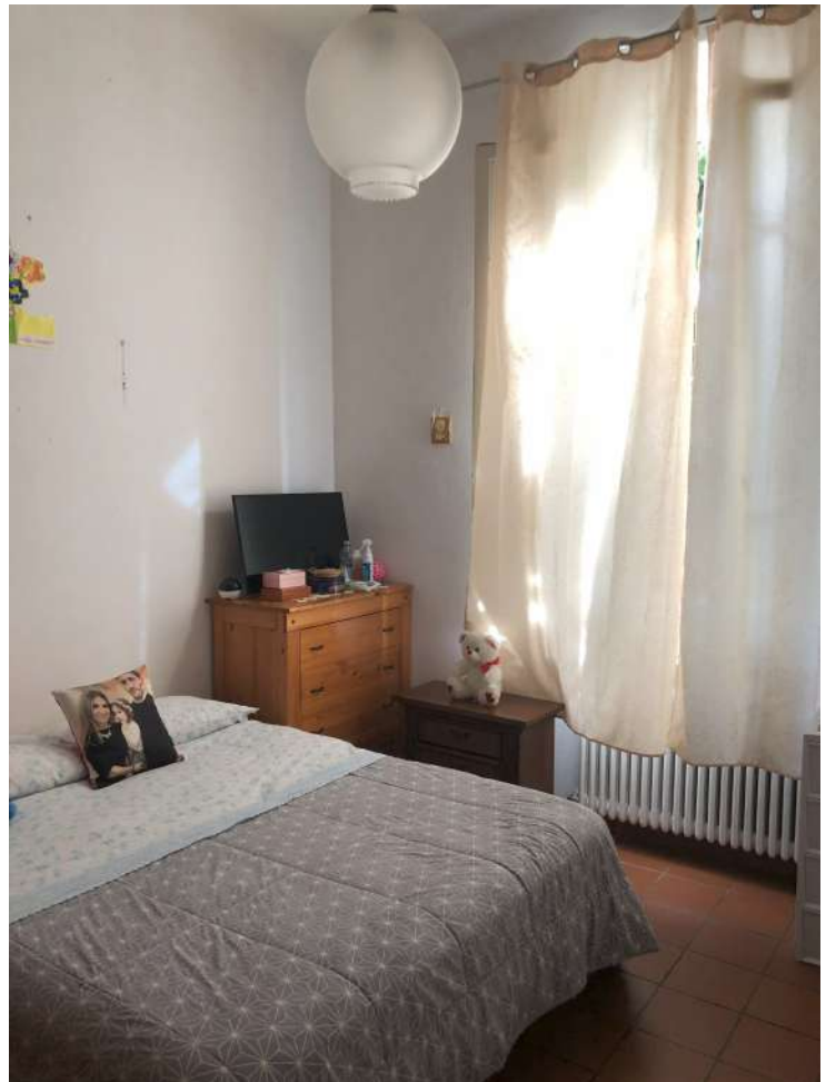
Foto 10- Sub.1 - camera da letto