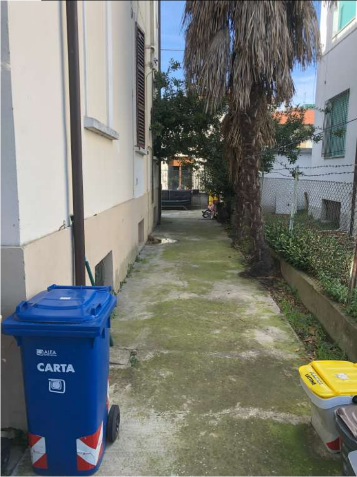
Foto 3- corte comune