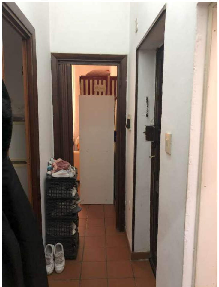
Foto 8- Sub.1 - disimpegno/ingresso