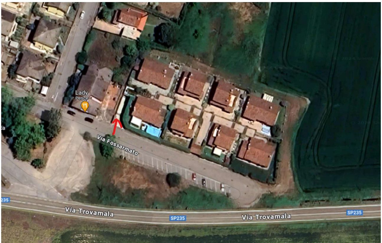
Vista Aerea per inquadramento generale