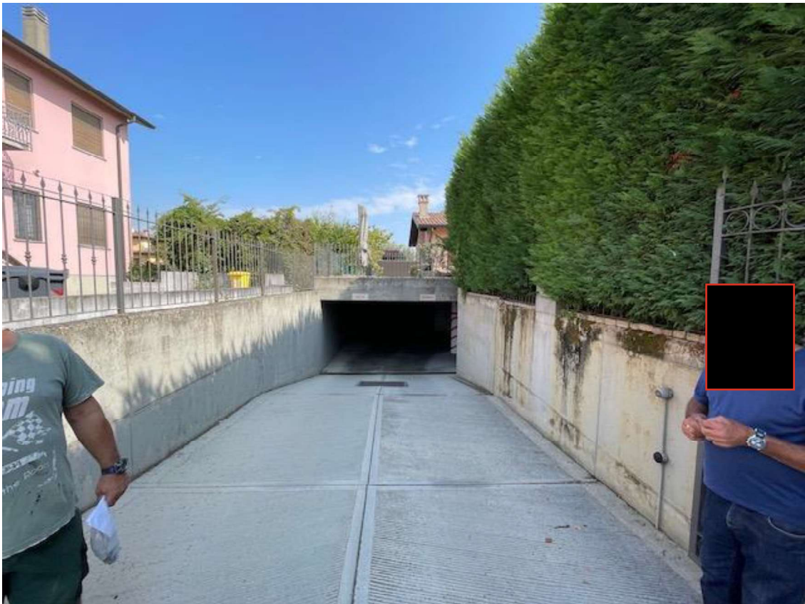
Rampa di Accesso al Piano Semi-interrato