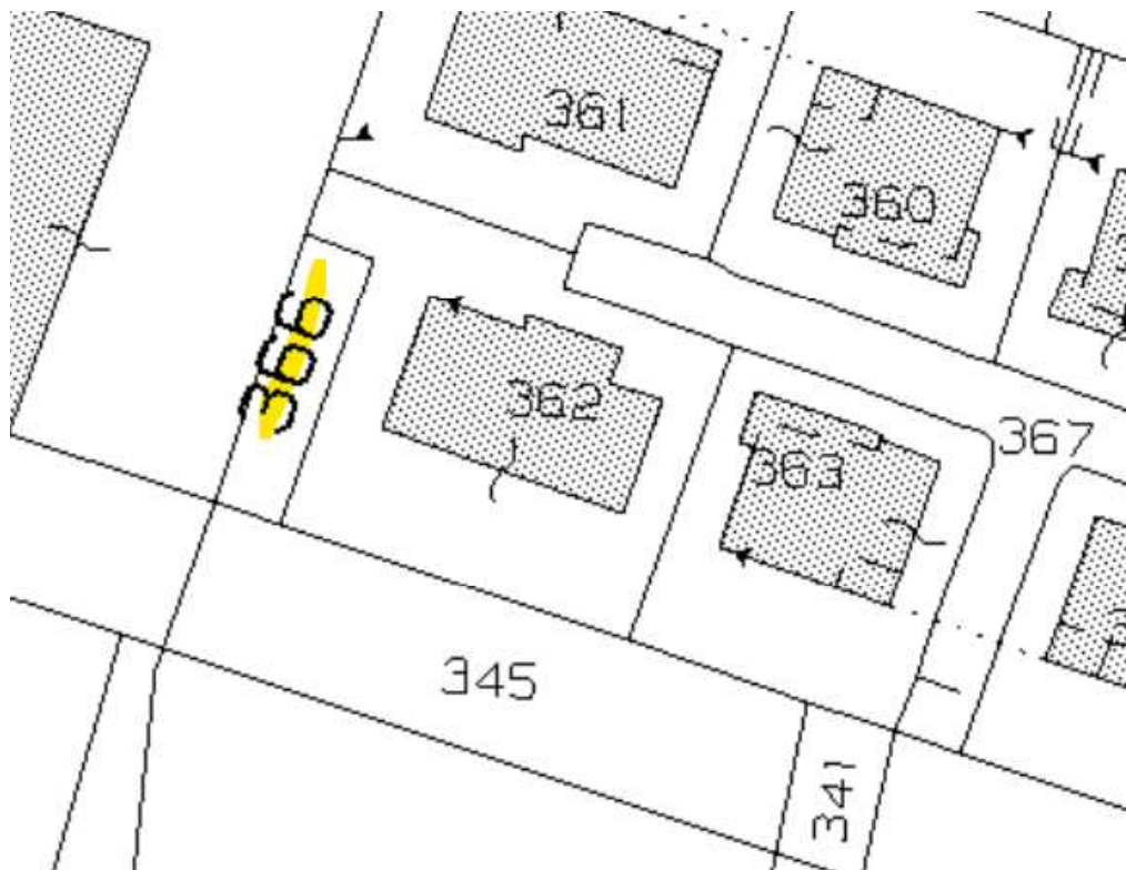
Inquadramento Generale particella 366 superficie – 358 (semi-interrato)