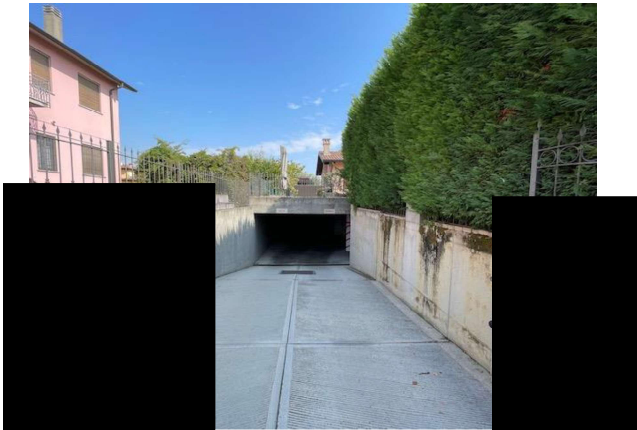
Rampa di Accesso al Piano Semi-interrato