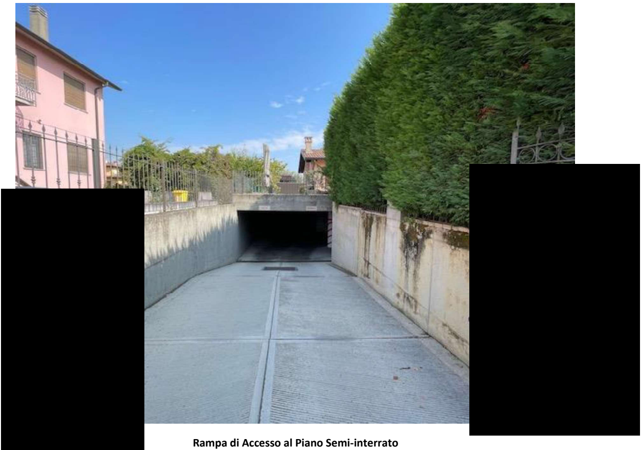
Rampa di Accesso al Piano Semi-interrato